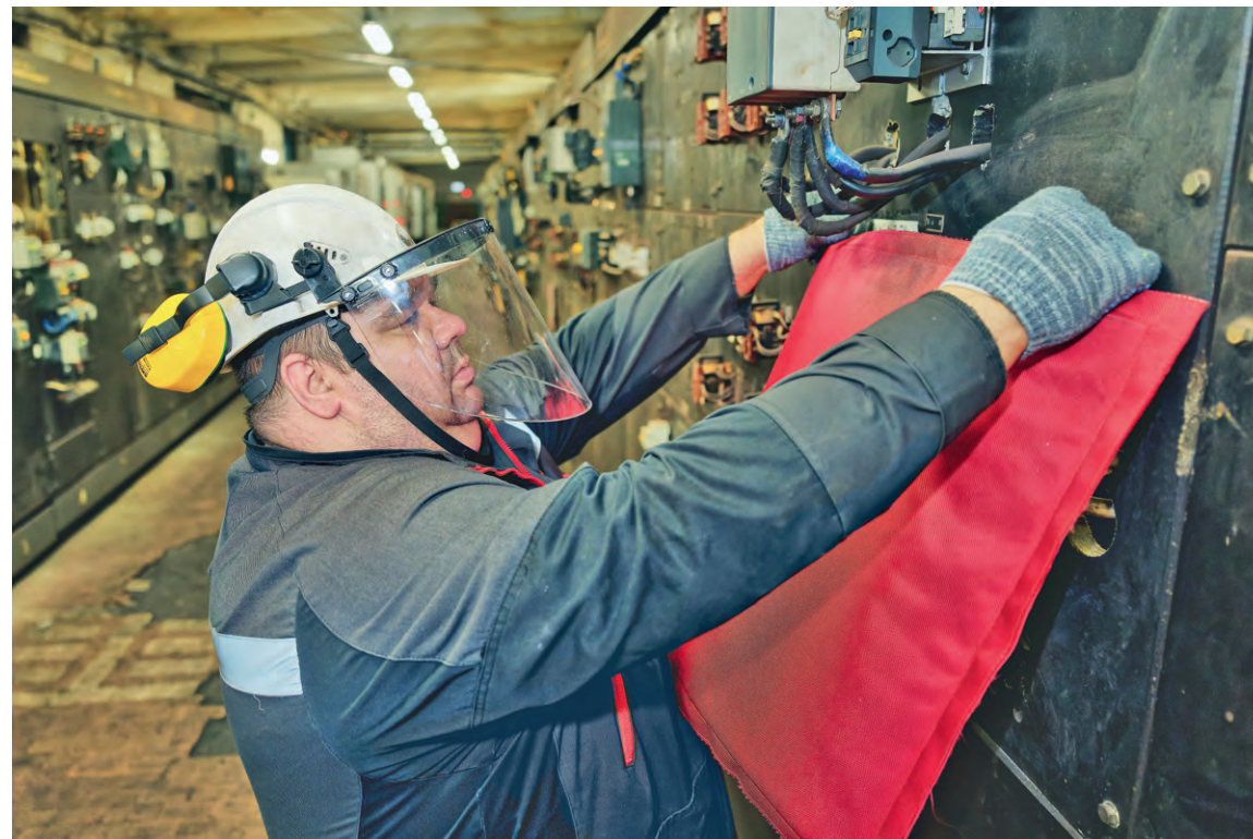
▲ Для защиты от возможного поражения током сотрудники энергоцентра используют диэлектрическое полотно

— Тем не менее на сменно-встречных собраниях мы постоянно повторяем основные требова-