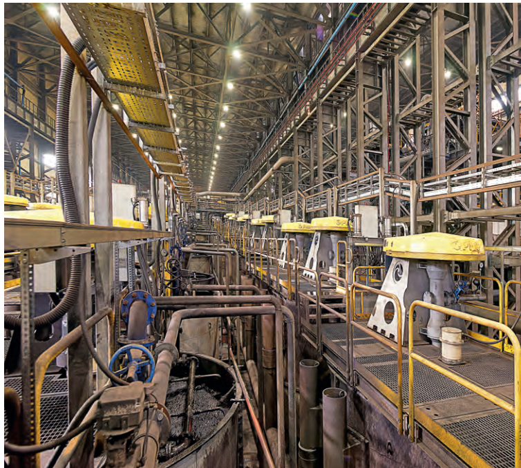
▲ Обогатительная фабрика будет повышать производственные объёмы. За несколько лет их рост составит более 2,5 миллионов тонн в год

На комбинате продолжают улучшать условия труда. К примеру, сейчас выполняют капитальные работы дренажной системы на обогатительной фабрике, защитных сооружениях в рудопроходе на станции «Погрузочная».