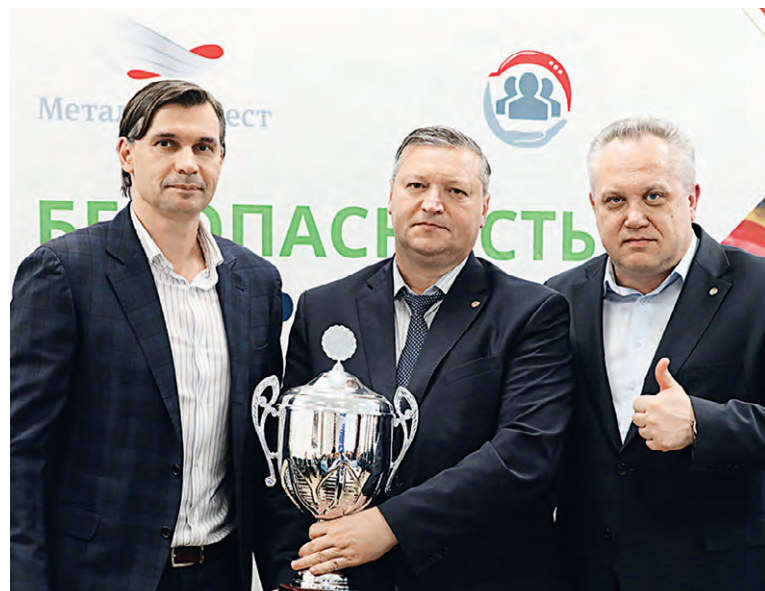
▲ Кубок — у Лебединского ГОКа!

Всего же грамотами на комитете отметили 20 человек, среди которых — представители разных вертикалей.