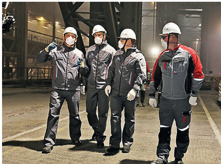
▲ Линейный обход в электросталеплавильном цехе ОЭМК

— Рабочие сами ищут риски, делятся опытом с другими под-