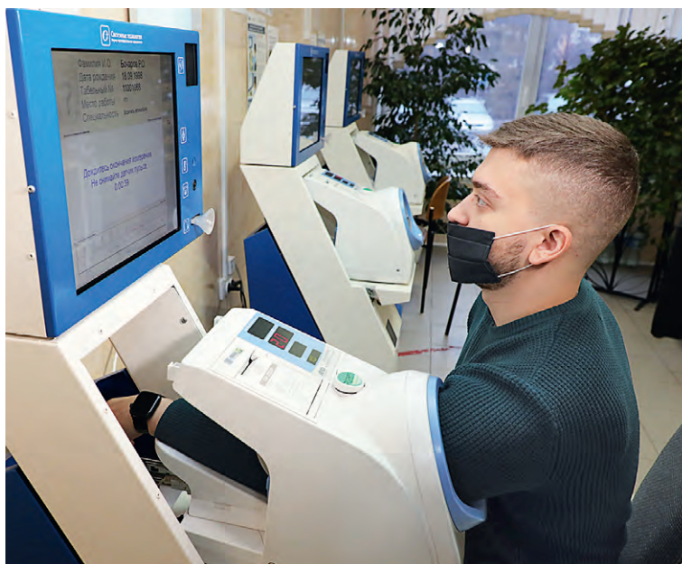
▲ АСМО позволяет отслеживать динамику здоровья каждого сотрудника

рублей составили инвестиции в корпоративную медицину в 2023 году.