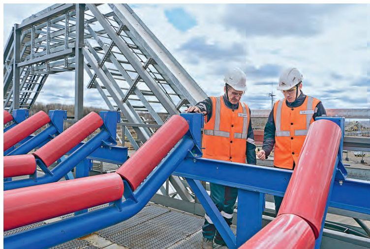
▲ Основные «инструменты» специалистов управления капитального строительства — передовые технологии строительства, профессионализм и опыт