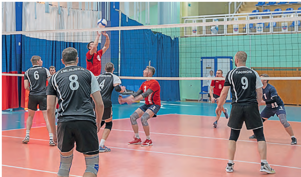
◀ Волейболисты Михайловского ГОКа (в синей форме) показали слаженную игру и хорошую технику

Мужская волейбольная команда Михайловского ГОКа стала победителем «Волейбольной лиги ЮЗГУ»