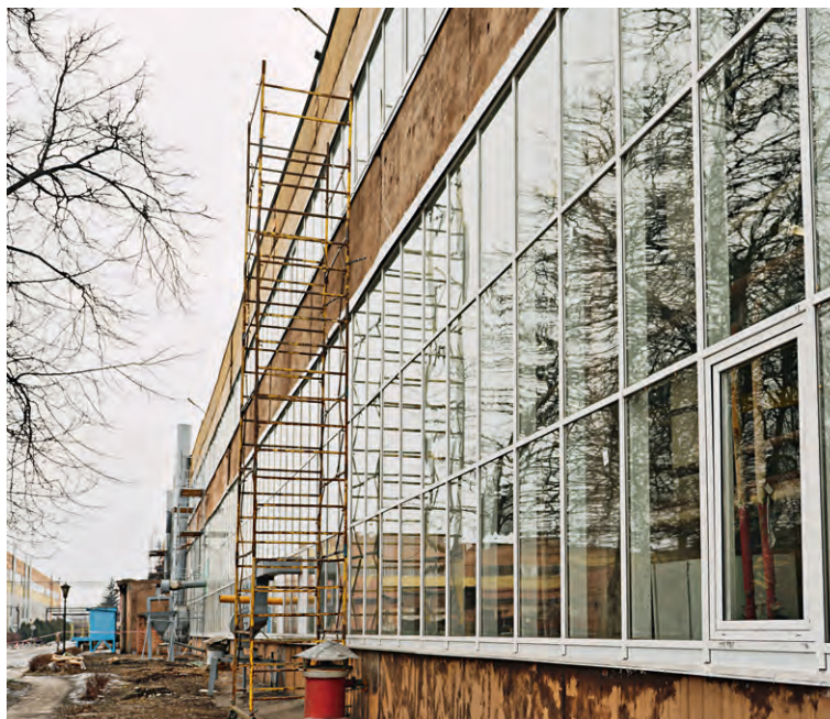
▲ В цехах комбината проводят полную замену остекления