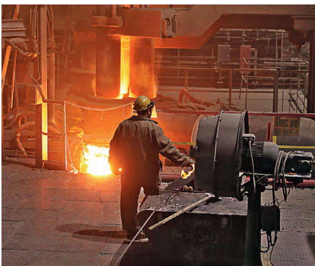
▲ Любое производство требует внимания к деталям. Особенно — в сфере безопасности