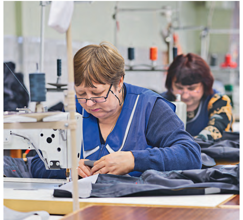
▲ Для горняков комбината разрабатывают новые костюмы, состоящие преимущественно из хлопка

На ОФ и ФОКе планируют модернизацию и капремонт оборудования, в УЖДТ — установку мачт освещения для повышения уровня безопасности, а в РУ расширят парковку, отремонтируют душевые кабины и рекон-