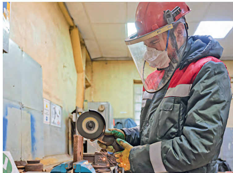
▲ На ДСФ своевременно приобретают новый ручной инструмент. Это позволяет снизить риск получения травмы при его внезапной поломке

Рудоуправление в прошлом году тоже входило в число победителей — во втором квартале. В арсенале горняков — инструменты, которыми они умело пользуются. Такие, к примеру, как охота на риски и анализ безопасного ведения работ.