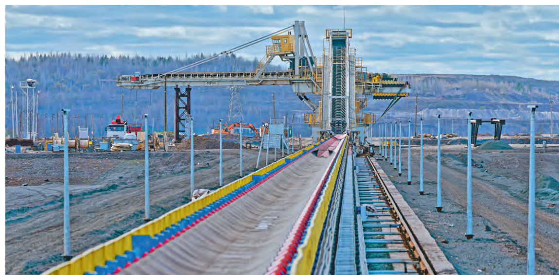
▲ Сегодня дробильно-конвейерный комплекс — это объект № 1 для строителей Михайловского ГОКа

очередь которого сейчас продолжают строить в карьере МГОКа.