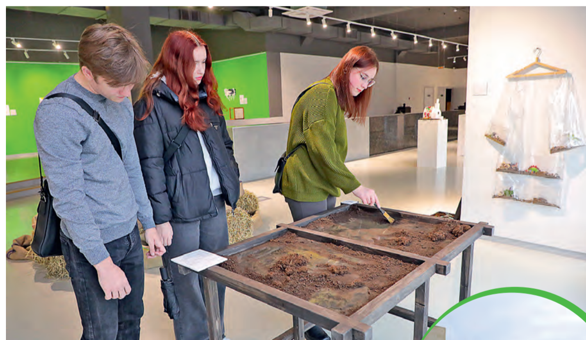
▲ На выставке можно увидеть почву со всех уголков Белгородской области

ка из расшитого цветами холста и кустики сухого камыша обрамляют ломоть пропечённого хлеба.