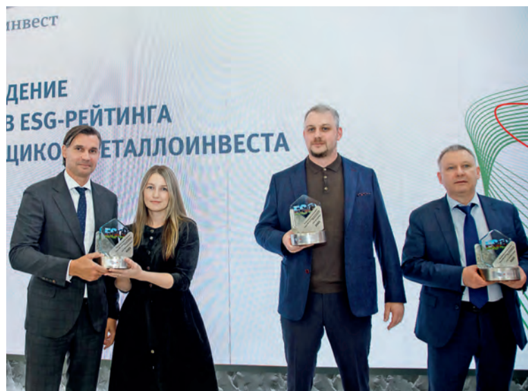
▲ Лидеров ESG-рейтинга поставщиков отличают надёжность и высокая скорость поставок

Лебединский ГОК также удивил новинками. Кроме концентрата, окатышей и брикетов ГБЖ, комбинат представил так называемую мелочь и «чипсы» ГБЖ, которые получают в процессе производства основного ГБЖ-продукта. Ранее на «широком» рынке их как товарные позиции не продвигали. Однако если первоклассные брикеты идеальны для конвертеров и электропечей, то «чипсы» можно использовать в сталеплавильном производстве, а мелкие фракции — в аглодоменном. Они позволяют повысить эффективность процессов, сэкономить топливо и энергоресурсы.