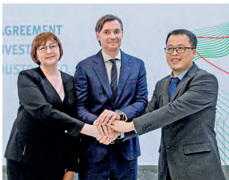
▲ Трёхстороннее соглашение с китайским поставщиком и его российским представителем обеспечит поставку брикет-прессов, необходимых при производстве ГБЖ

металлургических компаний, то оскольской сталью — автомобилестроители, производители подшипников, метизов, вагонных и автомобильных пружин, крепежа для строительной и судостроительной отраслей, оборудования для нефтепрома и не только.