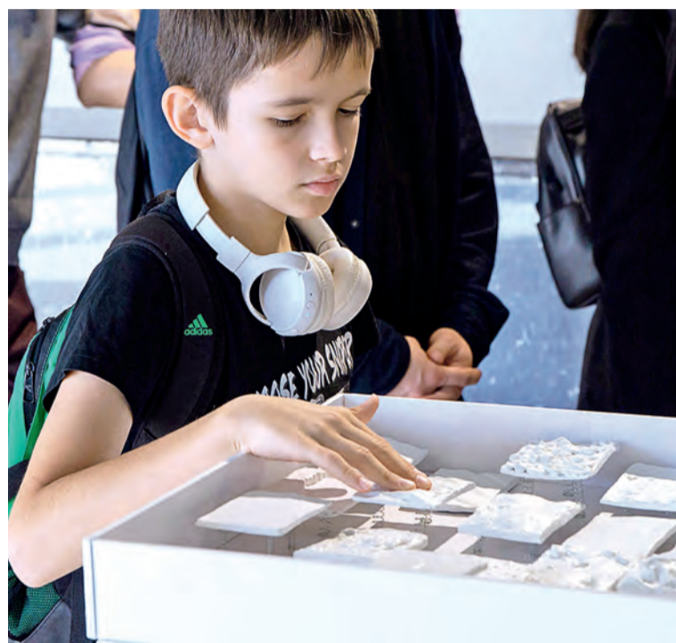
▲ У детей наибольший интерес вызывают тактильные композиции