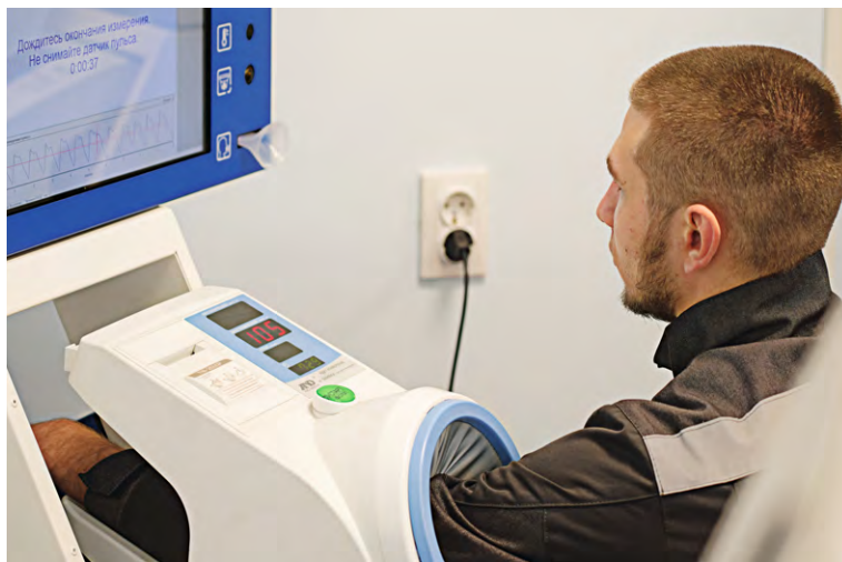
▲ Автоматическая система медицинских осмотров позволяет врачам «МГОК-Здоровья» тщательно следить за здоровьем горняков

По статистике, варикозным расширением вен страдает почти половина жителей России. Предвестники варикоза — увеличение вен, боль, отёки и звёздочки на ногах.