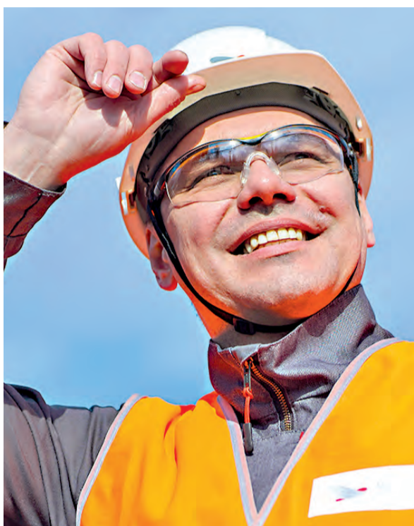
▲ Сотрудники ценят работодателей, которые обеспечивают стабильный доход, улучшают условия труда и предлагают возможности карьерного роста

«Достойное вознаграждение, социальный пакет, безопасные и комфортные рабочие места — это уже обязательные условия работы современной промышленной компании. Мы постоянно повышаем благополучие наших сотрудников, улучшаем условия труда, заботимся об окружающей среде. Мы также считаем важным приоритетом повышение привлекательности наших городов для жизни и построения карьеры. Мы понимаем, что комфортная городская среда — это не только развитая социальная инфраструктура и благоустроенные общественные пространства, но и культурная повестка, наполненная яркими событиями.»