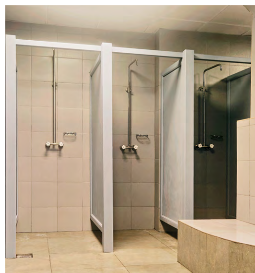
◀ Душевые обогатительной фабрики после капитального ремонта стали комфортнее

Корпоративный проект по ремонту помещений непроизводственного назначения стартовал в Металлоинвесте в 2020 году. За три года его реализации на Михайловском ГОКе провели ремонт более 360 помещений.