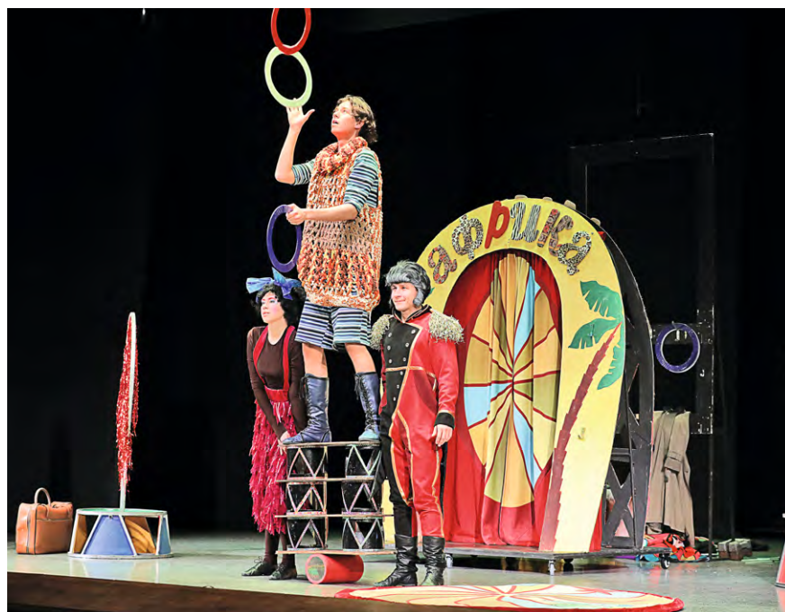
▲ Финальная сцена: Бонифаций балансирует на башенке из цилиндров и жонглирует кольцами