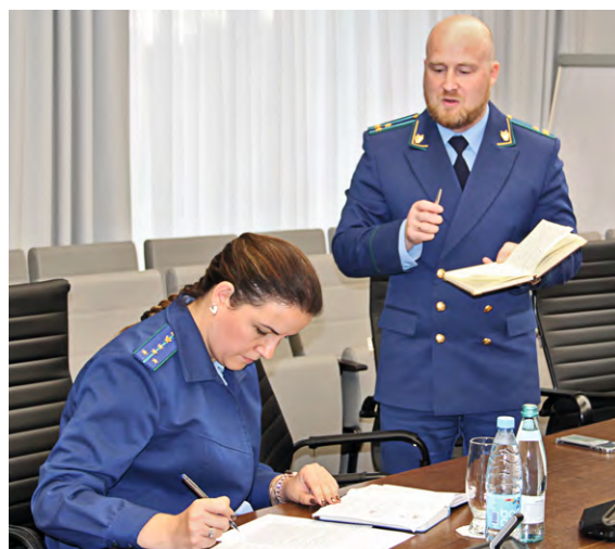
▲ Помощники зампрокурора приняли все обращения горняков