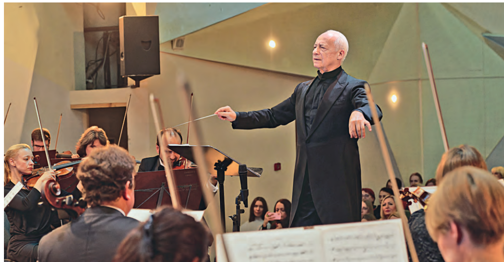
▲ Владимир Спиваков посвятил своё выступление памяти жертв теракта в «Крокус Сити Холле»

— Она подарила настоящую радость. Переливы её голоса были похожи на нашего курского соловья. И было в композиции что-то такое