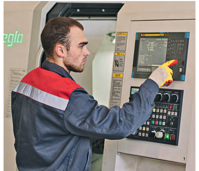
▲ Токари-конкурсанты выполняли на станке с ЧПУ по три модуля в день

В ЖГМК соревновались будущие программисты и электромонтажники, а в ЖелПК — сварщики и токари. За победу боролись лучшие студенты ссузов из нескольких муниципалитетов Курской области.