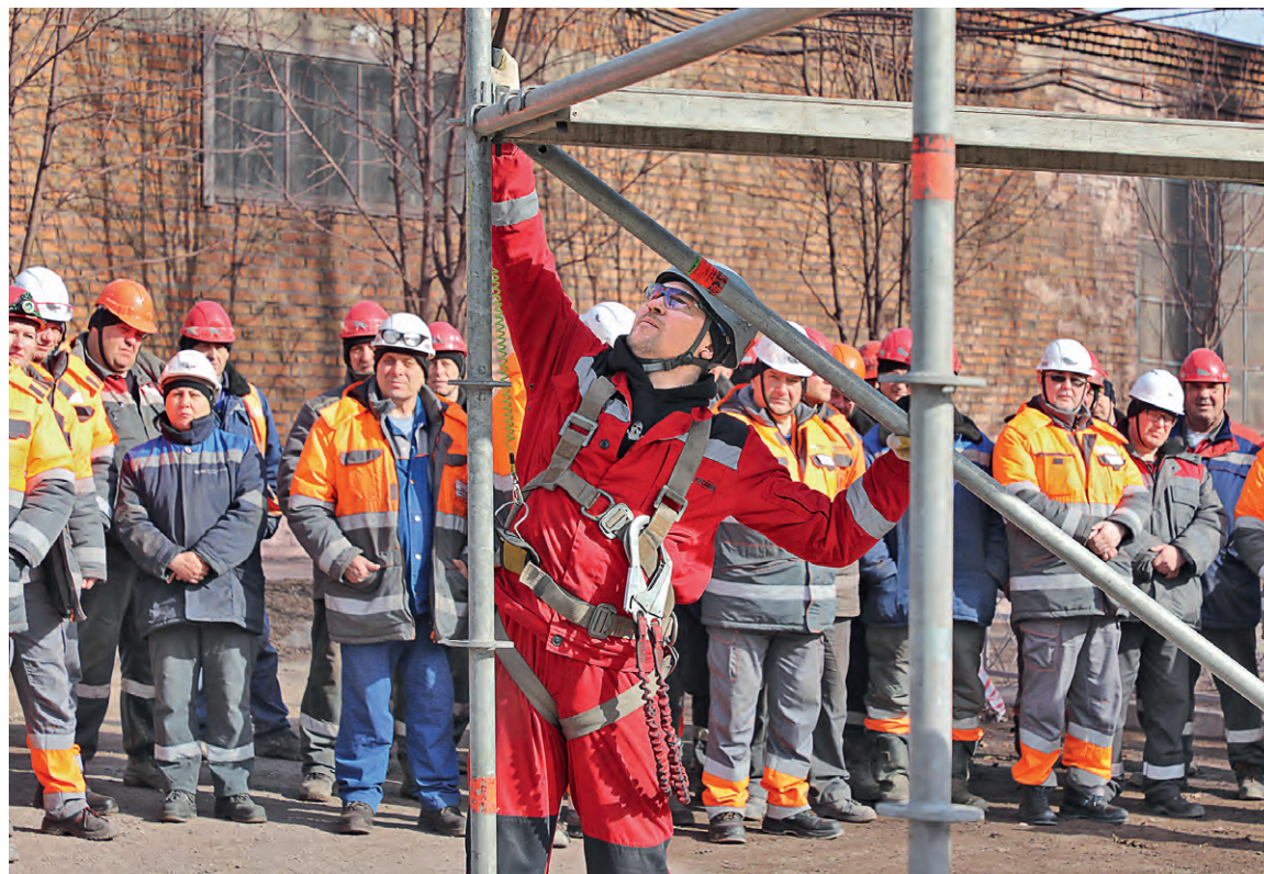
▲ Диагональные балки — одно из условий устойчивости конструкции лесов

Помимо привычных каски, очки, спецодежды и ботинок, у «высотников» есть целый набор специализированных СИЗ: страховочные привязи, канаты и стропы, анкерные линии, блокирующие устройства. И каждый элемент этого «арсенала» требует индивидуального подхода.