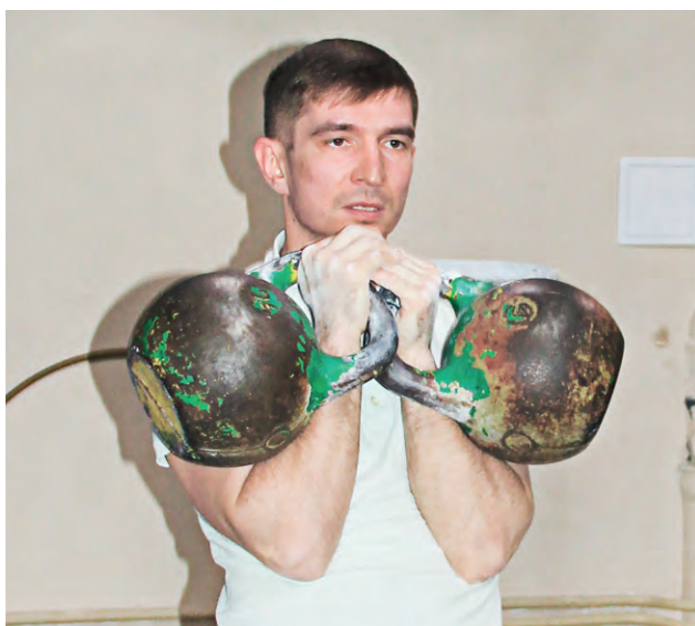
▲ Условия соревнований предельно просты: за десять минут нужно поднять две 24-килограммовые гири максимальное количество раз

— Именно они сегодня собрались здесь, чтобы выяснить, кто сильнее, — сооб-