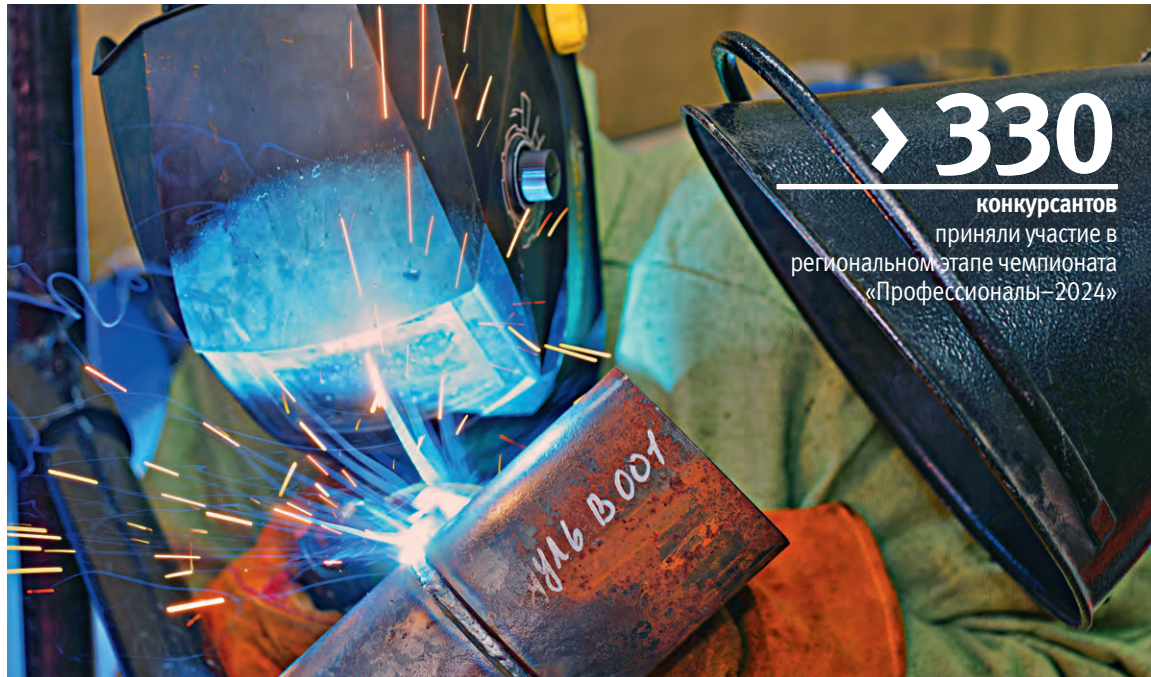
▲ В ходе конкурса сварщики должны соединить пластины, используя ручную дуговую и полуавтоматическую сварку

На площадках горно-металлургического и политехнического колледжей прошли состязания регионального этапа конкурса «Профессионалы»