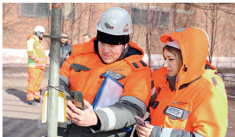
▲ После сборки на леса вешают бирку одного из трёх цветов — зелёного, жёлтого или красного. Жёлтый означает, что работа на них разрешена при соблюдении определённых условий