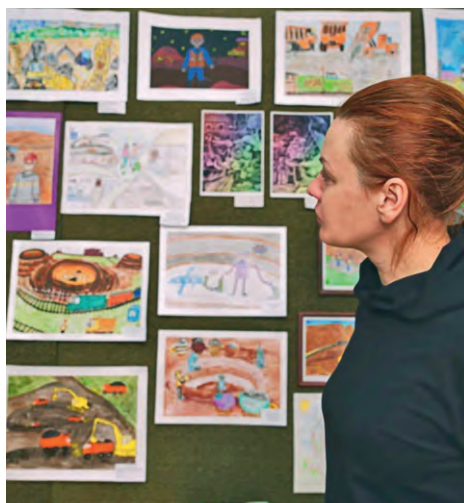
▲ В этом году в конкурсе «Жемчужина КМА» участвуют 296 детских работ

Мария Коротченкова