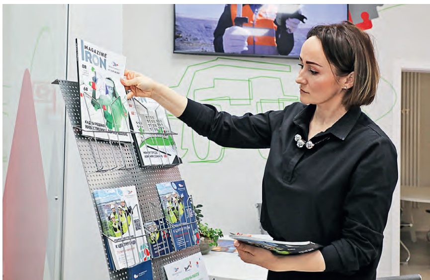
▲ Утро в офисе начинается с размещения информационных материалов на стойке и включения телевизора с видеороликами о деятельности компании

Поправляют образцы продукции на выставочном стенде и размещают брошюры на стойку.