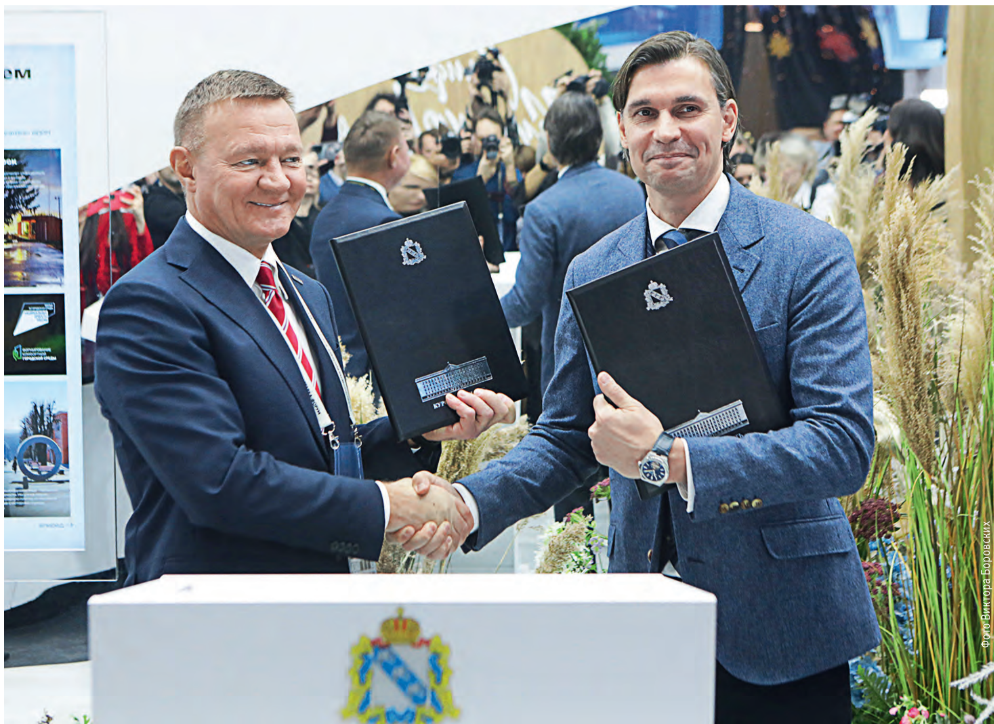
▲ Губернатор Курской области Роман Старовойт выразил благодарность Металлоинвесту за поддержку города и региона