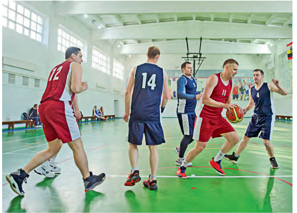
▲ Большинство работников Михайловского ГОКа занимаются спортом и придерживаются здорового образа жизни