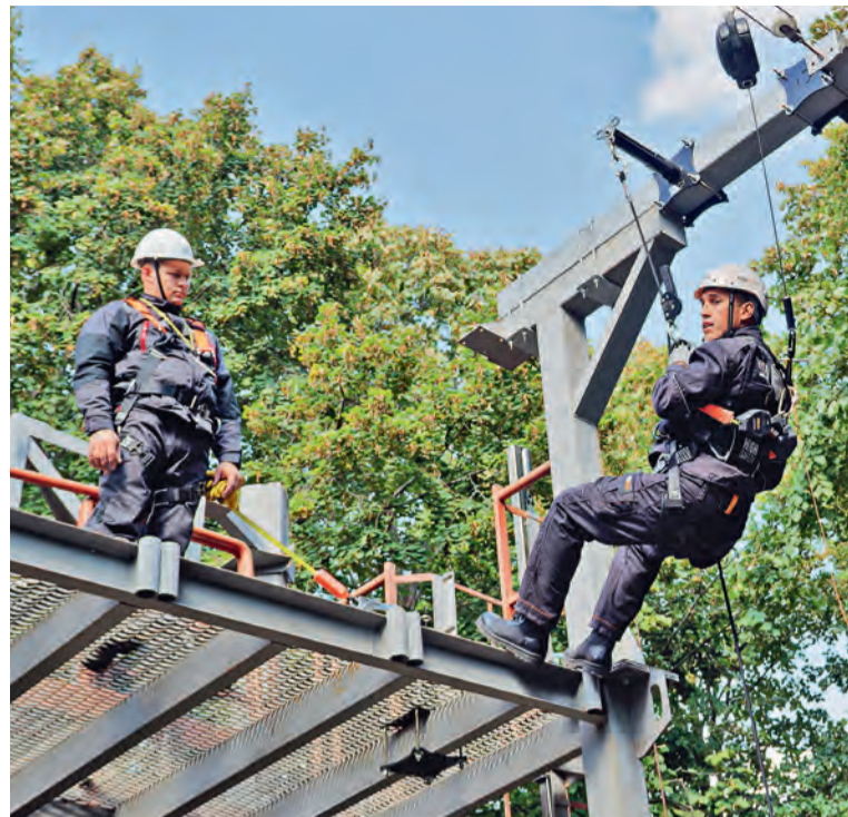
▲ На МГОКе модернизировали учебный полигон для отработки навыков безопасной работы на высоте

спецоценка проведена на рабочих местах в количестве 2 700 штук.