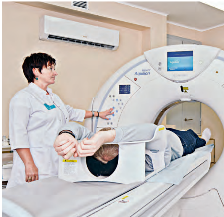
▲ Деятельность ЧЛПУ «МГОК-Здоровье» направлена на охрану здоровья и профилактику заболеваний у сотрудников комбината

В 2023 году в соответствии с Федеральным законом «О специальной оценке условий труда» № 426-ФЗ в структурных подразделениях АО «Михайловский ГОК им. А. В. Варичева» была продолжена работа по проведению специальной оценки условий труда на рабочих местах, в том числе и на вновь организованных рабочих местах. Всего в 2023 году