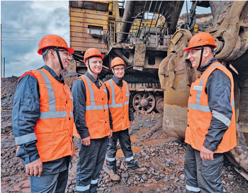
▲ Сплочённый трудовой коллектив — залог успеха Михайловского ГОКа