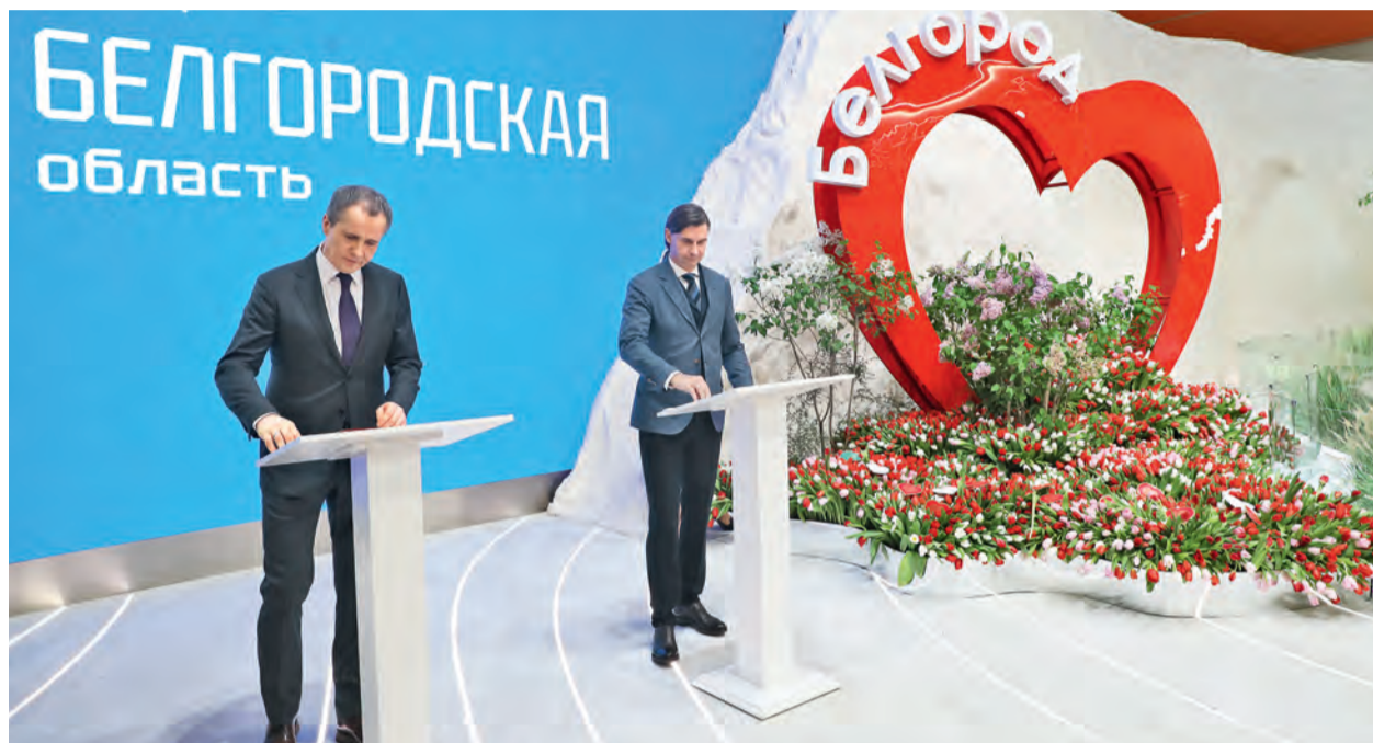
▲ Губернатор Белгородской области Вячеслав Гладков подчеркнул, что Металлоинвест готов протянуть региону руку помощи в любое время дня и ночи

Традиционно Металлоинвест окажет поддержку профильным учебным заведениям, в том числе старооскольскому и губкинскому филиалам Уни-