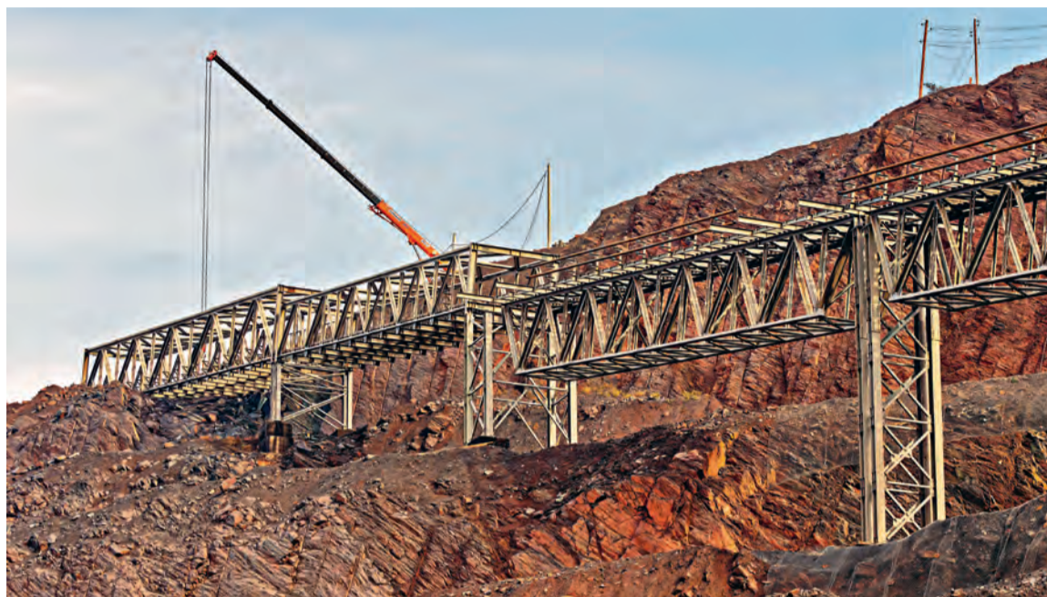
▲ Введение в действие второй очереди конвейерного комплекса улучшит производственные показатели работы карьера