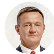
Роман Старовойт , губернатор Курской области:

В дополнение к налоговым отчислениям и сборам Металлоинвест инвестирует в Железногорск и Железногорский район порядка 1 млрд рублей в год. Одно из самых востребованных жителями направлений — благоустройство. Яркий пример реализованного проекта — аллея им. Андрея Варичева. У нас также развивается парк им. Никитина, ремонтируется центральная городская больница и другие медучреждения. Эта работа будет продолжена, и хочется выразить благодарность Металлоинвесту за поддержку города и региона.