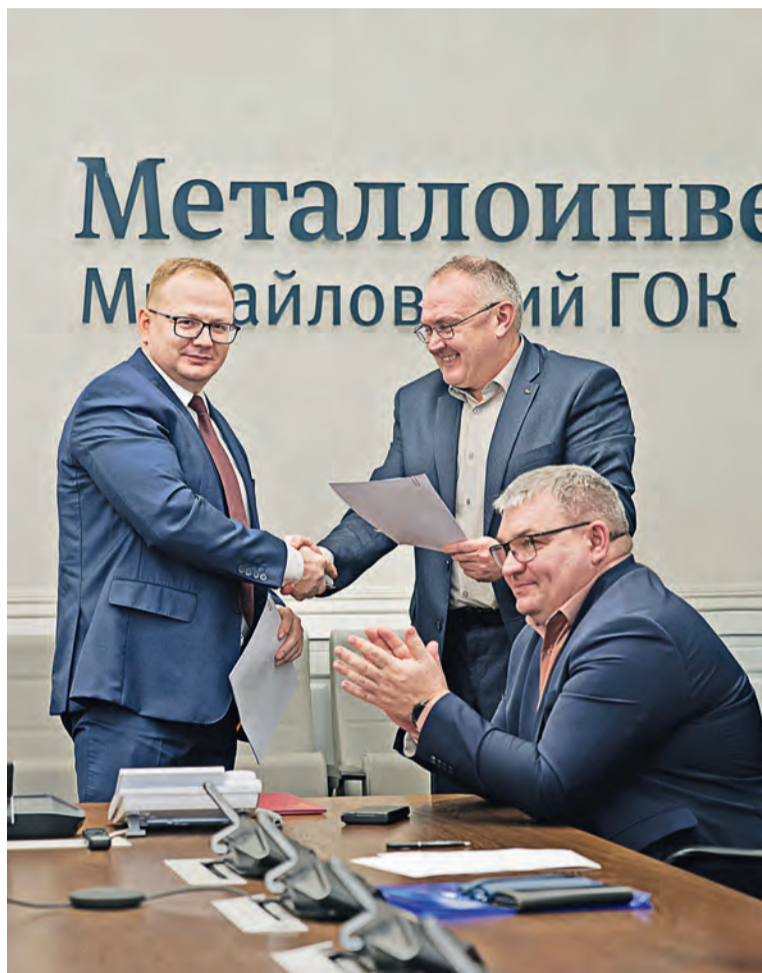
▲ Коллективный договор МГОКа учитывает права и интересы сотрудников комбината