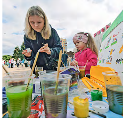
◀ Занятие ответственное и творческое: маленькие железнодорожцы рисуют свою семью