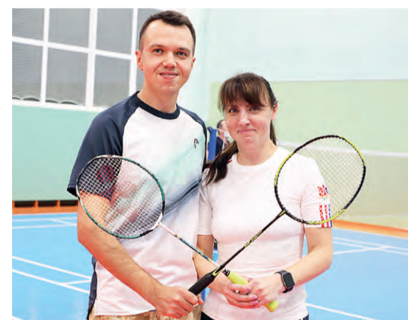
▲ Бадминтонисты JSA Group настроены решительно