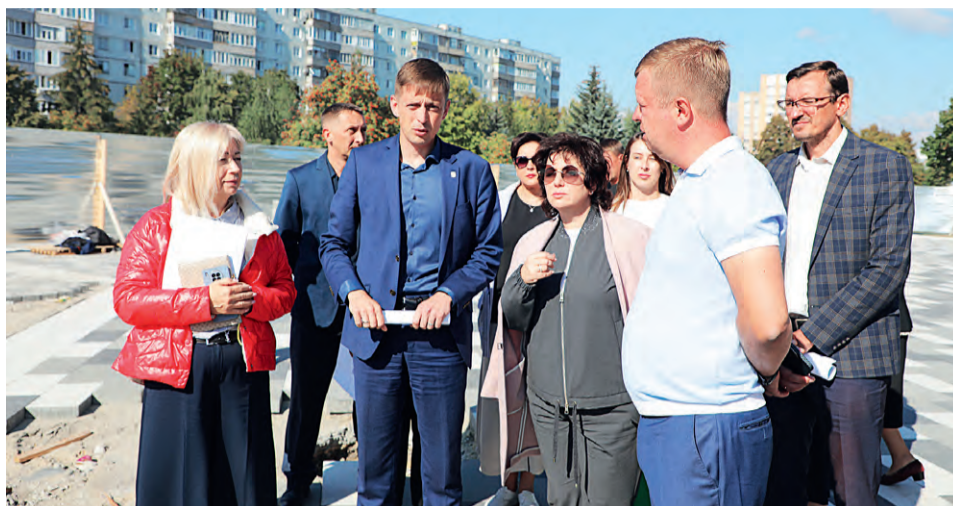
▲ Представители власти и бизнеса обсудили следующие направления по благоустройству города

Четырёхэтажное здание с 50-метровым бассейном на восемь дорожек будет соответствовать требованиям Международной федерации плавания и позволит проводить соревнования самого высокого уровня. Также здесь разместятся поме-