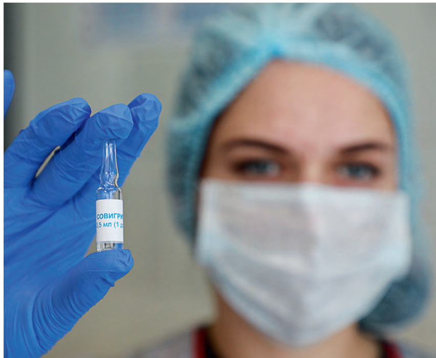
▲ Важно защитить себя и родных от гриппа — опасного заболевания

Что говорят о вакцинации врачи и пациенты