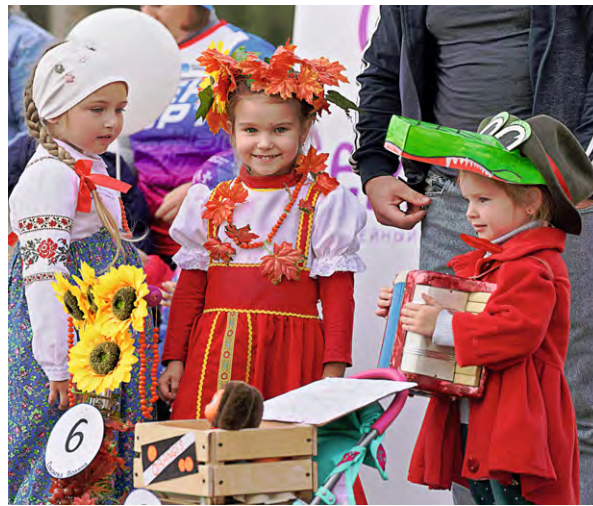
▲ Свои коляски подготовили к фестивалю и дети — участники конкурса в номинации «Маленькая мама»