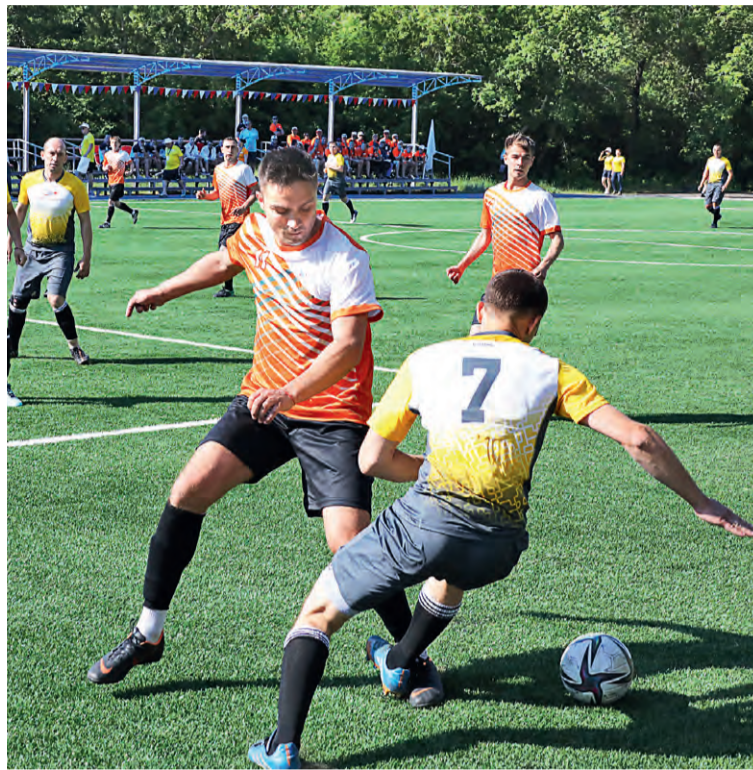
▲ Футболисты ОЭМК — фавориты соревнований

— Неимоверно горели ноги, такого пекла у нас нет даже на работе, — улыбается спортсмен. — Там на поле искусственное покрытие буквально плавилось при температуре плюс 35 градусов. Мы ведра ставили с водой, подбегаешь, окунаешь ноги и даль-