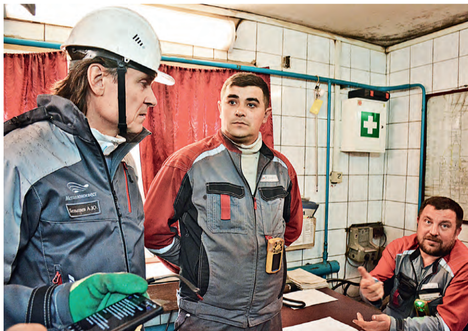
▲ Линейный обход — это не только оценка изменений, но и обсуждение предложений работников подразделений