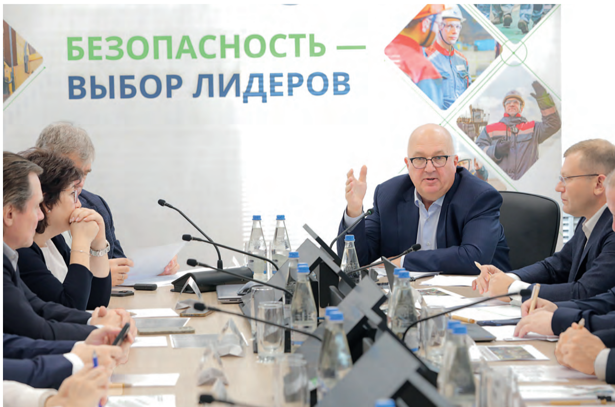
▲ Участники комитета по промышленной безопасности, охране труда и окружающей среды обсудили возможности для дальнейшего движения к нулевому уровню смертельного и тяжёлого травматизма и наметили следующие шаги

Во время линейного обхода производственных площадок пять групп во главе с руководителями компании побывали на участках ЭСПЦ, СПЦ №1 и ФОиМ. Главной задачей было оценить, как изменилось отношение рабочих к производственной безопасности, и как на эти перемены повлиял лидер подразделения. Генеральный директор Металлоинвеста отметил прогресс в сортопрокатном цехе №1: — Впервые СПЦ №1 по-