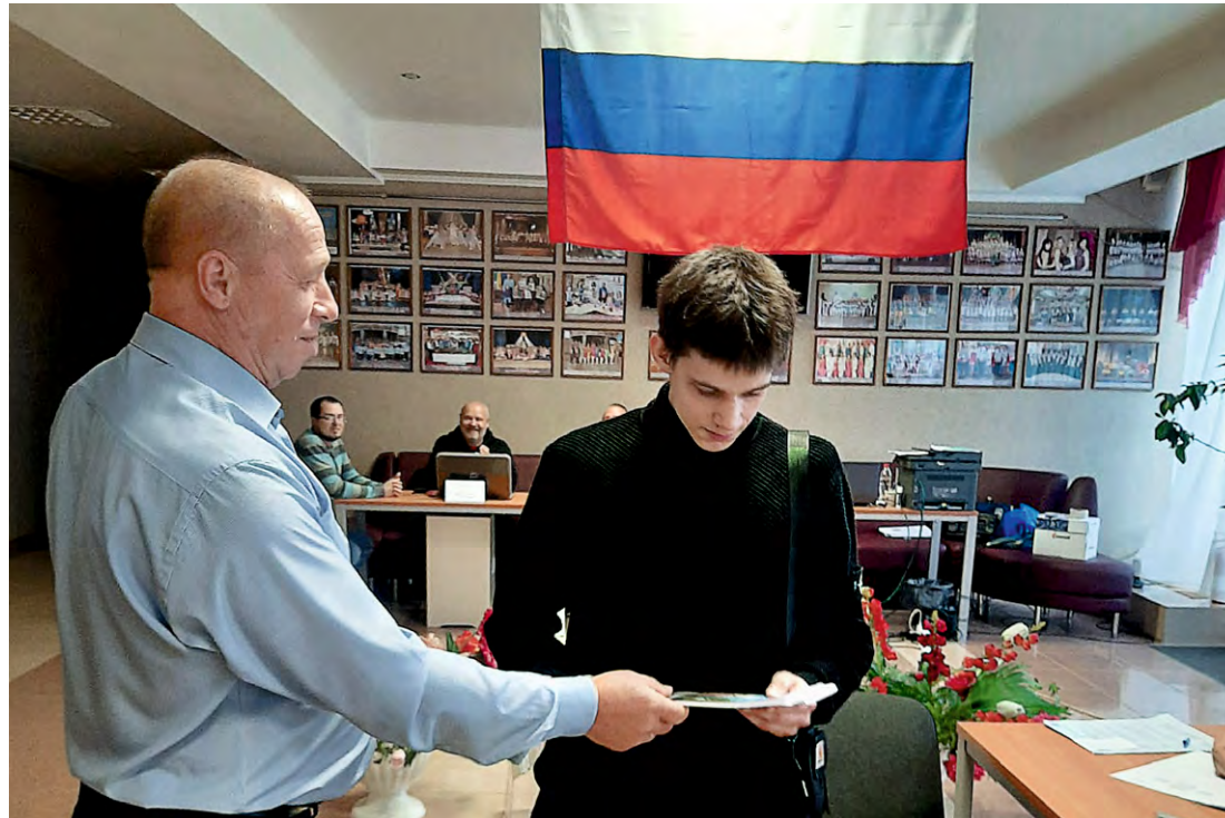
▲ В течение трёх дней железнодорожники могли отдать свой голос тому или иному кандидату