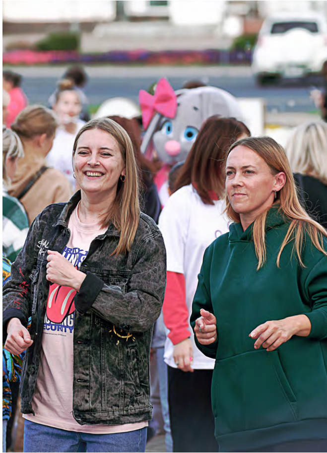
▲ Сотни железнодорожцев пришли на праздник и провели выходной день с прекрасным настроением

В сентябре на центральной площади Железнодорожска во второй раз прошёл яркий общегородской фестиваль #СемьяЖЕ. Его организовал железнодорожский Центр молодёжи, проект которого стал одним из победителей грантового конкурса Металлоинвеста «Вместе! С моим городом».