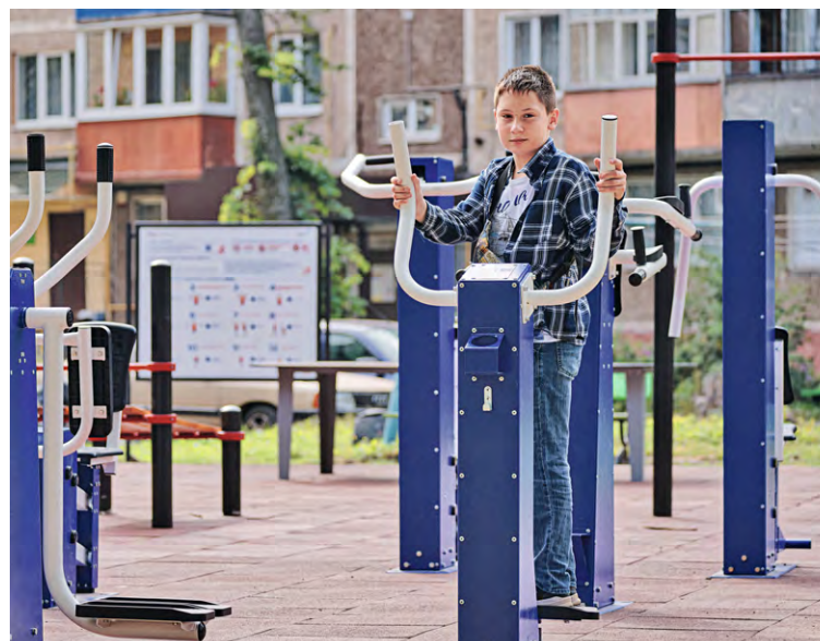
▲ Ещё три спортивные площадки Металлоинвест установил в этом году во дворах домов по улицам Гайдара, Комарова и Ленина

«Сегодняшние мальчишки и девчонки уже совсем скоро станут строителями, горняками, учителями, врачами, сотрудниками и руководителями муниципальных учреждений. Они будут строить и развивать наш город, делать его комфортнее и уютнее. Это не такая уж простая работа: для неё нужны и силы, и здоровье. Поэтому Михайловский ГОК ежегодно открывает во дворах и в общеобразовательных учреждениях новые спортивные объекты, устанавливает тренажёрные комплексы, создаёт условия для здорового образа жизни. Мы уверены: чем больше их будет, тем физически крепче будет наша молодёжь — будущее Железнодорожного.»