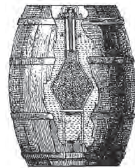
▲ Огнетушащая бочка Захарии Грейла давала водяной взрыв в очаге возгорания