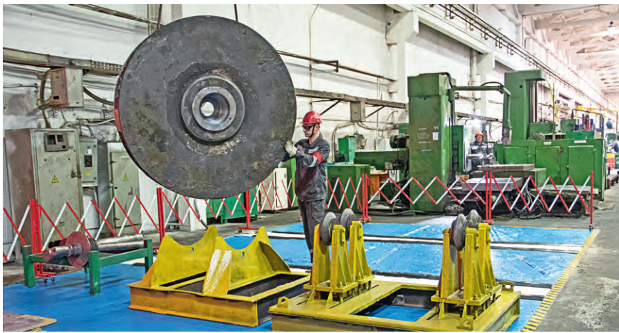
▲ При установке рабочего колеса на балансировку крановщик хорошо видит яркую, чётко очерченную рабочую зону