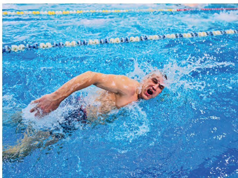
▲ Порой казалось, что вода в бассейне кипит от накала борьбы

— В школьном возрасте был чемпионом области по плаванию, сейчас — член областной сборной в своей возрастной категории, — рассказывает он. — Тренируюсь с удовольствием: любой спорт дарит положительные эмоции.