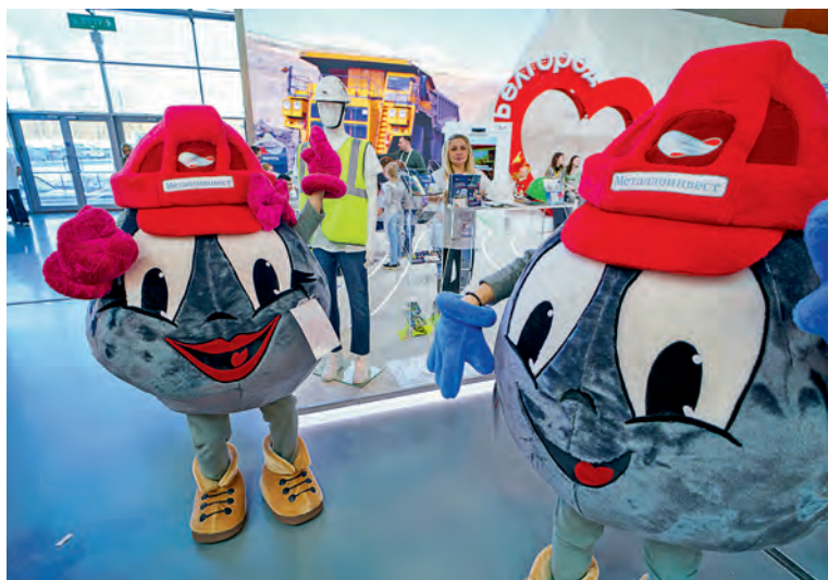
▲ Эти симпатяги очаровали многих посетителей стенда