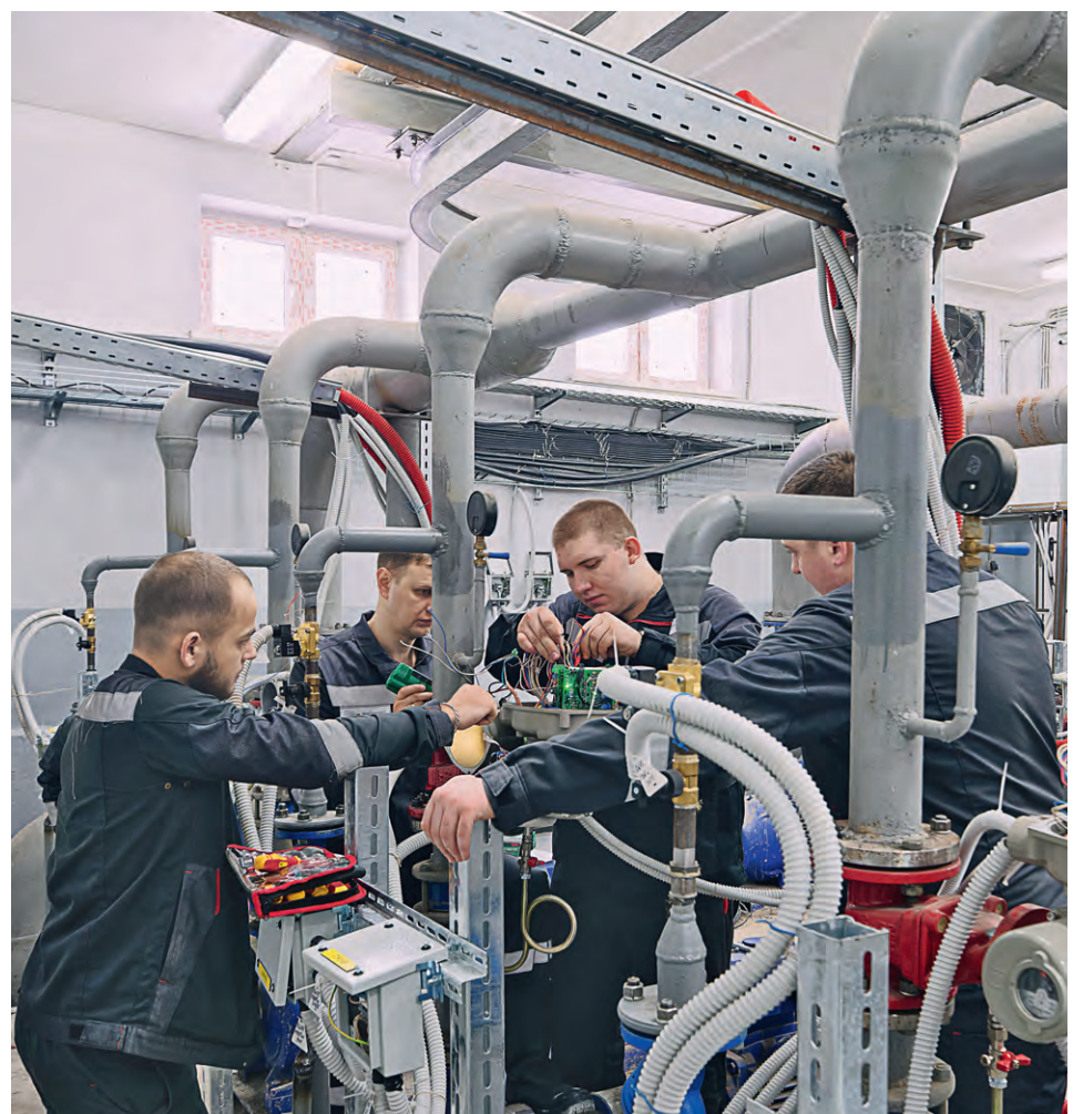
▲ На станции оборотного водоснабжения монтируют систему управления, которая позволит объекту работать без участия обслуживающего персонала

На дробильно-сортировочной фабрике Михайловского ГОКа подходит к завершению строительство станции оборотного технического водоснабжения