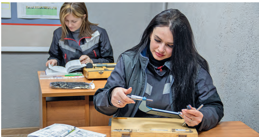
▲ Настройка измерительных приборов и контроль качества запасных частей теперь проходят в комфортных условиях