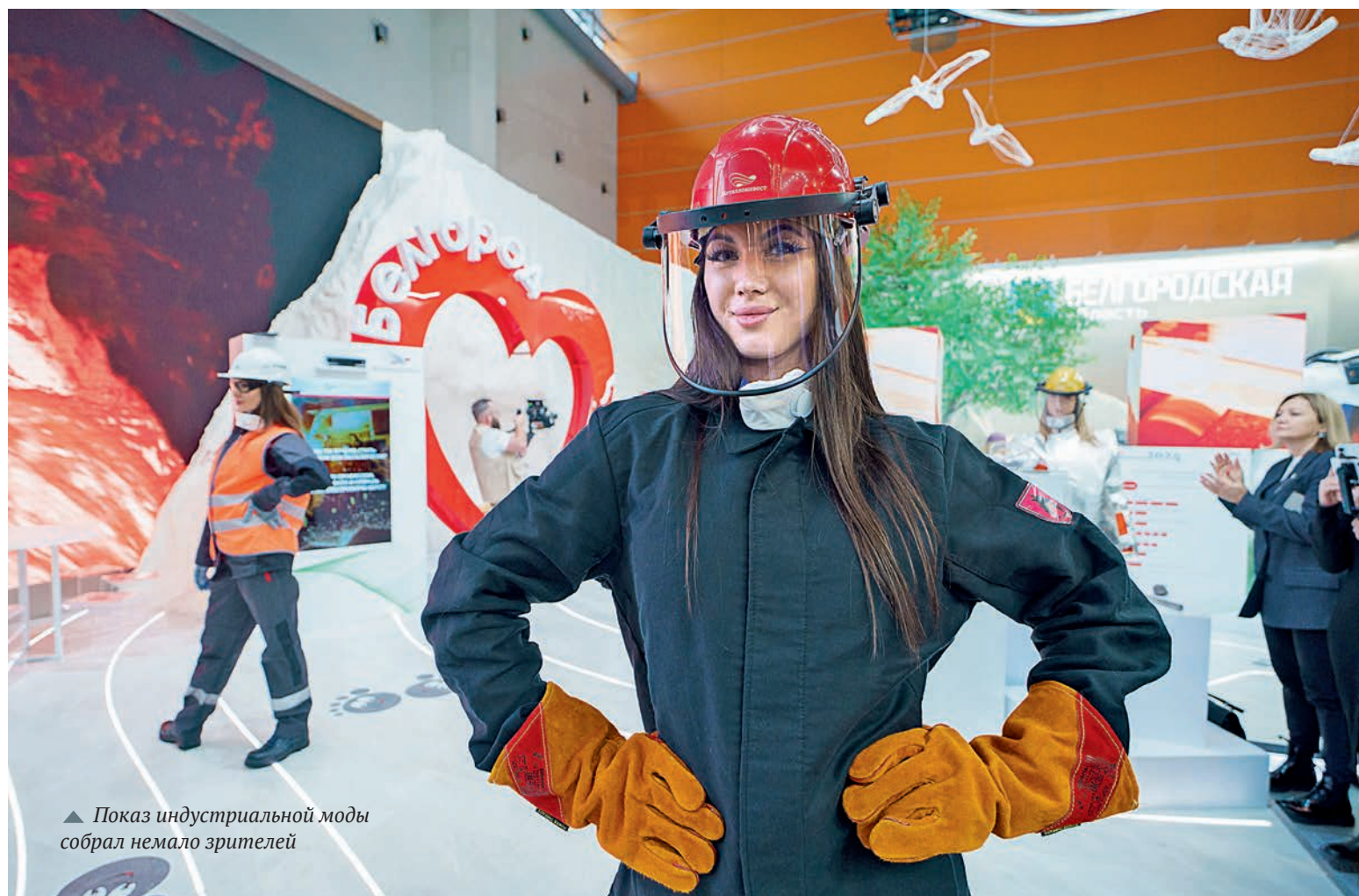
▲ Показ индустриальной моды собрал немало зрителей

— У нас огромные производственные мощности, самый большой набор технологий. Наша сила — в каждодневном трудовом подвиге горняков и металлургов. И мы с удовольствием рассказываем об этом, — отметил управ-