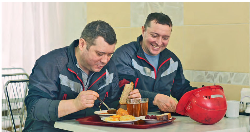
▲ Сотрудники УПЗЧ с удовольствием попробовали традиционные итальянские блюда

В столовой управления по производству запасных частей прошли Дни итальянской кухни