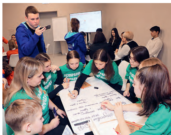
▲ Школьные команды тоже учились социальному проектированию