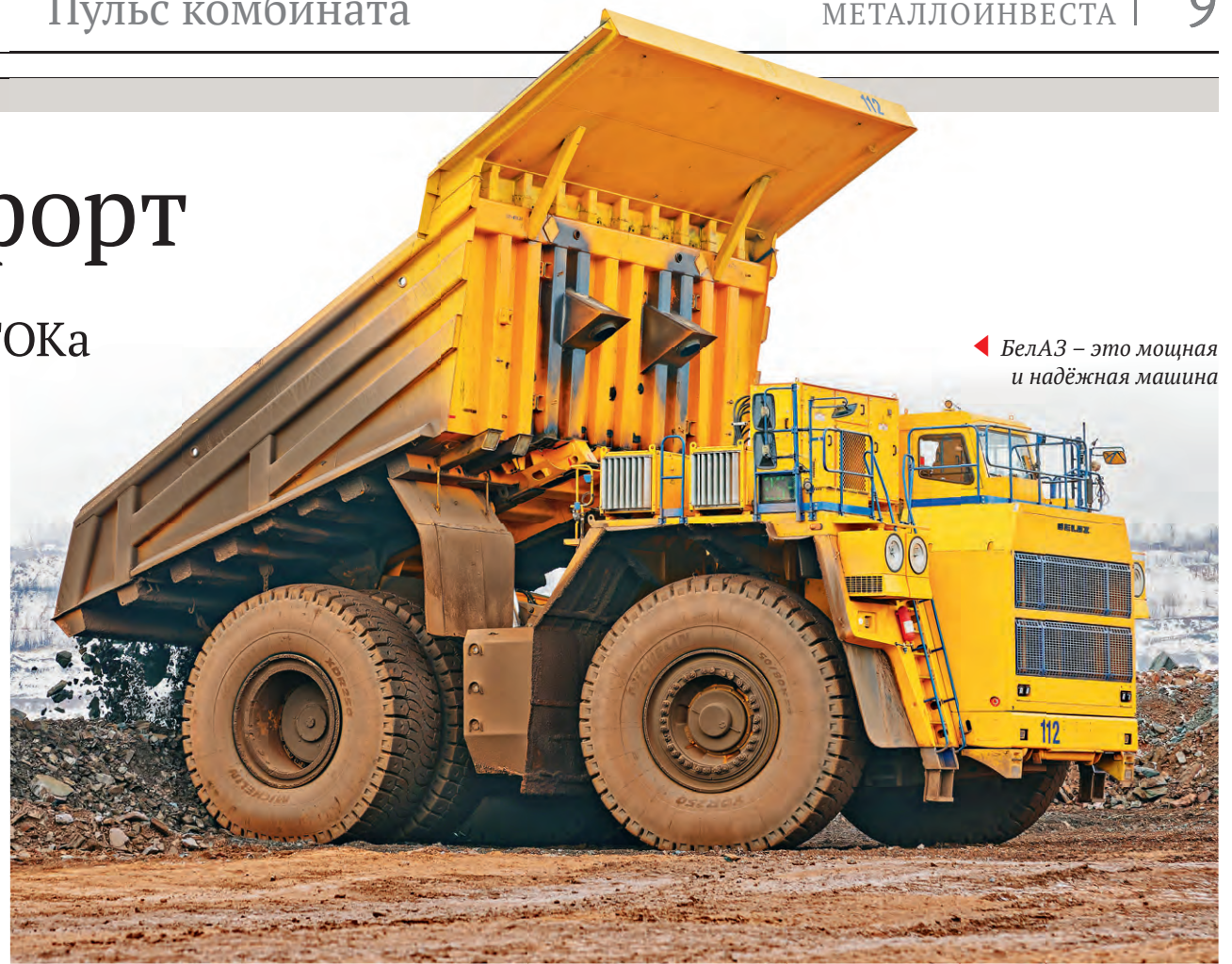
◀ БелАЗ — это мощная и надёжная машина

что огромным самосвалом управлять нелегко. Но Поздняков с этим мнением не согласен.