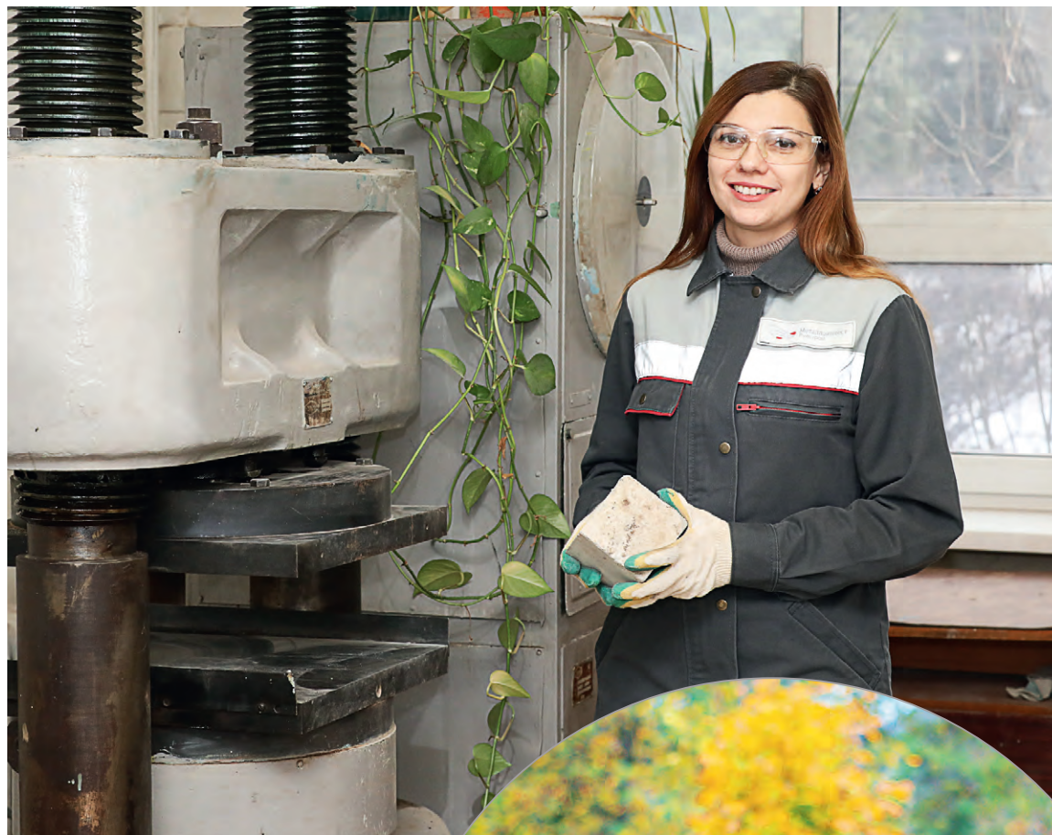
▲ Очередная проба бетона проверку на прочность прошла успешно