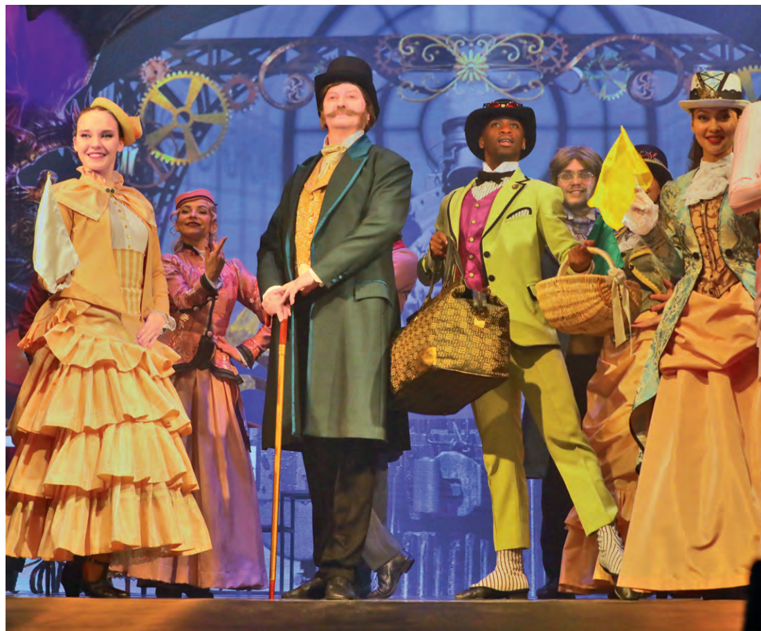
▲ Филеас Фогг и его слуга Жан Паспарту готовы отправиться в путешествие

Путешествие вокруг света в компании с астраханскими артистами, кажется сотканным из противоречий. Костюмы в стилистике XIX века, но с элементами стимпанка (направ-