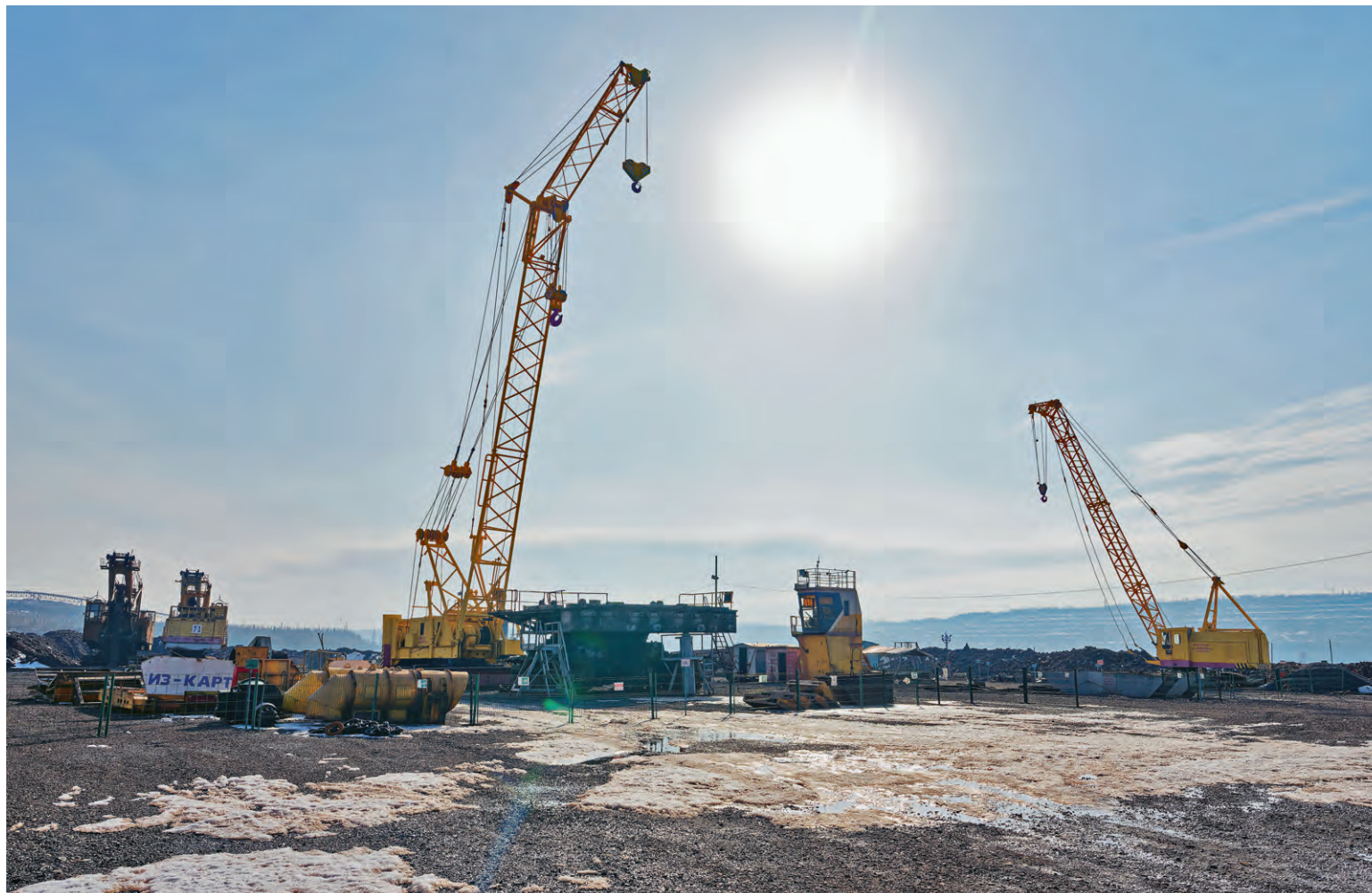
▲ Руководители комбината высоко оценили обустройство и содержание северной площадки по ремонту экскаваторов

Какие вопросы обсудили на февральском комитете по охране труда и промышленной безопасности