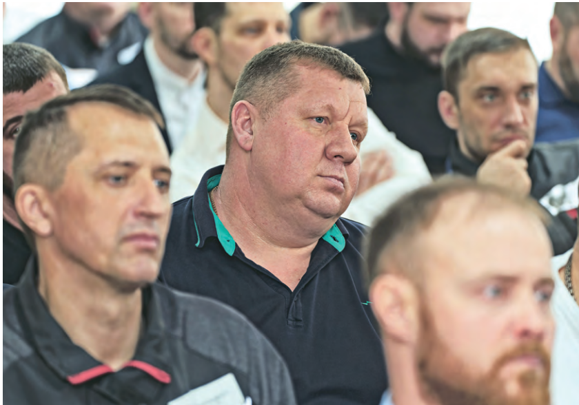
▲ Разговор с губернатором и обсуждение самых насущных и острых проблем вызвали неподдельный интерес у работников комбината, пришедших на встречу

Ещё один пункт программы модернизации городской медицины — собственный диагностический центр. Создать его глава региона планирует совместно с Металлоинвестом. Сейчас стороны обсуждают включение соответствующего пункта в программу