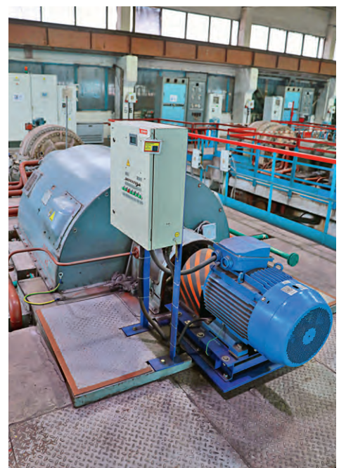
▲ Специальное устройство, установленное на компрессорах фабрики окомкования Михайловского ГОКа, позволяет управлять их мощностью и существенно экономить энергоресурсы

— Такой подход особенно актуален в подготовке к реализации крупных инвестиционных проектов Металлоинвеста — заводов ГБЖ и по переработке окисленных железистых кварцитов, которые будут строить на Михайловском ГОКе, — уверен он.