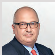
Назим Эфендиев, генеральный директор компании «Металлоинвест»: