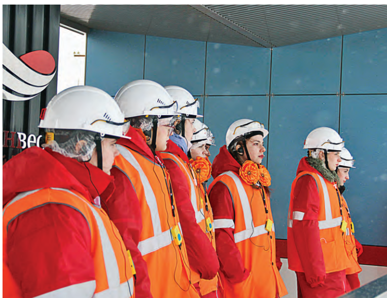
▲ Карьер МГОКа поразил школьников своими масштабами

Для нас третье место в турнире такого уровня — это высокий результат, ведь «Руда» совсем недавно начала свой путь в регби. На этом турнире мы заявили о себе во весь голос, доказав соперникам, что в Железнодорожном есть сильная команда, одолеть которую совсем непросто.