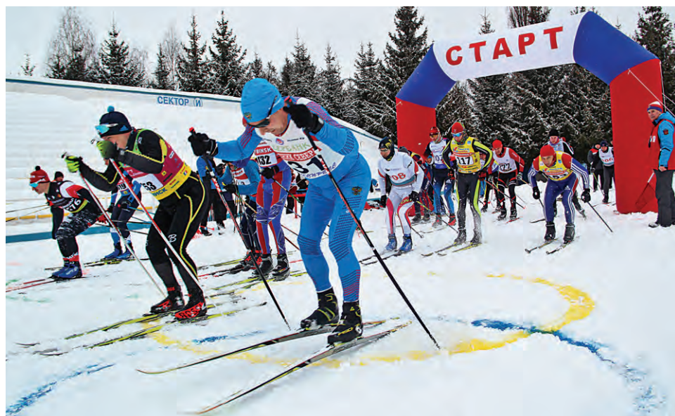
▲ На старт лыжной гонки в день состязаний вышло около трёхсот работников Михайловского ГОКа и его дочерних обществ

В личном первенстве самыми быстрыми на лыжне-2022 в своих возрастных группах среди мужчин ста-