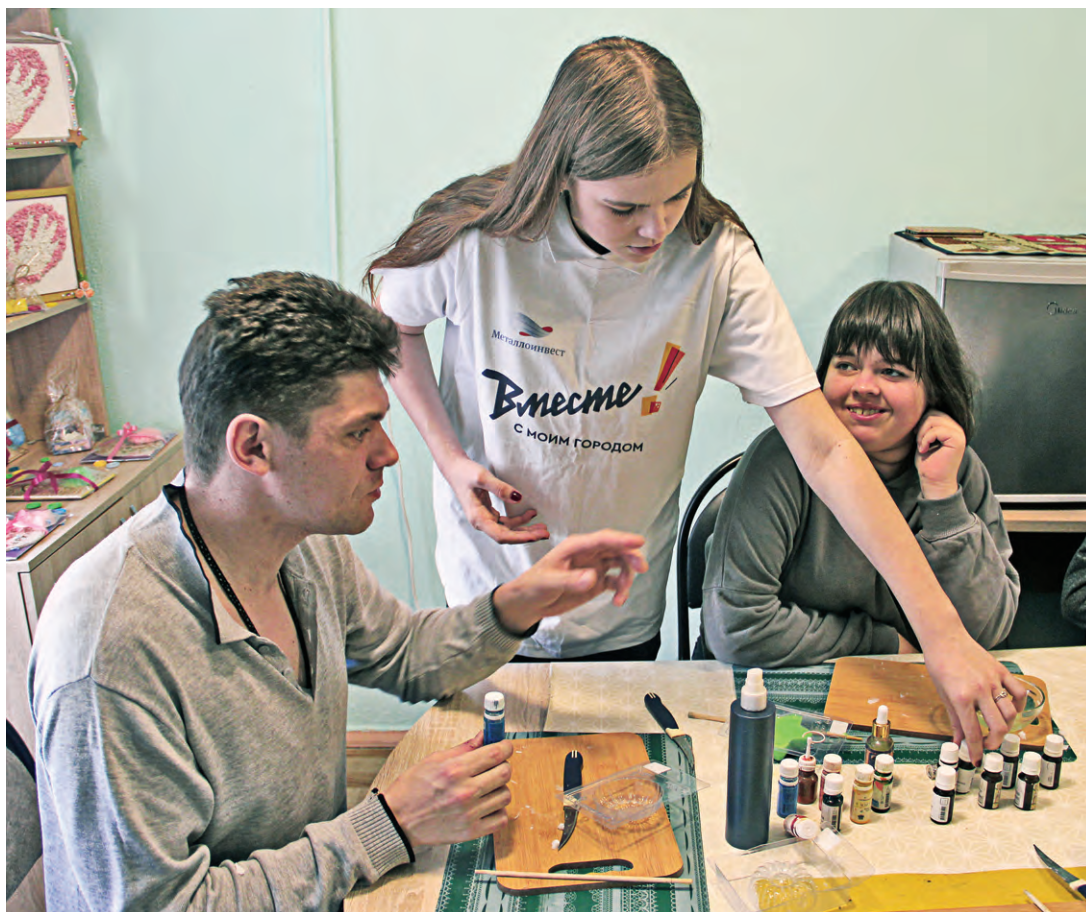
▲ В творческой мастерской «НеограниД» дети с ОВЗ успешно осваивают деревообработку, делают разную дизайнерскую продукцию и варят мыло ручной работы