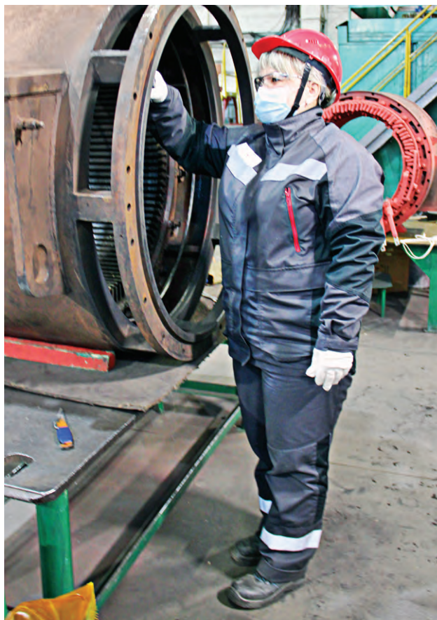
▲ Новая спецодежда, по словам работников, очень удобная, лёгкая и прочная

— Однако руководителиMetalloinvestа руководствуются проактивным подходом и понимают, что на производстве могут возникнуть разные ситуации, когда работнику будет необходимо оперативно сменить спецодежду. Поэтому было принято решение выдавать два комплекта костюмов для защиты от общепроизводственных загрязнений и механических воздействий (ОПЗ и МВ) всем работникам предприятий компании, в том числе —