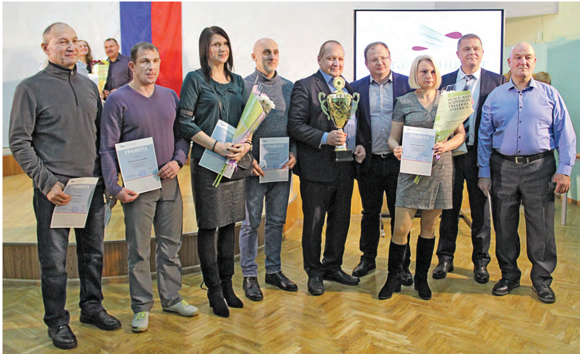
▲ Победители спартакиады МГОКа — 2021 — сборная центров ТОиР — с руководителями комбината