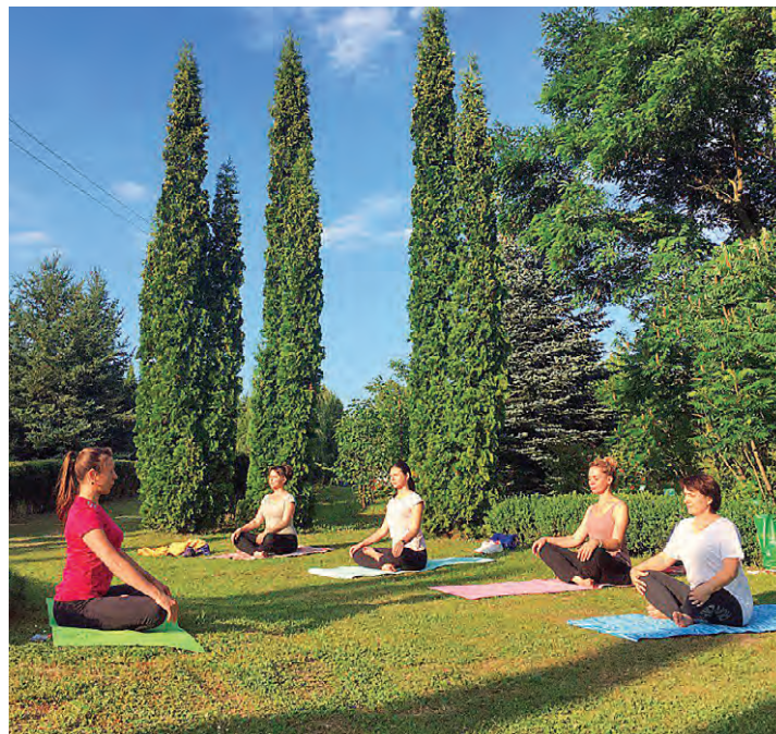
▲ В рамках проекта «Код женского здоровья» его авторы проводят бесплатные оздоровительные занятия для горожан

рублей дополнительных ресурсов получили за счёт привлечения партнёров.