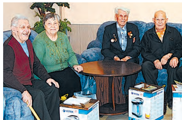
Подарки повышают настроение накануне праздника

Все ветераны комбината, которые завоевывали Победу, накануне знаменательной даты ощутили особое внимание и заботу от Металлоинвеста, коллектива горняков.