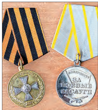
Боевые награды автора

В нашем городе, после лечения в госпитале, находится защитник Донбасса. Вот что он рассказывает о том, в какой ситуации оказалась его Родина.