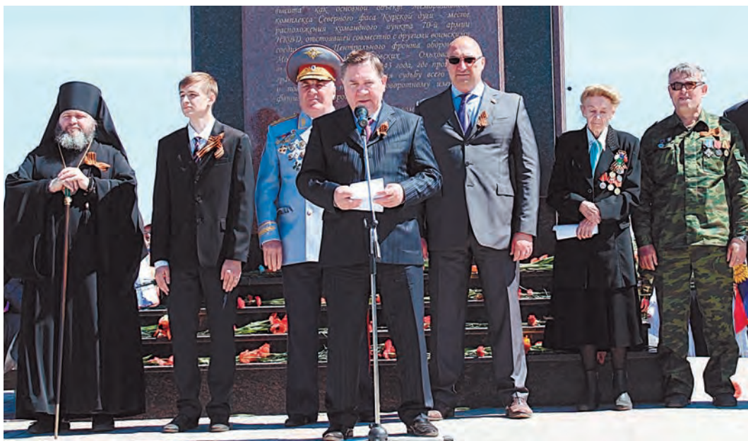
Торжественное открытие митинга

НАКАНУНЕ ПРАЗДНИКА ВЕЛИКОЙ ПОБЕДЫ ПРОШЛО ТОРЖЕСТВЕННОЕ ОТКРЫТИЕ МЕМОРИАЛЬНОГО КОМПЛЕКСА «ПОКЛОННАЯ ВЫСОТА 269 СЕВЕРНОГО ФАСА КУРСКОЙ ДУГИ».