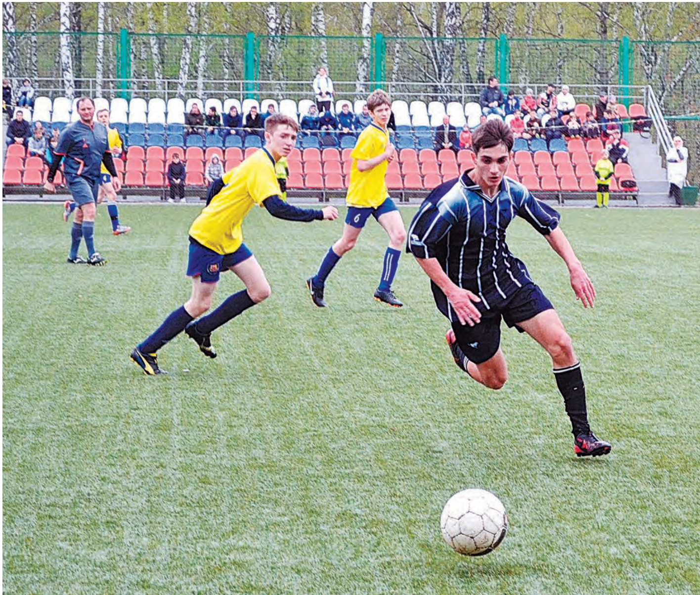
Матч команд «Горняк» и «Ника - ДЮСШ-6» открыл соревнования

С 1 по 5 мая в ЖЕЛЕЗНОГОРСКЕ ПРОШЕЛ МЕЖДУНАРОДНЫЙ ДЕТСКИЙ ТУРНИР ПО ФУТБОЛУ, ПОСВЯЩЕННЫЙ ЮБИЛЕЮ ПОБЕДЫ В ВЕЛИКОЙ ОТЕЧЕСТВЕННОЙ ВОЙНЕ. ЕГО ГЕНЕРАЛЬНЫМ ПАРТНЕРОМ СТАЛА КОМПАНИЯ «МЕТАЛЛОИНВЕСТ».