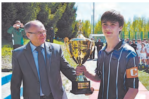
Железнодорожная команда «Горняк» заняла второе место в турнире