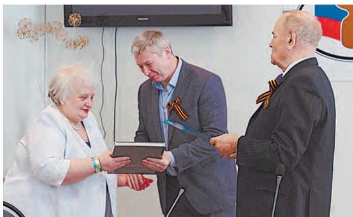
Победители конкурса получили награды

В еликая Победа советского народа над фашизмом. Подвиг и трагедия сороковых военных лет. Большое видится на расстоянии, значимость и ценность таких событий не уменьшается с годами. Оттого и интерес курских журналистов к военно-патриотической теме не угасает. Да и реалии современного време-