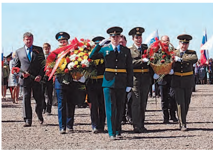
Возложение цветов к Поклонному кресту

Меньше года прошло с тех пор, как на высоком земляничном холме близ села Молотычи был заложен первый камень в основание большого мемориального комплекса. Тогда, прошлым летом, там находился только высокий Поклонный крест, установленный компанией «Металлоинвест» совместно с общественной организацией «Курское землячество». Теперь на вершине холма, с которого как на ладони видны бескрайние пшеничные поля, а в ясную погоду можно разглядеть окраины Курска, раскинул свои крылья установленный там Ангел мира. Этот памятник на высокой колонне является центром комплекса «Поклонная высота 269».