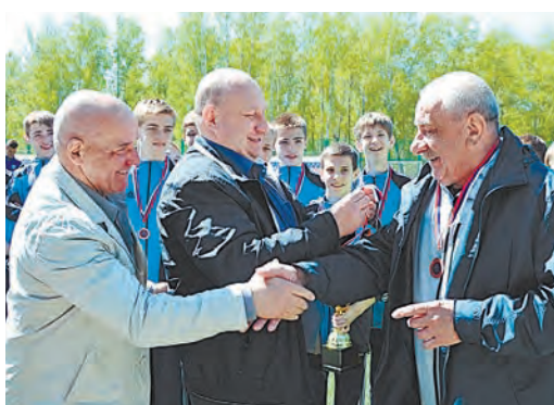
Тренеры юных футболистов также получили награды