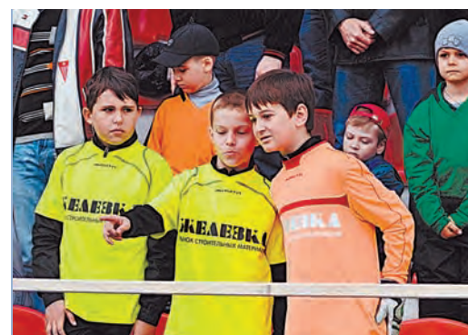
Болельщикам было что обсудить и на что посмотреть