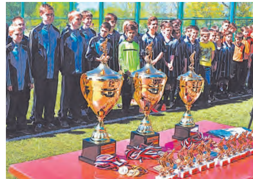
Награды за успех и мастерство