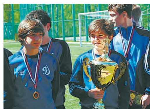
Абхазская команда «Динамо» - победитель турнира по футболу