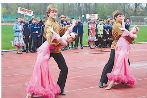
Во время открытия турнира артисты Дворца культуры создавали его участникам и гостям праздничное настроение

В течение пяти дней на стадионе «Горняк» проходил настоящий спортивный праздник. Гостеприимный город горняков встречал юных спортсменов не только из российских городов – Белгорода, Твери, Курска и Железнодорожска, но и из Беларуси и солнечной Абхазии.