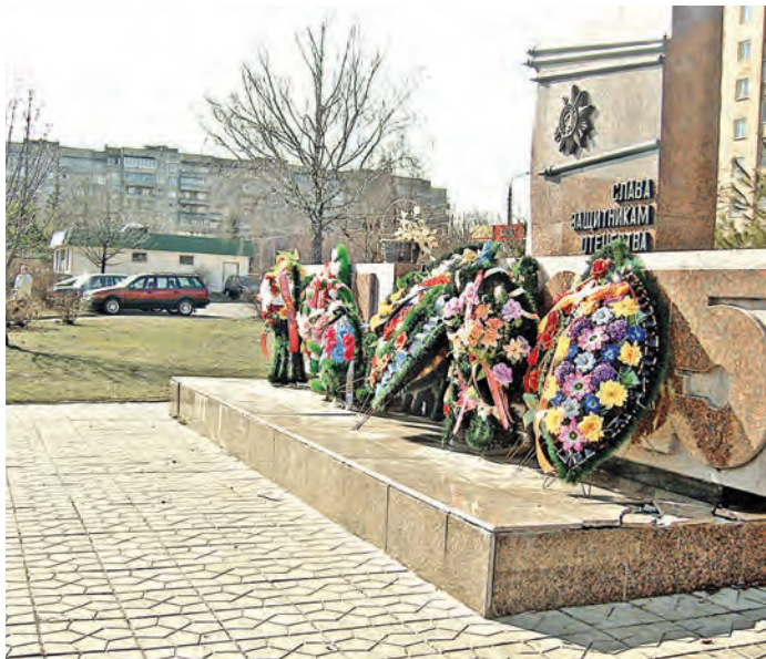
В городском сквере Солдатской славы.

Вновь перед глазами ветеранов Павшие в атаках в бой идут. Мы войны не видели с тобою, Лишь по книгам знаем и кино Кошечего, партизанку Зою... И во имя жизни нам дано Пронести их подвиг через годы, Через поколения вперед, Чтобы в мире жили все народы, В их числе - российский наш народ. Пусть не забывают все убийцы: Не дано прощения им, нет! И не смуть живой святой водицей Той войны кровавый зверский след. Дни проходят, месяцы и годы И уносят реки много вод, Память о войне в сердцах народа Будет жить - вовеки не умрет!