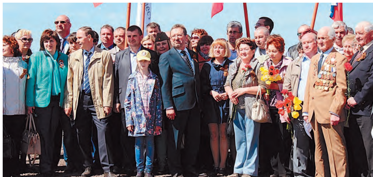
Горняцкая делегация вместе с ветеранами на открытии мемориала

Социальная инициатива Металлоинвеста по поддержке строительства мемориала «Поклонная высота 269» вблизи села Молотычи в Фатежском районе Курской области заняла второе место в десятке наиболее значимых проектов российских компаний к празднованию 70-летия Победы в Великой Отечественной войне по версии журнала «Промышленность и общество».