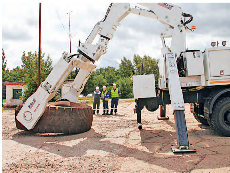
▲ В автопарке УГП есть редкие машины. Кран-манипулятор — одна из них

В составе УГП комбината — свыше 350 единиц техники для различных работ. Автомобили подразделения заправляют большегрузные самосвалы, доставляют горняков в карьер и обеспечивают их питьевой водой. Зимой обрабатывают карьерный «серпантин» песко-соляной смесью. Автокраны УГП (среди которых — силачи грузоподъёмностью 145 тонн) задействованы в ремонте карьерной техники. Есть в автопарке подразделе-