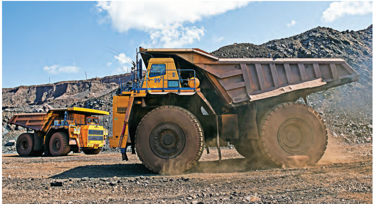
▲ Ежедневно самосвалы АТУ МГОКа перевозят около 320 тысяч тонн горной массы