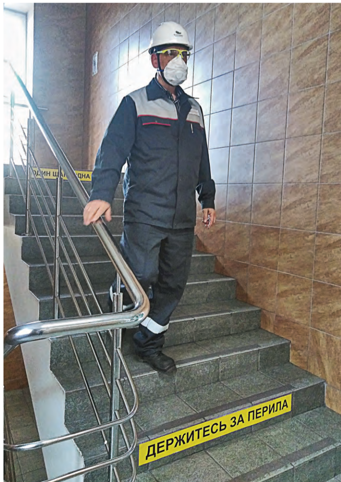
▲ Надписи на ступеньках лестницы призывают сотрудников быть внимательными