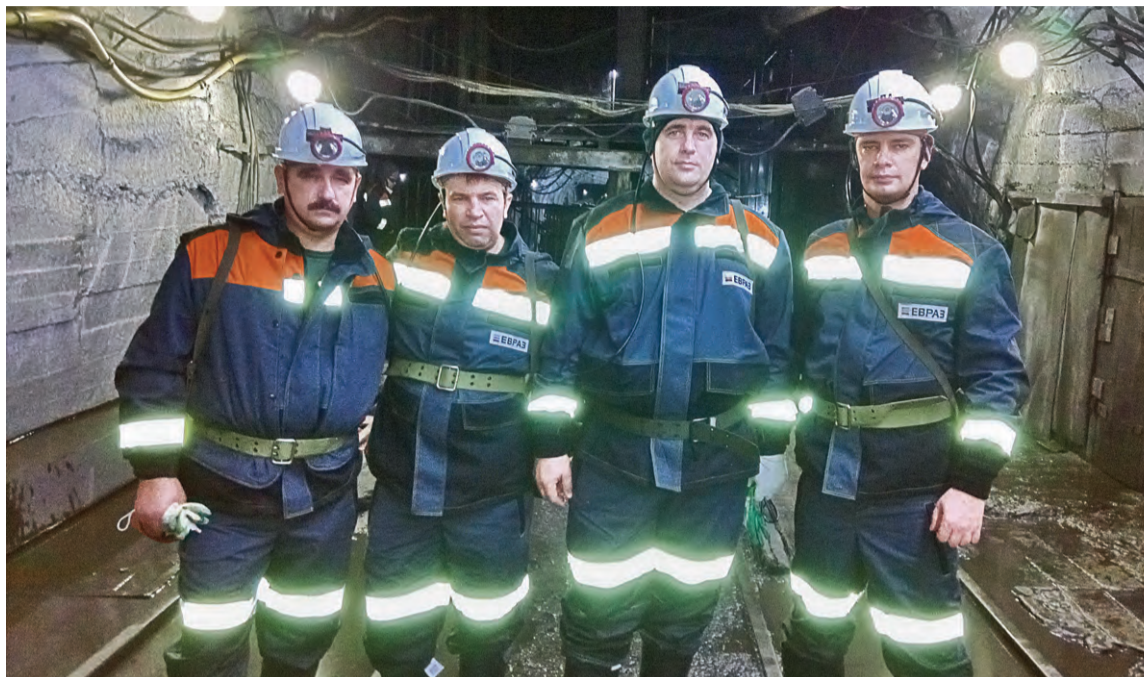
▲ Представители Металлоинвеста — в шахте «Осинниковская»

В первую очередь обращает на себя внимание комплексный подход к обеспечению производственной безопасности: в работе по созданию безопасных условий труда системно задействовано несколько подразделений. В ней активно участвует не только подразделение ОТиПБ, но и Центр подготовки кадров, IT-подразделение. Это позволяет успешно применять на производстве самые современные методы.