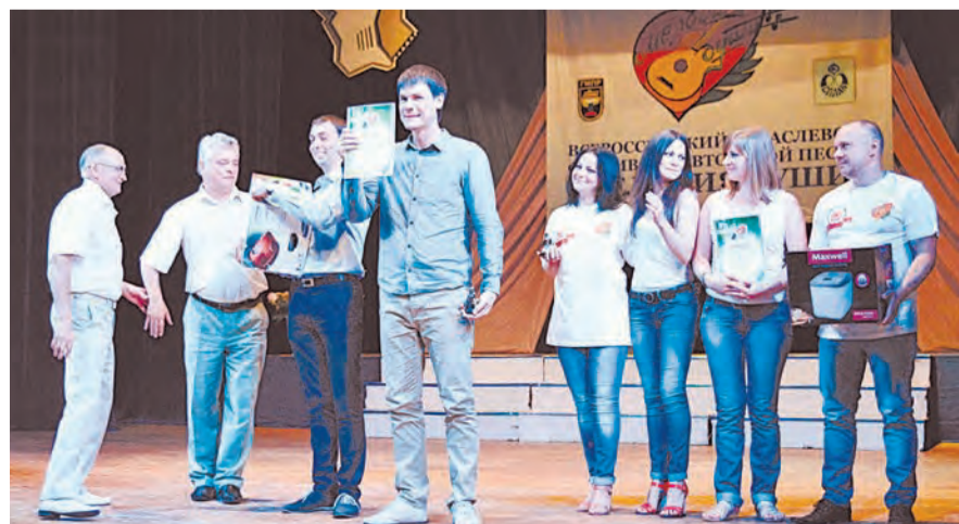
Гран-при фестиваля – это большая радость и гордость