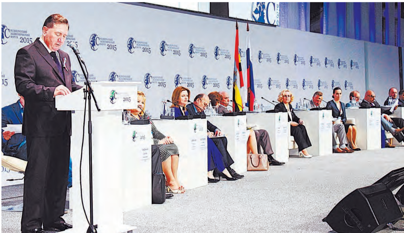
Губернатор области Александр Михайлов открыл четвертый Среднерусский экономический форум

В КУРСКЕ ПРИ УЧАСТИИ И ПОДДЕРЖКЕ АППАРАТА ПОЛНОМОЧНОГО ПРЕДСТАВИТЕЛЯ ПРЕЗИДЕНТА РОССИЙСКОЙ ФЕДЕРАЦИИ В ЦФО СОСТОЯЛСЯ ЧЕТВЕРТЫЙ СРЕДНЕРУССКИЙ ЭКОНОМИЧЕСКИЙ ФОРУМ.