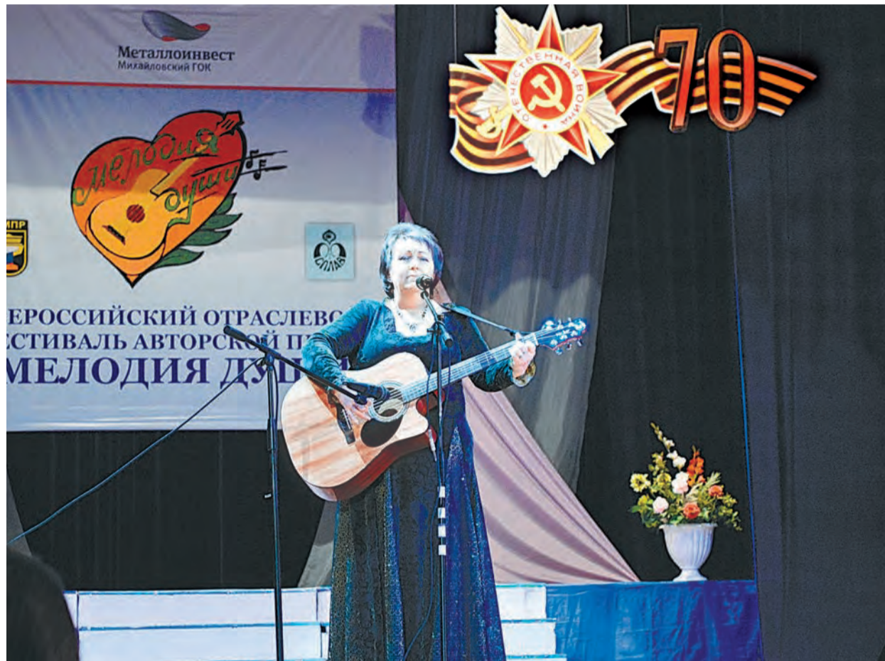
Гитара в руках – возможность высказаться о самом сокровенном

жать к ветеранам, инвалидам, детям, осваивать новые аудитории, находить новых слушателей и среди тех, кто не может побывать во Дворце культуры. Нам радуются жители дома-интерната, с благодарностью встречают дети. Хочется верить, что после таких концертов кто-то из них возьмет гитару и из души польются собственные строки.