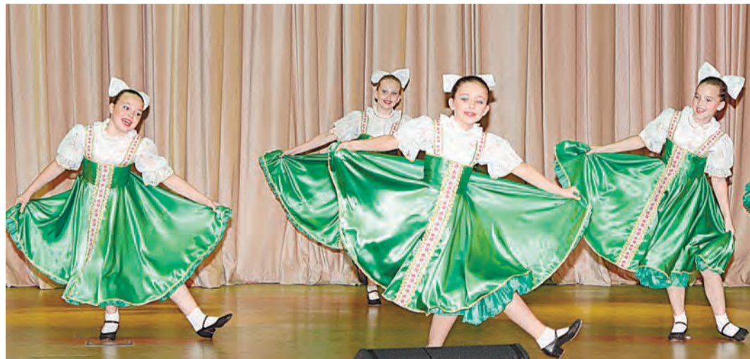
Задорный народный танец ансамбля «Юность Курской Магнитки» по достоинству оценили жюри и зрители

Мы заняли второе место и очень рады. Мы так волновались, чуть-чуть плакали, когда ошиблись, но, кажется, жюри не очень заметило, а потом мы исправили свою ошибку. Большое спасибо руководителю за такую поездку и за то, что нас так хорошо подготовили.