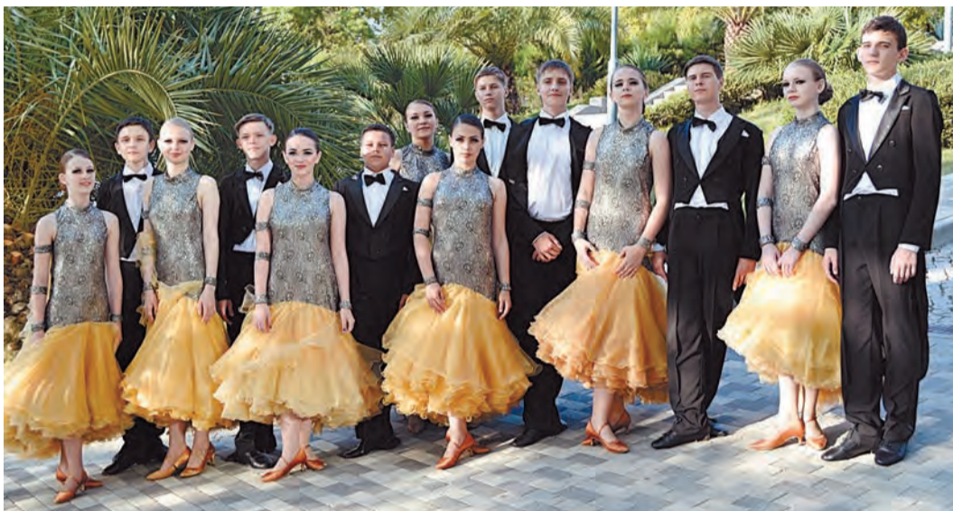
Старшая группа хореографической студии «Людмила» после «золотого» выступления на сцене фестиваля

Образцовая хореографическая студия «Людмила» заняла в номинации «Бальный танец» два «золотых» места и взяла одно «серебро». Старший состав «Людми-