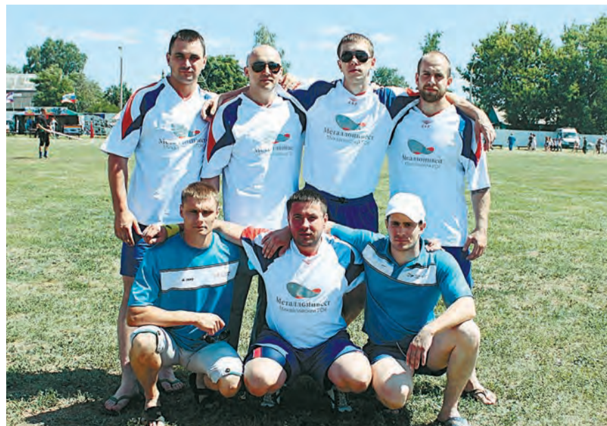
Команда гиревиков МГОКа