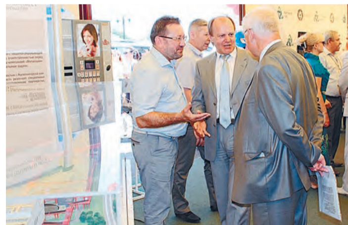
Экспозиция МГОКа – макет СКОМ-3 был интересен многим представителям бизнеса и власти

Юбилейная ярмарка собрала свыше 6 тысяч гостей и участников. Помимо представителей 40 регионов России, в ярмарке участвовали делегации 20 зарубежных государств: Белоруссии, Сербии, Молдовы, Вьетнама, Венгрии, Болгарии, Украины, Германии, Кореи, Индии, Шри-Ланки, Китая, Греции, Казахстана, Кении, Намибии, Анголы, Донецкой и Луганской народных республик. – Я рад видеть на юбилейной ярмарке как старых наших друзей, коллег и партнеров, так и тех, кто здесь впервые, – приветствовал на открытии участников ярмарки губернатор Курской области Александр Михайлов. – За пятнадцать лет, что мы проводим ярмарку, здесь подписано более 70 соглашений. За время проведения ярмарки внешнеторговый товарооборот Курского региона вырос в четыре раза. Постоянный участник – предприятие компании «Металлоинвест» Михайловский ГОК. Являясь крупнейшим промышленным предприятием Курского региона, комбинат традиционно занял на ярмарке одну из ключевых позиций, представив макет строящегося комплекса третьей обжи-