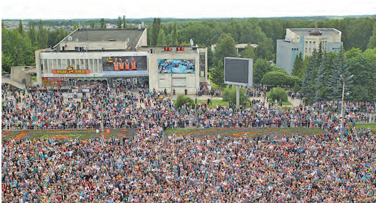
На праздничном концерте собралось около 27 тысяч железнодорожников.