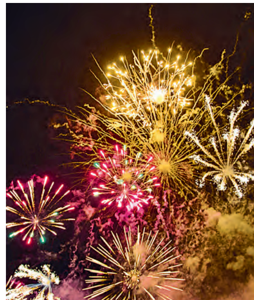
Фейерверк - красочное завершение праздника.