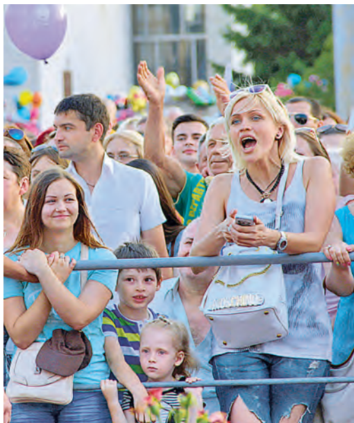
Зрители подпевали любимым артистам.

Металлоинвест привёз в Железнодорожск профессиональных артистов. В нашем городе выступили Филипп Киркоров, Soprano Турецкого и сёстры Толмачёвы.