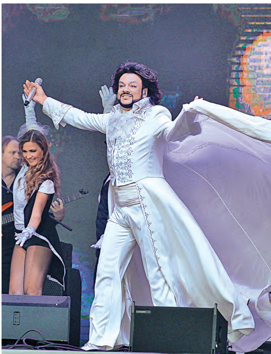
Перед железнодорожниками выступил Филипп Киркоров.

У же второй год подряд концерт, посвящённый профессиональному празднику горняков и металлургов, проходил у городской администрации. Посмотреть выступление любимых артистов мог любой желающий, и железнодорожники начали собираться на центральной площади задолго до начала представления. Когда зазвучала первая мелодия, возле сцены яблоку негде было упасть, а тем, кто хотел пройти из одного конца улицы в другой, приходилось изрядно потрудиться, ведь на концерт собралась огромная часть жителей города.