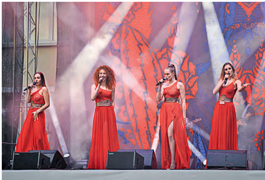
От голосов певиц арт-группы Soprano Турецкого по коже бежали мурашки.