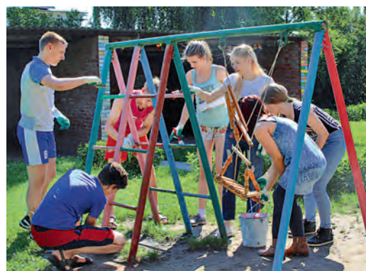
Молодогвардейцы всегда готовы прийти на помощь.