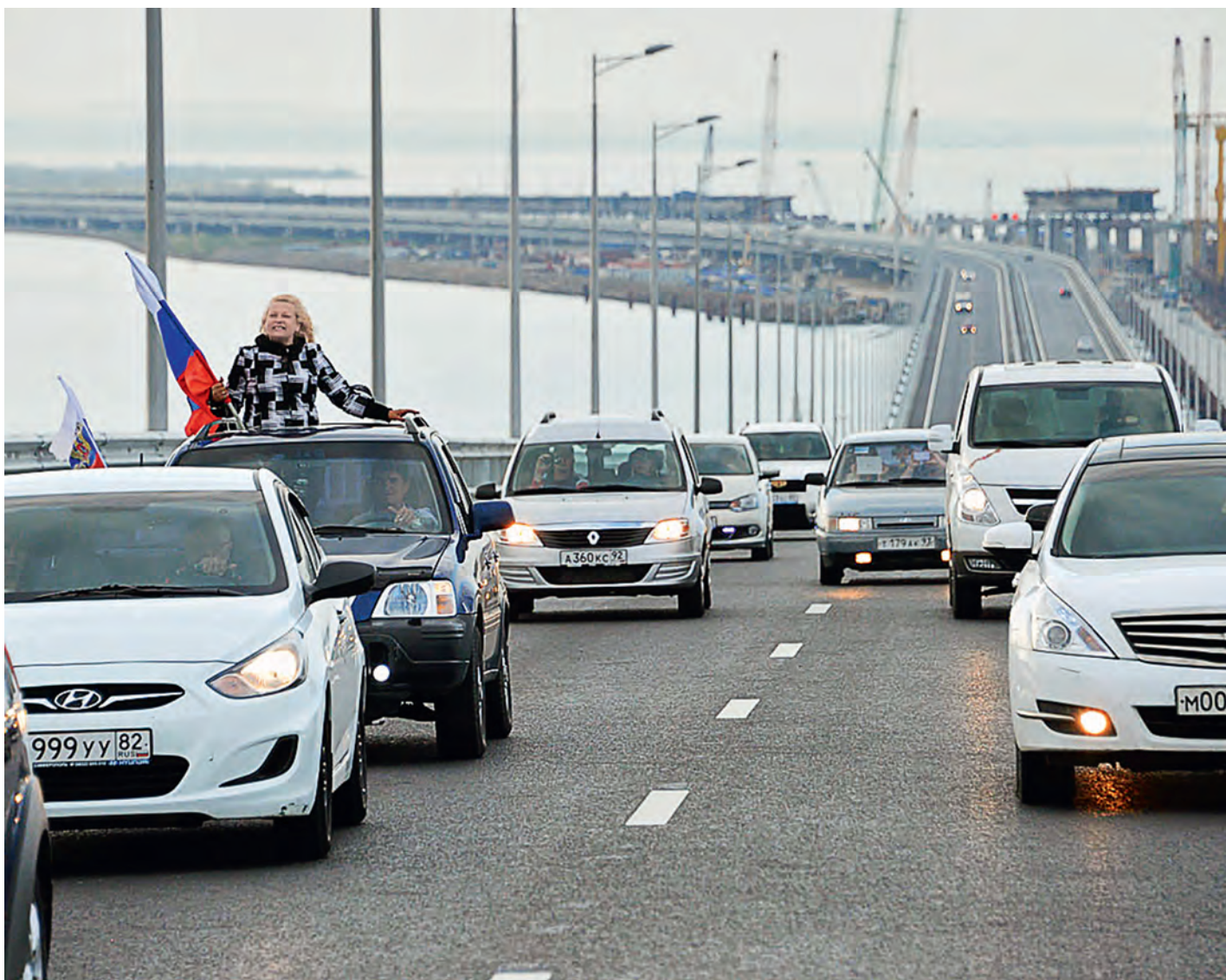
Автомобильное сообщение между Керчью и Таманью открыто: 16 июня по Крымскому мосту проехали первые автомобили.

15 мая Владимир Путин открыл движение по Крымскому мосту. Вместе со строителями, воплотившими в жизнь этот грандиозный проект, он проехал по мосту за рулём «КамАЗа».