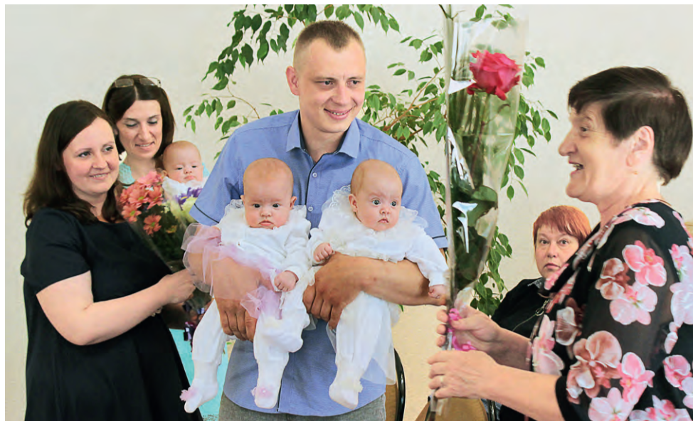
Счастливые родители принимают поздравления.

Накануне Международного дня семьи в Железногорске поздравили молодых родителей с рождением тройни.