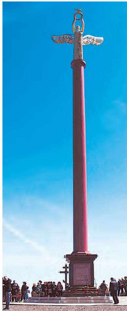
Пусть помнит край спасенный