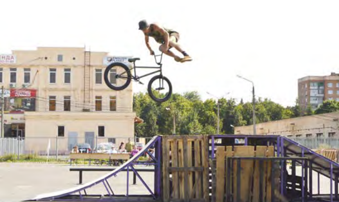
Кто сказал, что человек не может летать? Главное - очень этого хотеть и активно к этому стремиться