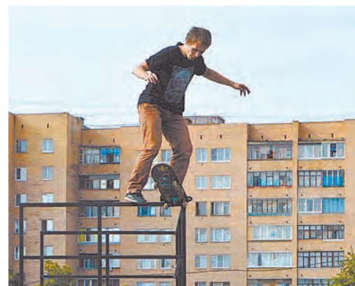
На такое отважится далеко не каждый. А вы бы так смогли?