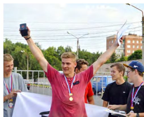
Итоги подведены, и награды нашли своих экстремалов. Ура победителям!