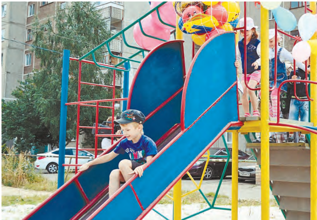
Здорово, когда детская площадка прямо у тебя во дворе!

...Над горкой и лесенками парили разноцветные воздушные шары. Все это так и манило к себе, мальчишкам и девчонкам просто не терпелось опробовать новинку. Наконец-то красная ленточка перерезана – и веселая ребятня быстрым ручейком устремилась к новенькой площадке. Впрочем, не толкались, катались по очереди и громко обещали друг другу,