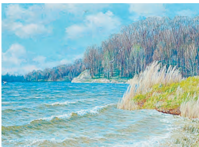
Не поверите! Но эти волны – на нашем озере

Мир природы, создающий позитивное настроение