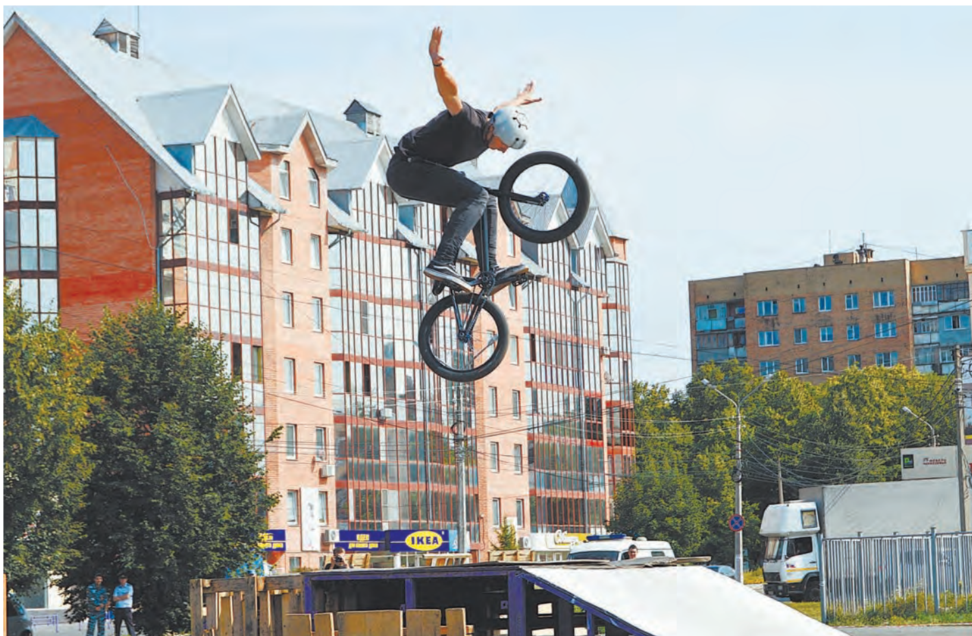
Экстрим - это по-нашему!