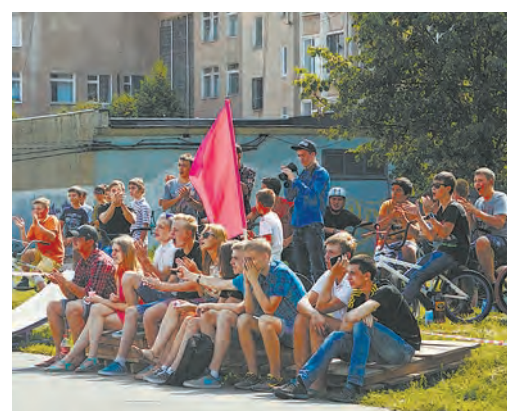
Такие зрелищные виды спорта всегда собирают много болельщиков