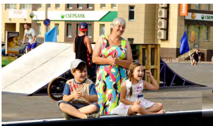
За спортсменов болели все - и взрослые, и дети. Причем, маленькие зрители - активнее всех