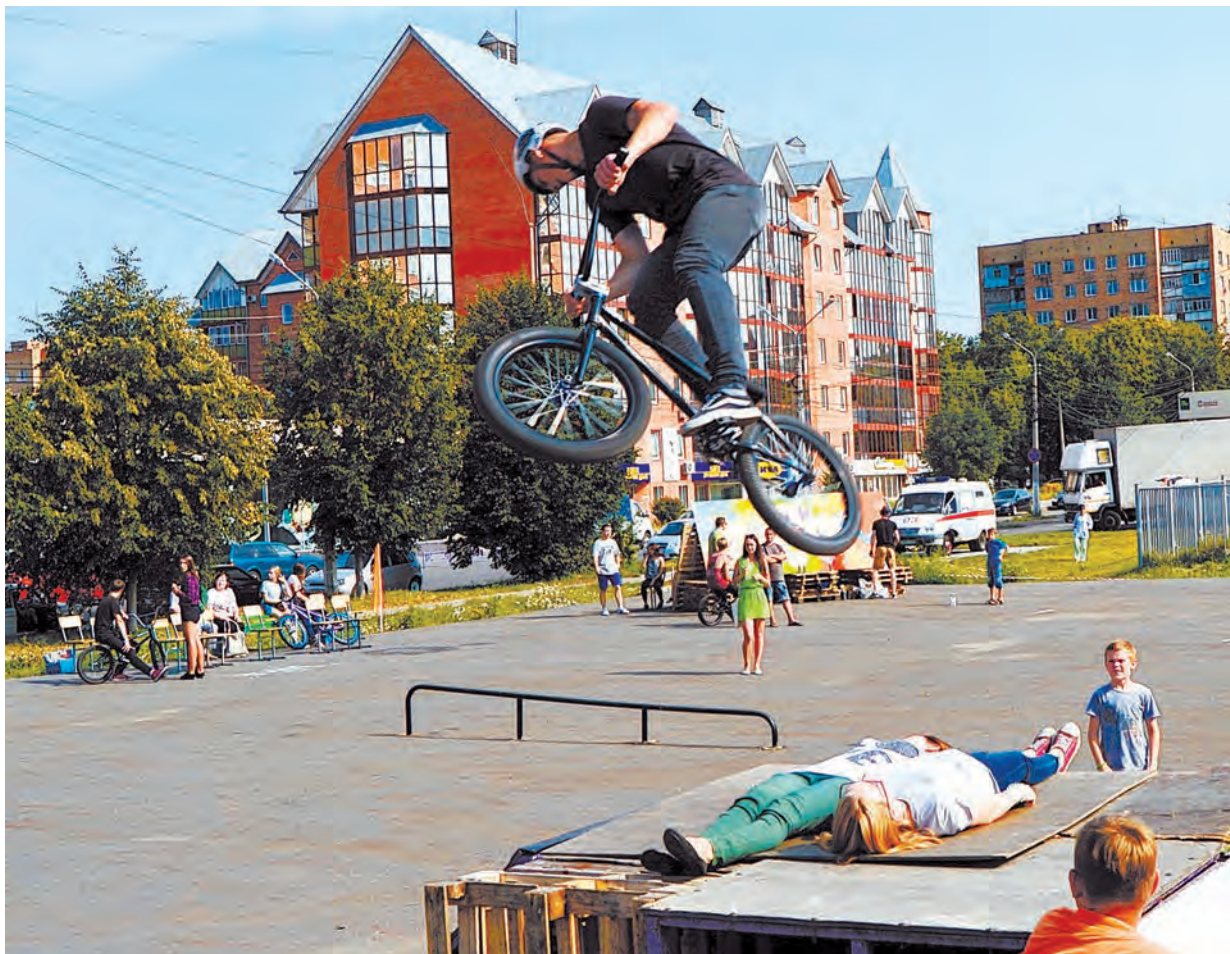
Страхно? Не то слово. Зрелищно? Еще как! Мастерски? Без сомнений. Соревнования спортсменов-экстремалов всегда превращаются в настоящий спортивный праздник