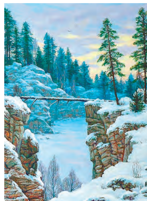
В картинах Филоненко – география его путешествий