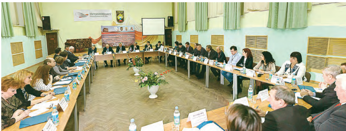
Участники семинара обсудили работу профсоюза в современных условиях