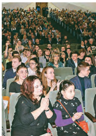
Зал аплодировал, не переставая