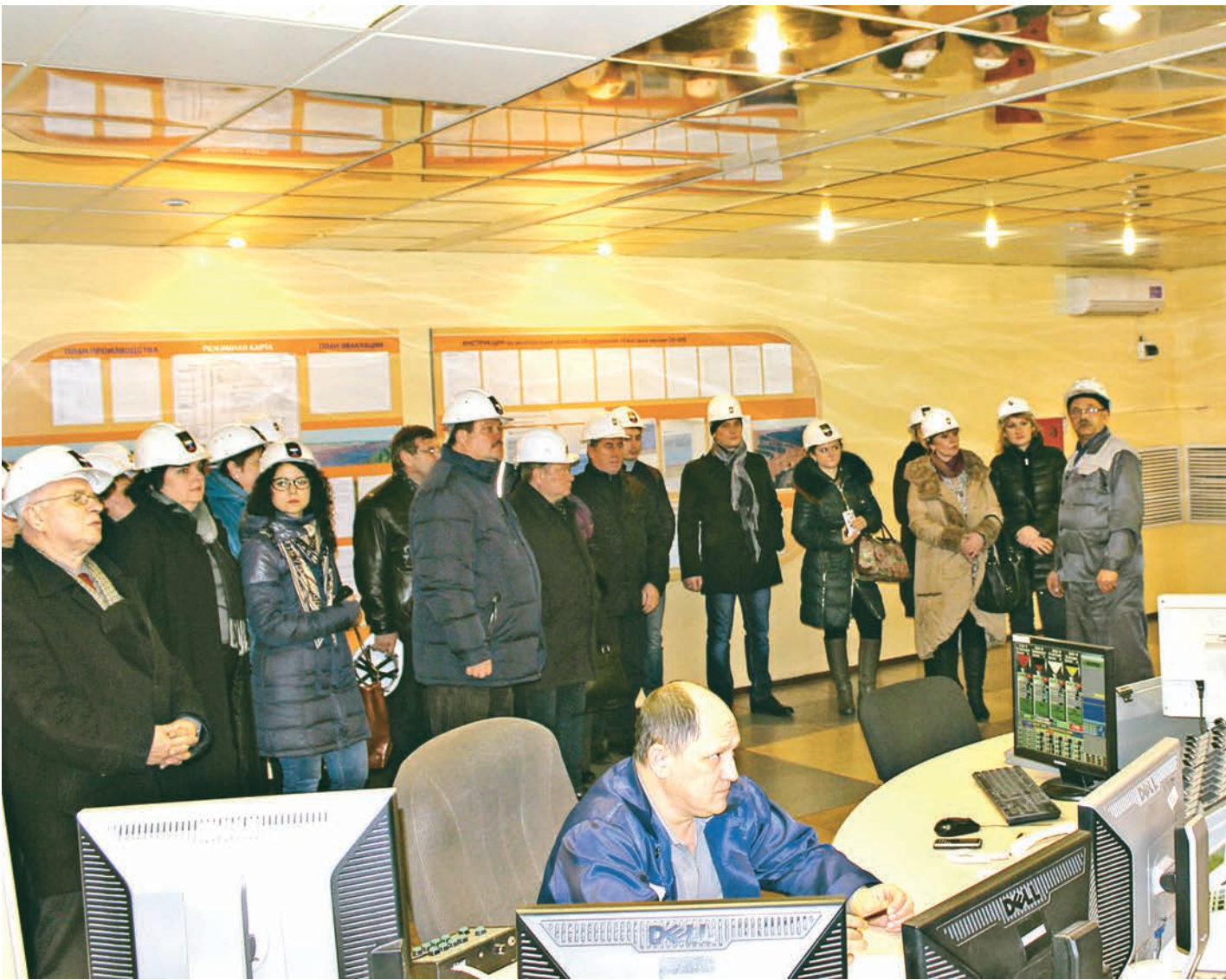
Участники профсоюзного форума познакомились с производством Михайловского ГОКа

Семинар на Михайловском ГОКе собрал вместе представителей Горно-металлургического профсоюза России (ГМПР) из восьми регионов России.