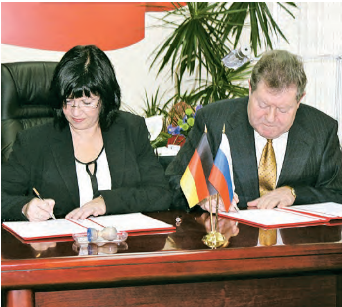
Подписание протокола о намерении установления побратимских связей