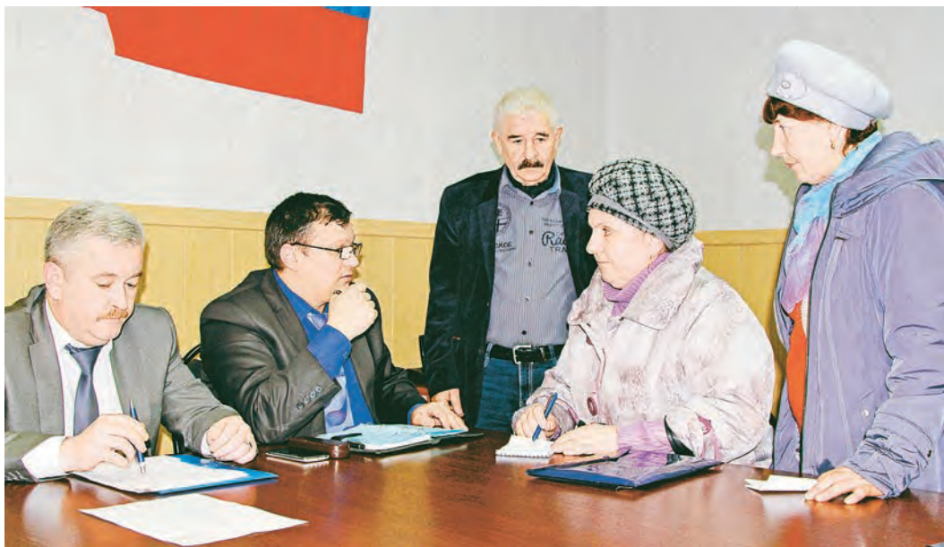
Железнодорожники старались «брать на карандаш» обещания. Поможет ли?

Предполагалось, что в этом году в городе капитально отремонтируют 40 домов. Сколько уже готово - выяснить не удалось.