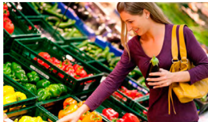
Флодоовощная продукция стала доступней

В областном комитете по тарифам и ценам сообщили, что в регионе снизились цены на 24 из 39 наблюдаемых продуктов питания. На динамику цен на продовольственные товары, в первую очередь, повлияло снижение цен на