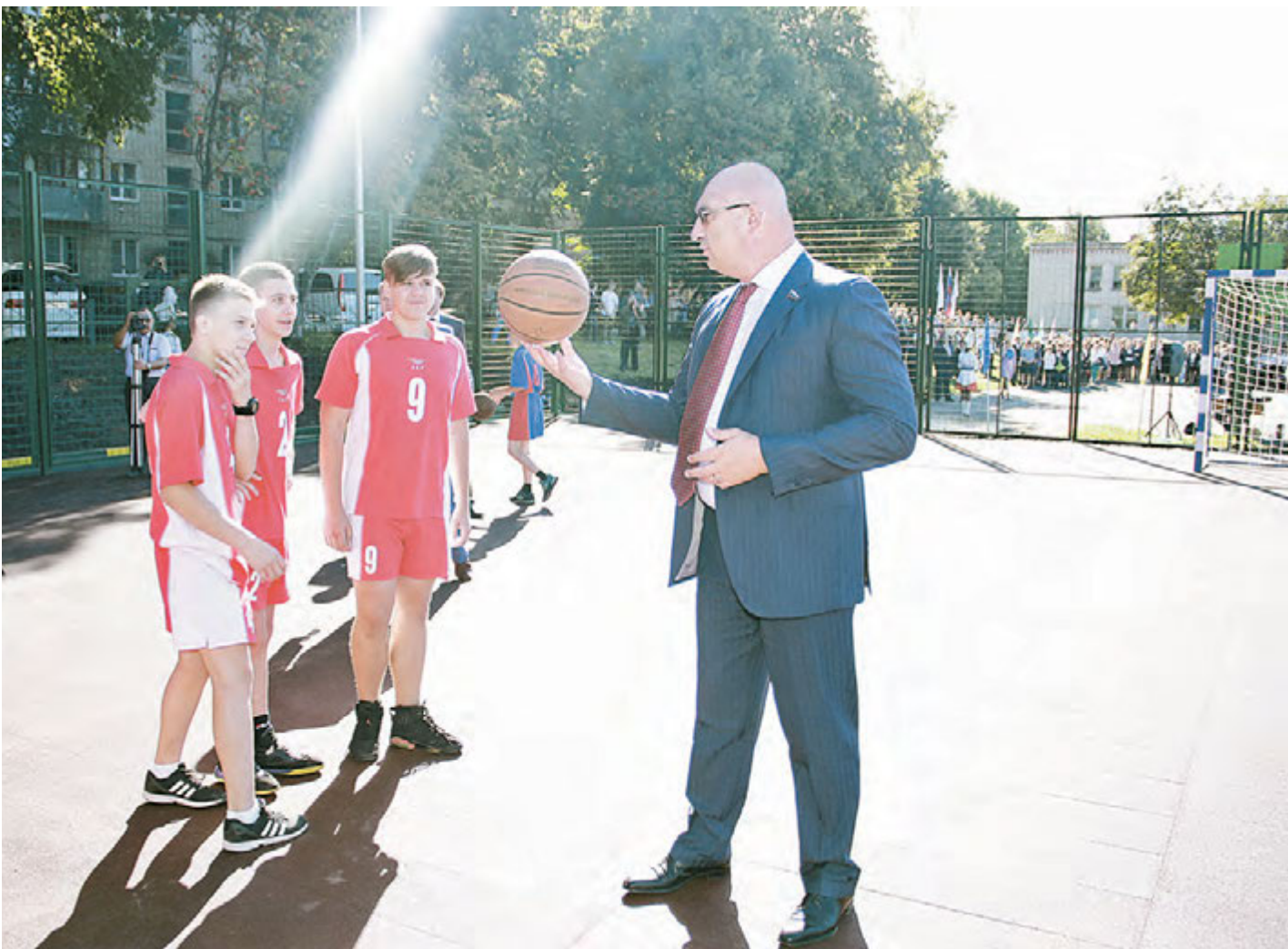
Генеральный директор Металлоинвеста - автор первой подачи на новой спортивной площадке

В День знаний в школе № 3 открыли спортивную площадку, в лицее № 12 первоклассники сели за новые парты, а старшеклассники получили новое лабораторное оборудование.