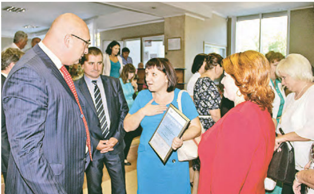
Педагоги города знают, что руководителю Металлоинвеста хорошо знакомы вопросы учительства, поэтому общение с ним получилось содержательным

Во Дворце культуры Михайловского ГОКа состоялся традиционный большой августовский педсовет.