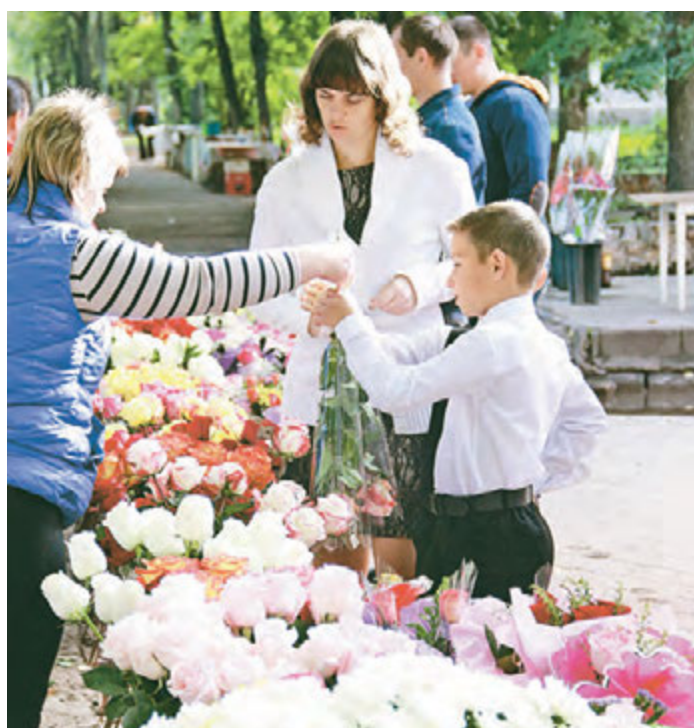
Красивые цветы для любимой учительницы

Главной мелодией дня в России стал школьный звонок. Звенит везде по-разному, но всюду торжественно. Каждый День знаний - особенный. Строгие костюмы, школьные платья, встречи с одноклассниками, банты, новые портфели, тетради... Школьная жизнь вновь закружила девочек и мальчишек. Как всегда, на торжественной линейке, главными участниками были первоклассники и будущие выпускники. Вчерашние детсадовцы старались соответствовать статусу школьника, но в одночасье стать взрослыми так и не смогли. В итоге кто-то устал опустить вниз массивный букет, кто-то стал зевать. Но были и те, кто в толпе родителей и гостей