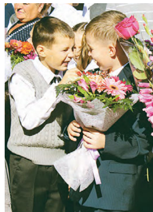
Столько веселых секретов за лето накопилось...

От всего педагогического коллектива школы №3 благодарю компанию «Металлоинвест» за внимание к нашим просьбам, за помощь в решении наших проблем, и отдельное спасибо за столь необходимый и нужный подарок - новую спортивную площадку.