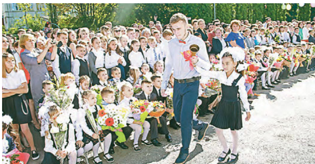
Звенит первый звонок - новый учебный год вступил в силу