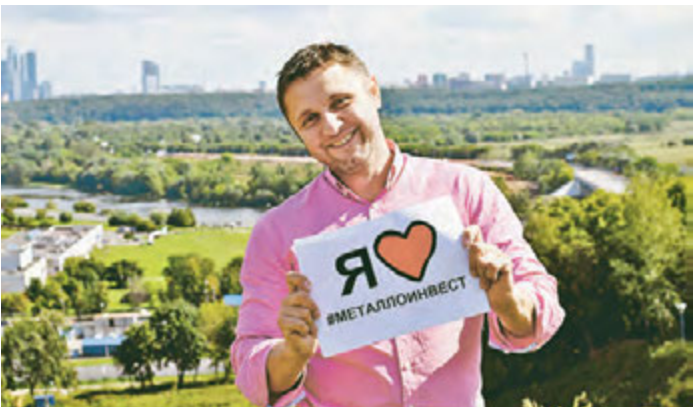
Любители фотографии - этот конкурс для вас!

Работы принимаются с 25 августа 2016 года до 25 сентября 2016 года. Результаты будут объявлены в период с 27 по 30 сентября 2016 года.