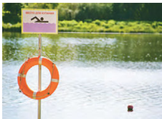
Купальный сезон официально завершён

1 сентября во всех регионах страны начало работу Российское движение школьников. Эта новая общенациональная детско-юношеская организация создана при участии Президента РФ Владимира Путина. Возглавил РДШ космонавт Сергей Рязанский. «Наше движение абсолютно вне политики. Это воспитание в правильной системе ценностей», - пояснил Рязанский. Социологические исследования, которые проводили с экспертами, с лидерами образования, с общественными организациями, родителями и школьниками, помогли определить направления деятельности РДШ - это и волонтерская работа, и краеведение, экологическая работа, работа со СМИ и многое другое. В будущем деятельность Российского движения школьников будет осуществляться во всех общеобразовательных организациях. А пока в нашем регионе представительства Российского движения школьников появились в пилотной десятке школ. В число пилотных школ Курской области вошла и гимназия № 1 г. Железногорска. Сертификаты, подтверждающие включение первой десятки курских школ в Российское движение школьников, вручены 1 сентября на торжественных линейках, посвященных Дню знаний.