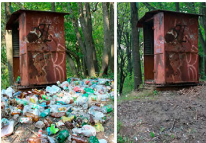
Магия, доступная каждому!

Ж елезногорские активисты стали первыми в нашей области, кто выбрал такой нестандартный подход к борьбе с мусором на природе. Что же такое #МемыВЛес? Это уборки зеленых территорий от мусора с применением креативной соцрекламы в стиле интернет-мемов. Акция реализуется проектом #РосЭко общественной организации «Лига здоровья нации», находящейся под патронажем Лео Бокерии. На страницах «Курской руды» мы поднимали тему замусоренности лесов, связывались с представителями администрации, где нам посоветовали «взять и самим убрать»... Что ж, дело сделано! Мы связались с «роскозовцами» и организовали креативный субботник совместно с участниками соцпроектов