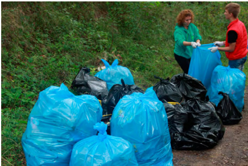
Со свалкой расправились быстро

31 августа «Курская руда» вместе с победителями конкурса «Сделаем вместе!» участвовали во всероссийской экологической акции #МемыВЛес.