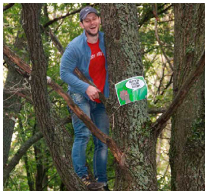
Мемы крепятся выше человеческого роста и на веревочках, чтобы не повредить деревья

Ж елезногорские активисты стали первыми в нашей области, кто выбрал такой нестандартный подход к борьбе с мусором на природе. Что же такое #МемыВЛес? Это уборки зеленых территорий от мусора с применением креативной соцрекламы в стиле интернет-мемов. Акция реализуется проектом #РосЭко общественной организации «Лига здоровья нации», находящейся под патронажем Лео Бокерии. На страницах «Курской руды» мы поднимали тему замусоренности лесов, связывались с представителями администрации, где нам посоветовали «взять и самим убрать»... Что ж, дело сделано! Мы связались с «роскозовцами» и организовали креативный субботник совместно с участниками соцпроектов