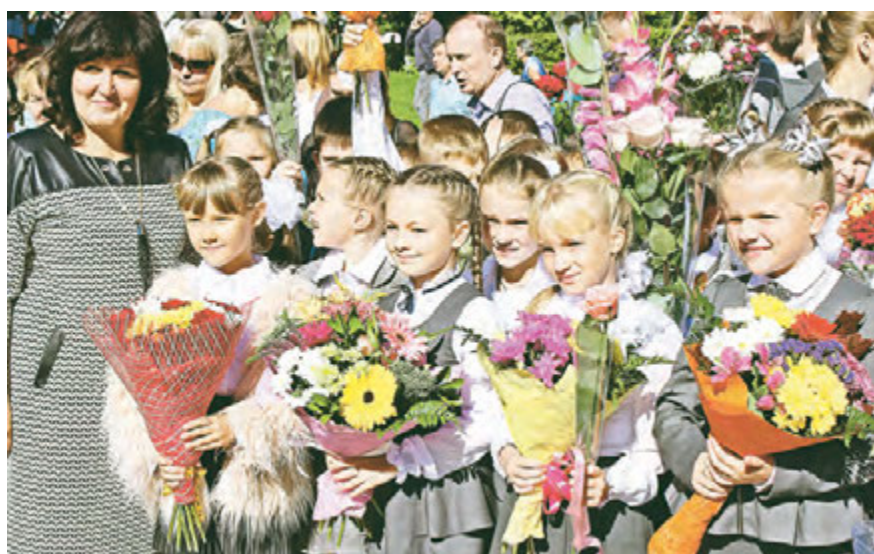
Торжественная линейка в День знаний - и дисциплинирует, и трогает душу

Юлия Ханина