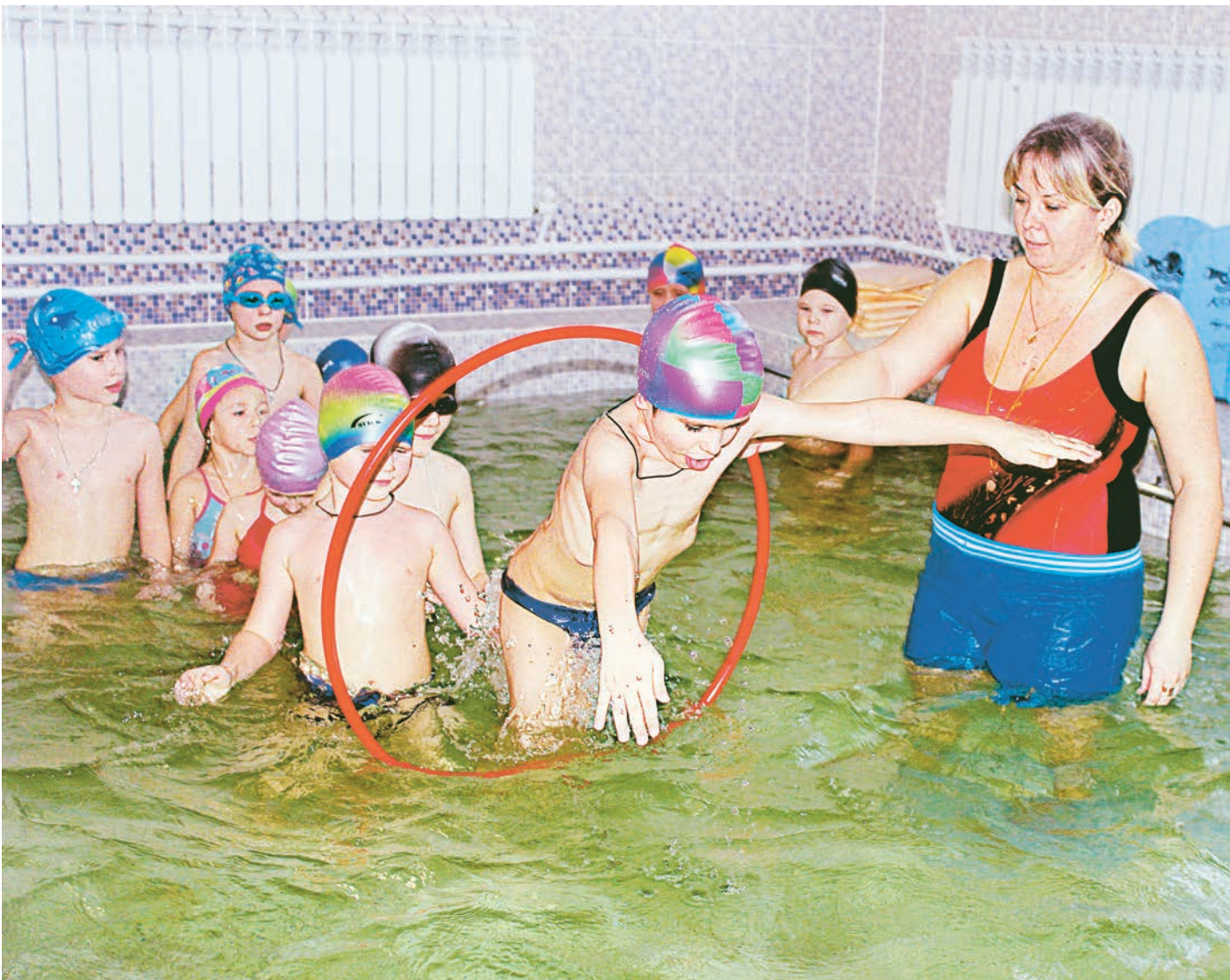
Тренировка и вода - здоровья лучшие друзья

После капитального ремонта в детском саду № 24 открылся бассейн. Отпраздновать событие, благодаря программе «Здоровый ребенок», собралось более полусотни гостей.