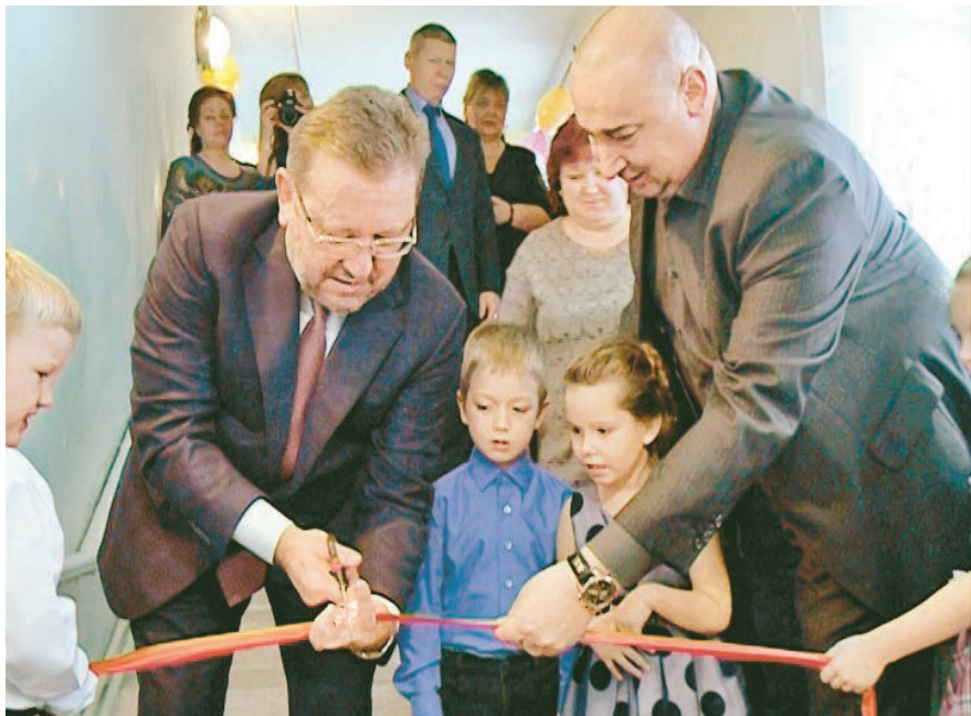
Руководители МГОКа и города на открытии бас- сейна в детском саду №24