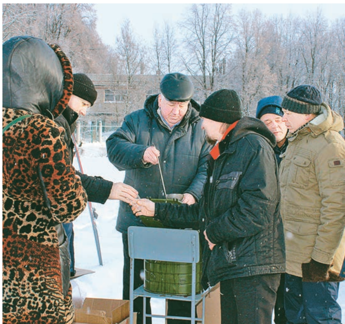
Спортсмены и гости могли согреться горячим чаем от профкома МГОКа