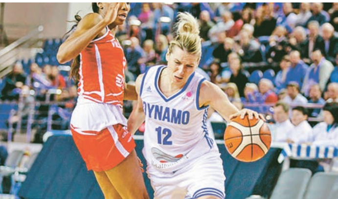
«Динамо» преградило путь «Лиллю» в четверку лучших клубов Евролиги

всего одно очко – 19:18. К большому перерыву «Динамо» сумело несколько оторваться от «Лилля», поведя в счете с разницей в 5 очков – 33:28. А в третьей четверти хозяйки площадки