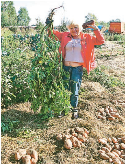
В этом году картофель вырос очень крупным

Картофель один из любимых культур в выращивании растений. Вырастить свою картошку, вкусную, рассыпчатую, без применения химии, не копая огород, а еще и урожай получить такой, чтобы хватило на три семьи до нового урожая – задача очень интересная.