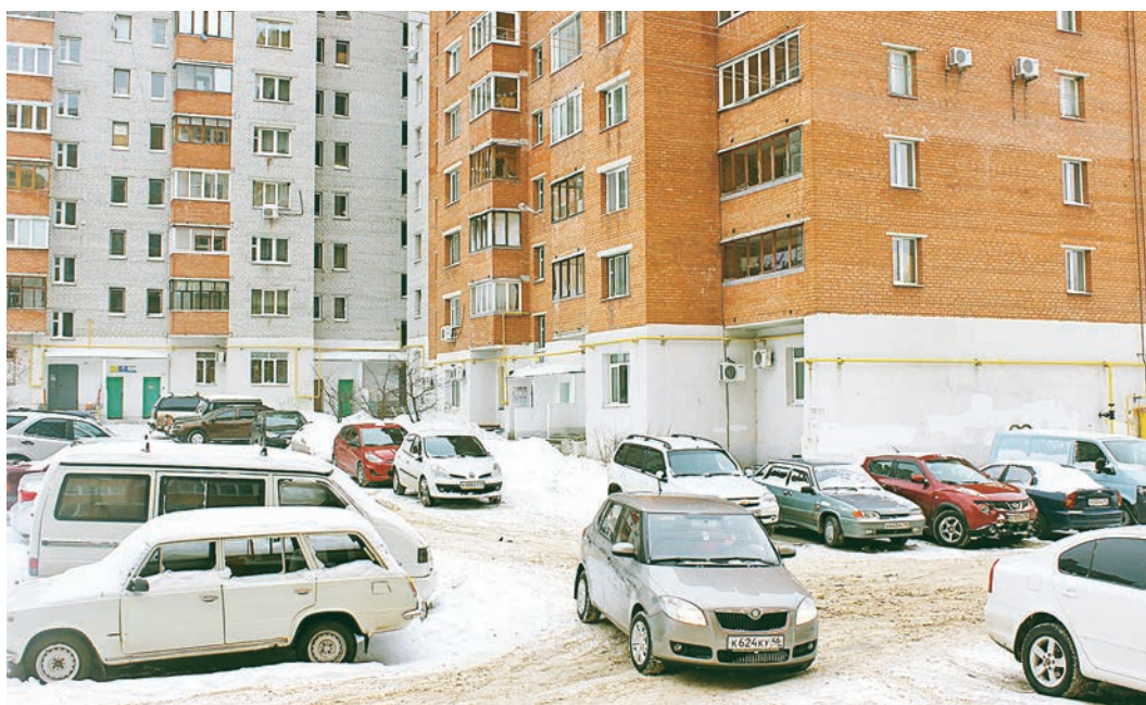
Вот так выглядит теперь двор напротив бывшей стоянки