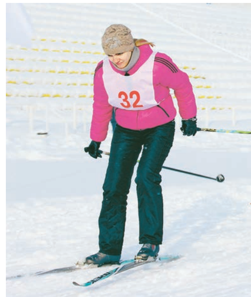
Легко и быстро стартуют лыжницы команды ЗРГО