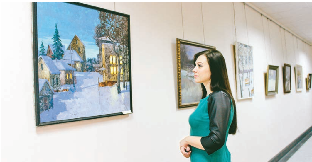
Картины курских мастеров кисти колоритны и ярки. В их центре – человек и родная природа