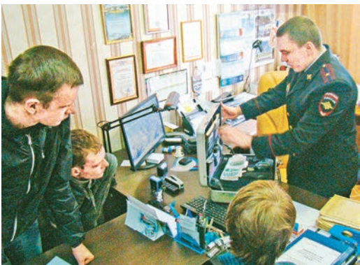
Таковыми чемоданчиками «вооружены» криминалисты

В этом году он будет проходить с 1 по 17 февраля. Принять участие в конкурсе могут представители работающей молодёжи в возрасте до 35 лет по номинациям: «Музыка» (вокал эстрадный, вокал народный, вокал академический, авторская песня, инструментальная музыка, ВИА, РЭП, Битбокс); «Хореография» (танец народный, танец бальный, танец эстрадный, танец современный, микс-танец); «Театр» (любительский театры, художественное слово); «Оригинальный жанр» (молодёжная мода, цирковое искусство). Также состоится заочный конкурс по номинациям: литературное направление «Духовные традиции Курской области» (эссе, заметки, очерки, стихотворения, рассказы на тему духовно-нравственного воспитания, сохранения православной культуры, истории Храмов Курской области); «Молодой специалист» («Профессиональное мастерство», «Рационализаторская и изобретательская деятельность», «Профориентация», «Социальная активность») и «Приглашение к путешествию» - конкурс видеороликов экскурсионных маршрутов по культурно-историческим и иным привлекательным местам. Обращаться в МУ «Центр молодёжи» по телефону: 2-46-25, по эл. почте: tv1972@list.ru.