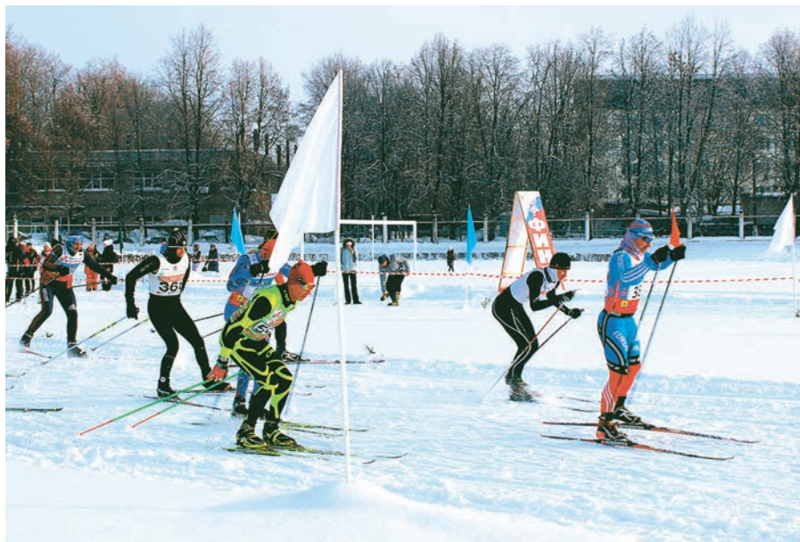
Лучшие лыжники комбината кроме спартакиады МГОКа участвуют ещё и в «Лыжне России»