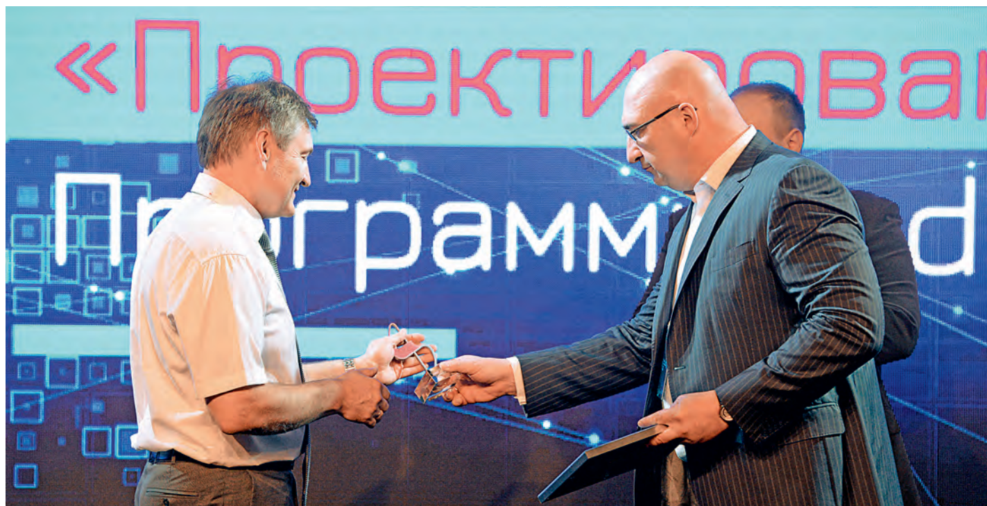
Награды — участникам реализации этапа «Проектирование».