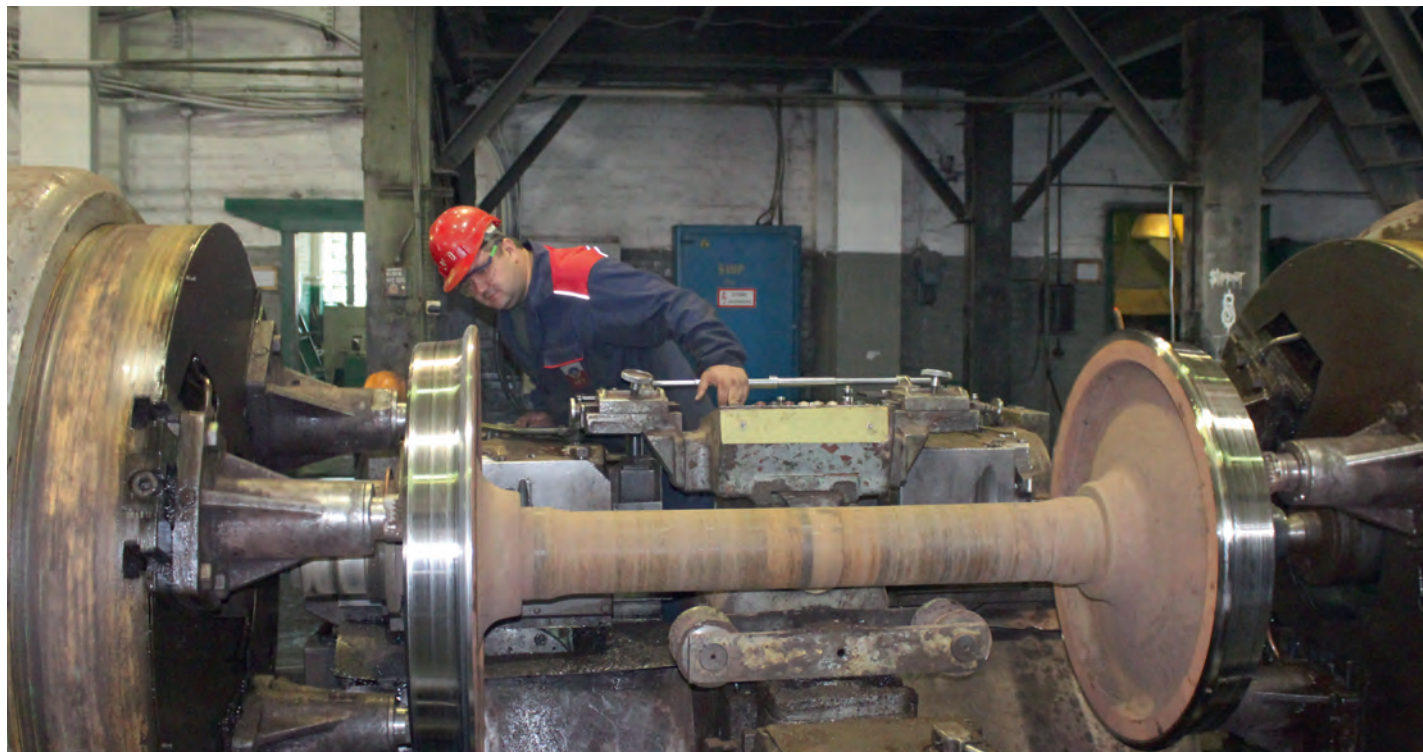
На Михайловском ГОКе успешно выполняют ремонты собственными силами.