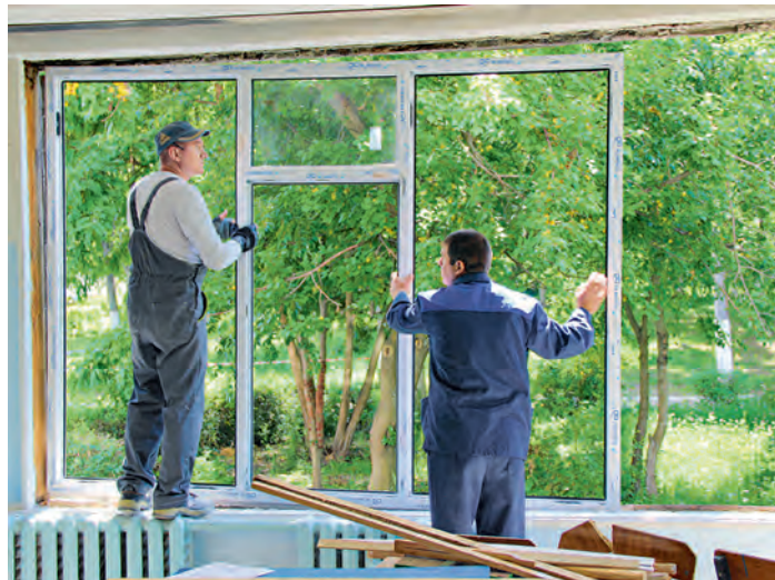
В десяти школах города при поддержке Металлоинвеста меняют окна.