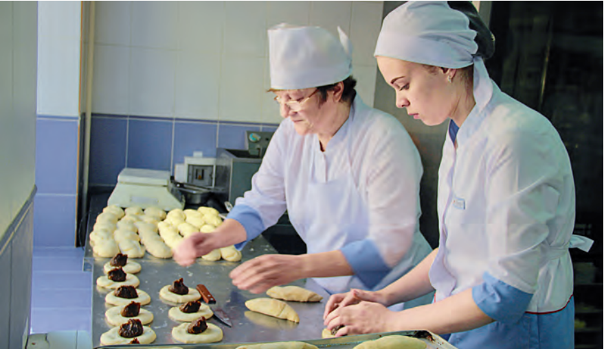
Все блюда работники цеха питания готовят с душой.

Накануне Дня работника торговли девятнадцать лучших сотрудников цеха питания были награждены почётными грамотами, благодарностями и юбилейными медалями Михайловского ГОКа.