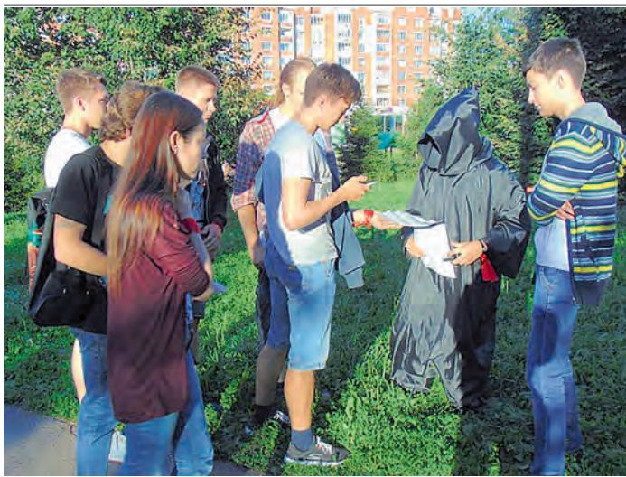
«Лигеры» в чёрных балахонах давали командам подсказки.

Одним из воскресных вечеров горожане могли наблюдать, как группы подростков, споря и жестикулируя, осматривают дома и памятники в центре Железногорска. Эти ребята — участники новой увлекательной игры «Liga+», своеобразного сплава брейн-ринга на краеведческую тематику и городского квеста.