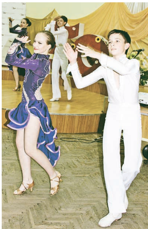
Праздничную атмосферу создавали лучшие творческие коллективы Дворца культуры

П раздник собрал много работников здравницы и гостей - участие в юбилейном вечере приняли представители руководства Металлоинвеста