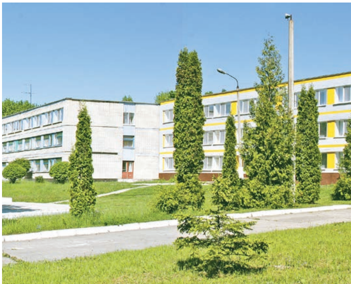
Санаторий по праву считается лучшей здравницей Черноземья