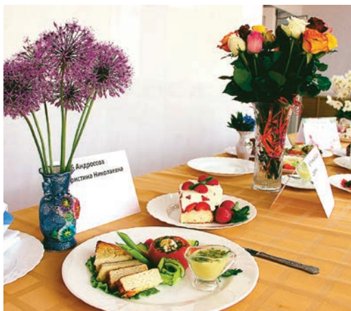
Вкусно и красиво - именно так готовят в столовых комбината

На Михайловском ГОКе прошёл конкурс профессионального мастерства среди поваров.