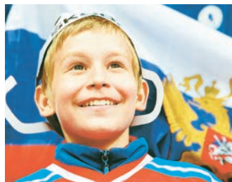
Мечта стала реальностью