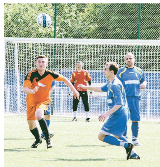
Команда МГОКа бьется за победу на площадках спартакиады

С 25 мая в Старом Осколе проходит VI корпоративная спартакиада компании «Металлоинвест».