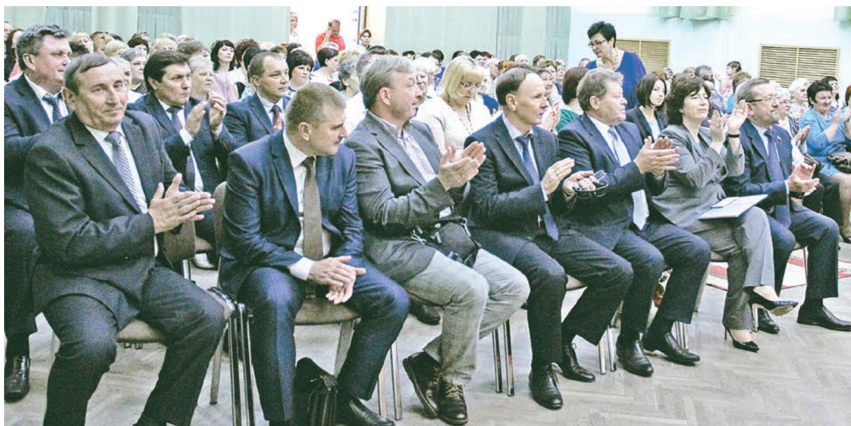
От Москвы до Урала - санаторий поздравляли руководители Компании, МГОКа и Железнодорожска, коллеги из города и других медучреждений Металлоинвеста