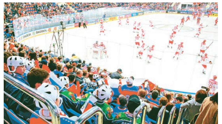
Этот матч стал самым ярким и впечатляющим

любимый игрок был лучшим на этой игре. Замечательно, что ребята запомнили не только тех, кто забивал, но и тех, кто отдавал передачи, срывал атаки соперников. Да, эта поездка на чемпионат мира, наверняка, станет стимулом в их спортивной жизни.