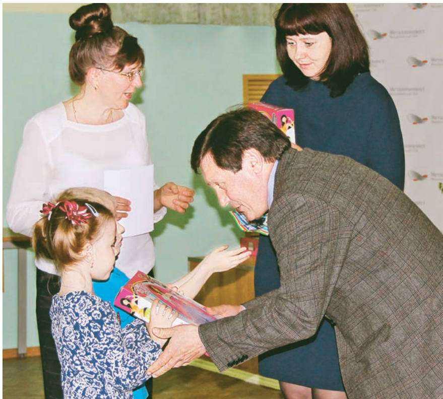
Маленькие победители радостно принимали награды

26 мая в дискозале Дворца культуры наградили победителей детского творческого конкурса «Жемчужина КМА». Юные таланты Железнодорожского получили дипломы и подарки от компании «Металлоинвест».