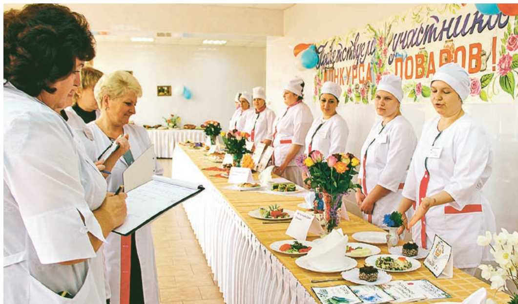
Пожалуй, когда-нибудь цех питания МГОКа точно попадет в знаменитый Красный гид Мишлен

«Главное в конкурсе - приобретённый опыт», - говорили все участники