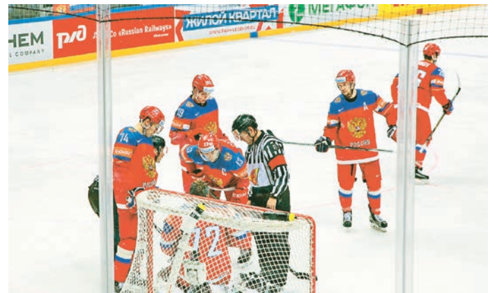
Лучший обзор – с мест, где сидели наши ребята

просто невероятная! И правда, сборная России разгромила Данию со счетом 10:1. Эта победа по праву названа самой крупной и зрелищной победой чемпионата. Всю обратную дорогу ребята обсуждали игру сборной России, утверждая, что именно их