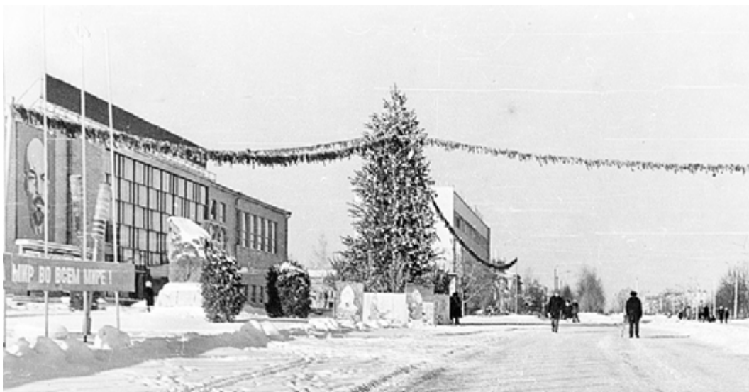
Изначально праздничная городская ёлка стояла напротив Дворца культуры Михайловского ГОКа.

Приложение позволяет любому гражданину, заметившему нарушение охраны труда на строительной площадке, угрожающее жизни и здоровью работников, зафиксировать его на свой телефон и сообщить об этом в Роструд. Приложение размещено на площадках наиболее популярных магазинов приложений для смартфонов («Google Play» и «App Store»). Данное приложение интегрировано с уже успешно функционирующим на портале «Онлайнинспекция.рф» сервисом «Сообщить о проблеме». Обращение гражданина и фото, в том числе информационного щита застройщика, будут направляться на рассмотрение в территориальный орган Роструда в регионе. При наличии соответствующих оснований будет инициироваться проверка изложенных в обращении фактов, приниматься меры по устранению выявленных нарушений и привлечению виновных в них лиц к ответственности. В ходе разработки приложения Рострудом были проанализированы наиболее травмоопасные нарушения и выбраны те, которые может заметить гражданин, не являющийся работником и не находящийся непосредственно на стройке. На первом этапе работы приложения планируется провести кампанию по выявлению и устранению таких нарушений как отсутствие у работников касок при проведении строительных работ, работа на высоте без защитных ограждений и страховки, а также отсутствие ограждений строительных площадок.