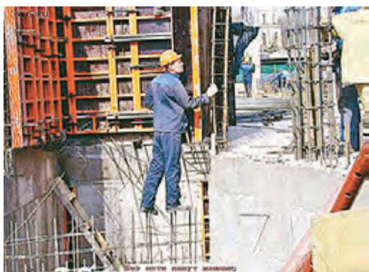
Любой человек сможет зафиксировать нарушения

Текст соответствующего постановления размещен на официальном сайте ведомства. Розничная торговля будет приостановлена для всей спиртосодержащей непищевой продукции, за исключением парфюмерии и стеклоомывающих жидкостей. Ранее сообщалось, что премьер-министр РФ Дмитрий Медведев поручил главе Роспотребнадзора Анне Поповой приостановить реализацию непищевой продукции с содержанием алкоголя свыше 25 градусов на срок до 30 дней. Между тем, спиртосодержащими являются лекарственные препараты, без которых во многих семьях не обойтись – йод, зеленка, валокордин. В железнодорожных аптеках эти медикаменты пока продаются свободно. За 9 месяцев 2016 года, по данным Курскстата, в результате случайного отравления алкоголем в регионе умерли 63 человека. В прошлом году за аналогичный период было зарегистрировано двадцать восемь смертей. В токсикологию БСМП, ежемесячно с диагнозом «отравление алкогольной продукцией» в среднем попадает около 100 человек. При этом случаев отравления печально известной «Настойкой бо-ярышника для ванн» в Курске не было.