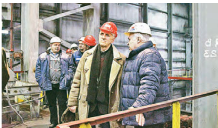
Ветеранов впечатлили размах современного производства.

Михайловском ГОКе достойно продолжают их почин. Многие из тех, кто приехал на экскурсию, не только работали на ФОКе, а еще и участвовали в строительстве первой и второй обжиговых машин.