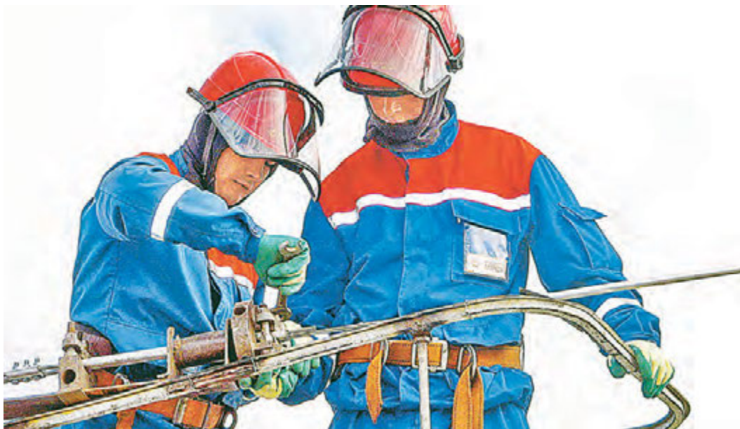
Без энергетиков невозможно представить себе современную жизнь.