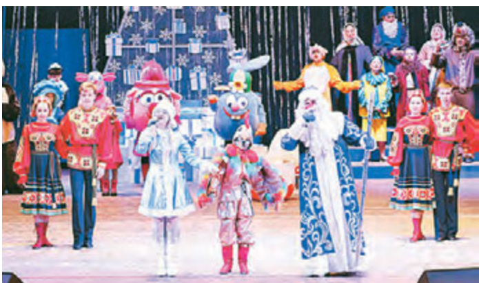
На праздник к детям пришли герои их любимых сказок.

рассказывали стихи и делились своими впечатлениями. Кроме сказки и отличного настроения ребятишки получили и сладкие подарки от компании «Металлоинвест». – Мне очень понравилось