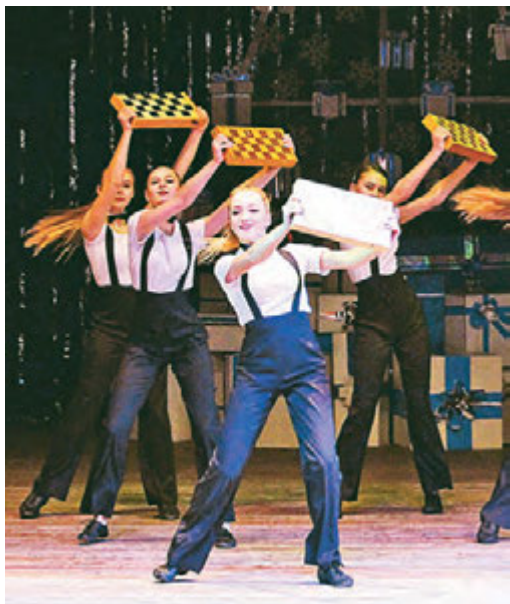
Энергичный танец от артистов балета «Нон-стоп».

Одна из замечательных традиций в коллективе Михайловского ГОКа - в большой, праздничной обстановке подводить итоги прошедшего года.