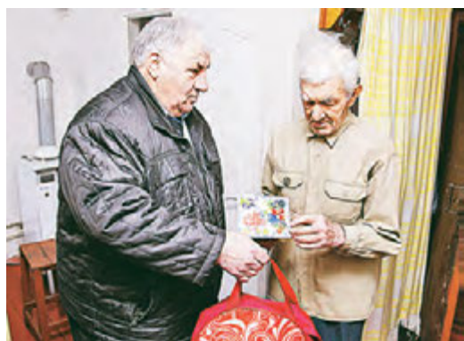
Дарить ветеранам подарки - традиция МГОКа.

Ключи от новеньких квартир получили 24 жителя Железногорска, 11- Железногорского района, 8 – других районов области. Жилье выдали на договорных обязательствах, оно будет принадлежать специализированному жилищному фонду Курской области. А через пять лет с сиротами заключат бессрочный договор на проживание. Все квартиры площадью от 36,9 до 37,8 кв.м. расположены по улице Батова, дома №2 и №4. Администрация города подарила всем ребятам теплые одеяла, а компания застройщика – бытовую технику - мультиварки. Выделение квартир гражданам из числа детей-сирот и детей, оставшихся без попечения родителей, осуществляется в рамках подпрограммы «Выполнение государственных обязательств по обеспечению жильем категории граждан, установленных Федеральным законом «О дополнительных гарантиях по социальной поддержке детей - сирот и детей, оставшихся без попечения родителей» государственной программы Курской области «Обеспечение доступным и комфортным жильем и коммунальными услугами граждан в Курской области». В Железногорске для этой категории граждан с 2007 года уже выделено 209 квартир.