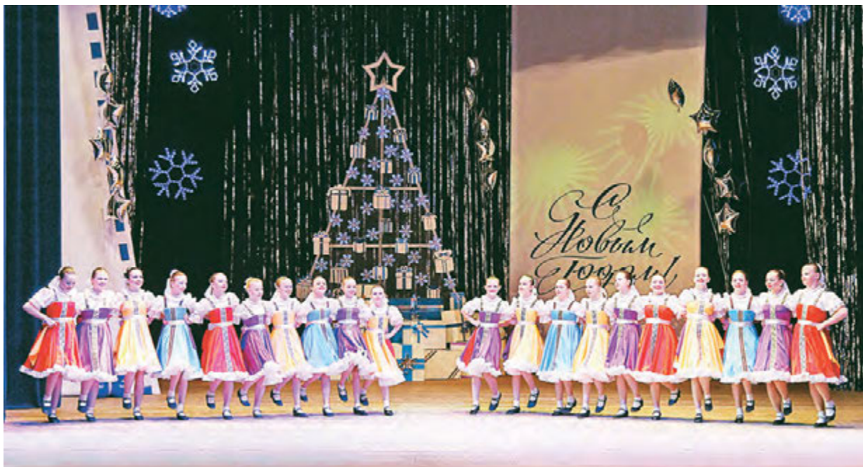
Веселые танцы и красочные костюмы юных артистов Дворца культуры подняли настроение зрителям.