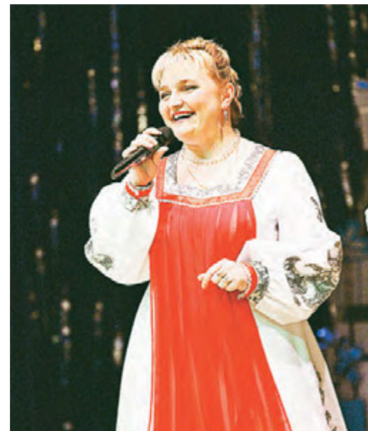
Народная песня молода и любима во все времена.