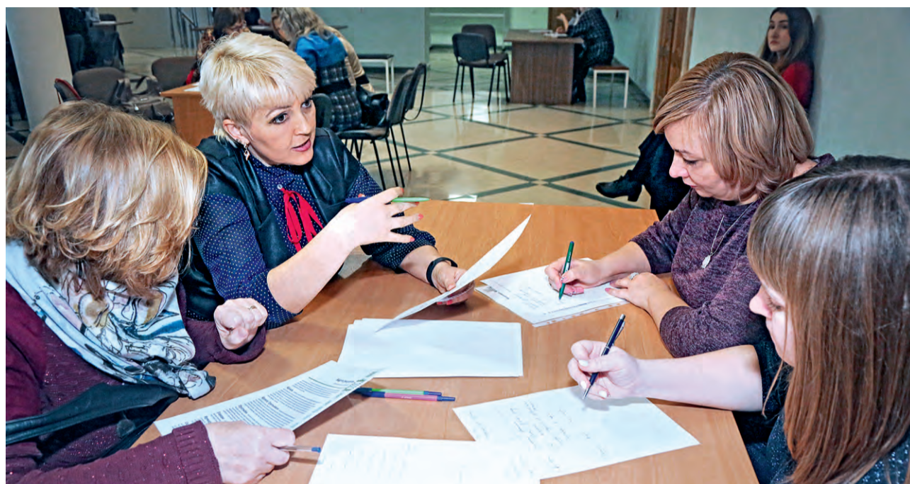
▲ В связи с условиями, сложившимися из-за пандемии коронавируса, работа с участниками программы пока будет идти не в привычном формате, а онлайн

В рамках программы «Сделаем вместе!» в 2020 году продолжится активное продвижение ценностей добровольчества и реализация волонтерских проектов номинации «Откликнись!», а также проектов таких направлений, как «Город для жизни» и «Город-сад», которые призваны совершен-