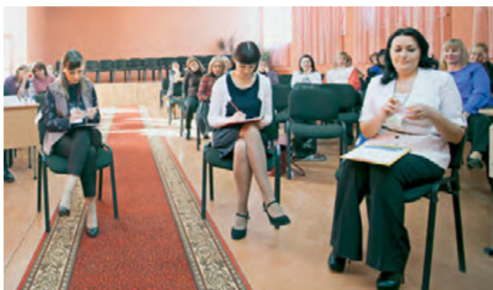
Конкурсантки выполняют очередное задание.