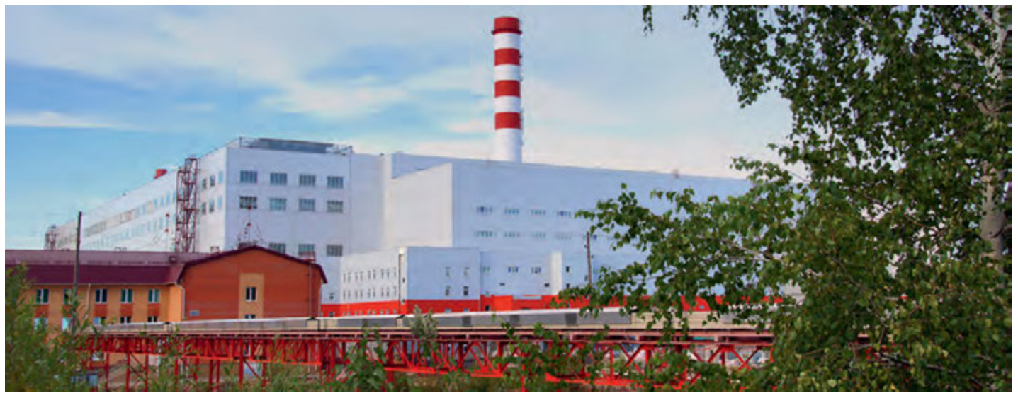
Выход на проектную мощность обжиговой машины №3 позволил МГОКу достичь рекордного объема производства окатышей.