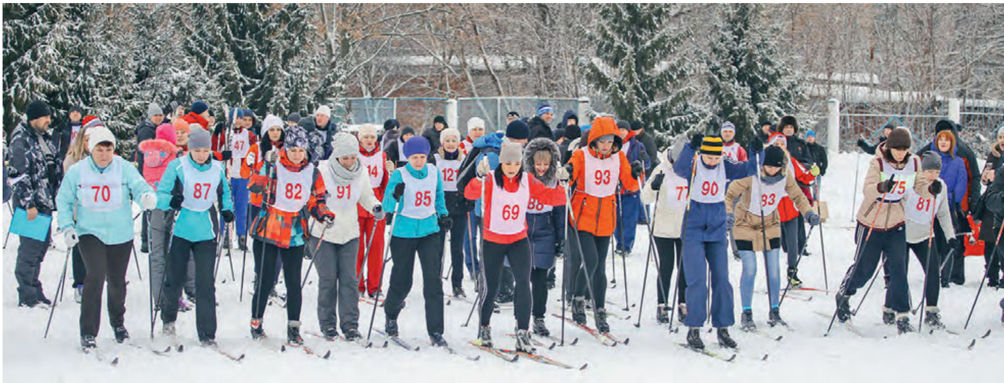
Лыжные гонки - один из любимых зимних видов спорта работников Михайловского ГОКа.

Меньше недели осталось до того момента, когда на железнгорской земле откроется Первая зимняя корпоративная спартакиада Металлоинвеста.