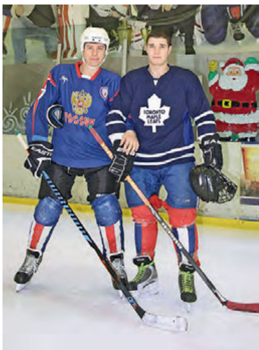
На льду - хоккеисты ОЭМК.

Хороший настрой - полдела, но соперники тоже не сидят сложа руки. Готовясь к спартакиаде, спортивные дружины ОЭМК и ЛГОКа провели дружеский турнир на льду в