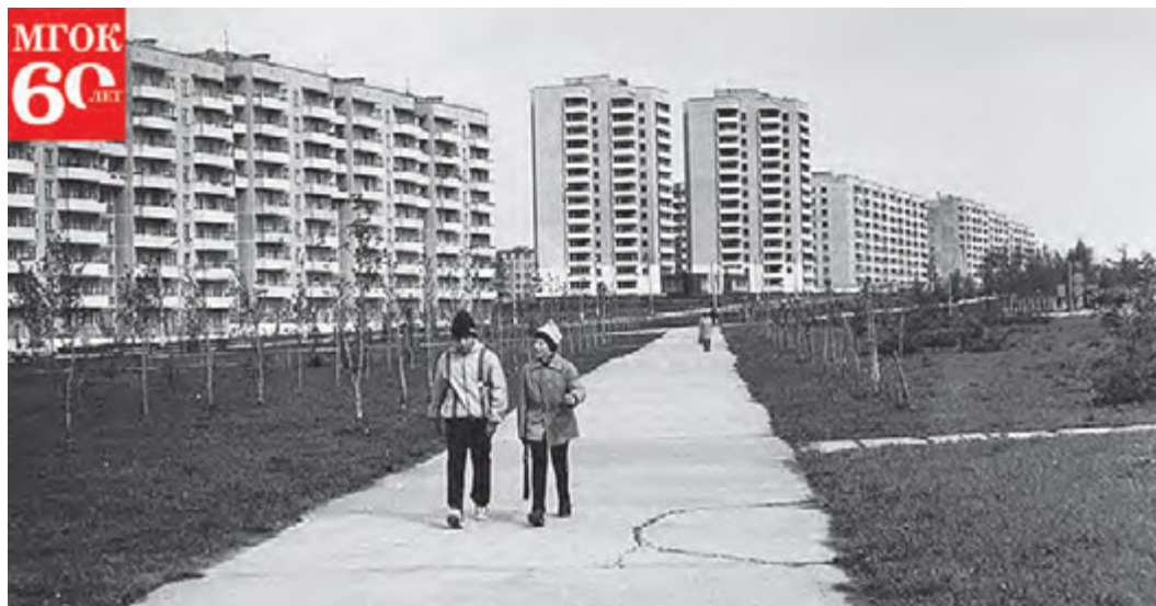
В 60-е годы здесь планировали построить «Бульвар имени 60-летия СССР»