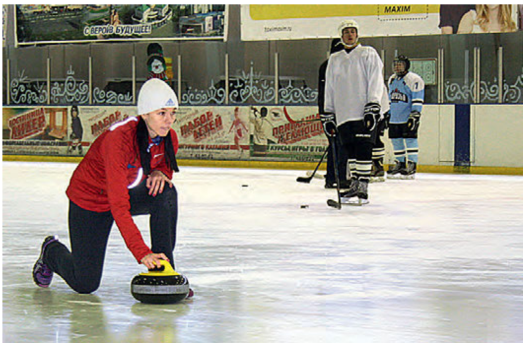
Керлингистки ОЭМК тренируют глазомер и твердость руки.