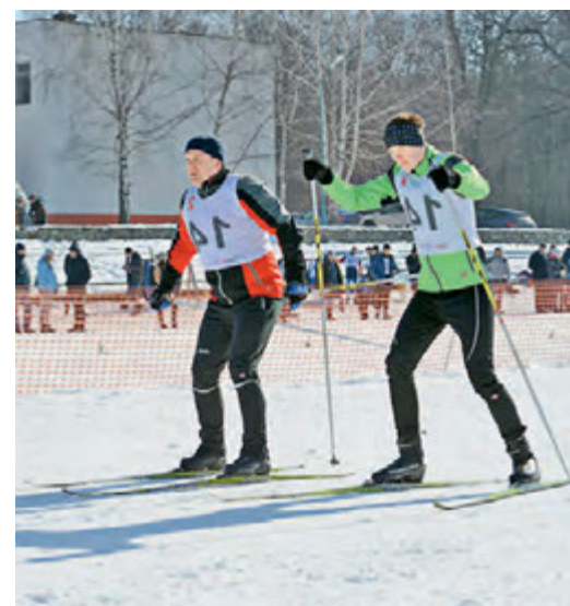
ЛГОК: из лыжников в биатлонисты.