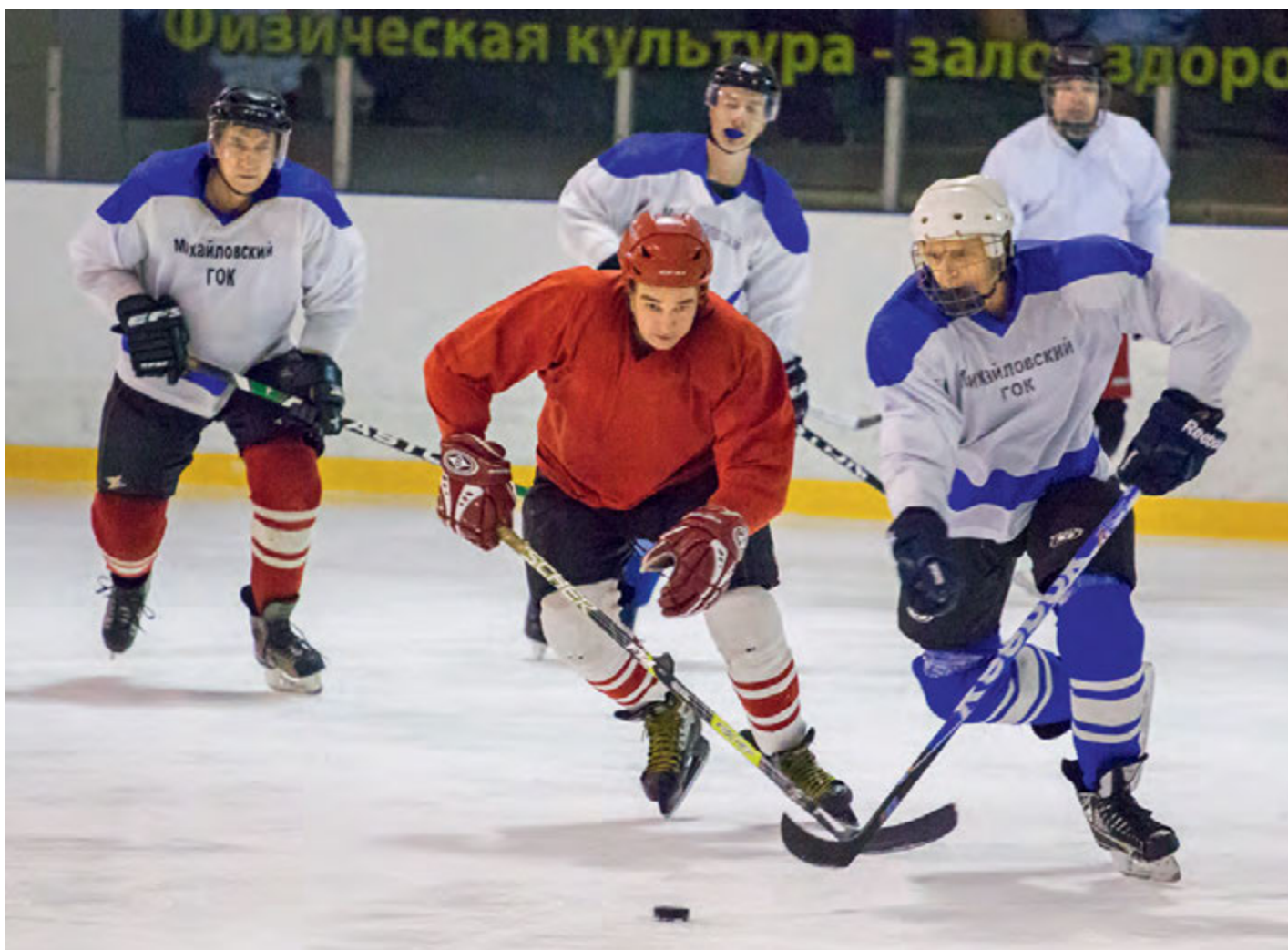
Хоккейный клуб Михайловского ГОКа настроен на победу в зимней корпоративной спартакиаде.

Меньше недели осталось до того момента, когда на железногорской земле торжественные звуки фанфар откроют Первую зимнюю корпоративную спартакиаду Металлоинвеста.