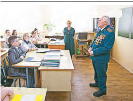
Ветераны войны - в гостях у школьников.

Кроме того, будет внедрена электронная система оценки качества обслуживания пассажиров.