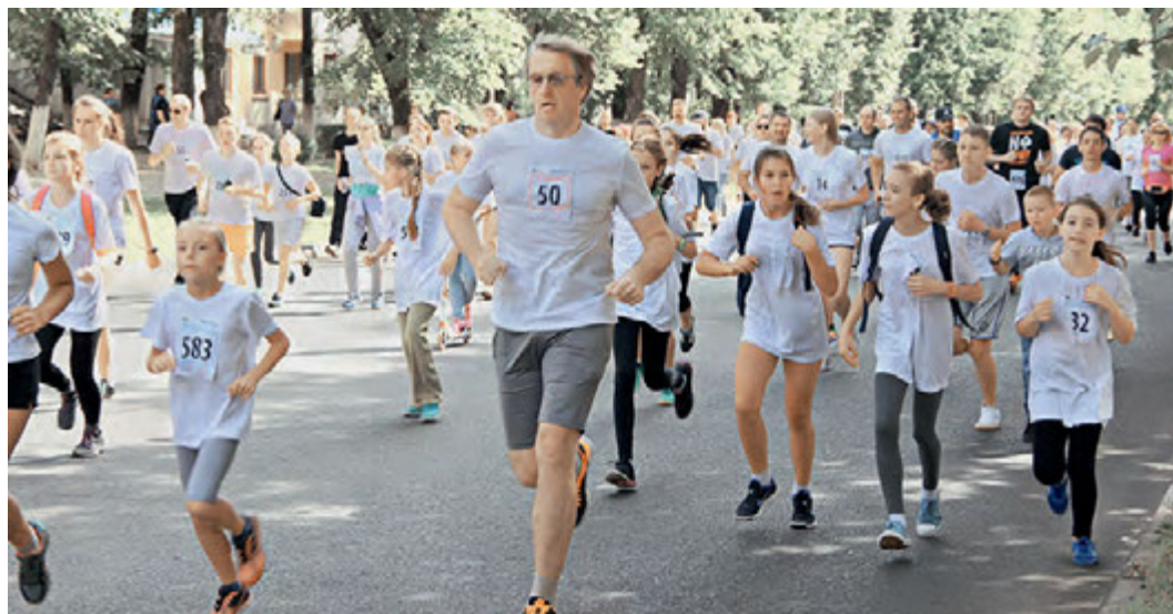
Акция #ВСЕНАСПОРТ отмечена как одно из самых масштабных мероприятий 2016 года.