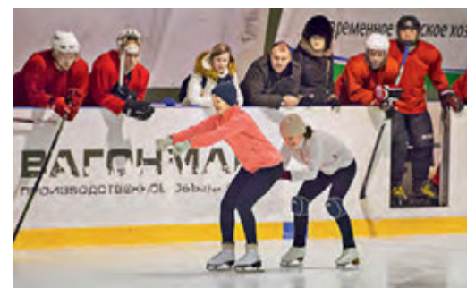
Железнодорожские конькобежцы готовятся к стартам.