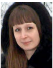
Анастасия молодая мама

Я один раз пользовался «Госуслугами», чтобы получить талон к врачу. Пока вводил данные и ждал, когда перестанет глючить портал, хотел уже выключить компьютер и записаться на прием обычным способом. Талон я, в конце концов, получил, но сколько нервов потратил! Надеюсь, разработчики сайта исправят его недочеты. Задумка-то с электронной очередью, по сути, отличная.