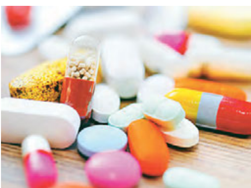
При лечении боли лучше избегать инъекций