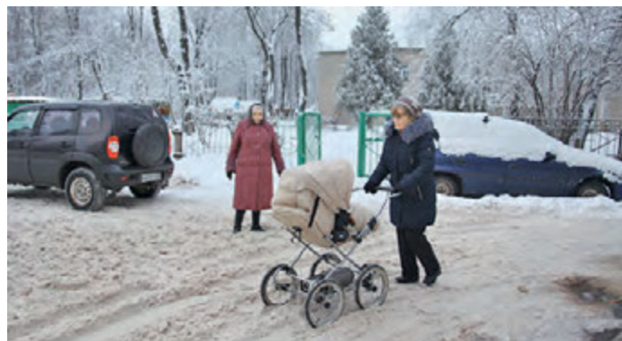
Пока УК и ТСЖ не уберут снег, горожане будут преодолевать сугробы.