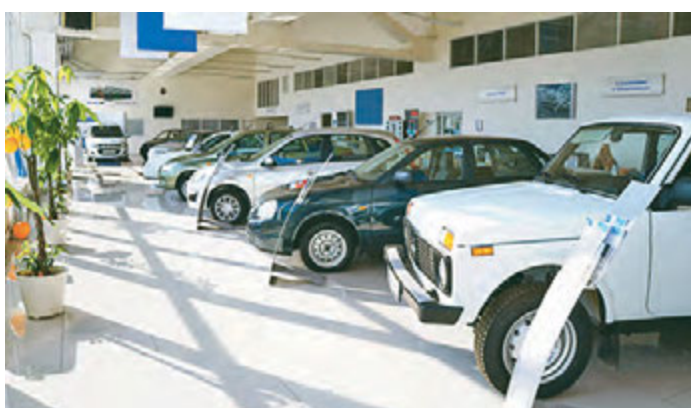
Теперь за льготный кредит можно приобретать автомобили подороже

нынешнем или прошлом году. Скидка на автокредит составит 6,7 процентных пунктов, при этом сам кредит нужно будет выплатить не более, чем за три года при 20-процентном первом взносе.