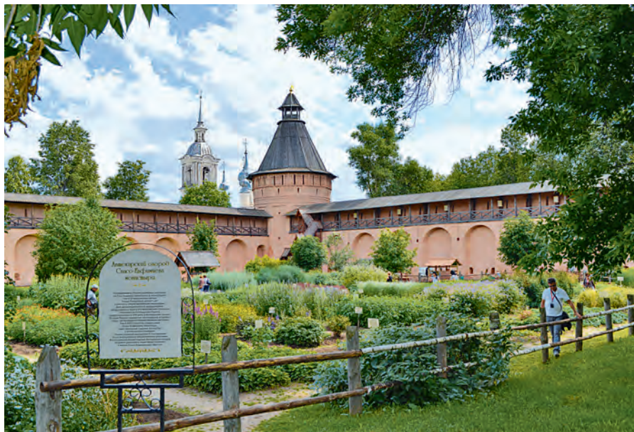
Аптекарский огород на территории Спасо-Ефимьева монастыря.