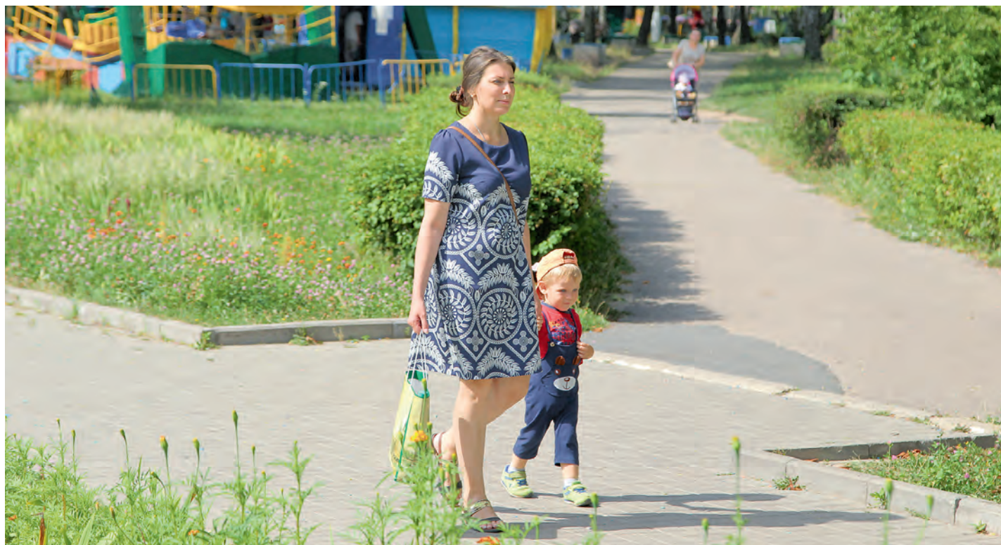
Железнодорожцы могут высказать своё мнение о том, каким они хотят видеть парк.