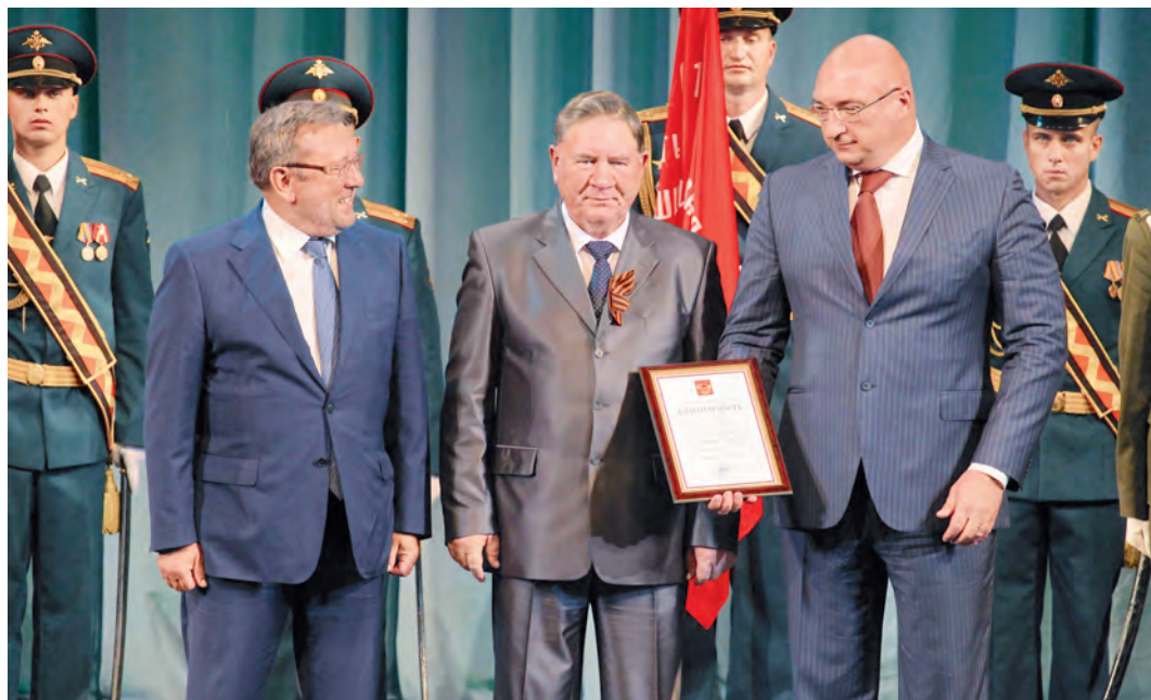
За добросовестный труд коллективу Михайловского ГОКа вручена уже вторая благодарность президента России Владимира Путина. Первой награды комбинат был удостоен в 2007 году.

Коллектив Михайловского ГОКа удостоен благодарности президента РФ Владимира Путина «За достигнутые трудовые успехи и высокие показатели в профессиональной деятельности».