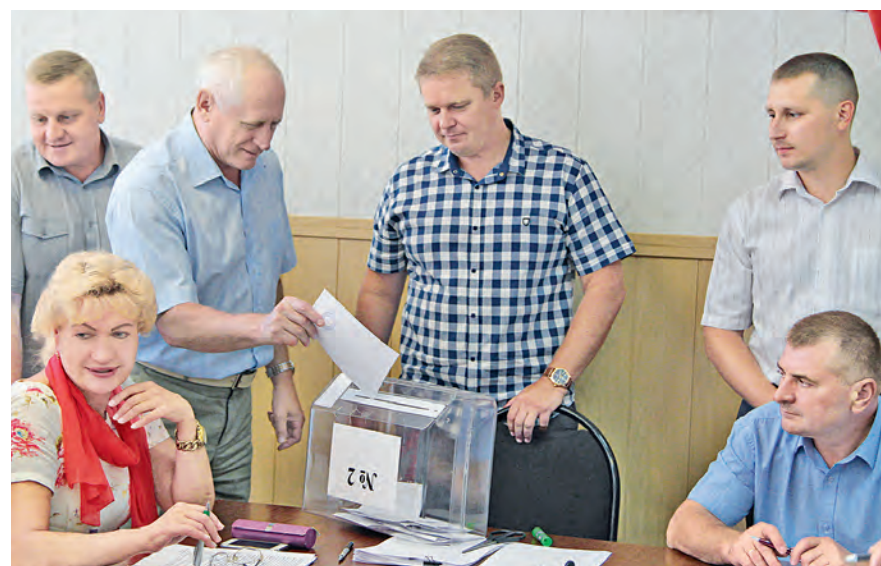
Почётных граждан города депутаты определили путём тайного голосования.

Ольга Богатикова