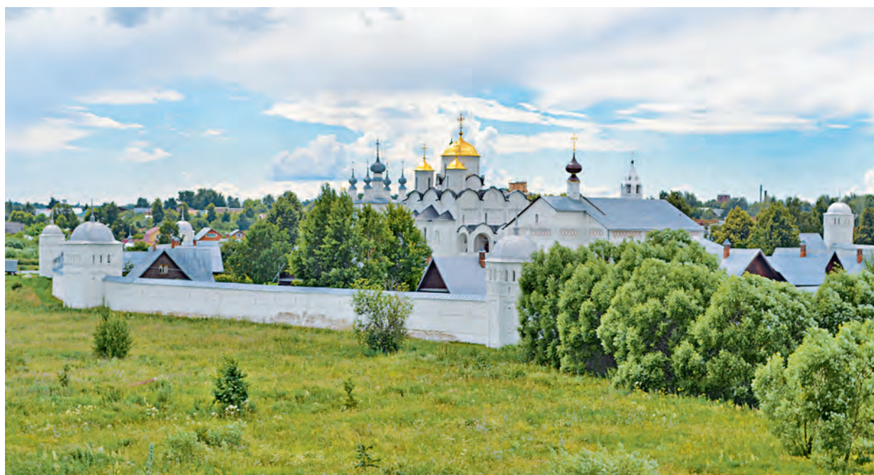
Вид с реки Каменки на Покровский женский монастырь.