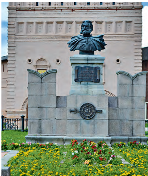
Памятник князю Пожарскому.

Золотое кольцо России – это история, застывшая в камне и дереве. Одной из жемчужин в этом ожерелье прекрасных городов по праву считается Суздаль.