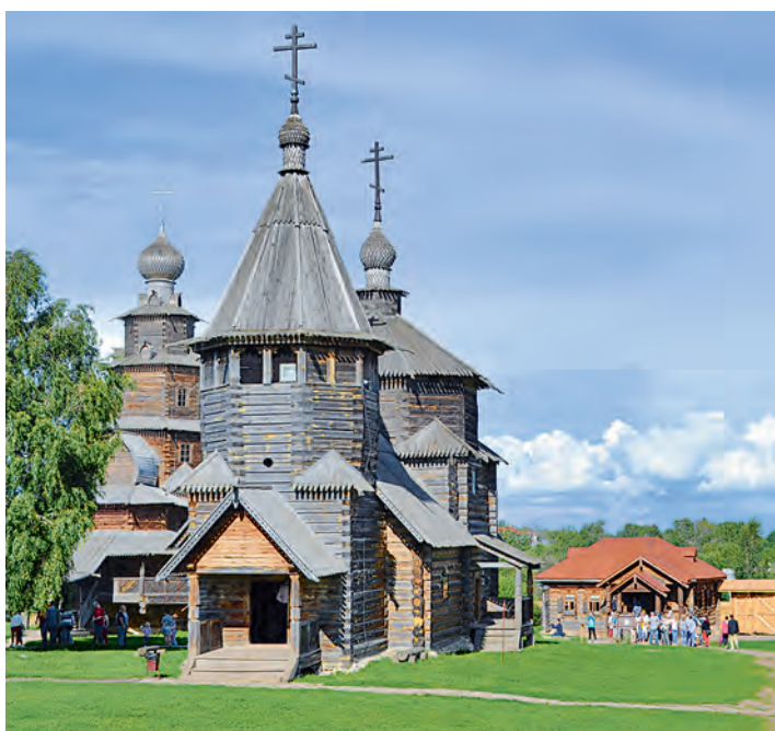
Музей деревянного зодчества всегда посещают толпы туристов.