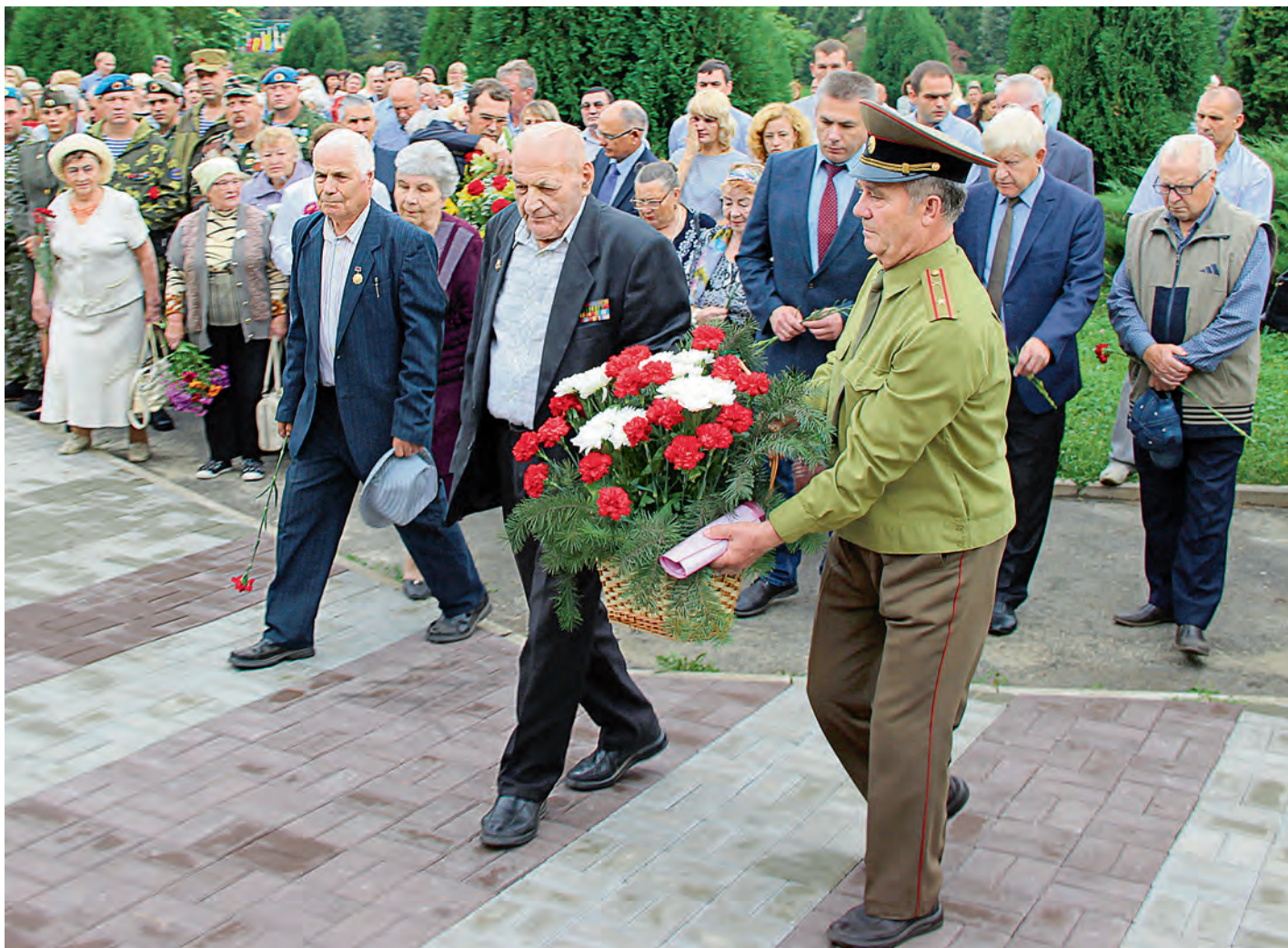
Возложения цветов к памятникам воинской славы прошли по всей Курской области.

В Железнодорожске прошли митинги памяти 74-й годовщины Курской битвы — коренного перелома, изменившего ход Великой Отечественной войны.