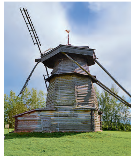
Экспонат музея деревянного зодчества.