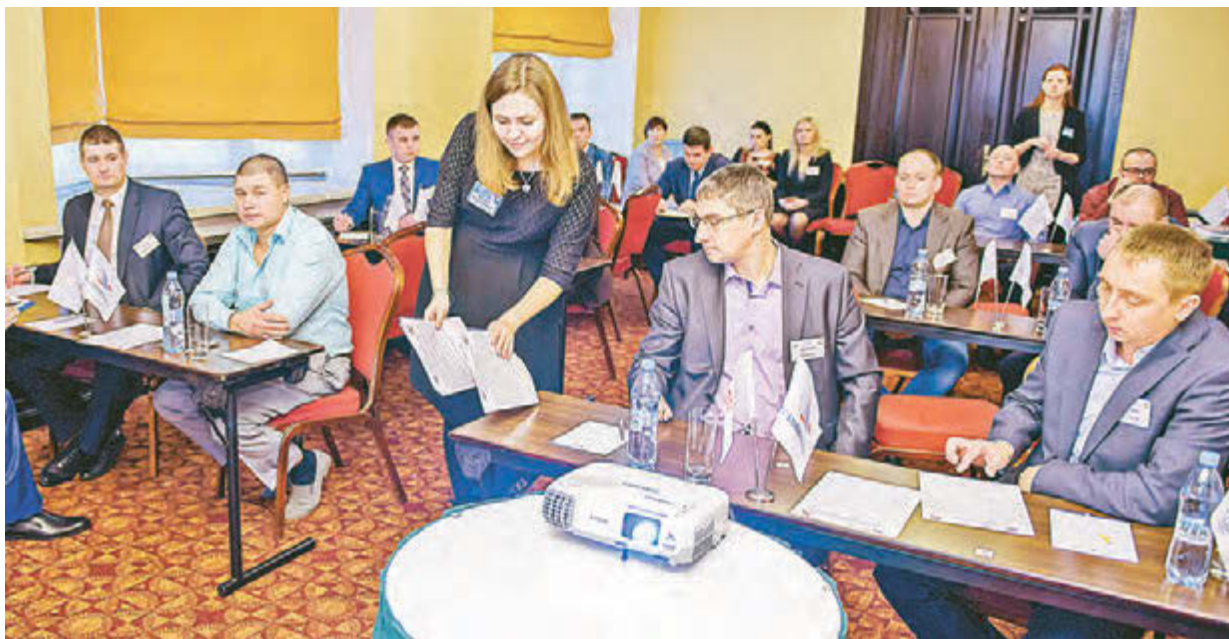
В финале конкурса «Лучший руководитель» его участникам нужно было выполнить по семь сложных заданий и выявить сильнейших управленцев компании.

В Москве 5 декабря прошёл финальный этап первого корпоративного конкурса «Лучший руководитель». В «бой» пошли только самые грамотные и компетентные управленцы среднего звена, а также мастера всех предприятий компании.