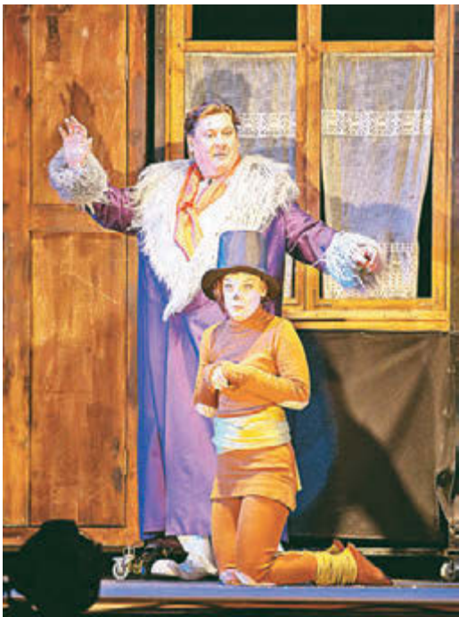
Сначала Каштанка не понимала, чего от нее хотят...

Мы – молодежный театр, – подчеркивает режиссер. – Поэтому знакомство с театральным миром зачастую начинается именно с нас. При этом главная задача – научить юного зрителя понимать язык театра, вызвать у него желание постоянно приходить сюда. Поэтому мы стараемся развиваться в разных направлениях. Например, для качественной постановки мюзиклов мы создали собственный симфонический оркестр. Поскольку действие рассказа разворачивается, по большей части, в цирке, то и в спектакле элементы циркового жанра представлены в полном объеме. Здесь и силачи-акробаты, и веселый клоун, и Пьеро с романсом Алябьева о трагической судьбе «звезды» сцены, и, конечно же, дрессированные зверушки. Образы проработаны буквально до деталей: клоуны натурально «рыдают» шутковскими струями-слезами, у силачей трясутся поджилки, декорации и костюмы – как в подзабытом цирковом балагане. Веселое шутовство