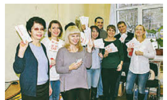
Победители викторины получили билеты на спектакль