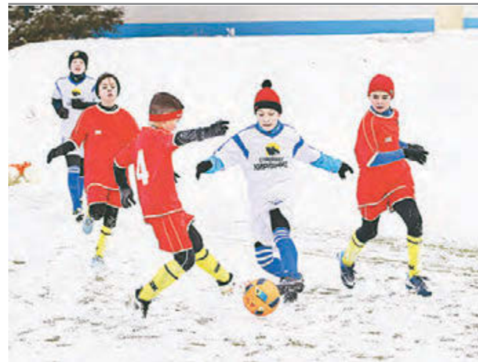
Снег футболу - не помеха!