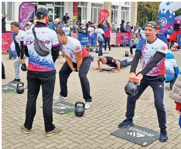
▲ Железнгорцы активно «тестировали» уличную атлетику

В этот день железнгорцы — участники проекта «Академия ГТО», ставшего одним из победителей грантового конкурса Металлоинвеста «Вместе с моим городом!», показали, чему научились за полгода тренировок. Разбившись на группы в зависимости от возраста,