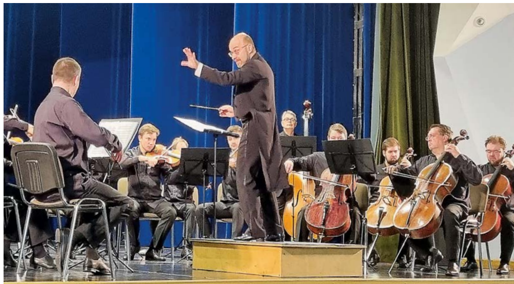
▲ Музыка в исполнении «Виртуозов Москвы» заполнила собой всё пространство, прикоснулась к душе каждого слушателя

Взмах дирижёрской палочки, прикосновение к инструментам — музыка мо-