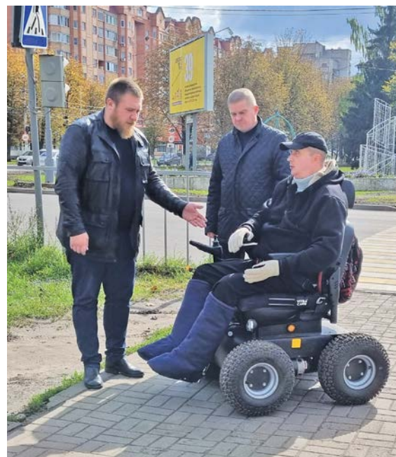
▲ В нынешнем году Металлоинвест направил на реализацию программы создания безбарьерной среды в городе около 550 тысяч рублей