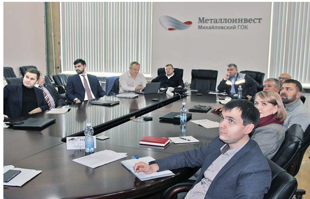
▲ Представители Михайловского ГОКа и эксперты международной компании Tactise обсудили этапы реализации проекта по внедрению рискориентированного подхода на комбинате

— Нам всем предстоит перейти на следующую ступень культуры безопасности — т. е. на работу по предупреждению опасных ситуаций, это позволит нам стать более эффективными. Основная задача — каждый год снижаться в показателях травматизма и повышать безопасность условий труда на производстве, — подчеркнул заместитель генерального директора по промышленной безопасности, охран