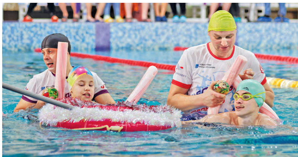
▲ На занятиях все дети научились самостоятельно держаться на воде

Для детей с ограниченными возможностями здоровья провели праздник на воде