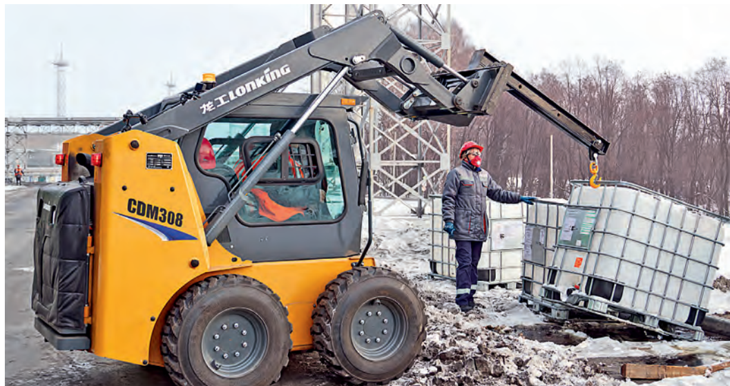
▲ Несмотря на скромные размеры, этот «крепыш» способен решать самые сложные задачи

Все узлы и агрегаты машины расположены так, чтобы быть максимально доступными при проведении сервисного обслуживания.