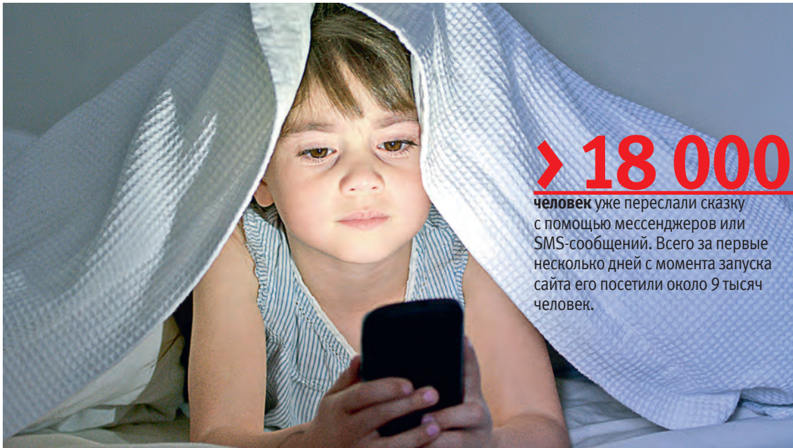
▲ Перед сном малыши услышат сказку, отправленную папой или мамой и прочитанную профессиональным диктором

Пока «Сказки на ночь» — это только шесть оригинальных историй, написанных специально для детей сотрудников