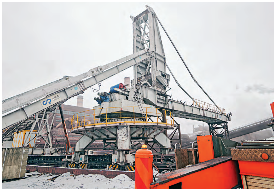
▲ Длина стрелы нового роторного укладчика — 32 метра

тонн окатышей в час — производительность нового роторного укладчика.