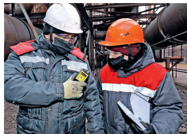
▲ Как и смартфон, газоанализатор на морозе разряжается быстрее