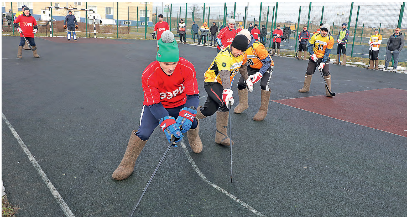
▲ Хоккей в валенках кажется несерьёзной игрой только со стороны

Периодически старооскольцы меряются силами с соперниками по спартакиаде Металлоинвеста. Среди земляков у них оппонентов нет: сегодня комбинат — единственное предприятие в Ста-