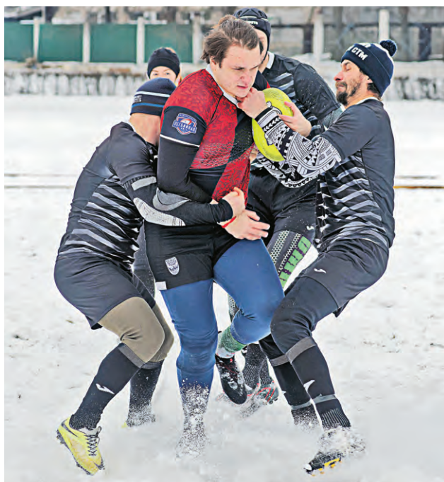
▲ В игре с командой из Рыльска спортсмены железнгорской «Руды» победили со счётом 6:3

Так и получилось. Все пять минут, которые длился первый тайм, крепкие ребята из железнгорской