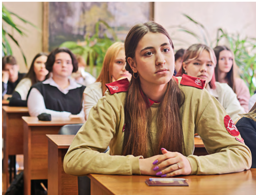
Участники состязаний — девятиклассники городских школ — к заключительному этапу готовы

В Железногорске провели металлургическую олимпиаду среди школьников