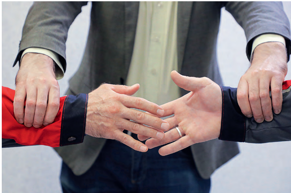
▲ Любой конфликт можно перевести в конструктивную плоскость

«Я замеры этого вала делать отказываюсь. И так работаю больше, чем положено, да ещё не на своём месте! Где справедливость?!»