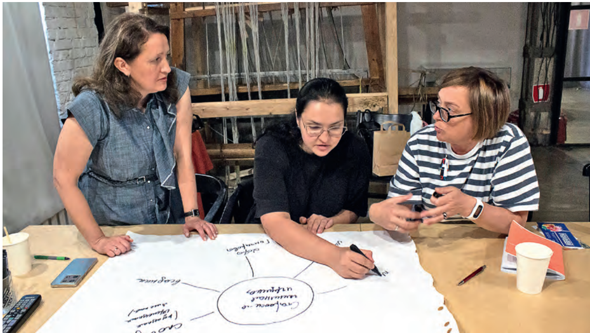
▲ Стажировка — возможность не только познакомиться с наработками коллег, но и сделать первые наброски к своим будущим проектам

Коломну в качестве маршрута стажировки выбрали не случайно. С 2008 года благодаря усилиям энтузиастов здесь развивается центр познавательного туризма «Коломенский посад». Сегодня это целый музейно-творческий