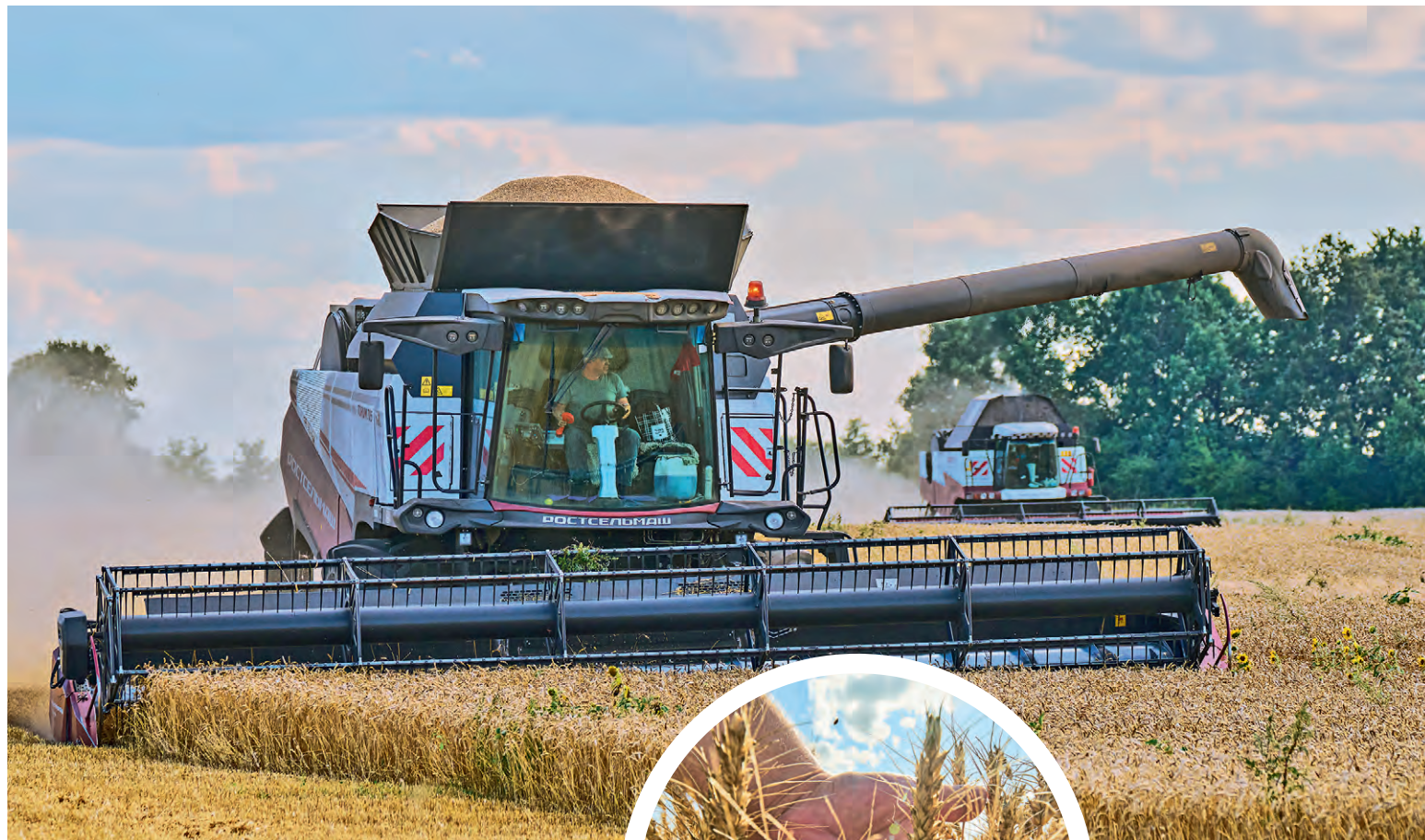
▲ Рабочий день комбайнёры начинают в пять утра и завершают в девять вечера

Чтобы выдержать столь интенсивный ритм работы, нужна крепкая крестьянская закалка. И комбайнёры, и водители, и другие сотрудники агрофирмы — жители Карманово и окрестных сёл. Поэтому к тяжёлому аграрному труду привыкли с малых лет. Пахать, сеять, убирать зерновые для них — дело обычное.