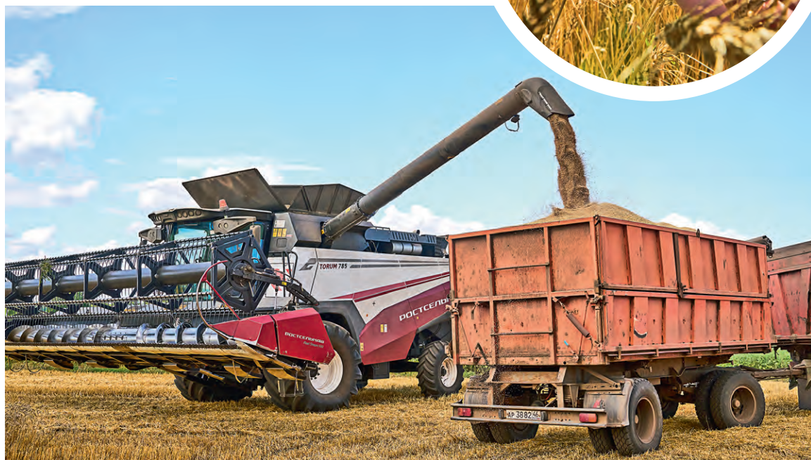
▲ Уборочная страда — в самом разгаре