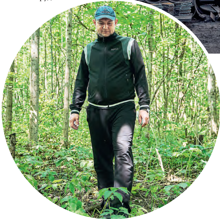
▲ Прогулки по лесу — любимый вид отдыха. Но даже здесь важен риск-ориентированный подход. Правильный выбор одежды позволит свести к минимуму риск пострадать от укуса клеща

«Даже дома, в родной квартире, существуют десятки угроз. Розетки, выключатели, газовая плита — всё это может стать причиной травмы».