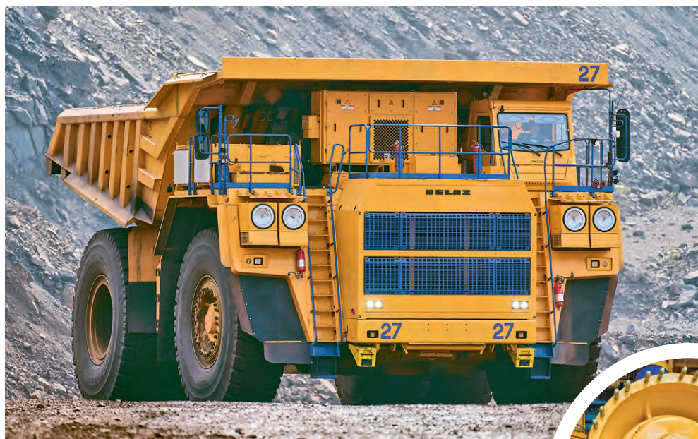
▲ Новый 220-тонник уже приступил к выполнению своих обязанностей в карьере Михайловского ГОКа

— Мы будем обслуживать машину, следить за узлами и