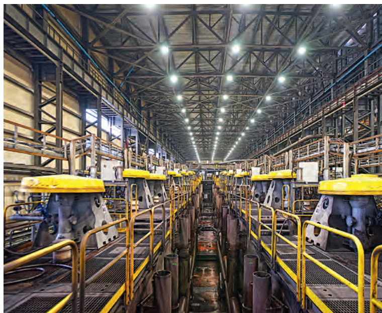
▲ Флотационное дообогащение позволяет получить концентрат самого высокого качества, содержащий 71 % железа

более высокопроизводительным. Растёт уровень автоматизации и механизации с минимальным использованием ручного труда. Всё это делает рентабельным переработку этих руд.