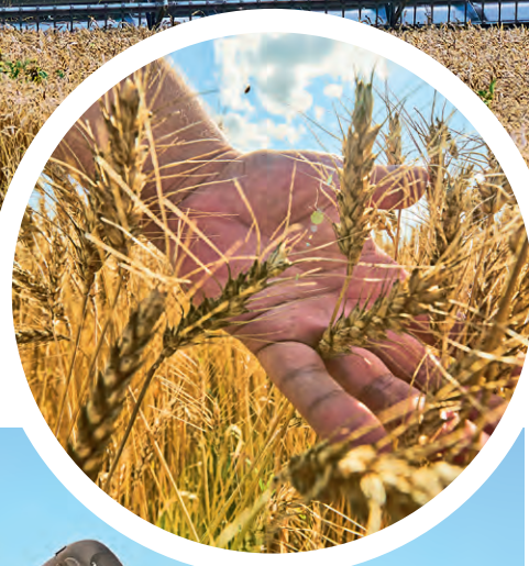
◀ Урожайность пшеницы в этом году — выше, чем в прошлые периоды