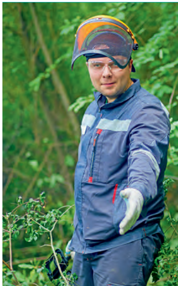
▲ Волонтеры Металлоинвеста приезжают в Поленово уже не первый раз

Территория усадьбы — более 14 гектаров. Чтобы содержать её