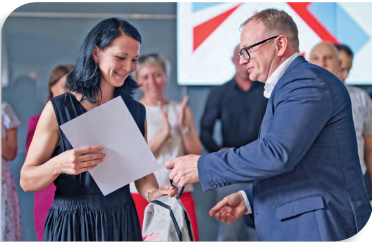
▲ Заслуженные награды — победителям и призёрам конкурса