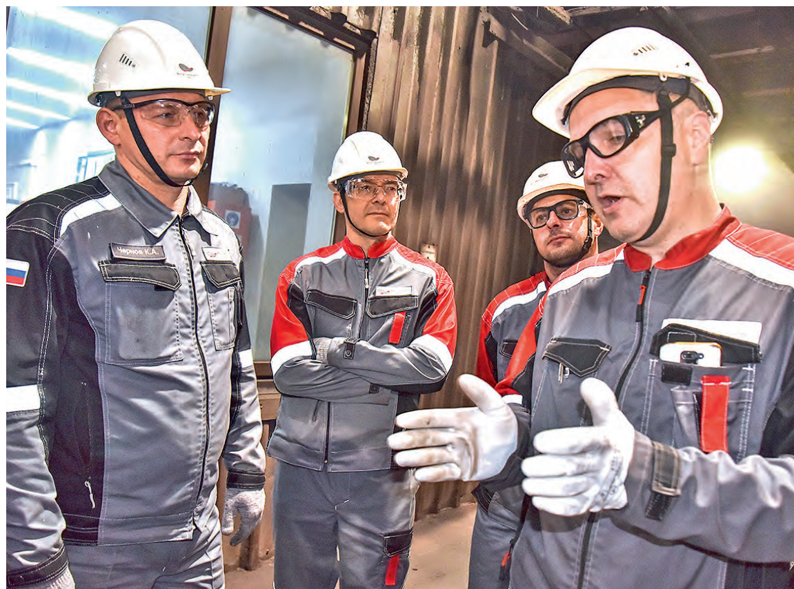
▲ Обязательная часть линейного обхода в электросталеплавильном цехе ОЭМК — общение с персоналом

— Работники с разных участков цеха провели настоящий мозговой штурм: сделали визуализацию места, где это произошло, посмотрели, что пошло не так, накидали море идей, как