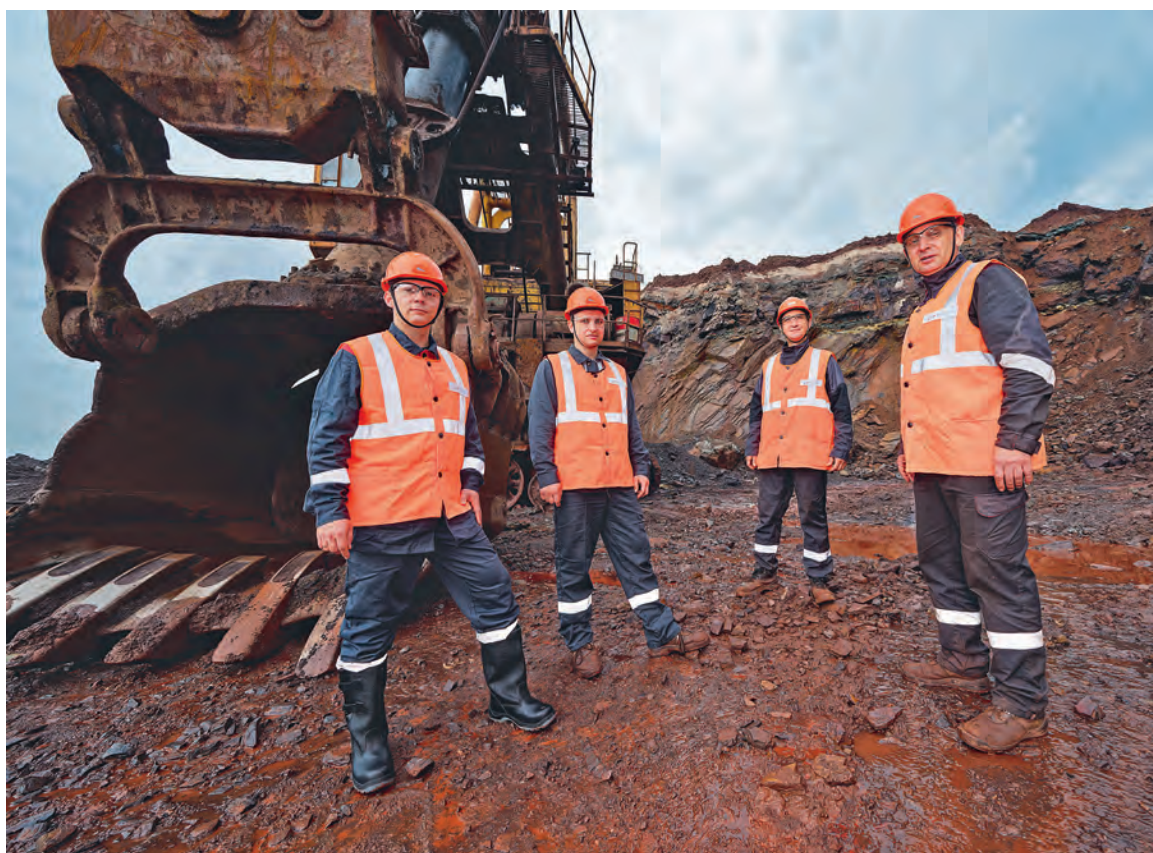
▲ Бригада экскаватора № 83 — одна из лучших в рудоуправлении Михайловского ГОКа. Сотрудники чётко выполняют производственные задания и внимательно следят за узлами машины