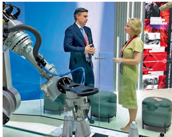
▲ Съёмки программы проходили в северной столице в дни ПМЭФ-2025