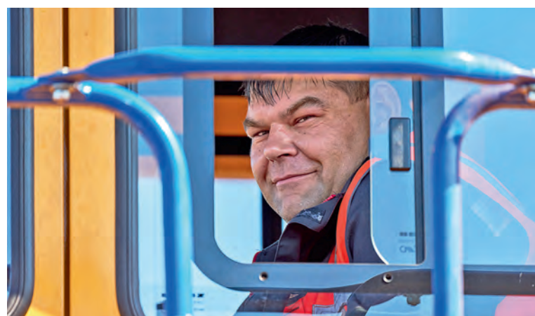
▲ Михайловский ГОК. Когда работа — любимая, нипочём даже самые знойные дни