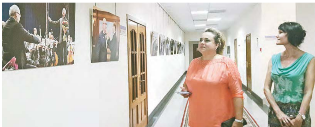
Фотолегипись десятилетия получилась яркой и интересной

Десять лет – это много или мало? Казалось бы, в историческом летоисчислении это всего лишь небольшой отрезок времени. Но, взглянув на эти фотографии, становится понятно – 10 лет вместе с компанией «Металлоинвест» - эта целая эпоха, полная масштабных промышленных, социальных, культурных, спортивных событий. С появлением компании «Металлоинвест» жизнь в Железнодорожном и Курском регионе качественно изменилась, и это наглядно демонстрируют фото-