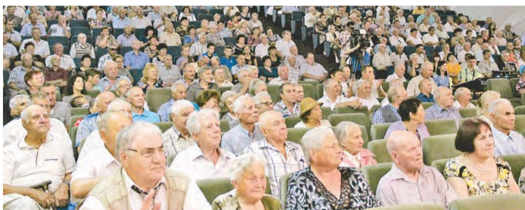
В зале - ветераны и лучшие работники комбината

добросовестный труд. Это они мелькали на кадрах летописи истории комбината, показанной зрителям большого зала Дворца культуры. Истории, которую они творили и продол-