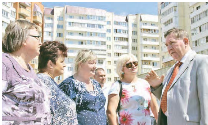
Губернатор в курсе проблем образования

По словам губернатора, к 2024 году в Курской области будет построено 18 новых школьных зданий. И школа № 14 в Железнодорожке – первая из них.