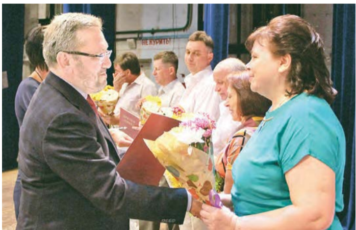
Сегодняшнее поколение горняков верно традициям трудовой доблести

Уже несколько лет эстафета горняцкой славы, чествование передовиков производства собирают вместе ветеранов и сегодняшних работников Михайловского ГОКа.