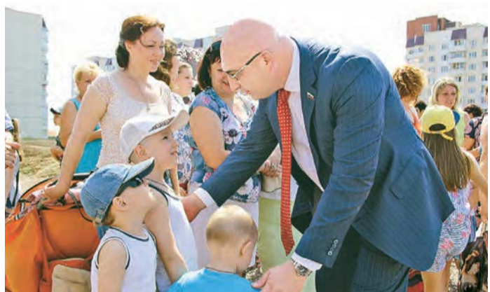
«Скоро пойдете в новую школу, ребята!»