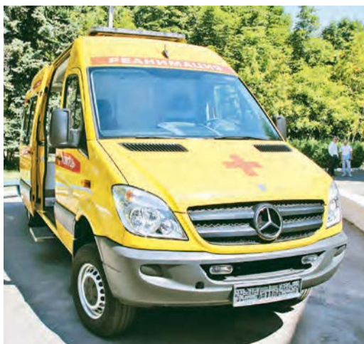
Новый реанимобиль – как «космический аппарат»

14 июля компания «Металлоинвест» вручила железнодорожской городской больнице №2 современный реанимобиль.