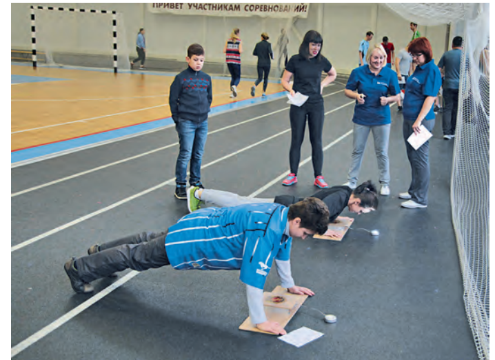
Всё больше горожан стремятся сдать нормы ГТО.