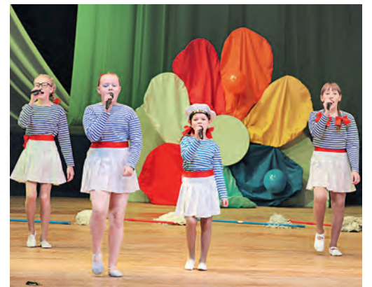
Каждый раз, выходя на сцену, ребята примеряют на себя новые образы.

В этот день всё было предназначено для любимых мам. Юные воспитанники Дворца культуры с удовольствием показывали то, чему они научились, всем членам своих семей и друзьям, пришедшим на праздник. А их было немало — свободных мест в зале практически не осталось. На каждого ребёнка, поднявшегося на сцену, из зала с безграничной любовью смотрели глаза мамы, единственной и самой родной. Поэтому концертные номера в исполнении юных артистов — это детское «спасибо», сказанное языком искусства. Ведь для этих мальчишек и девчонок, как и для всех людей на земле, — мама — самый близкий на свете человек. Мы все многим обязаны нашим матерям. Они дали нам жизнь, подарили свою любовь, привили жизненные ценности и указали ориентиры, по которым надо двигаться дальше. Даже то, что эти юные таланты занимаются в различных коллективах Дворца культуры — тоже заслуга мам. Это они когда-то привели сюда своих