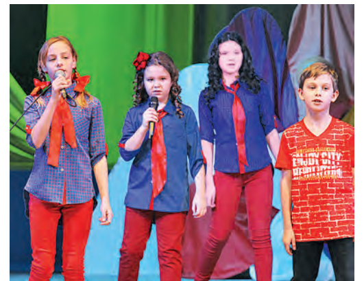
Петь любят и мальчики, и девочки.