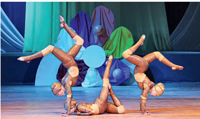
Воспитанники цирковой студии «Арлекин» демонстрировали на сцене чудеса гимнастической пластики.