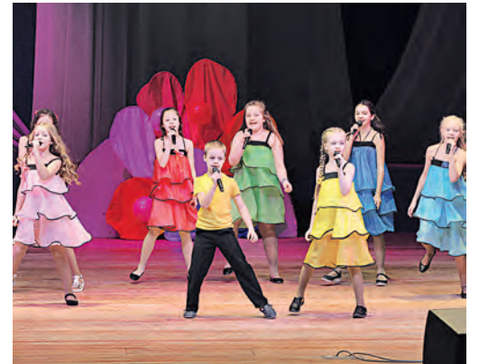
Артисты творческого коллектива «Карусель» подарили мамам задорную песню.