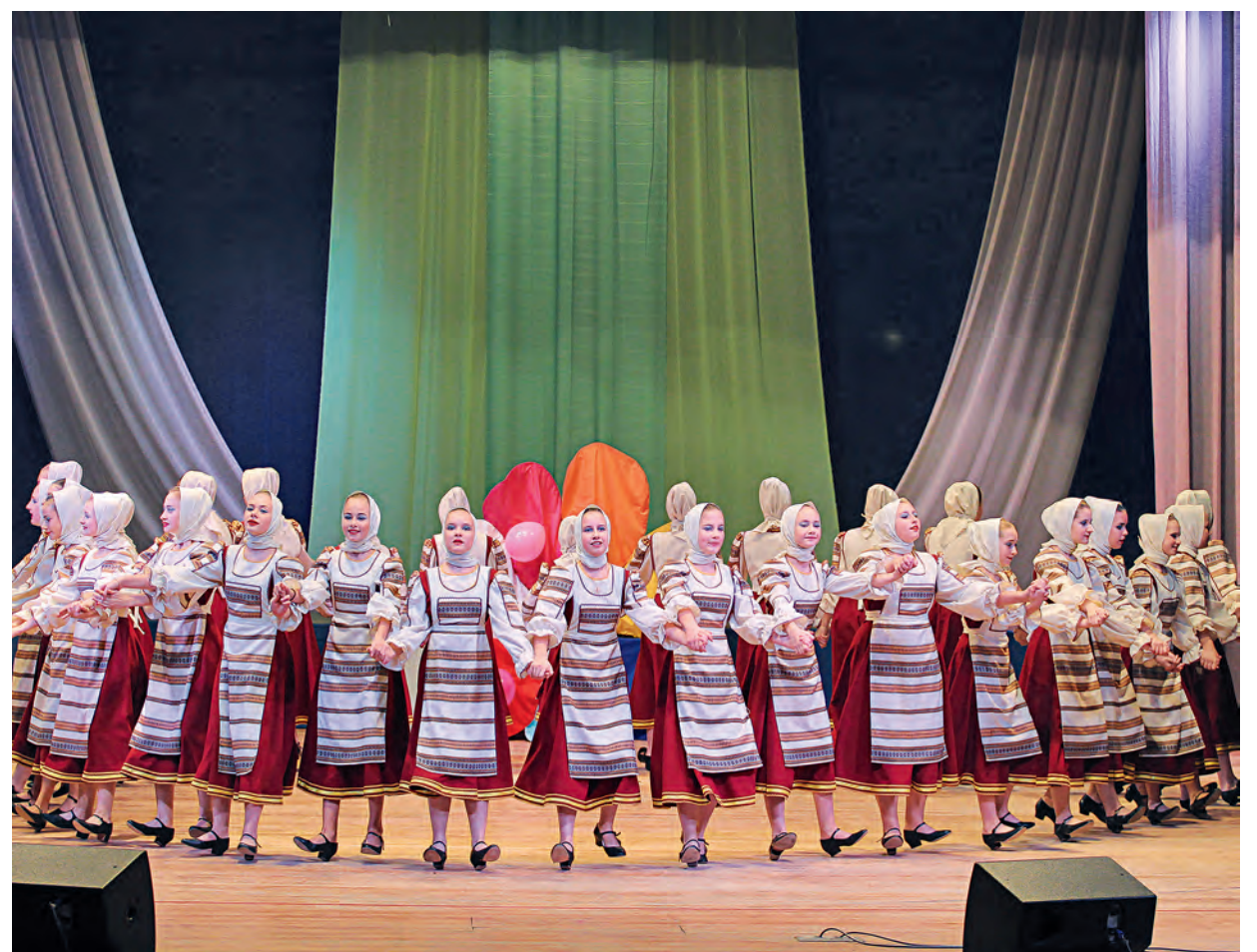
Русский хоровод закружит всех в своём весёлом, озорном танце.