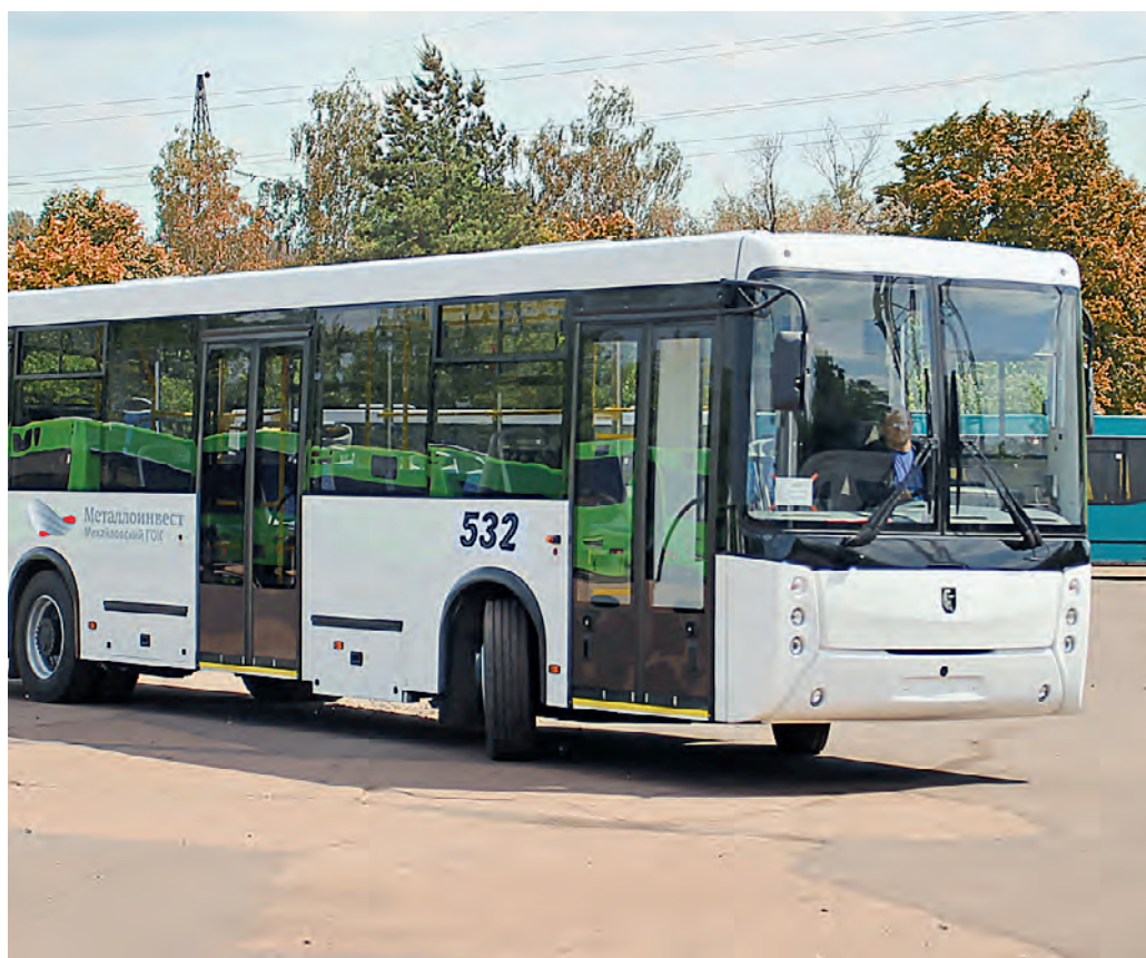
Система «Омником», установленная на транспорте, позволяет проследить маршрут автомобиля, установить его скорость, количество топливных дозаправок, а также расход топлива.

Современные информационные технологии для повышения эффективности производственного процесса сегодня используют на всех комбинатах «Металлоинвеста» и на самых разных переделах, начиная с добычи железистых кварцитов и заканчивая выпуском высококачественного стального проката. Один из последних примеров применения передовых разработок — автоматизированный мониторинг автомобильного транспорта. На МГОКе, в частности, на автобусах, хозяйственных и горно-дорожных машинах установлены специальные системы «Омником», которые позволяют вести дистанционное наблюдение за транспортом круглосуточно, в режиме реального времени. — В этом году мы оснастили Омником 183 транспортных средства. Всего же эта система установлена на 248 машинах, это 88 % от всего парка хозяйственных и пассажирских единиц, — говорит главный инженер УГП Андрей Харламов. — На следующий год мы планируем оснастить ещё 33 единицы техники, и тогда система «Омником» будет фун-