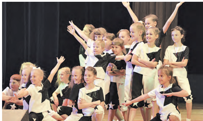
Юным звёздам студии современного танца — под стать и «звёздные» костюмы.