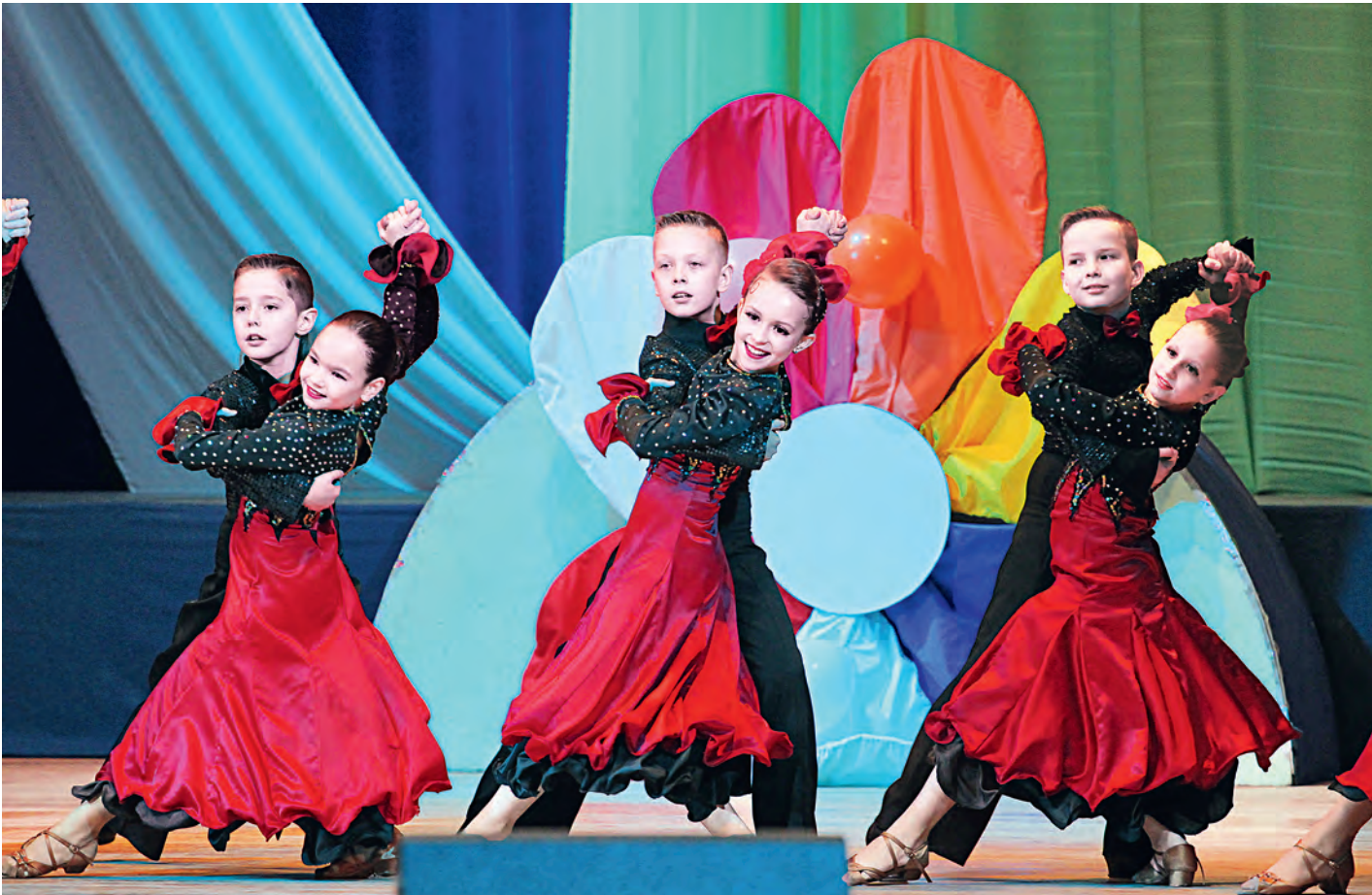
Бальные танцы — это всегда красиво и грациозно.

Юные участники творческих коллективов Дворца культуры Михайловского ГОКа со сцены поздравили своих мам с их праздником. Для каждой из них ребята сказали тёплые слова, исполнили песни, танцы и акробатические номера.