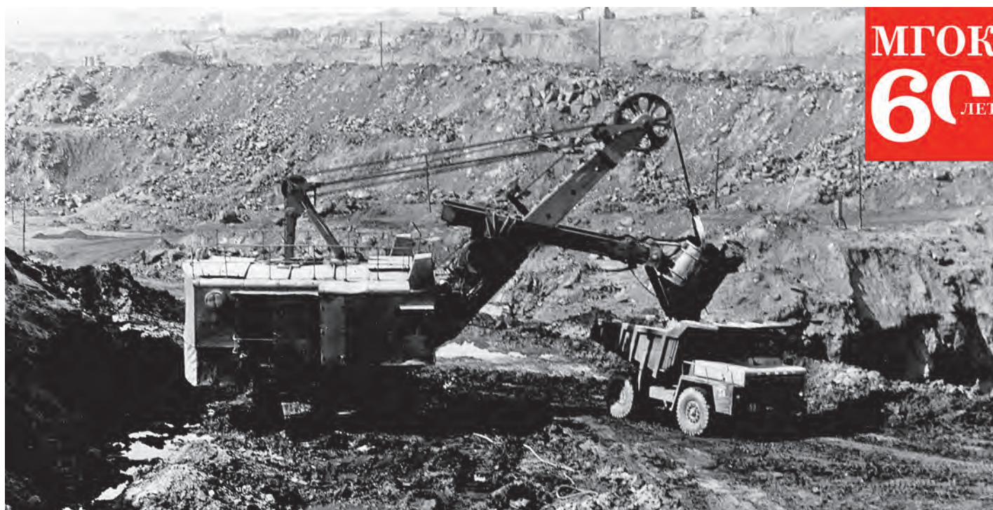
Более полувека развития комбината - это богатая история, славные горняцкие традиции и производственные победы.