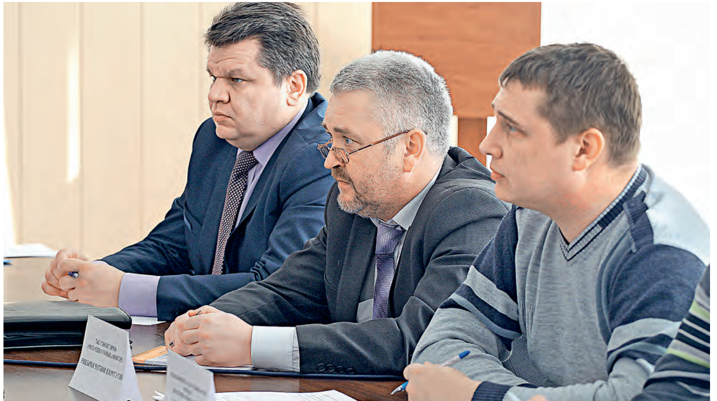
Представители регионального оператора пообещали, что в Железнодорожск приедет специальная комиссия, которая проверит работу подрядчиков.