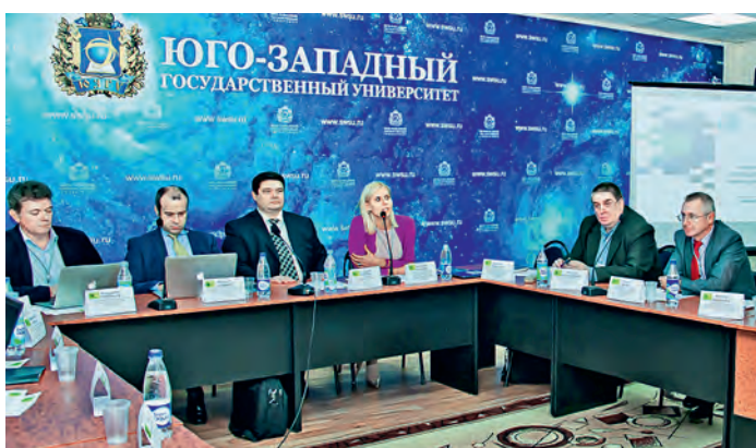
Эксперты «Сколково» обсудили с курянами варианты ведения бизнеса.

направлении «Индустриальный трек» с проектом «Оптическая система «Орлиный глаз». Всего по итогам регионального конкурса были названы 9 участников, получивших признание экспертов и инвесторов российского инновационного рынка. Представители фонда «Сколково» вручили всем победителям пригласительные билеты на Startup Village – крупнейшую в России ежегодную стартап-конференцию, которая пройдет в июне текущего года в инновационном центре «Сколково». А те, кто занял первое место, получили право участвовать в этом мероприятии без прохождения дополнительной экспертизы.