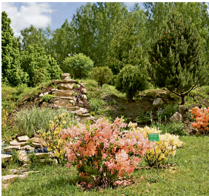
В железногорском дендрарии собрана коллекция растений со всего мира.

Для ценителей всего необычного и интересного также найдется, что посмотреть в нашей области. Знаете ли вы, что в Курском крае есть природный заповедник им. Алехина, где растут уникальные растения, а слой чернозема достигает метра? Или, быть может, гуляли по самому настоящему подвесному мосту, что перекинут через реку Сейм неподалеку от курчатовской деревни Дичня? А любовались ли вы огромным железорудным карьером МГОКа? Или необычными растениями железногорского дендрария? Если нет – вам стоит подумать о путешествии по Курской области. Любителям истории, живописи, театра прямая дорога в столицу соловьиного края. Чего стоит один только курский музей археологии, в числе коллекций которого есть самое настоящее золото гуннов, попавшее к археологам во время раскопок древнего захоронения на территории Фатежского района. Тем же, кто предпочитает православный туризм, будет интересно посетить наш знаменитый мужской монастырь Коренную Пустынь в Золотухинском районе, Свято-Николаевский мужской монастырь, что неподалеку от Рыльска, а также Знаменский и Сергиево-Казанский соборы Курска.