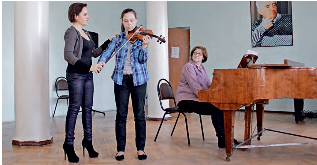
Педагоги и исполнители мирового уровня охотно делились секретами мастерства с юными музыкантами.