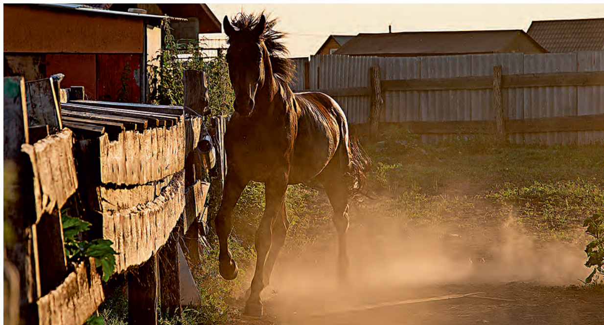
В конных клубах области можно не только прокатиться верхом, но и получить несколько уроков верховой езды.