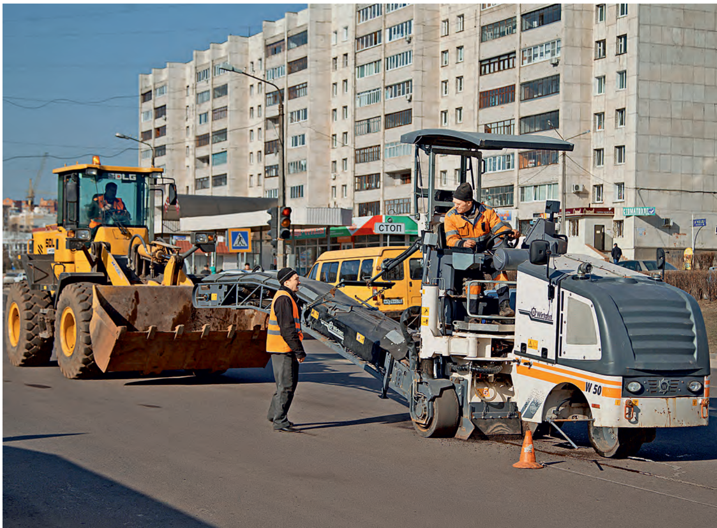
Улица Димитрова будет отремонтирована подрядчиком по гарантийным обязательствам.

Растаял снег, высохли, наконец, лужи, и железнодорожники приступили к традиционному ямочному ремонту городских улиц.