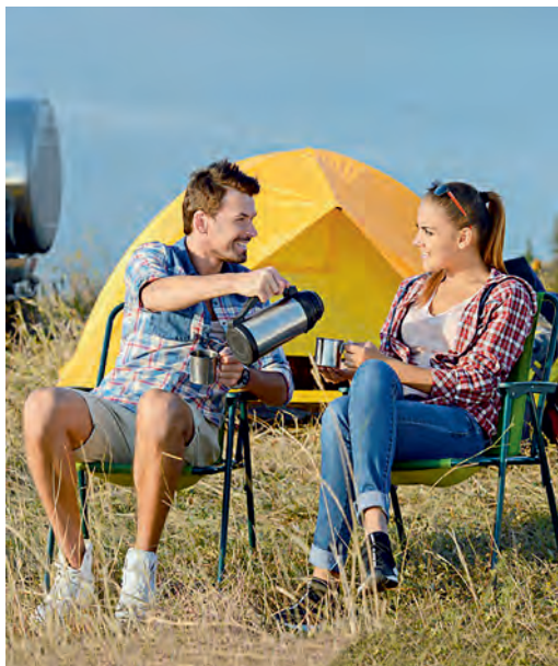
Отдых на природе? Легко!

Не за горами теплые дни, совсем скоро начнется сезон отпусков. Чтобы набраться сил, обязательно ли ехать в дальние дали? Или можно хорошо отдохнуть и в нашей области?