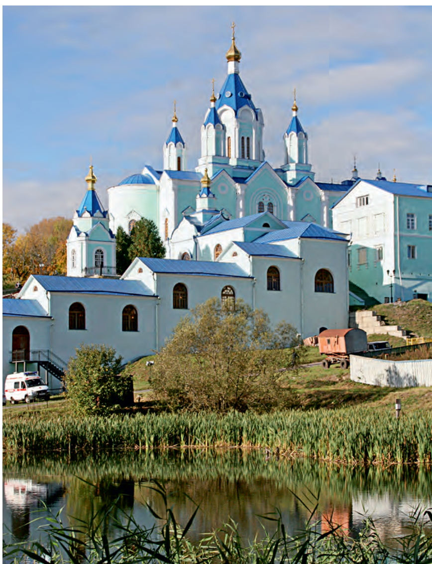
Коренная Пустынь - один из древнейших монастырей Курской области.

М ожно, без сомнений. В Курской области так много чудесных уголков и интересных достопримечательностей, что каждый человек может провести здесь заслуженные выходные так, как ему нравится.