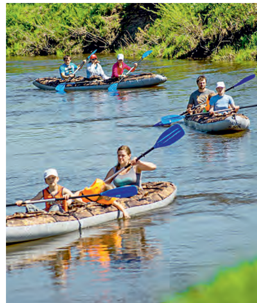
Любителям активного отдыха есть где развернуться.