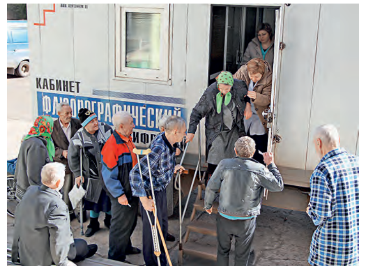
Жители Дома-интерната воспользовались передвижным флюорографом.

Помощь компании «Металлоинвест» этому социальному учреждению, в котором проживают 270 постояльцев, оказывается системно. Комбинат помогает в обновлении оборудования, поздравляет