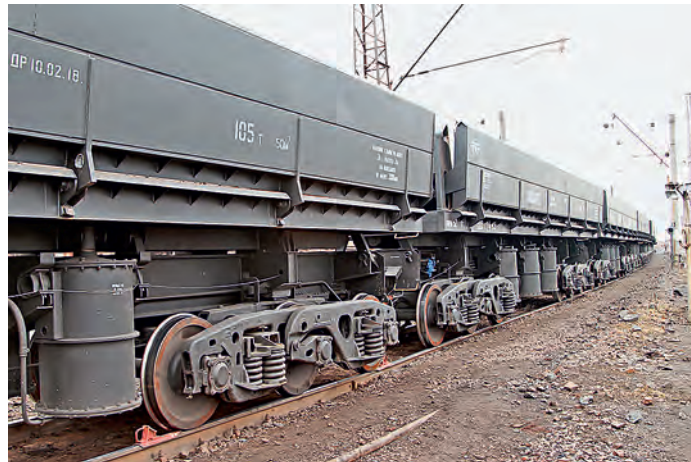
Новые думпкары поступили на Михайловский ГОК в рамках реализации инвестиционной программы Металлоинвеста.

Эта новая техника поступила на МГОК в рамках реализации инвестиционной программы Металлоинвеста, направленной на обновление и модернизацию производственных мощностей. В компании к выбору техники и оборудования