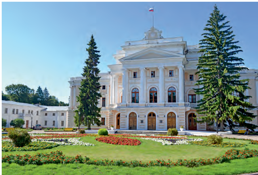
Усадьба князей Барятинских - жемчужина соловьиного края.