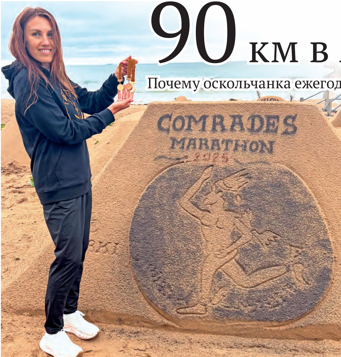
▲ В прошлом году за 10-е место оскольчанке вручили медаль из чистого золота

Почему оскольчанка ежегодно ездит на сверхмарафон в ЮАР