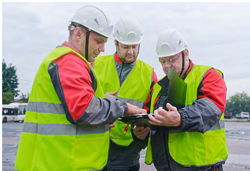
▲ Жюри скрупулёзно фиксировало каждую ошибку, наказывая участников дополнительными секундами, ухудшавшими итоговый результат