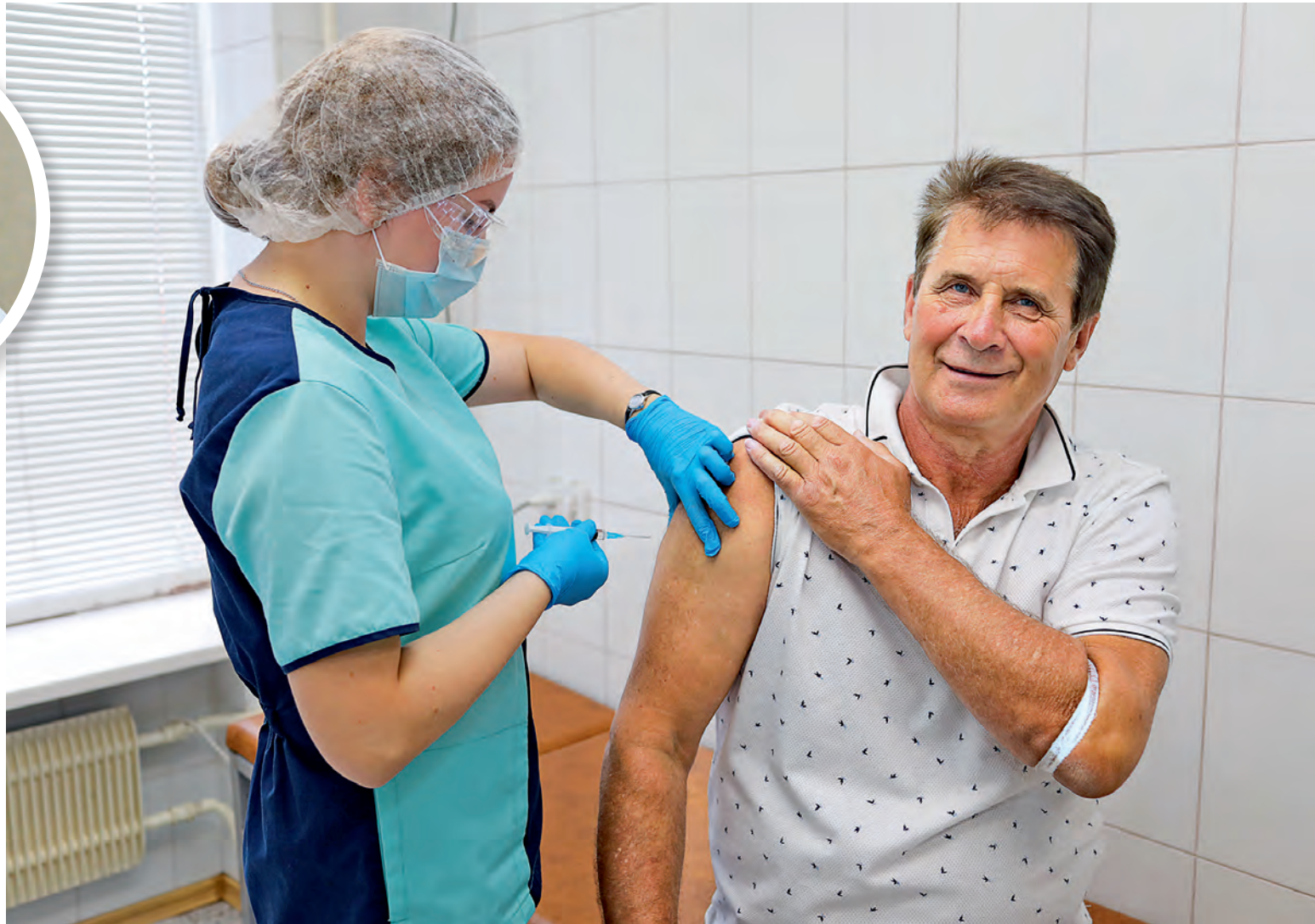
▲ Заботясь о своём здоровье, вы снижаете риск распространения инфекций в коллективе и вносите вклад в защиту здоровья близких

Грипп характеризуется высокой заразностью и тяжёлыми осложнениями. По данным ВОЗ, ежегодно им болеют около одного миллиарда человек в мире. И от 300 до 600 тысяч — это случаи с летальным исходом.