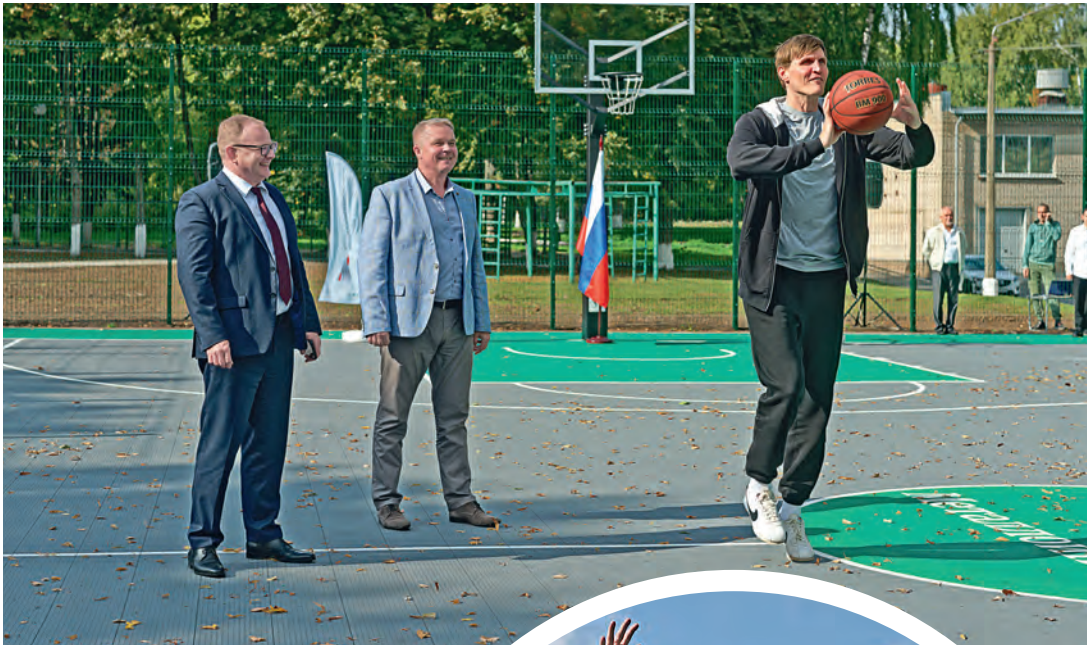
▲ Первый бросок в кольцо — и площадка открыта!

Железногорск впервые посетил знаменитый баскетболист, глава Российской федерации баскетбола Андрей Кириленко. Точным броском в корзину он открыл новую баскетбольную площадку в лицее № 5 и пообщался с его учениками.