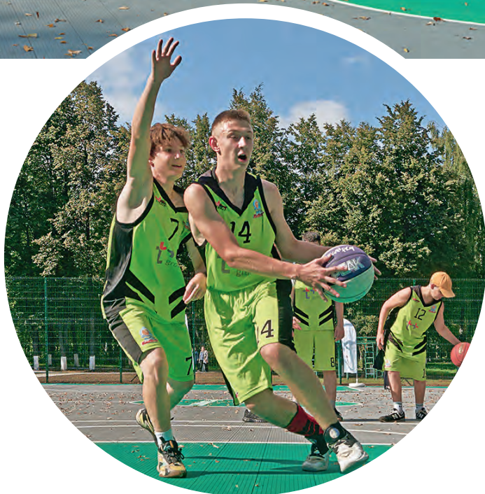
▲ Юные баскетболисты «тестируют» современное покрытие.

Мария Коротченкова