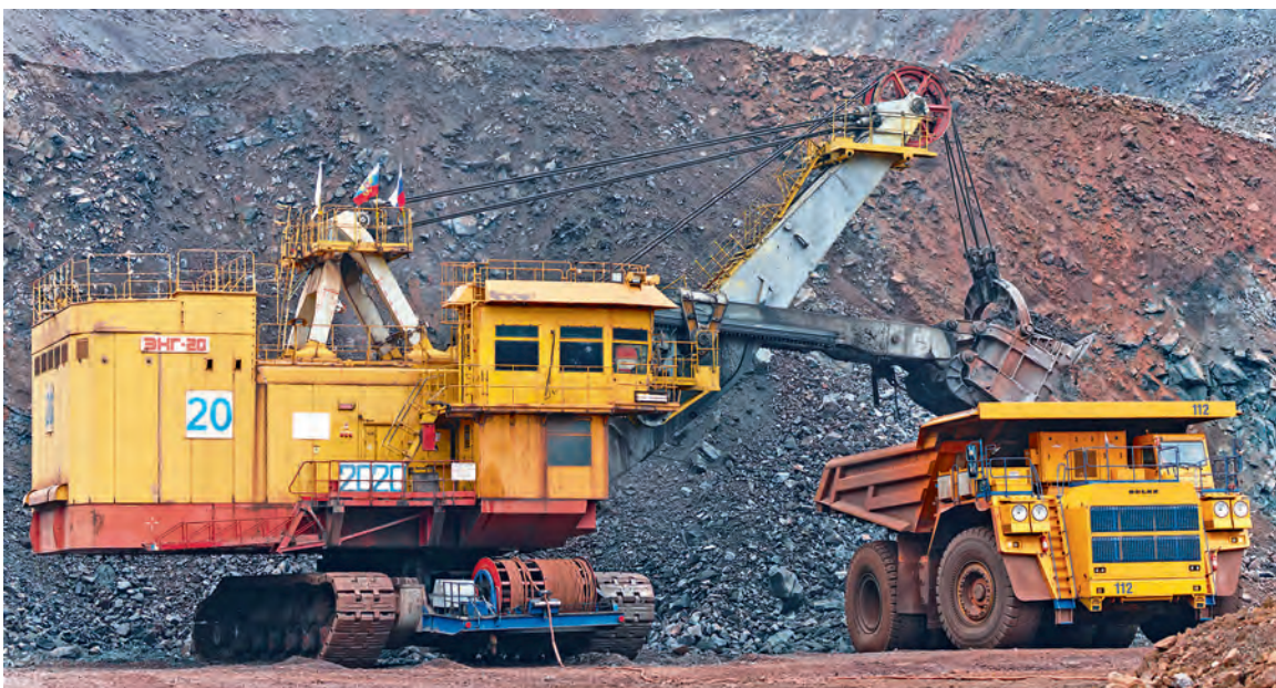
▲ Современные исполины не идут ни в какое сравнение с экскаваторами и самосвалами, которые добывали и вывозили руду в начале 1960-х

Михайловский ГОК отпраздновал добычу двух миллиардов тонн железной руды