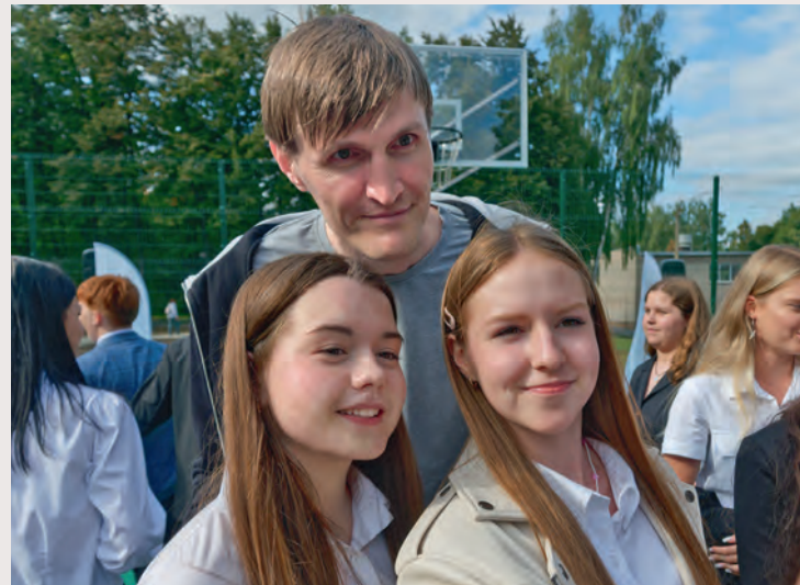
▲ Автограф-сессия и селфи с чемпионкой

Звезда отечественного баскетбола рассказал о пути к успеху, борьбе со страхом и о том, почему не заставляет детей заниматься спортом.