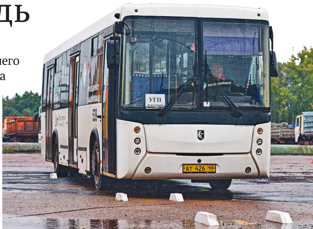
▲ Непрерывный дождь, ставший ещё одним, непредвиденным испытанием для водителей, заставил их мобилизовать всё своё мастерство

— В подобных состязаниях участвую уже в третий раз. Но одно дело — просто выполнять свою работу, другое — выступать перед зрителями и судьями. Тут —