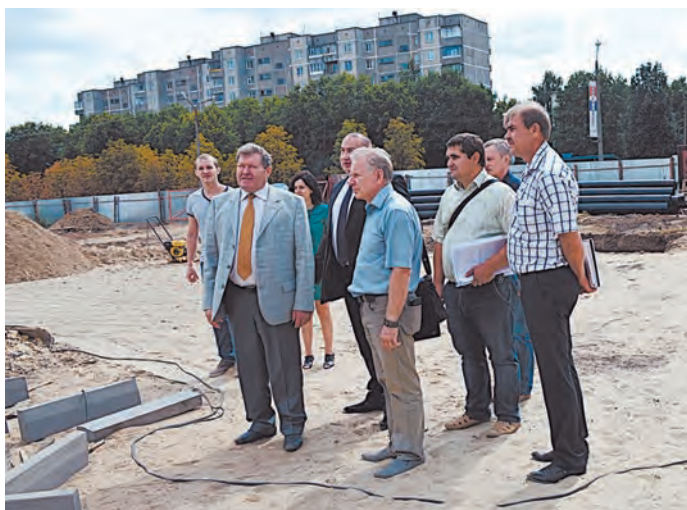
Участники совещания обсуждают ход строительства

Глава города в завершение совещания рассказал, что на недавнем форуме руководителей муниципальных образований России многие из мэров удивлялись, как нашему городу удалось занять столько спортивных сооружений. А ответ один: благодаря трехстороннему соглашению Металлоинвеста с администрациями обла-