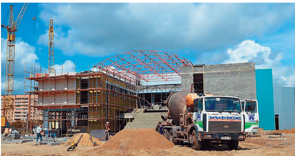
Все работы ведутся комплексно

Кроме этого зала в ФОК предусмотрены еще два. В них можно будет заниматься как атлетикой, так и видовым спортом. Причем, по видовому спорту в ФОК можно будет проводить соревнования любого уровня. Болельщикам будет хорошо видно, как именно они проходят. В самом большом зале предусмотрены трибуны для зрителей.