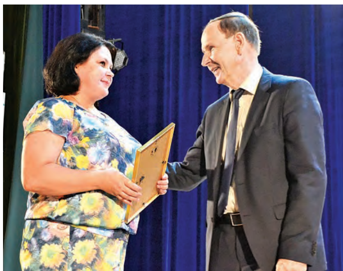
Лицей № 5 – лучшая инновационная школа

Железнодорожное образование идет по этому пути уверенно, ведь у него есть надежный помощник – компания «Металлоинвест». Благодаря трехстороннему соглашению между администрациями области, города и Компанией были выделены значительные средства для ремонтов уч-