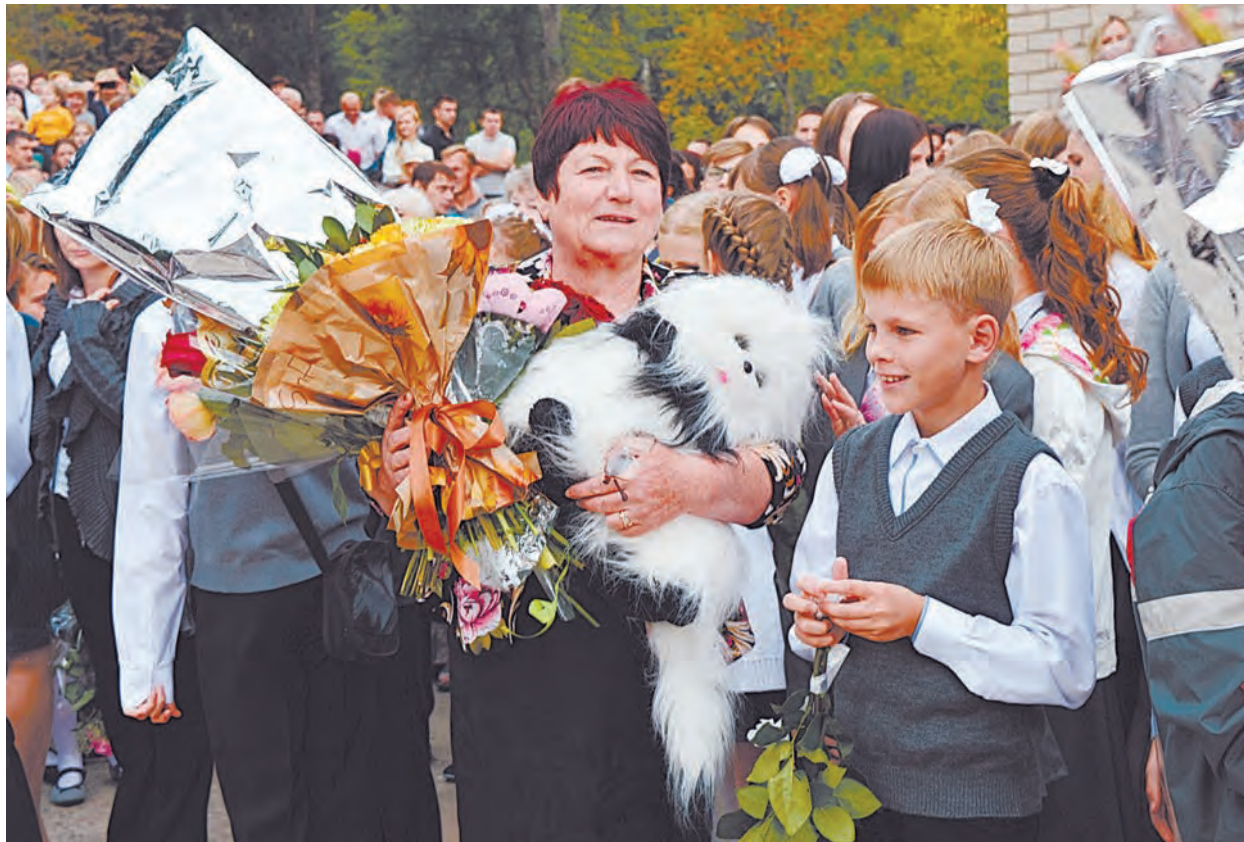
Мягкая игрушка — напутствие ребятам на успех

А развивают таланты лицеистов замечательные педагоги. Лицей — победитель в номинации