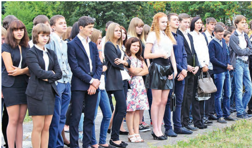
Студенты настроены на серьезную учебу

Первого сентября за парты сели не только тысячи железнгорских школьников, но и студенты городских колледжей, готовящих кадры для комбината.