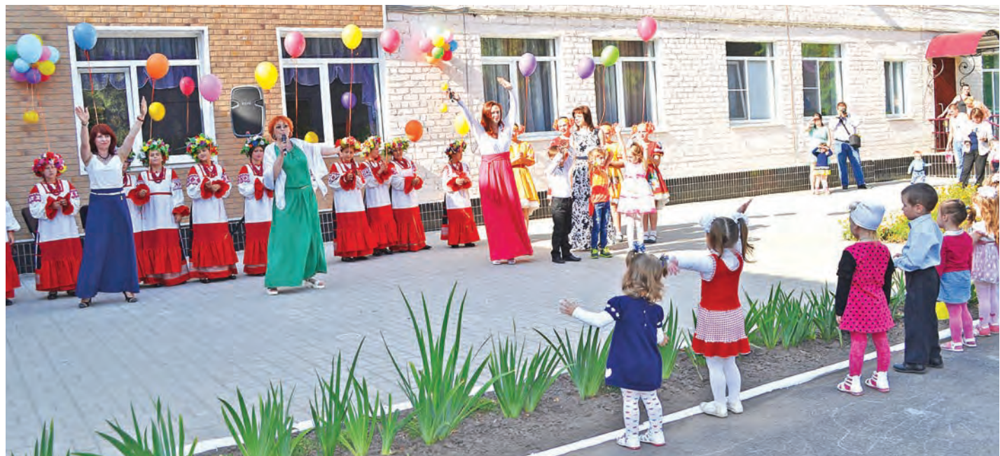
Праздник удался на славу