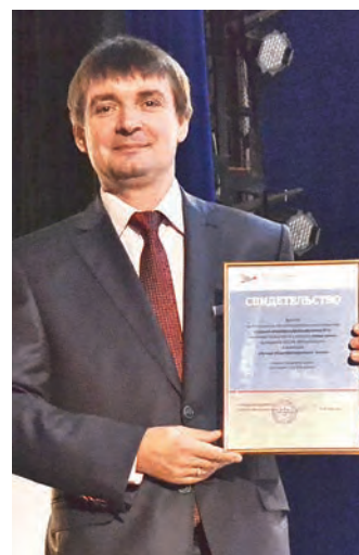
Школа № 3 – лучшая общеобразовательная школа