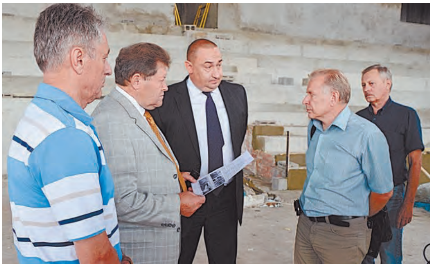
Под контролем даже искусственное покрытие для полов

В период экономического кризиса есть и проблемы, в том числе с финансированием социальных объектов. На строительство спорткомплекса в Железногорске теперь будет выделено в пять раз меньше средств из федерального бюджета. Основной объем финансирования ложится на региональный бюджет – 80%, по 10% вкладывают федеральный и городской.