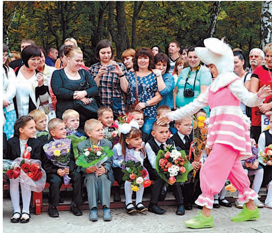
Мыши тоже хотят учиться