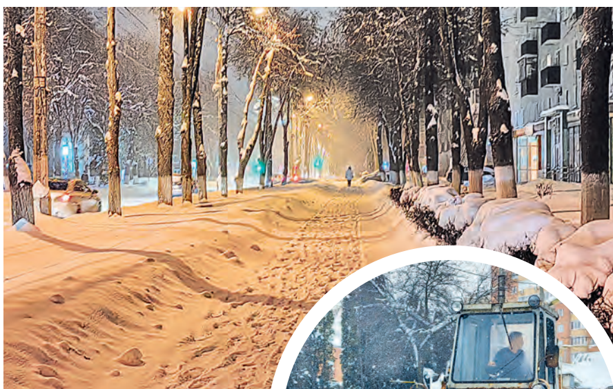
▲ Обильные снегопады на новогодних каникулах стали серьёзным испытанием для городских коммунальщиков

► Как отметил мэр города, коммунальные службы не всегда правильно и рационально используют специальную технику