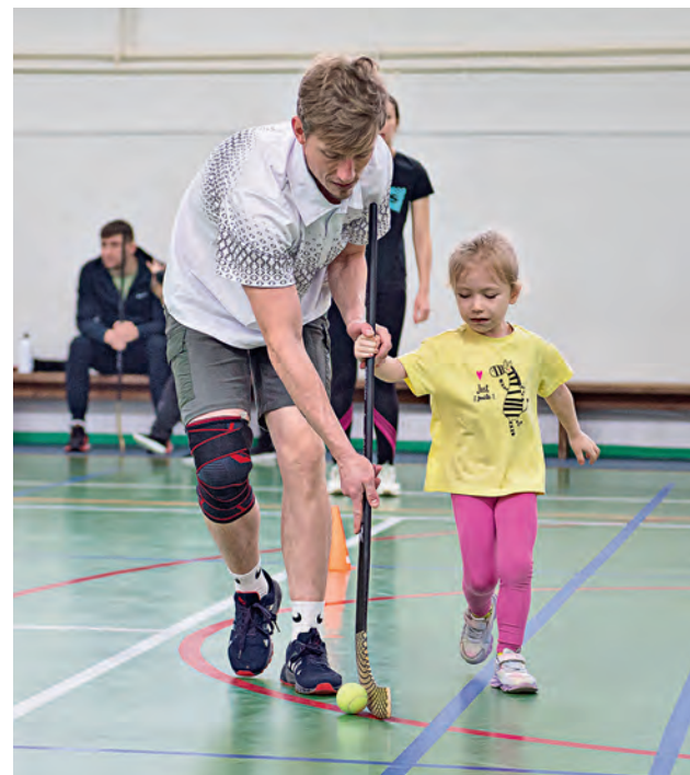
▲ Провести теннисный мяч клюшкой, огибая фишки, не так просто. Сделать это быстро — гораздо тяжелее

Последний рубеж — конкурс по скоростному одеванию ребёнка. Мы по очереди мчимся к дочери, чтобы надеть на неё шорты, футболку, жилетку с номером и кепку.