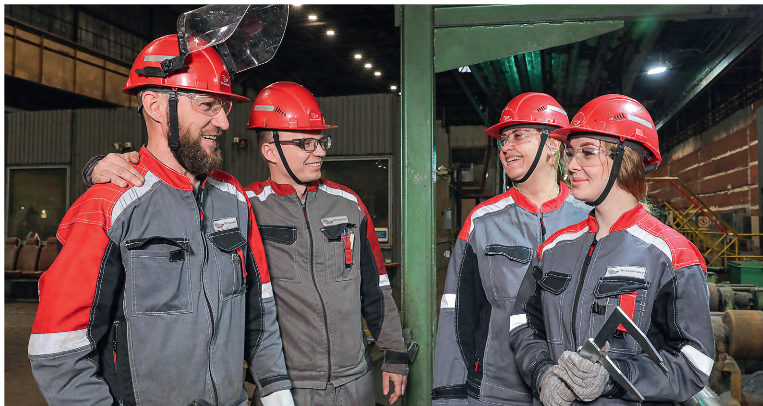
▲ Работники предприятий Металлоинвеста могут быть уверены: компания сделает всё возможное, чтобы обеспечить достойную оплату их труда

Беседовал Дмитрий Кравченко