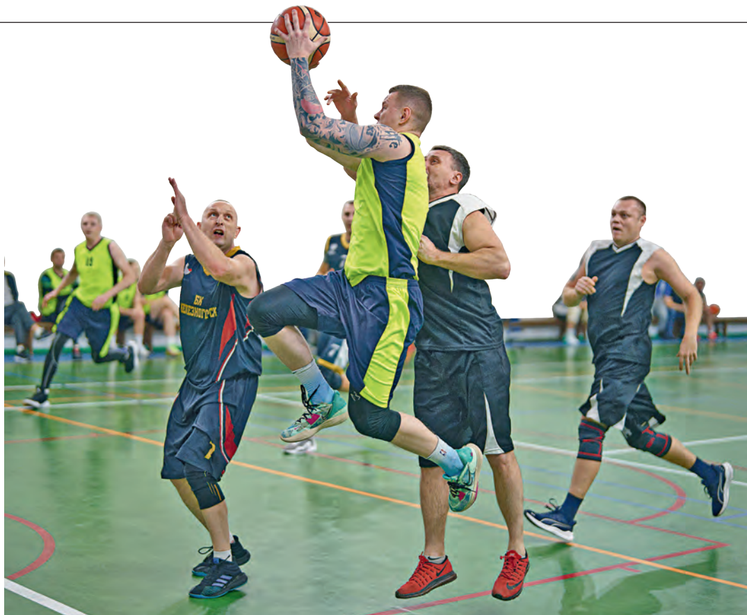
▲ Каждая команда стремилась показать атлетичный, комбинационный, атакующий баскетбол

На вторую ступень пьедестала поднялись баскетболисты обогатительной фабрики. Бронзовые награды завоевала объединённая команда автомобилистов.