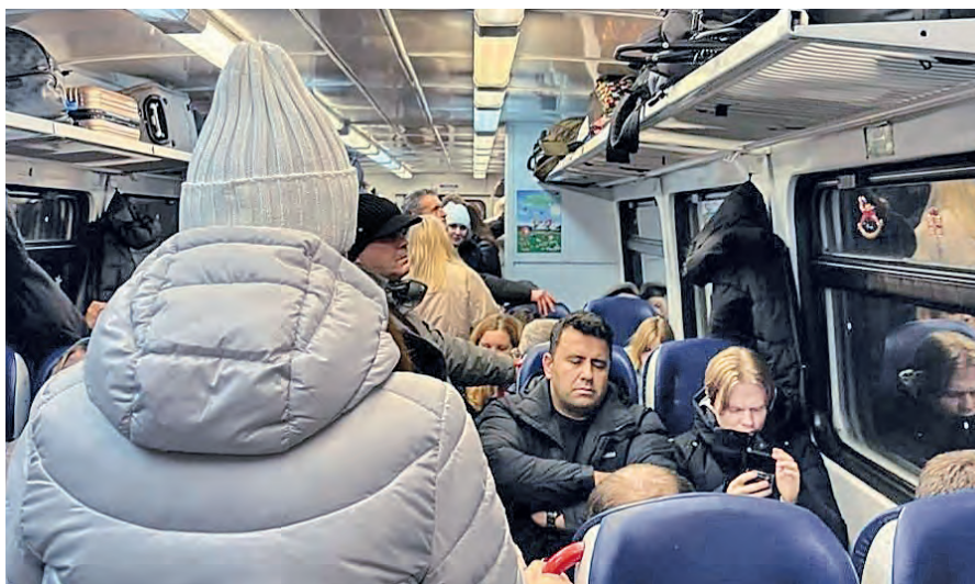
▲ Во время новогодних праздников электричка до Орла еле вмещала тех, кто хотел уехать в столицу

► Как отметил мэр города, коммунальные службы не всегда правильно и рационально используют специальную технику