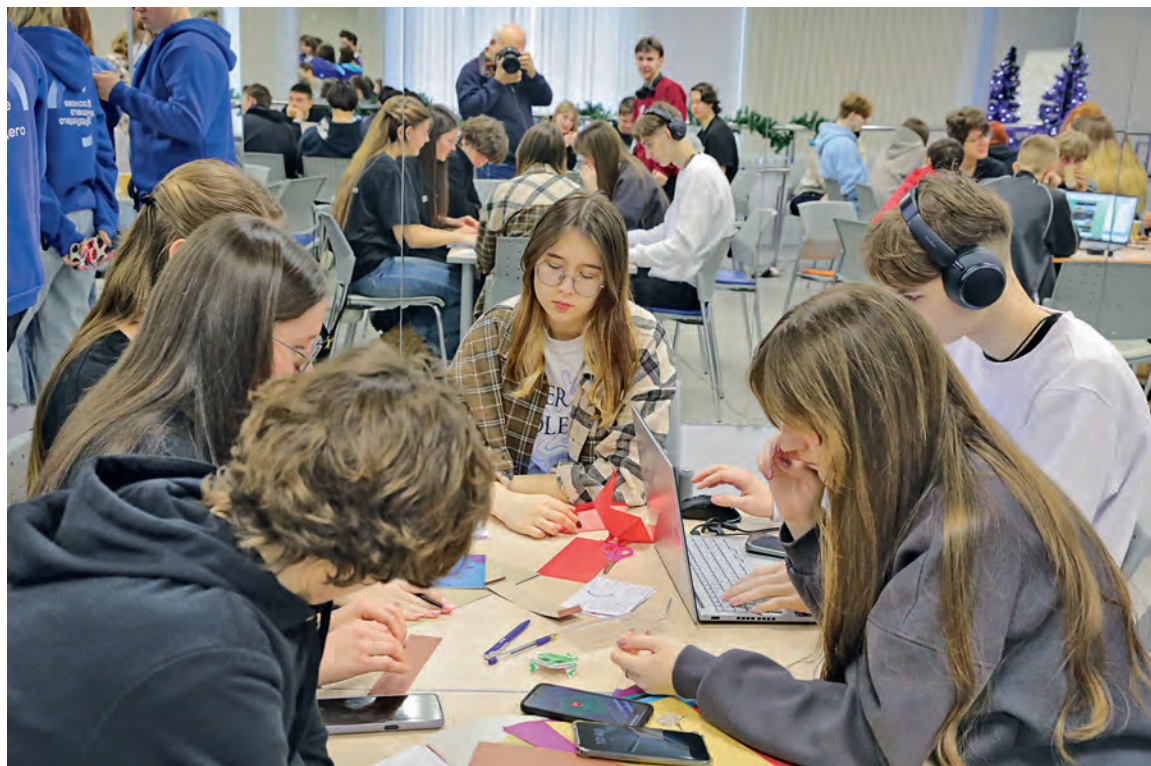
▲ Чтобы создать проект креативного арт-объекта, ребятам пришлось потрудиться в командах