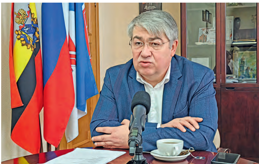
▲ Глава города честно, ничего не скрывая, рассказал о городских проблемах и способах их решения

Не будут закрывать и детские сады. А те, что уже прекратили работу из-за низкой