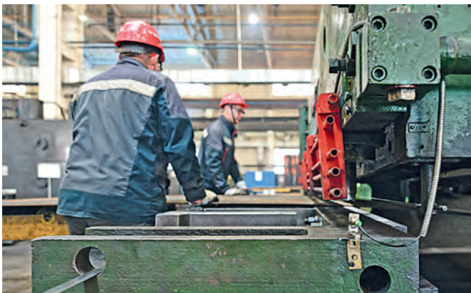
▲ Зона рубки металла — под постоянным контролем зоркого лазерного датчика

Мария Коротченкова