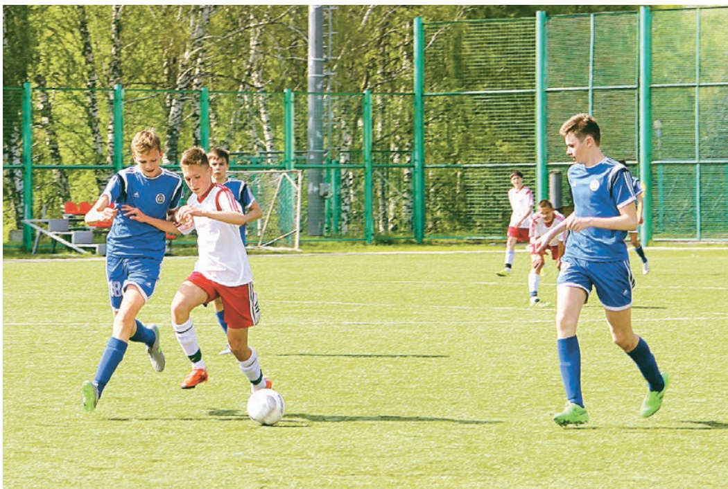
На своем поле победила железногорская команда

Уже второй год в городе проводится этот спортивный праздник, инициатором проведения которого выступила компания «Металлоинвест». В первые майские дни Железногорск гостеприимно встретил футбольные команды из пяти городов России, а также команду из Беларуси. Открывал турнир глава города