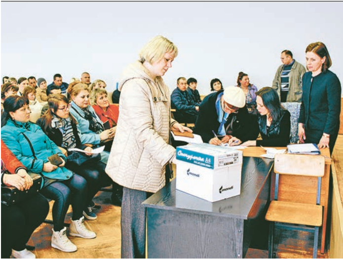
Каждый самостоятельно достал конверт с номером своего участка

Четыре года назад был принят региональный закон №74-ЗКО, который обязал муниципалитеты бесплатно обеспечивать земельными участками многодетные и молодые семьи, а также семьи с детьми-инвалидами. На сегодняшний день 35 семей уже получили участки, а на этой неделе счастливыми