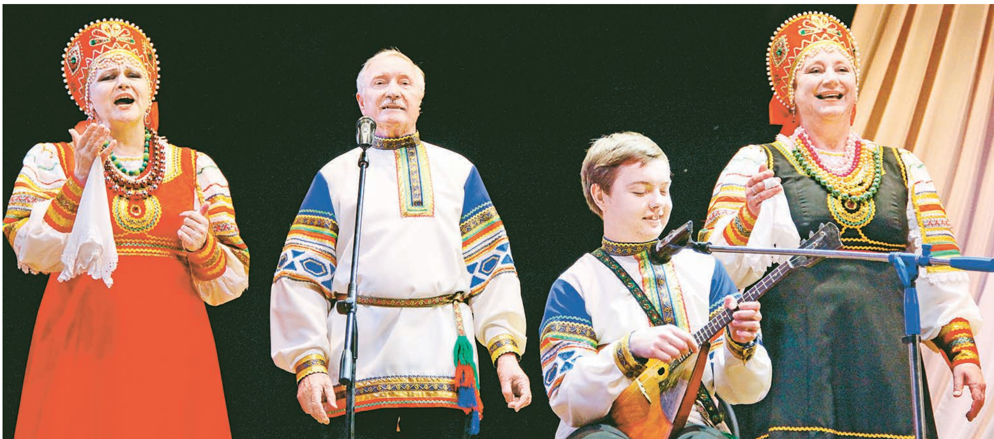
Русские задорные песни понятны зрителям и исполнителям всех возрастов