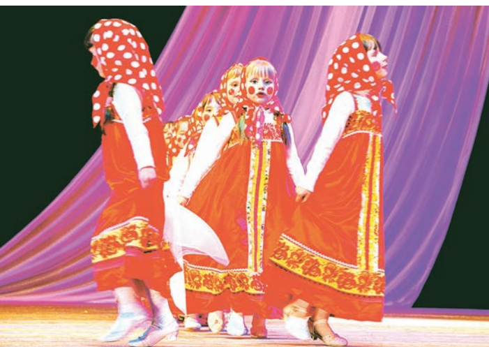
Куклы-матрешки вызвали у зрителей улыбки