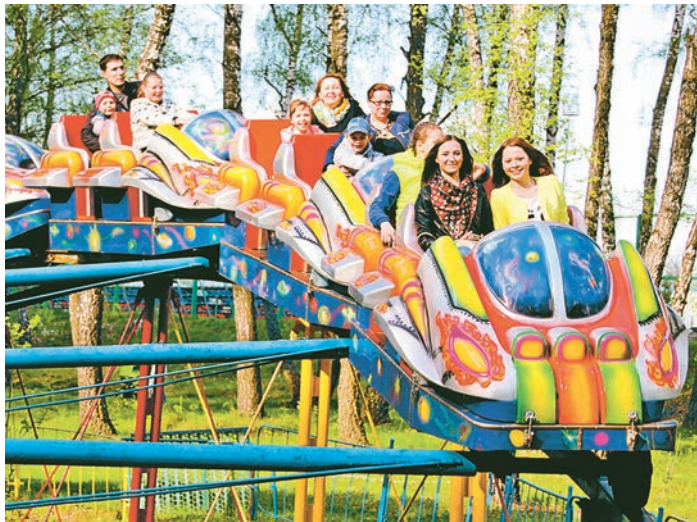
Смех, эмоции, адреналин - от «Веселых горок» захватывает дух

видеокамеры. В это же время у кассы уже выстроилась приличная очередь. - Не день, а сказка! - И правда, наконец-то тепло, - жмурясь на солнышке, сидят и болтают подружки. - Девчонки, айда кататься! - подбегают к ним ребята с заветными билетками. И компания радостно бежит на «Веселые горки». Спустя мгновение разноцветный космический корабль уже стремительно мчит их то вверх, то вниз. Девчонки визжат, мальчишки хохочут. Молодежь охватывает невероятное чувство невесомости. Рядом набирает обороты один из любимых детских аттракционов - «Ветерок». «Поех-а-а-ли!», - по-гагарински кричат мальчишки, крепко схватившись за цепи. «Мама, мама, я