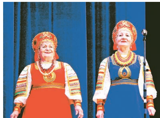
Народные песни любимы во все времена