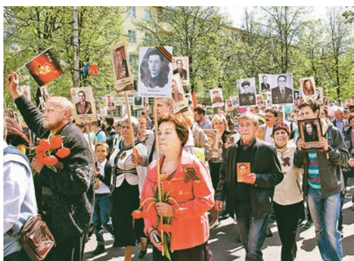
«Бессмертный полк» сплотит всех железнодорожников