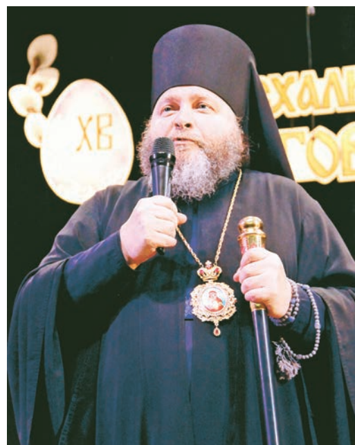
Проникновенные слова от владыки Вениамина