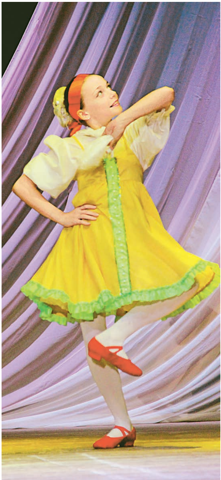
Легкость и задор покорили зрителей...

В первый праздничный день Пасхи Господней во Дворце культуры МГОКа прошел традиционный «Пасхальный Благовест». Это - четвертый фестиваль, который совместно проводят городской отдел культуры и Железнодорожная епархия.