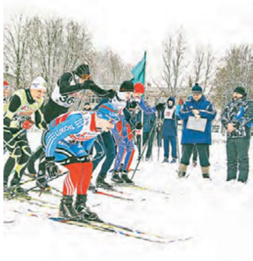
На старте – сильнейшие лыжники комбината.