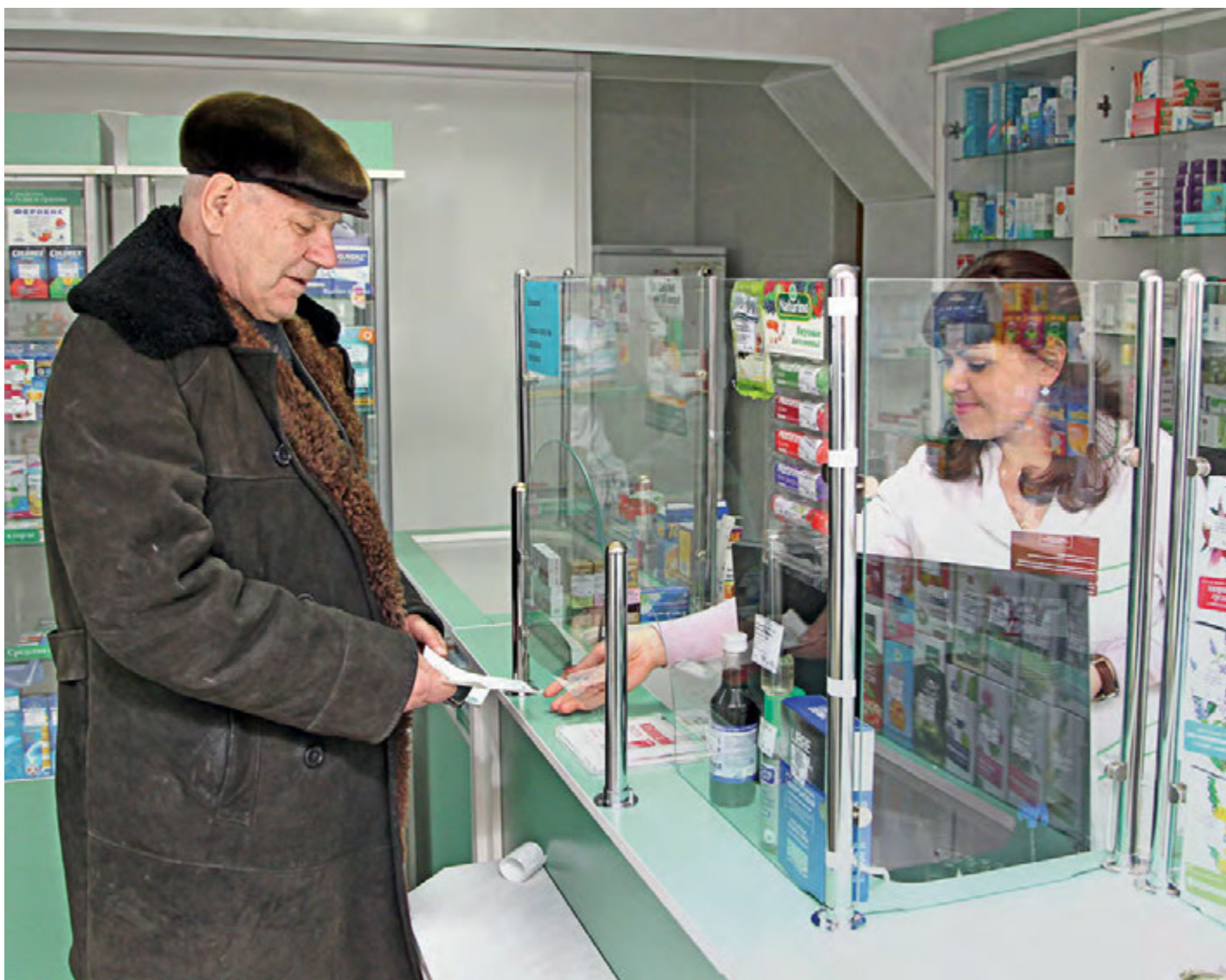
В новом году в медицине Железногорска появился ряд нововведений.

Железногорские врачи рассказали журналистам об эпидемиологической ситуации в городе и нововведениях, с которыми горожане уже столкнулись в этом году.