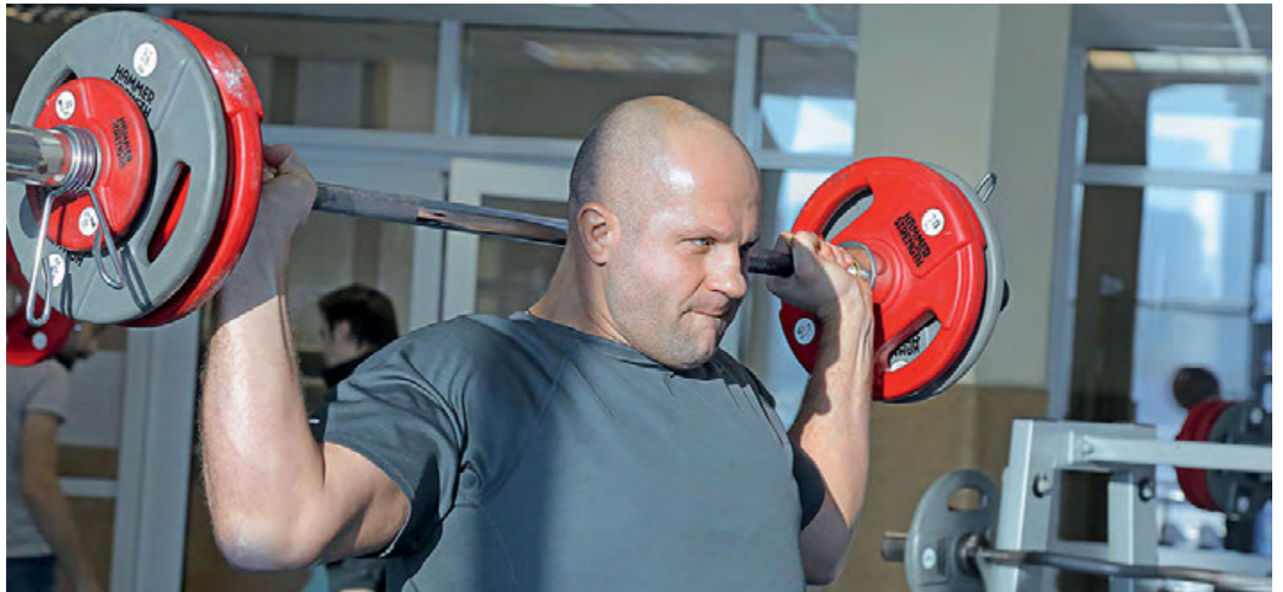
К бою с Мэттом Митрионом Федор Емельяненко готовится в оэковском Дворце спорта.