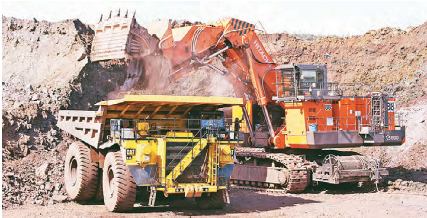
Горнорудное производство впечатляет своими масштабами.