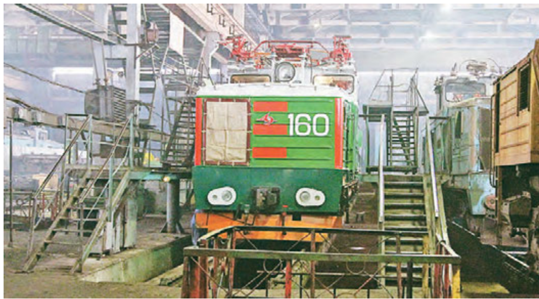
Яркий красно-зеленый тяговый агрегат скоро выйдет на железнодорожные пути карьера.