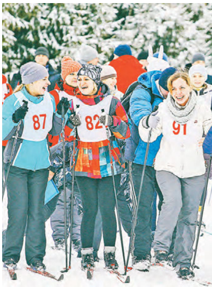
Позитивный настрой перед стартом – залог хорошего результата.