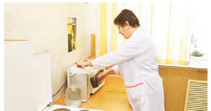
В ЦВК ЭЦ оснастили бытовыми приборами комнаты для приема пищи.

– Мы провели ремонты коммуникаций, электроаппаратуры, оснастили новые современные шкафы управления насосным