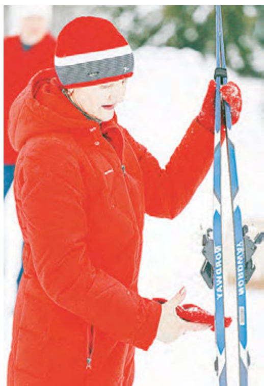
К старту нужно тщательно подготовиться.