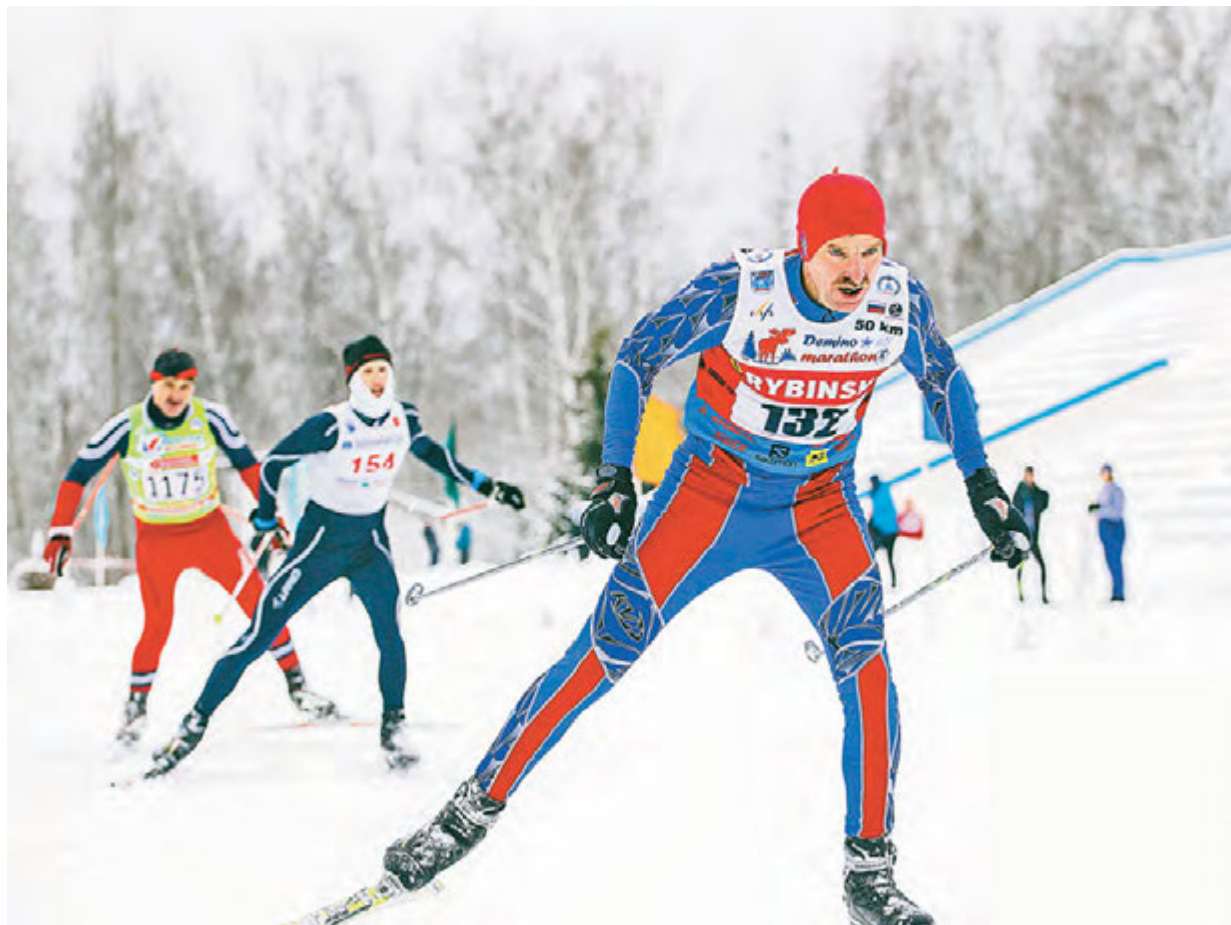
Самоотверженность, взаимовыручка и воля к победе – слагаемые высоких результатов спортсменов-горняков.

В минувшую субботу стартовала рабочая спартакиада-2017 Михайловского ГОКа. Традиционно соревнования начались с лыжной гонки – самого массового и любимого вида в программе спартакиады.