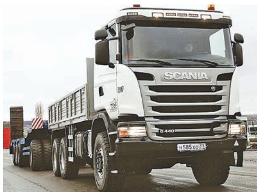
Новый тягач настоящий богатырь