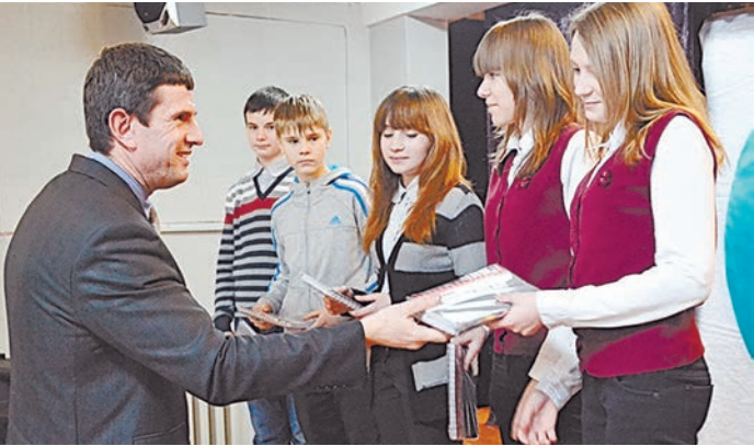
Школьники признались, что благодаря фотокроссу по-новому взглянули на родной город