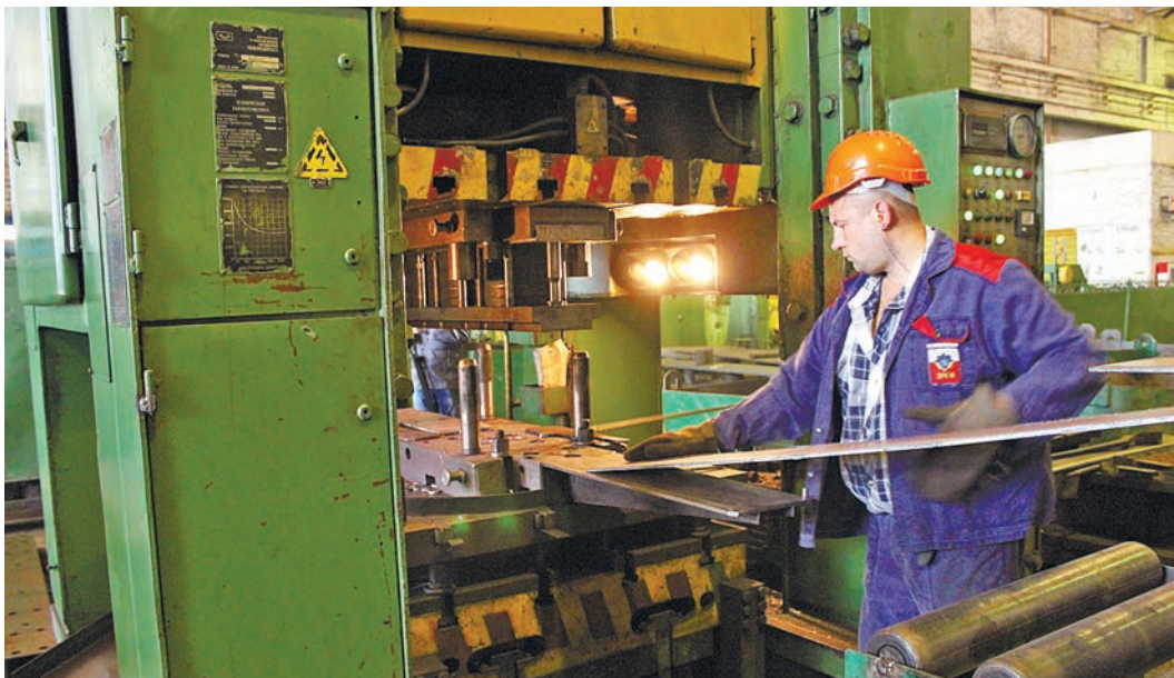
Завод по ремонту горного оборудования продолжает заниматься развитием и совершенствованием ремонтов оборудования своего основного заказчика – Михайловского ГОКа