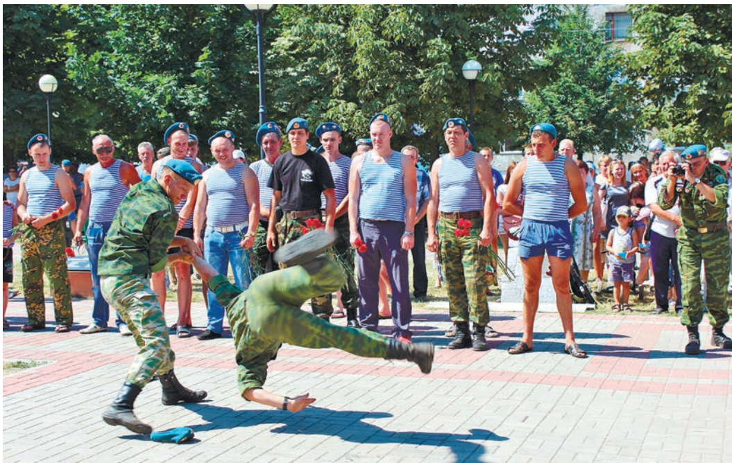
Показательное выступление военно-патриотического клуба «Витязь» на День ВДВ в 2014 году.