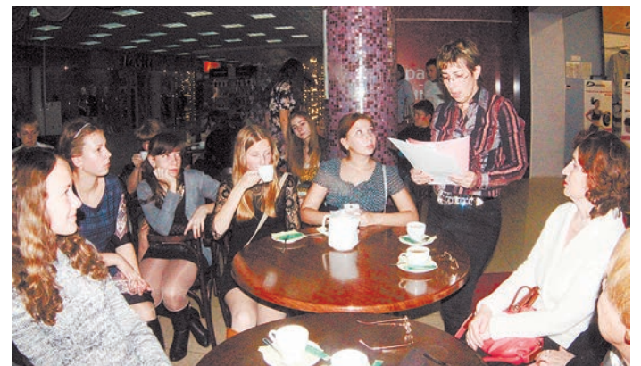
Открытие второй книжной полки в одном из городских кафе

У нас множество школьных и публичных библиотек. И мероприятия, которые проходят в их стенах, всегда собирают немало посетителей.