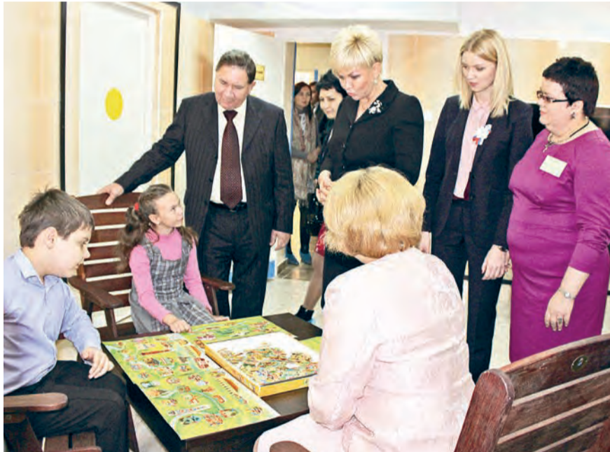
В ингалятории медкорпуса дети могут совмещать процедуры с игрой

гии, в новом медицинском корпусе будут проводиться также иммуностимулирующие и общеукрепляющие процедуры. Новое здание оснастили первоклассным медицинским оборудованием, специализированной мебелью, техникой, лечебно-игровым и спортивным инвентарем. Для проведения широкого спектра процедур в корпусе теперь есть душ Шарко, восходящий, дождевой, циркуляционный душ, стоматологическая установка, ванна для подводного гидромассажа и вытяжения позвоночника с подъемником, концентратор кислорода, аппараты ультразвуковой физио-, СМВ- и магнитотерапии, галогенатор, плановизор, негатоскоп, озокерит- и парафинонагреватель и многое другое. Залы восстановительного лечения оснащены брусками, шведскими стенками, игровыми лабиринтами и лестницами, дидактическими ковриками и мягкими модулями, массажными мячами и физио-роллами, беговыми дорожками и велотренажерами, имитаторами ходьбы «Имитрон» и другим оборудованием. Особенно важным приобретением стали уникальные приборы для пассивной разработки суставов, подобных которым нет ни в одном реабилитационном центре Курской области.