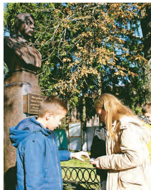
Еще один адрес игры - памятник первому директору