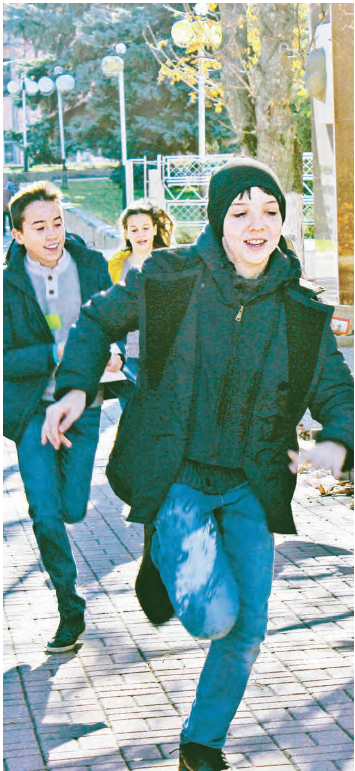
Вперед, навстречу приключениям!

А весело, интересно и познавательно. Это доказали активисты Школы полезного действия Металлоинвеста, которые устраивали увлекательные квесты по истории Михайловского ГОКа для школьников Железнодорожского и Курска.