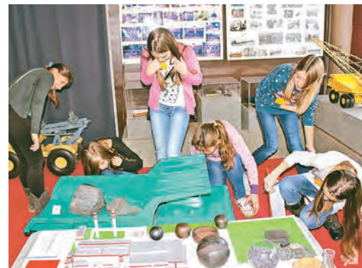
Где очередная подсказка? Наверно, под самосвалом?