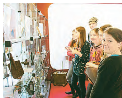
Разгадка спрятана в экспонатах музея