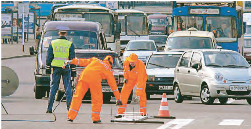
Своевременный ремонт делает дороги безопаснее

«НАРОДНАЯ ЭКСПЕРТИЗА» «ОБЩЕРОССИЙСКОГО НАРОДНОГО ФРОНТА» (ОНФ) НАЗВАЛА РЕГИОНАЛЬНЫЕ СТОЛИЦЫ, ЛИДИРУЮЩИЕ ПО УРОВНЮ СМЕРТНОСТИ НА ДОРОГАХ. НАШ РЕГИОН В НЕМ НЕ ОТМЕЧЕН, НО ЕСТЬ ПОВОД ПОГОВОРИТЬ О БЕЗОПАСНОСТИ И НА НАШИХ ДОРОГАХ.