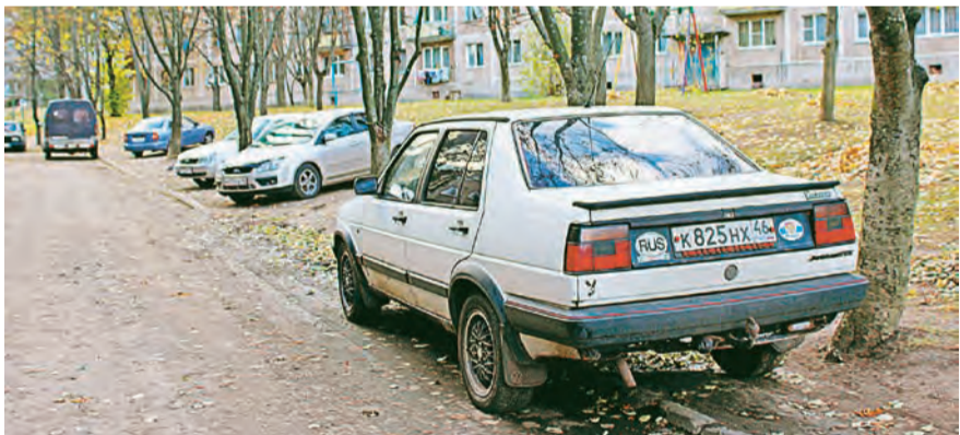
Вот так паркуют машины во дворе дома 19/2 по улице Гагарина

вот, уже весной 2015 года перед домом появилось 18 законных парковочных мест, к которым теперь прибавилось еще три и обновленная пешеходная тропинка. В планах жильцов – посадить новые деревья, разбить клумбы вокруг площадки, а также сделать карниз. Выходит, все не так сложно, как кажется на первый взгляд. Главное – сплоченность и инициативность жителей дома. Увидев, каким парковочное место должно быть в идеале, мы отправились на смотр проблемных территорий. Двор Гагарина, 19/2. Парковочное место не благоустроено. Точнее сказать – парковки тут нет вообще! Машины просто напросто въезжают на газон. Водителей неоднократно штрафовали. Специалисты утверждают, что на этом месте еще не скоро прорастет трава. А вот у дома №3 по ул. 21 Партсъезда разрешение на благоустройство стоянки имеется. И дано оно аж в 2006 году! Но за все это время единственное, что сделали жильцы – это засыпали территорию щебнем, а такое покрытие сегодня не соответствует нормам, значит, должно быть исправлено.