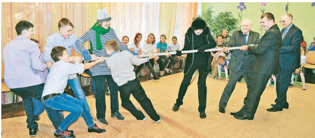
Депутаты городской Думы подарили детям настоящий праздник