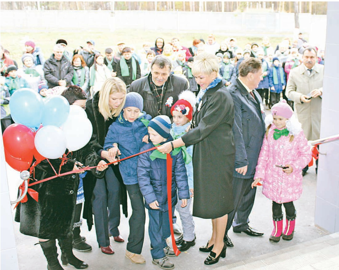
Вход в новый дом здоровья открыт

В школе-интернате № 2 Курска открылся медицинский корпус, реконструированный при поддержке Благотворительного фонда Алишера Усманова «Искусство, наука и спорт».