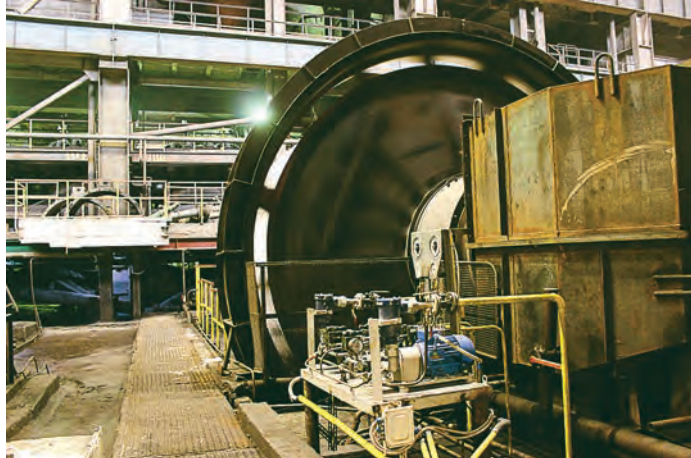
Новая мельница обладает большими размерами, соответственно большей вместимостью. Это дает больше продукции на выходе

Помольный агрегат производства Новокраматорского машиностроительного завода поступил на фабричный комплекс комбината в рамках инвестиционной программы Металлоинвеста по техническому перевооружению предприятий Компании. Корпус №2 отделения мокрого магнитного обогащения ДОКа - одно из основных звеньев в цепочке по производству концентрата. Здесь в гигантском цехе крутятся десятки мощных шаровых мельниц, напоминающих барабаны. Внутри них - руда, которая уже прошла первый этап крупного, среднего и мелкого дробления и теперь разбивается в мельницах на более мелкие фракции. Разрушение рудного материала происходит в результате ударов и истирания кусков породы помольными шарами внутри крутящегося барабана. Именно здесь, среди десятков других, притаилась новая мельница. На первый взгляд может показаться, что она ничем не отличается от остальных - такой зрительный эффект создает непрерывное вращение строя барабанов в цехе. - Новая мельница отличается размерами, а значит и вместимостью, - сказал начальник