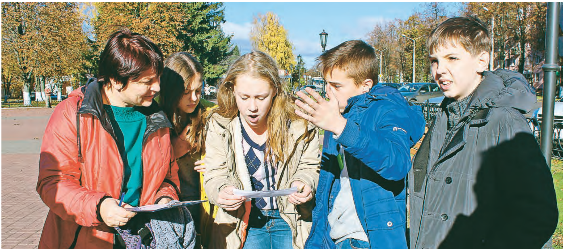
«Сто метров на юго-восток - это в сторону парка или к центру города?» - этот вопрос ребята решали долго, но вспомнили, что в помощь им был дан компас