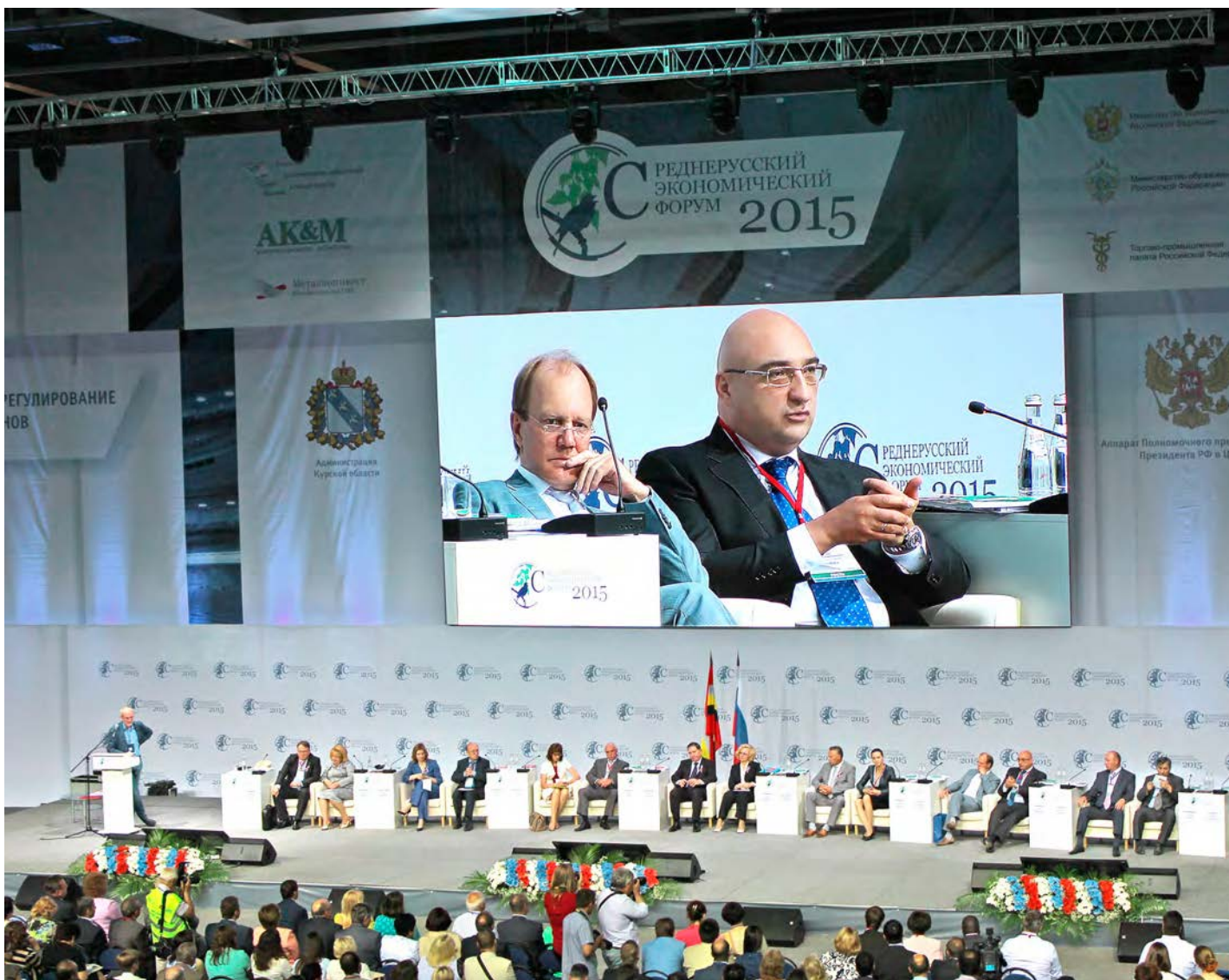
Среднерусский экономический форум - стержневое событие в экономической и политической жизни регионов средней полосы РФ

Сегодня в Курске открылся V Среднерусский экономический форум. Компания «Металлоинвест» вновь выступила его генеральным партнером.