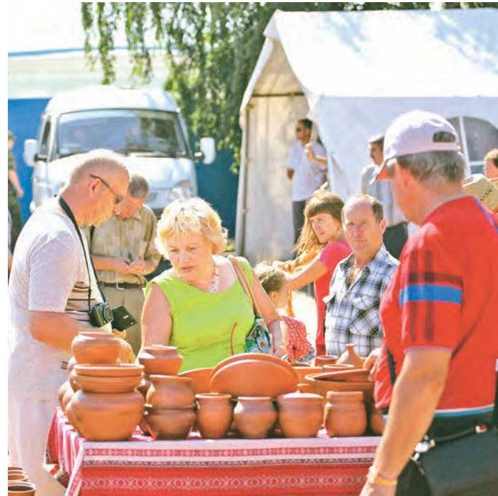
Курская Коренская ярмарка традиционно привлекает много людей

ГОКа. Практически по каждому аспекту у представителей компании и МГОКа есть важные знания и опыт, которыми они готовы поделиться с другими участниками форума. Организована прямая трансляция с места событий. Каждый желающий сможет увидеть открытие и проведение форума на главной странице, по ссылке http://www.sef-kursk.ru/2016/index.jsp . Начало трансляции в 10:00.