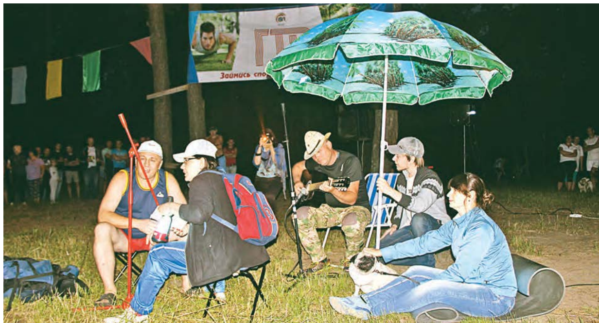
Вот такой «турпоход» организовала команда УЗ-УПКР к творческому конкурсу