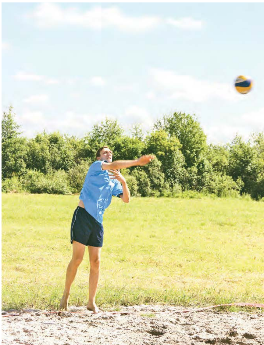
Пляжный волейбол - одна из любимых игр многих спортсменов МГОКа