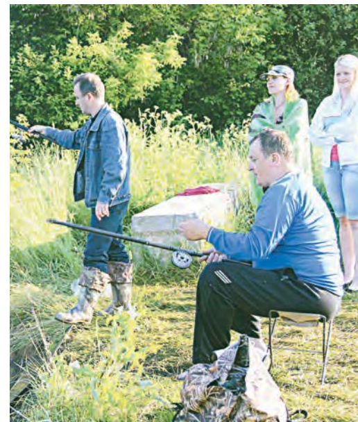
Проснуться в 5 утра? Легко!