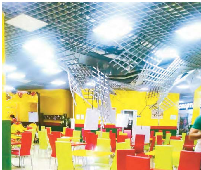
На момент обрушения потолка посетителей в кафе ТЦ не было