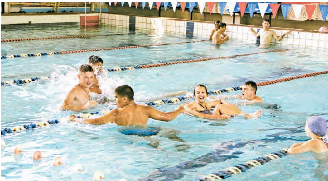
Ребята радостно и весело провели время на голубых дорожках «Нептуна»