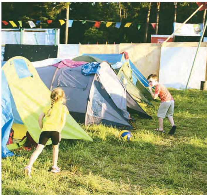
Активный отдых на природе - с самого детства