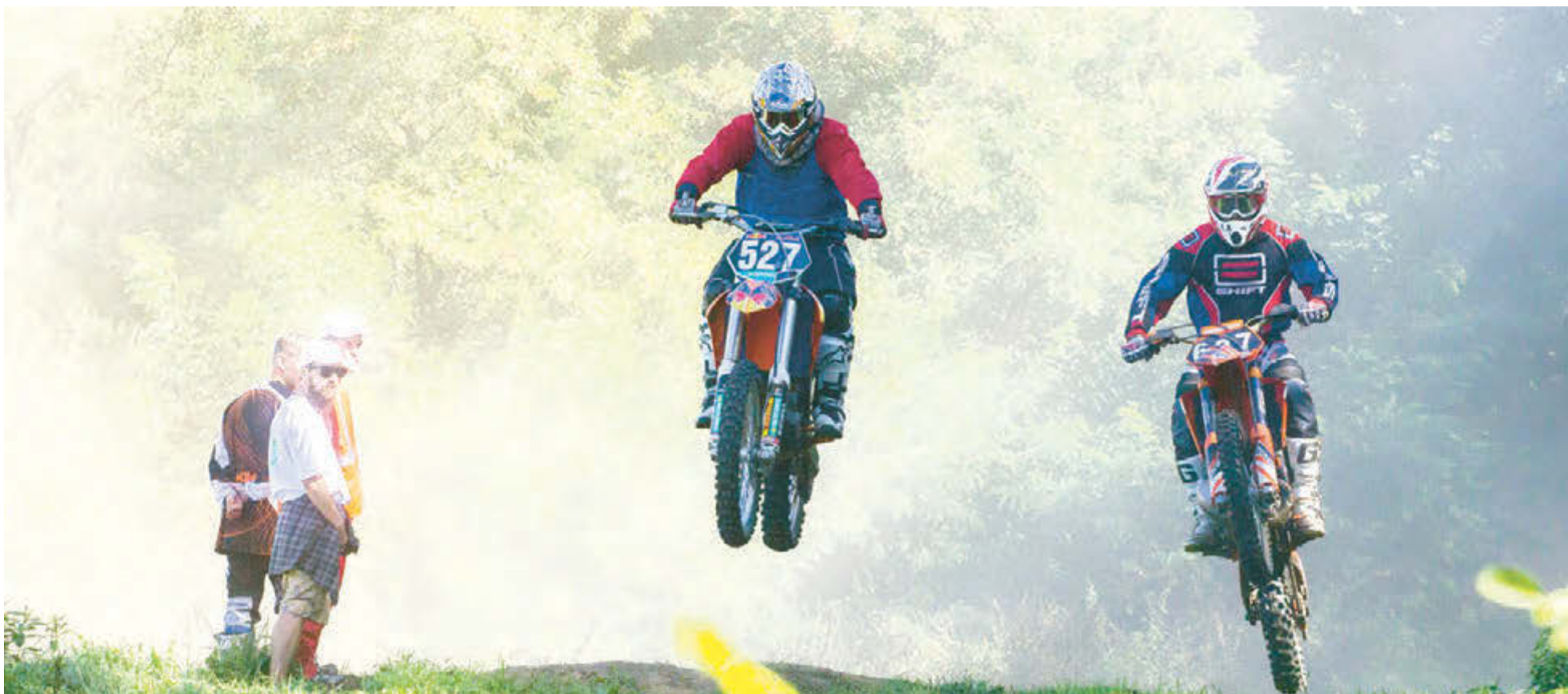
Состязания на земле и в воздухе: чтобы «подпрыгнуть» на трамплине и мягко приземлиться, нужно тренироваться несколько лет.