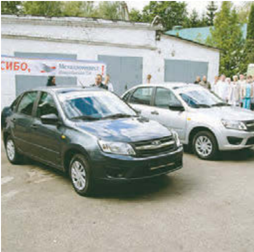
На колесах добраться к пациентам гораздо проще

15 сентября компания «Металлоинвест» вручила Городской больнице № 1 два новых автомобиля для участковых врачей.