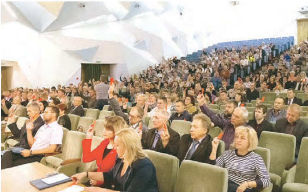
Работа профсоюзной организации МГОКа признана удовлетворительной