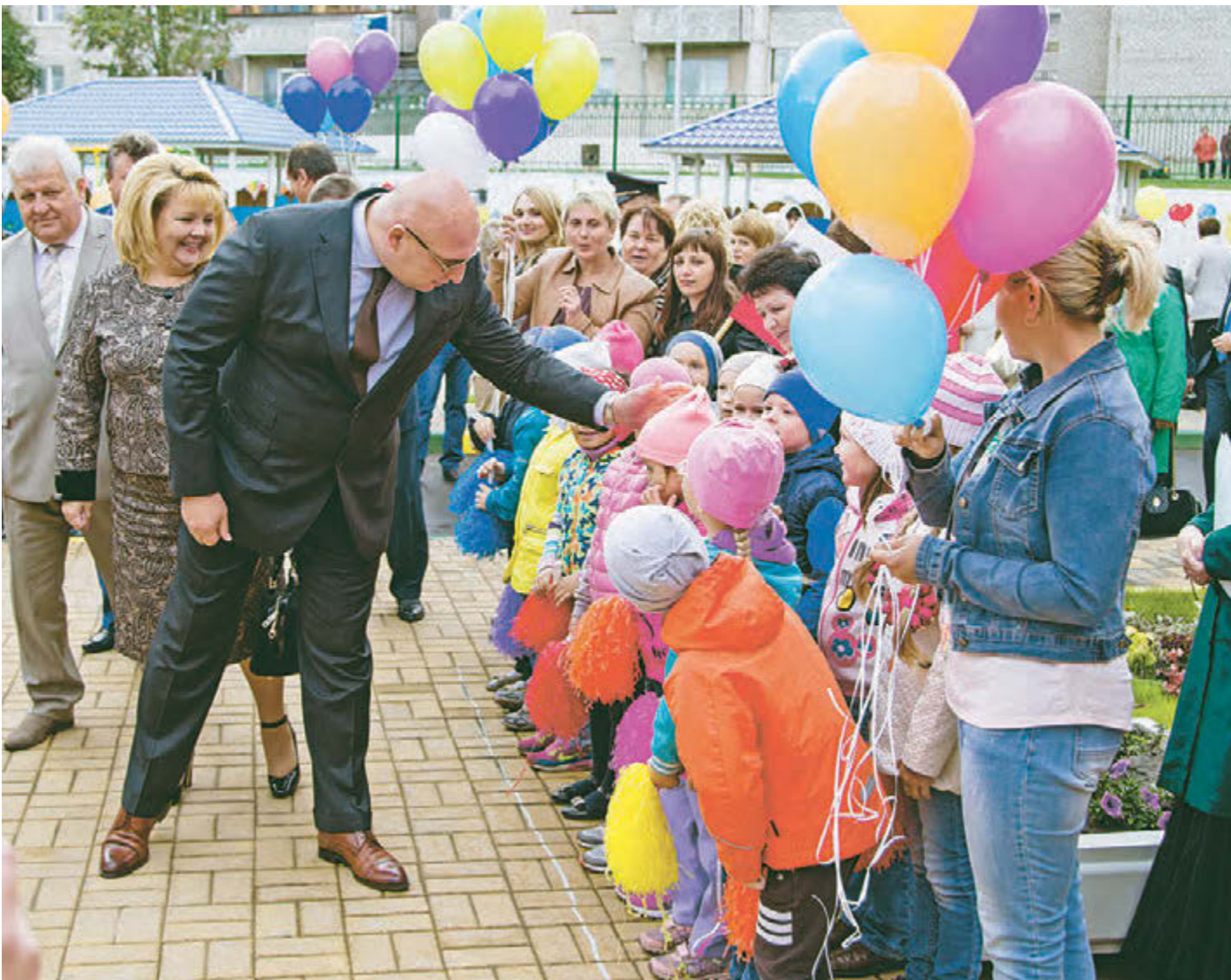
На просторной территории нового детсада развернулось настоящее торжество для детей и взрослых

В 12-а микрорайоне в присутствии большого количества гостей и жителей близлежащих домов торжественно открыли детский сад № 2 комбинированного вида «Капитошка».