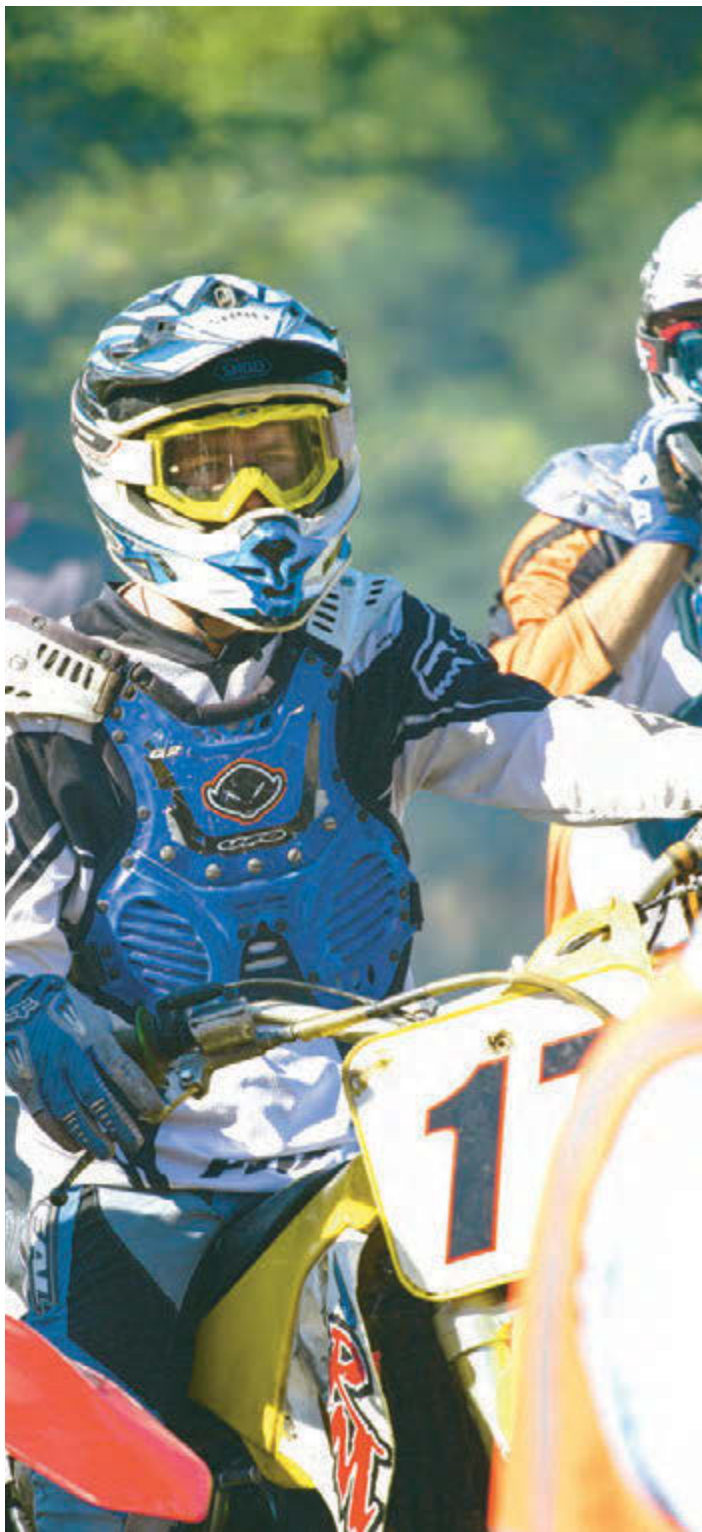
Участники соревнований на старте заезда

11 сентября на трассе поселка Студенок прошли ежегодные соревнования по мотокроссу «Молодежь против наркотиков». В состязании участвовало 67 мотогогонщиков из Центрального Черноземья.