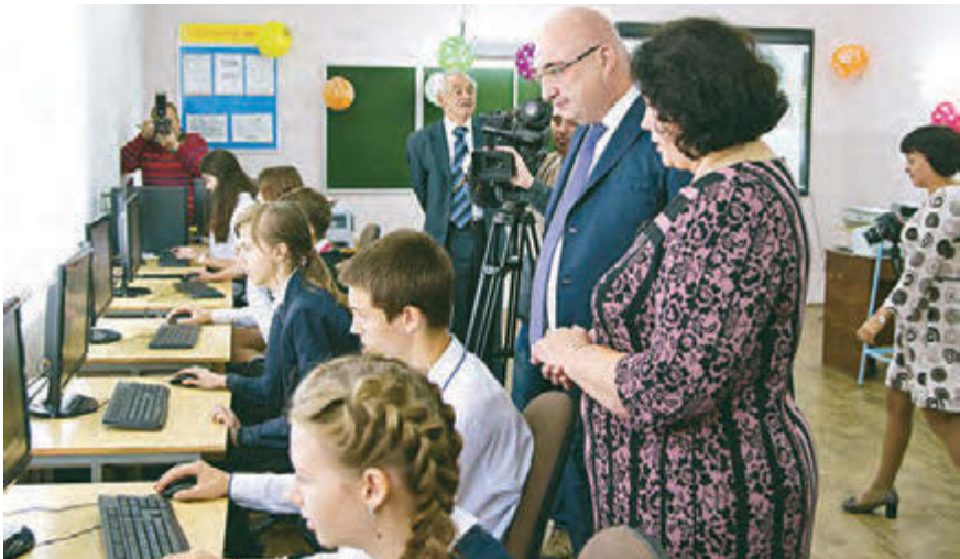
Школьники с неподдельным интересом осваивают новое оборудование компьютерного класса

В школе № 6 Металлоинвест в рамках системной поддержки городского образования открыл новый компьютерный класс.