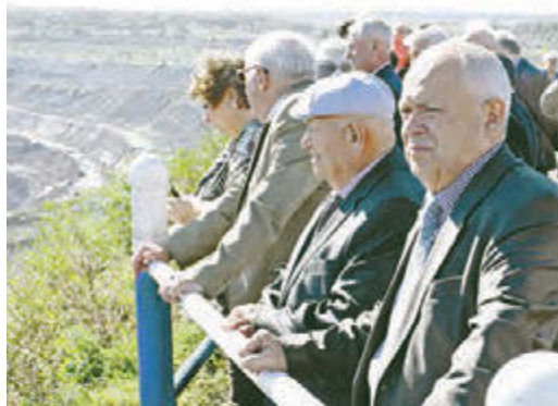
Масштабы карьеры МГОКа очень впечатлили гостей