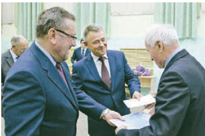
Руководители сердечно поздравили ветеранов

Бывшие железнодорожники сейчас находятся на заслуженном отдыхе, но всегда рады возможности встретиться и вот