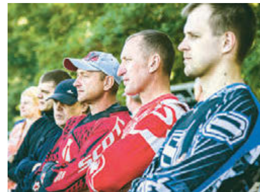
Опытные гонщики болеют за своих юных товарищей