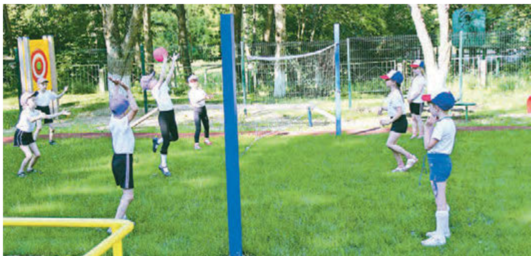
Реализация программы «Здоровый ребенок» позволила улучшить спортивные площадки детсадов