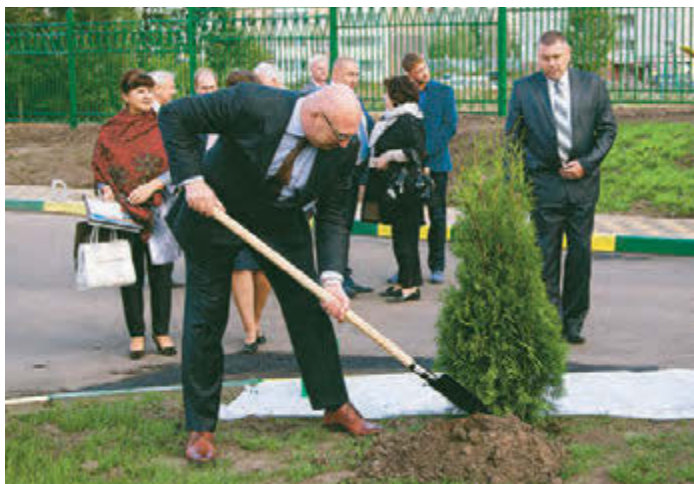
Дом для детей построен. Теперь нужно посадить дерево

- Открытие нового детского сада – очень своевременное событие. Замечательно, что жители новых микрорайонов получили детский сад шаговой доступности. Это – важное условие ком-