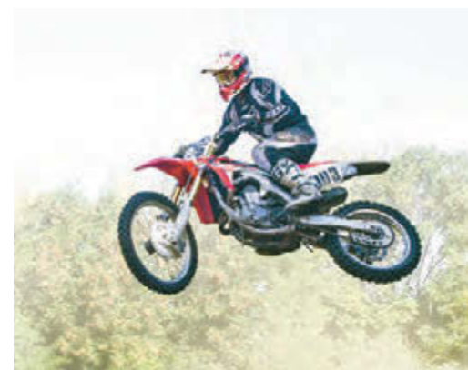
На трамплине мотокроссменов взлетает на 3-5 метров!