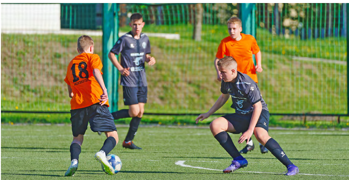
▲ В первом матче турнира железногорская команда (в оранжевой форме) уверенно переиграла белорусов со счётом 3:0

Накануне Дня Победы Михайловский ГОК провёл традиционный международный детский футбольный турнир. В этом году в Железнодорожск впервые приехала команда из белорусского Жодино.