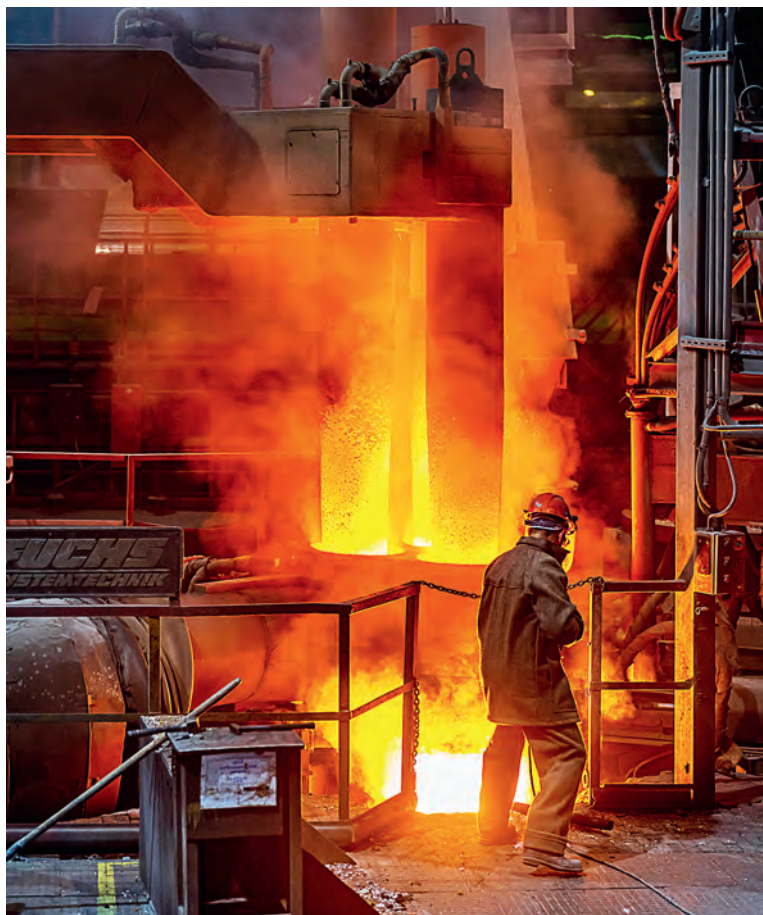
▲ Выплавка стали в оскольских электропечах с использованием железа прямого восстановления позволяет снизить нагрузку на экологию

Елена Филатова