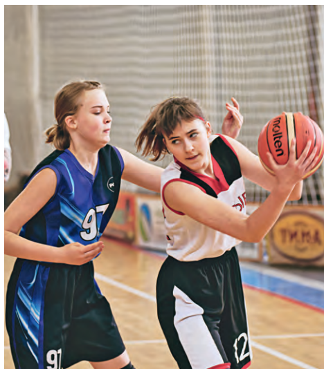
▲ На всём протяжении турнира на баскетбольной площадке шла напряжённая, бескомпромиссная борьба