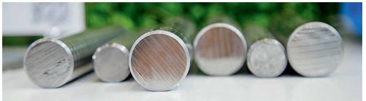
▲ Из оскольской стали производят самые важные узлы и агрегаты, способные выдерживать повышенные нагрузки

— Контрагент направляет нам запрос, предоставляет пакет документов. Далее его проверяет наша служба безопасности. По-