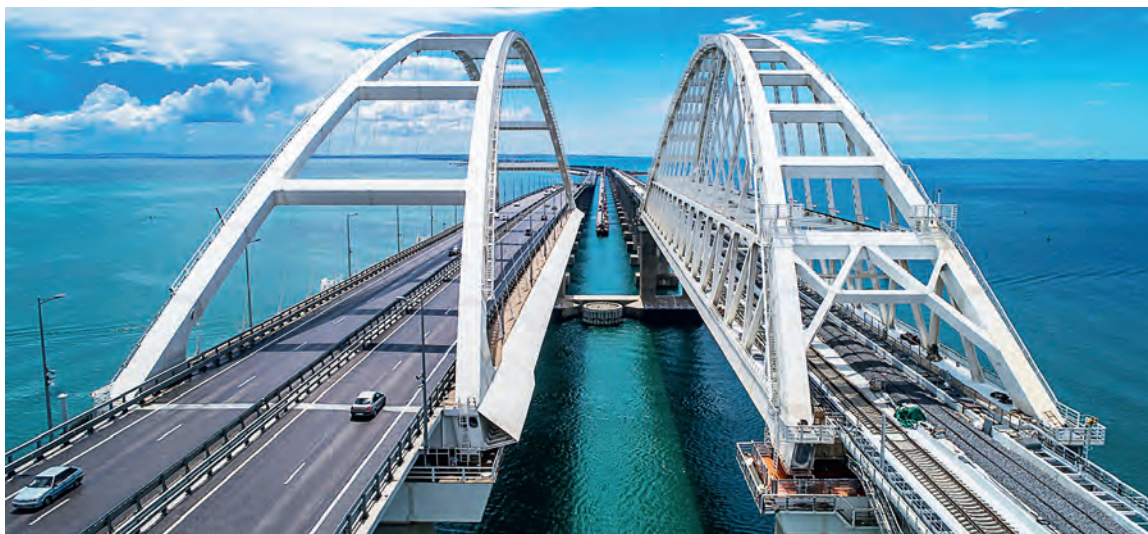
▲ Металлоконструкции моста через Керченский пролив весят 260 тысяч тонн. Есть в них и оскольская сталь

Важно помнить, что цель цифровизации не в замене сотрудника на машину, а в облегчении труда человека. А тот, кто готов слушать и слышать, постоянно узнавать новое и учиться, не оста-