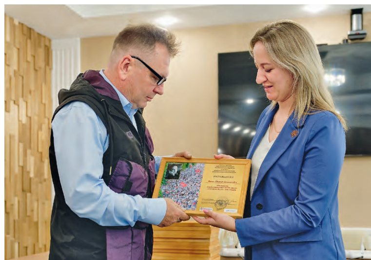
▼ Награды от Металлоинвеста получили 16 лауреатов конкурса

няя, — отметила главный специалист группы внешних социальных программ Михайлов-