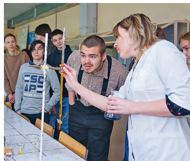
▲ Для абитуриентов ЖГМК провели экскурсию по учебным аудиториям и продемонстрировали современные условия обучения

Мария Коротченкова