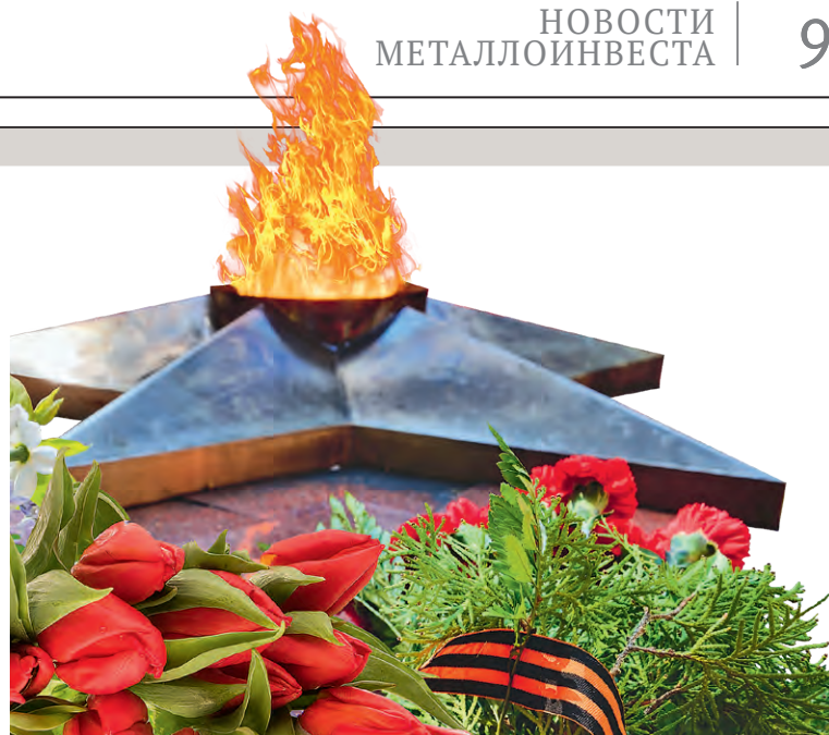
▲ Ежегодно горожане, отдавая дань подвигу павших в годы войны, приносят цветы к Вечному огню на мемориале Большой Дуб