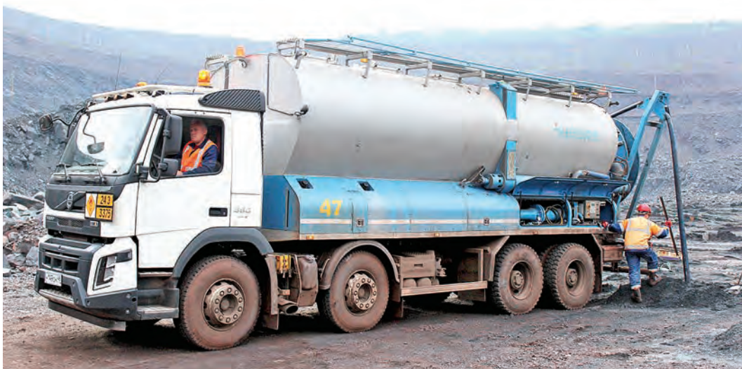
Новая ТСЗМ трудится в южном карьере

В карьере Михайловского ГОКа успешно трудится новая транспортно-смесительно-зарядная машина, поступившая в рамках программы обновления производственных мощностей предприятий Металлоинвеста.