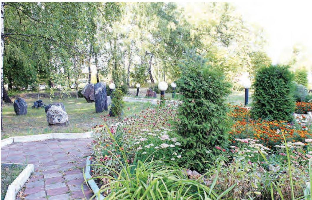
Сквер им. 50-летия РУ знаменит красивыми клумбами и уникальным садом камней

время, когда живой уголок будет работать. Порадовало, кстати, и бережное отношение работников к улучшениям на промплощадке. В отремонтированных год назад нарядной и комнате приема пищи по-прежнему чисто и красиво. АБК рудоуправления тоже встретило нас работающим на площади фонтаном. Он создавал особое настроение – захотелось на скамеечку в парк и мороженого. Тележки с мороженым поблизости не оказалось, зато парк с лавочкой – пожалуйста! Сквер имени 50-летия РУ давно славится своей тенистостью и красотой – здесь так хорошо отдохнуть в свободную минутку. Ухоженные клумбы не уступают своим разноцветьем городским фитокомпозициям. Вымощенные плиткой дорожки, удобные лавочки, стильные фонари – все создает приятную атмосферу уюта и покоя, который порой столь необходим в суете рабочих будней. Но самая главная «фишка» – знаменитый сад камней, в котором, при помо-