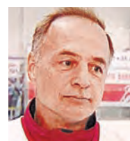
Илья Бякин олимпийский чемпион по хоккею, трехкратный чемпион мира, заслуженный мастер спорта СССР: