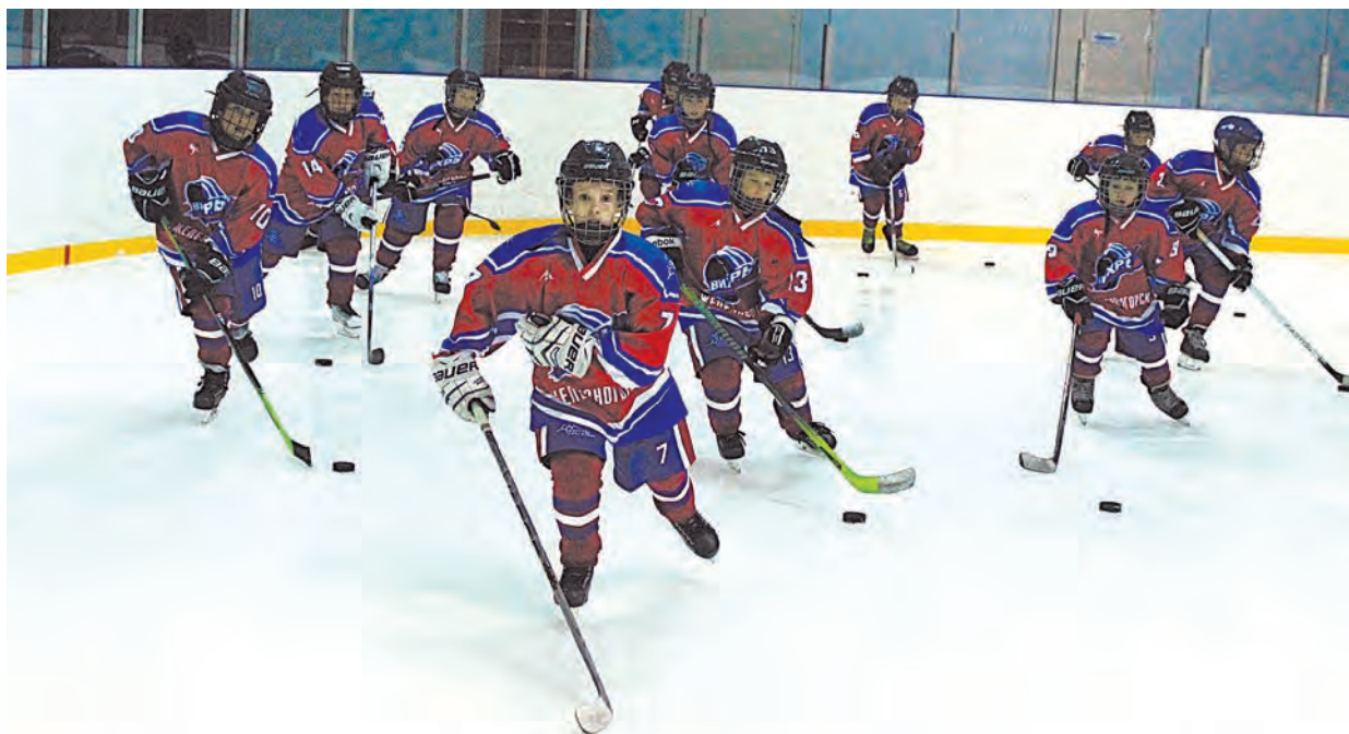
Новая яркая форма сделала наших хоккеистов самыми заметными на льду

- В хоккей меня привел папа, и мне сразу понравилась эта игра. Очень интересно быть вратарем – нравится ловить шайбы, правда, когда проигрываем, появляется какая-то спортивная злость и азарт. Сегодня нам подарили очень красивую форму с новым логотипом. Надеюсь, эта форма принесет нам удачу.