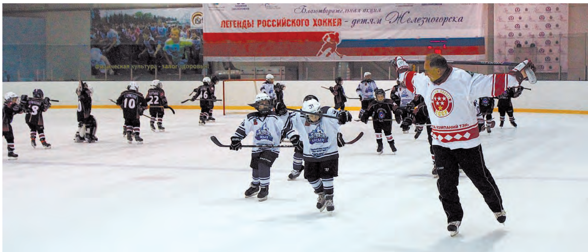
Бесценный опыт: мастер-класс олимпийского чемпиона Ильи Бякина

Без сотрудничества компании «Металлоинвест», фонда «Искусство, наука и спорт», Михайловского ГОКа, администраций Железногорска и Курской области решение многих вопросов в нашем городе было бы невозможным. Город ежегодно получает огромную поддержку по трехстороннему соглашению, у нас строятся социально-значимые объекты. Помимо этого, фонд Алишера Бурхановича Усманова проводит очень полезные, хорошие и нужные мероприятия. Благодаря этой работе у железногорцев есть возможность видеться с именитыми спортсменами, знаменитыми артистами, людьми искусства. Такая поддержка дорогого стоит.