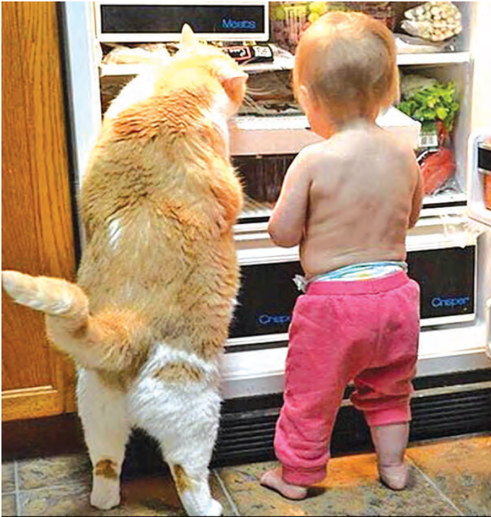
Кот плохому не научит

Ленивый человек способен справиться даже с самой сложной задачей. Поверьте, он отыщет самый легкий путь