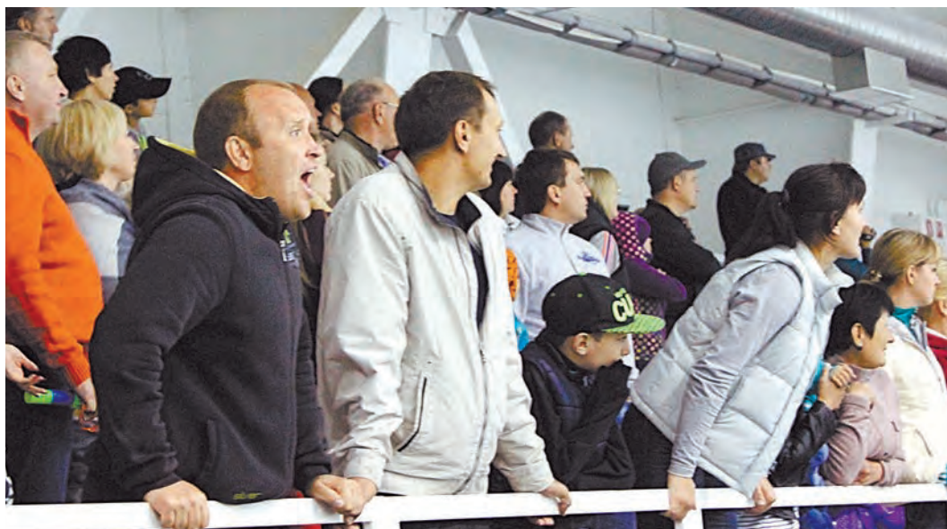
Болели за своих всей душой