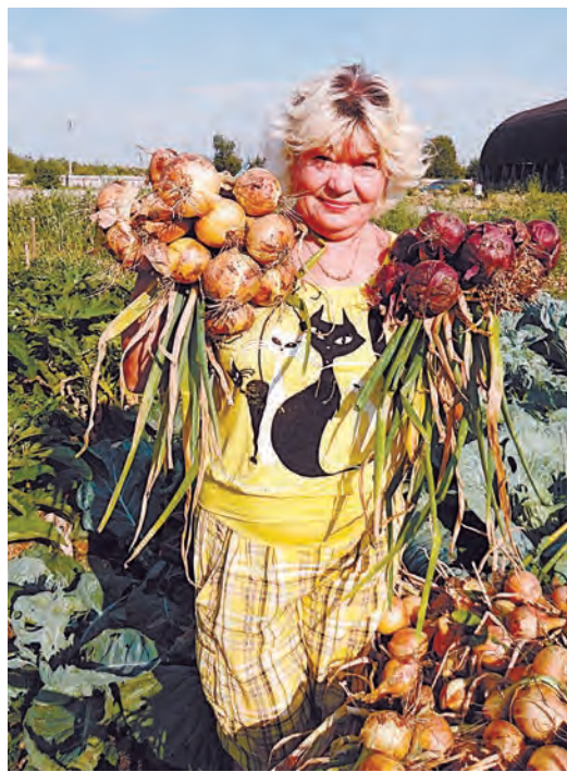
...летом дает вот такой урожай!

раньше, чем посаженный весной и дает, как правило, одну крупную луковицу независимо от сортовых особенностей. Растения обычно не повреждаются луковой мухой, т.к. к началу ее лёта на донце севка образуются большая