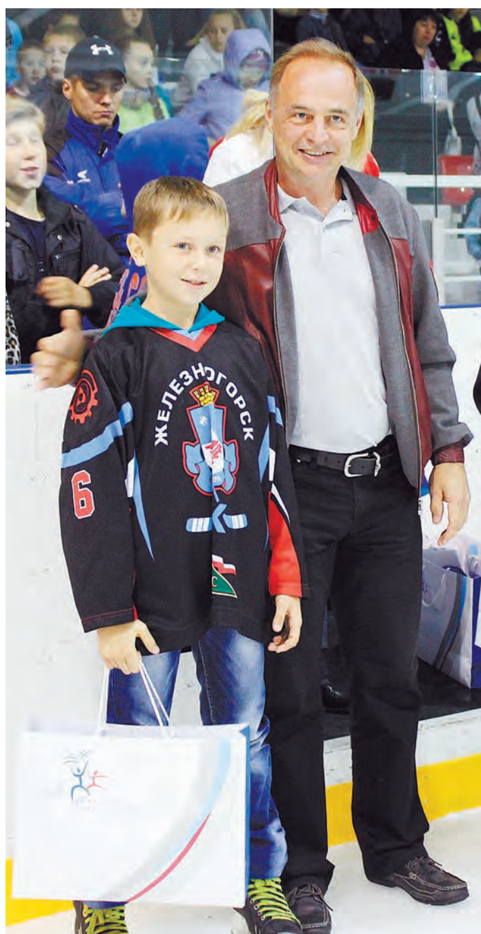
Волнующий момент вручения новой формы

5 СЕНТЯБРЯ в ледовом катке «Юбилейный» состоялся яркий праздник хоккея, главным героем которого стал олимпийский чемпион по хоккею, ТРЕХКРАТНЫЙ ЧЕМПИОН МИРА, ЗАСЛУЖЕННЫЙ МАСТЕР СПОРТА СССР Илья Бякин. Звезда советского и мирового хоккея вручил юным хоккеистам Железногорска новую командную форму, изготовленную при поддержке фонда Алишера Усманова «Искусство, наука и спорт».