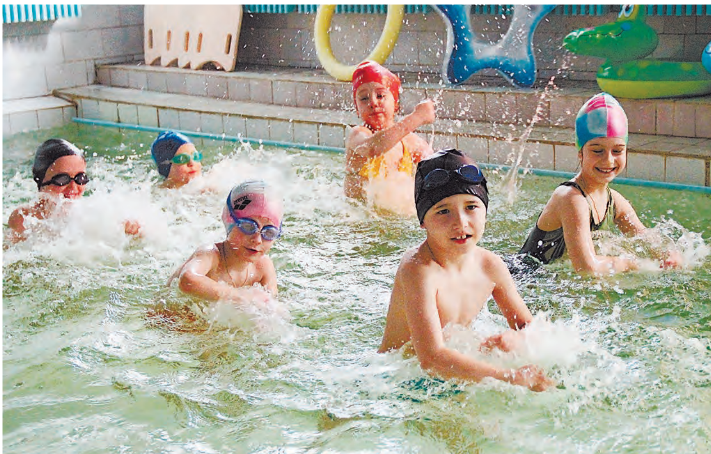
Мы – за здоровый образ жизни!

Участники конференции «Программа «Здоровый ребёнок»: ФОРМИРОВАНИЕ УСЛОВИЙ РАЗВИТИЯ ЗДОРОВОГО ПОКОЛЕНИЯ» ПОДВЕЛИ ИТОГИ РЕАЛИЗАЦИИ ПРОЕКТА, ОБОБЩИЛИ ОПЫТ И НАМЕТИЛИ ПЛАНЫ НА БУДУЩЕЕ.