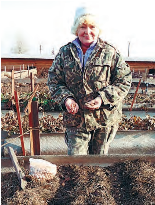
Подзимняя посадка лука-севка...

ют на незатопленных участках, хорошо освещенных солнцем. Под посадку вносят по 0,5 ведра перегнившего компоста и по 1 стакану золы на 1 м 2 . Затем формируют грядку, слегка уплотняют ее поверхность и делают бороздки глубиной 3-4 см с расстоянием между ними по 12 см. При более мелкой посадке луковицы весной могут быть выперты из почвы. Перед посадкой лук-севок замачиваем в Фитолавине, Фармо-йде, ЭМ-Востоке, в «Сиянии». Севок раскладывают в бороздки через 3-4 см друг от друга и засыпают перегноем или рыхлой почвой, сверху мульчируют торфяной крошкой или прикрывают листьями. А чтобы весной с этой грядки получить еще и лук на перо, осеннюю посадку севка можно и загустить, сажая его в борозды через 2 см друг от друга. В мае надо вырывать лук на перо через растение, и дальше он будет расти при нормальной площади питания. Когда выпадет достаточное ко-