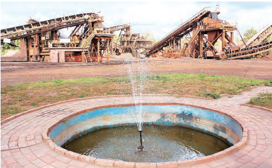
Тот самый фонтан, где живут черепахи