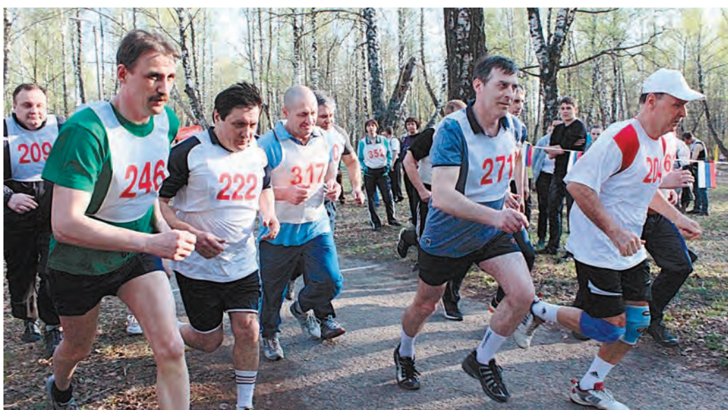
Стартуют руководители подразделений