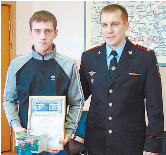
За неравнодушие и сознательность - подарок от полиции

В МО МВД России «Железнодорожный» наградили 19-летнего железнодорожника. Начальник отдела выразил ему благодарность за активную гражданскую позицию и помощь полиции при задержании подозреваемых в совершении преступления.