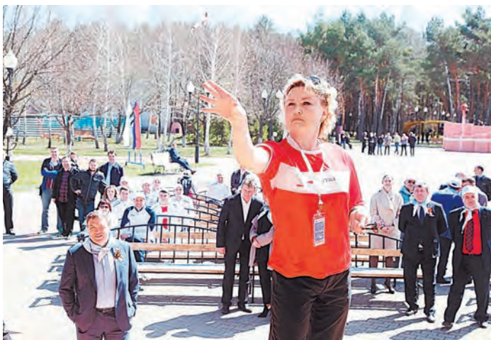
В дартсе ловкость и меткость проявили и женщины