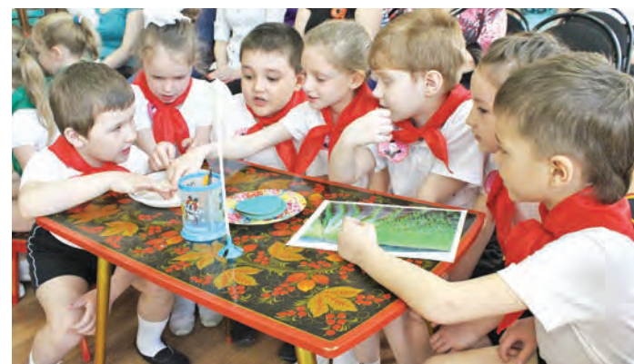
Команда «Знаек» учится распознавать полезные крупы