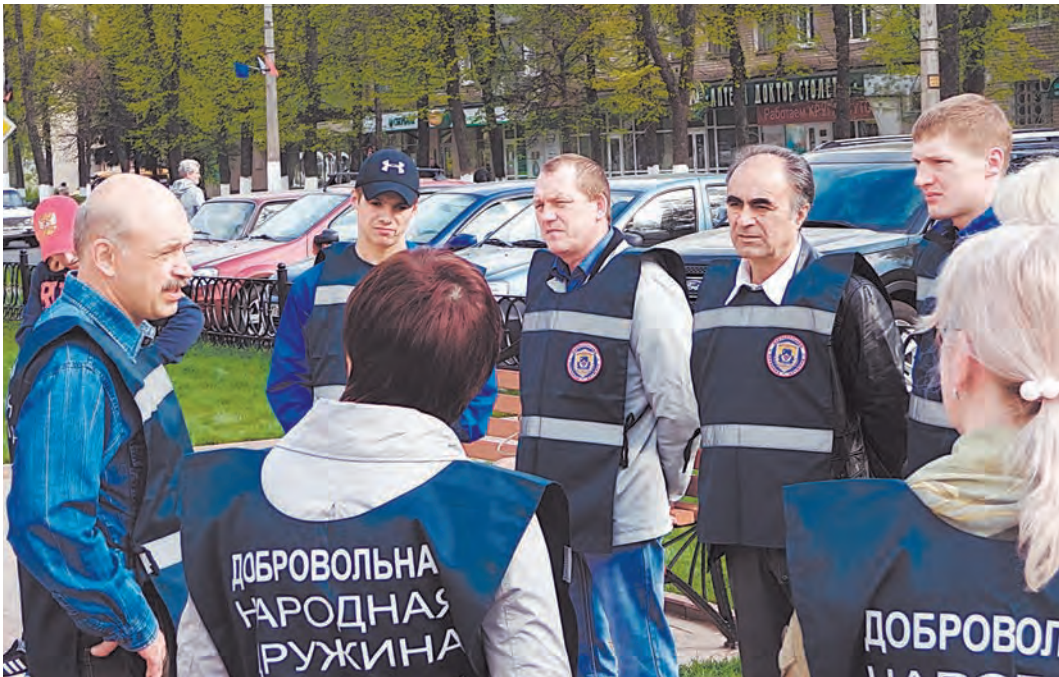
Участники ДНД получают задание перед дежурством

ДОБРОВОЛЬНАЯ НАРОДНАЯ ДРУЖИНА ДЕЙСТВУЕТ В ЖЕЛЕЗНОГОРСКЕ УЖЕ ДВА ГОДА, И ЗА ЭТО ВРЕМЯ ЗАРЕКОМЕНДОВАЛА СЕБЯ КАК ХОРОШАЯ ПОМОЩЬ НАШЕЙ ПОЛИЦИИ.