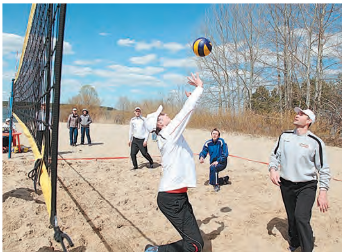
На волейбольной площадке игроки, вопреки погоде, творили чудеса