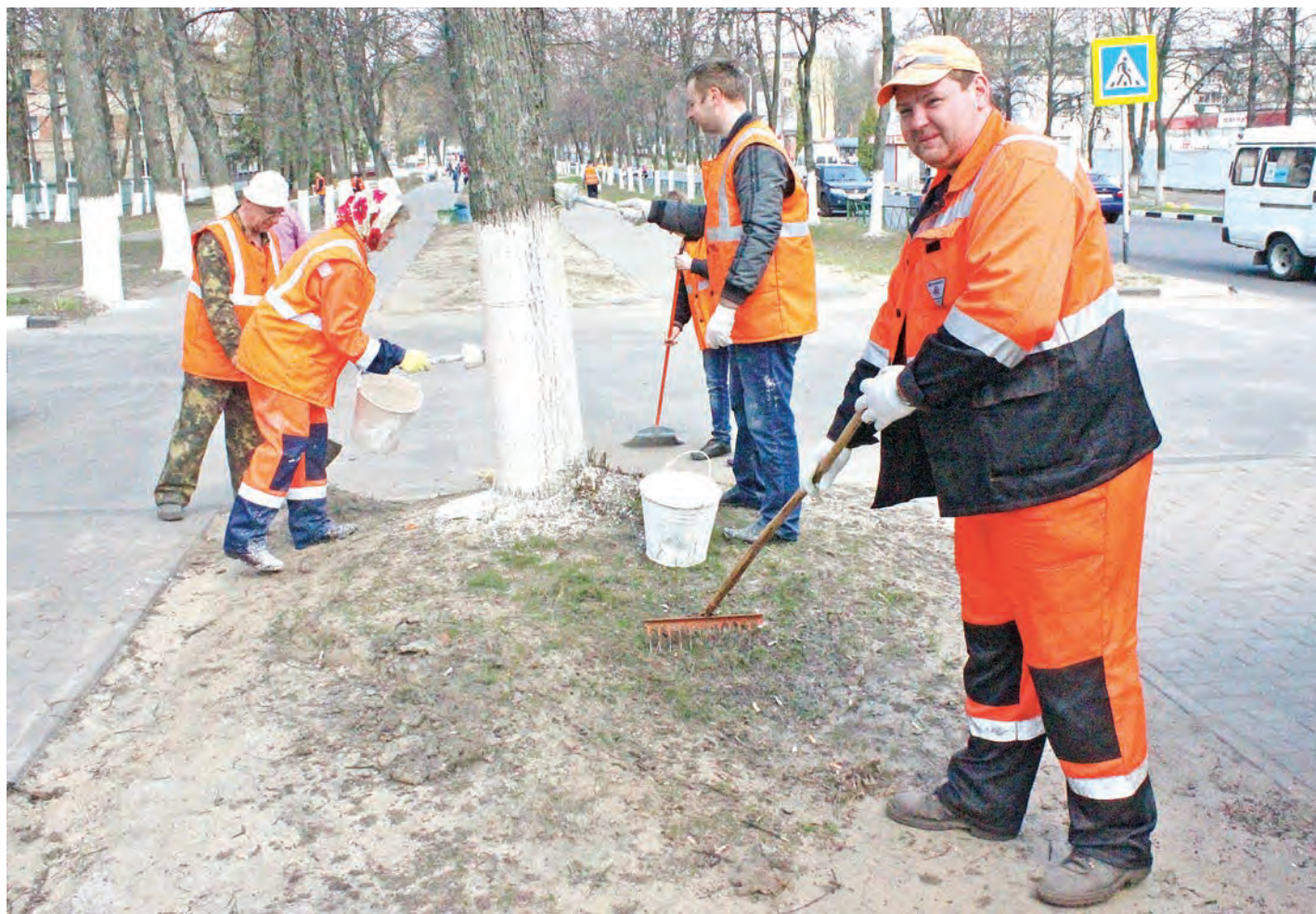
Накануне майских праздников дружный коллектив УЖДТ навел чистоту и побелил деревья в аллеях на большом отрезке улицы Ленина

В РАМКАХ ГОРОДСКОГО МЕСЯЧНИКА ЧИСТОТЫ КОЛЛЕКТИВЫ ПОДРАЗДЕЛЕНИЙ МИХАЙЛОВСКОГО ГОКА НАВЕЛИ ПОРЯДОК НА МНОГИХ ГОРОДСКИХ УЛИЦАХ И В МЕСТАХ ОТДЫХА ГОРОЖАН.