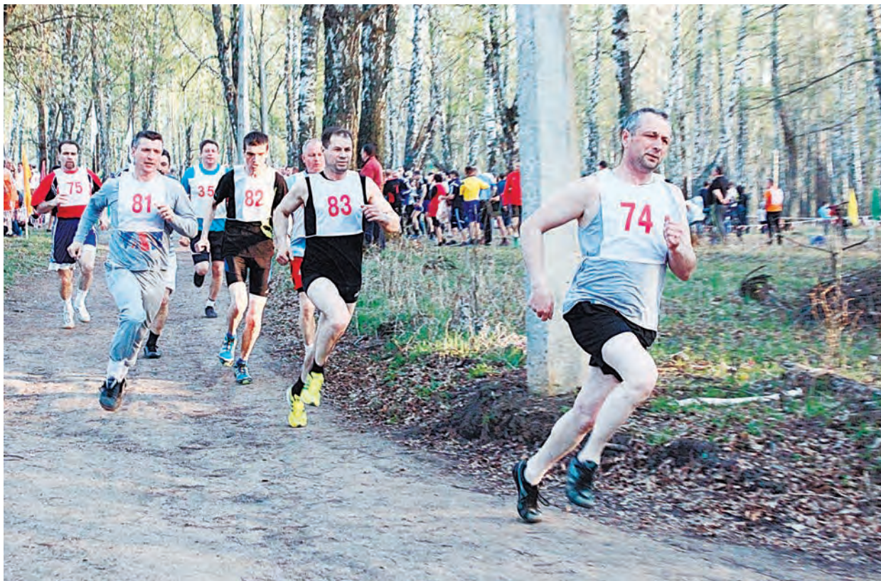
Забег спортивных ветеранов комбината

На этой неделе в городском парке прошел легкоатлетический кросс работников Михайловского ГОКа, в котором участвовали более 500 человек.