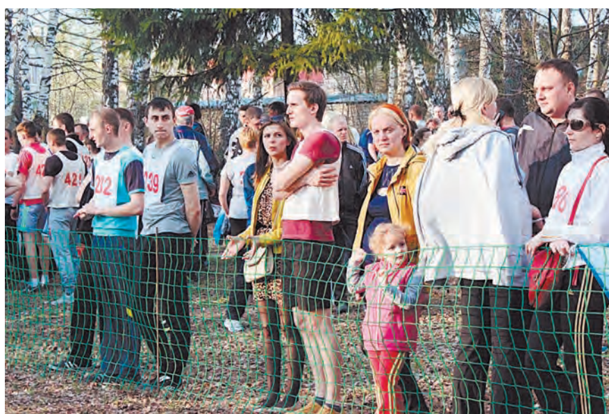
Интересно всем: и участникам, и зрителям от мала до велика

Л егкоатлетический кросс - одно из самых массовых и значимых спортивных мероприятий нашего комбината, уступить которому могут, пожалуй, лишь лыжные гонки. Популярность здорового образа жизни, количество спортивных семей и даже династий на Михайловском ГОКе растет год от года. И в этот день в парке собралось рекордное количество человек - более 500 участников, что в среднем на 80 участников больше, чем в прошлые годы. И почти каждый пришел со своей группой поддержки: семья, родные и близкие. Малыши помогали папам завязывать шнурки на кроссовках, молодые супруги желали друг другу удачи в забеге, - настоящий семейный спортивный праздник, которому очень благоприятствовала и теплая солнечная погода. Уже доброй традицией становится участие в легкоатлетическом кроссе первых лиц комбината, руководителей подразделений. Им предоставляется право первого забега, также, помимо своих основных, они приносят пять дополни-