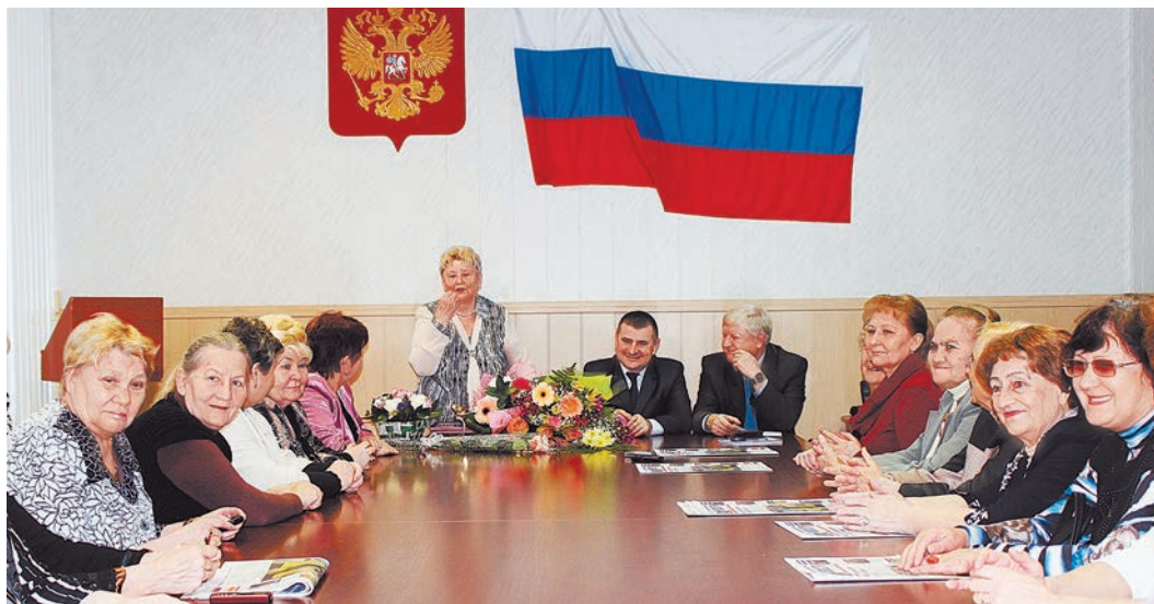
Премия "Золотая птица" - признание многолетних заслуг железнгорского "Союза женщин России"

Перечень мероприятий, проводимых "Союзом женщин России", достаточно