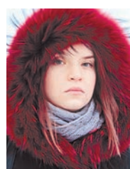
Анна Жительница города, мама двоих детей

На рубеже лет все желают друг другу чего-то важного, необходимого для счастливой жизни. Мы спросили у железнорожцев, чего бы они пожелали городским властям в наступившем новом году.