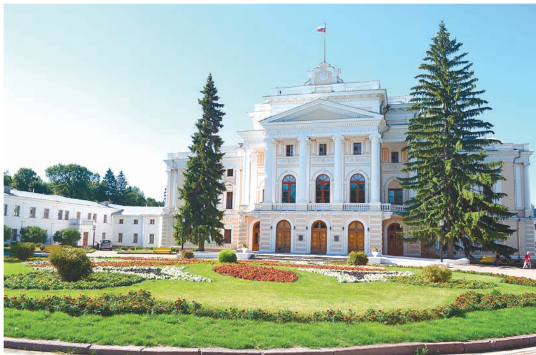
Дворец князей Барятинских - главный корпус санатория «Марьино» - одно из самых прекрасных и знаменитых строений в Курской области.

Серьезно его обустройством занялся сын Барятинского Иван Иванович. Свое имение он фактически отстроил заново - задумал создать усадьбу, ни в чем не уступающую дворцам в Петербурге и Москве. Роскошная усадьба