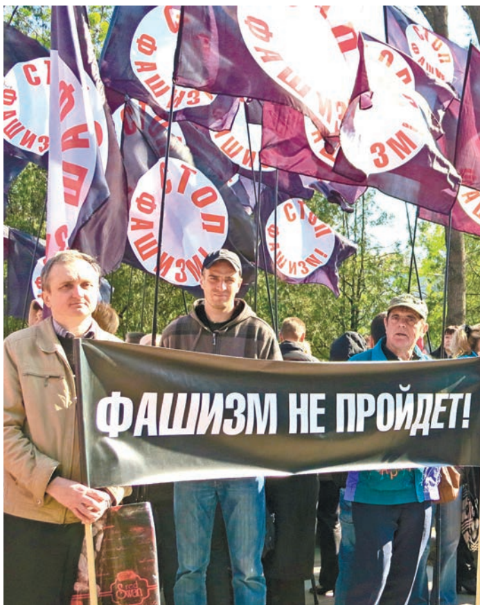
В отпоре нацизму и экстремизму все должны быть едины

Депутаты Госдумы четко определили позицию уважительного отношения к исторической значимости победы России в ВОВ