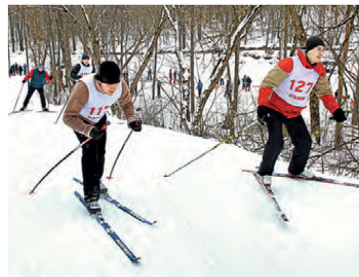
Лыжники ОЭМК рассчитывают на хорошие результаты.