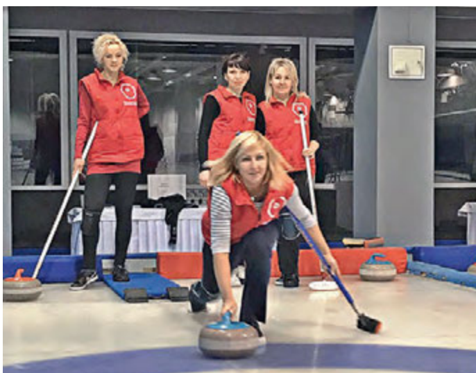
УралМетКом сформировал дружную и сплоченную команду.