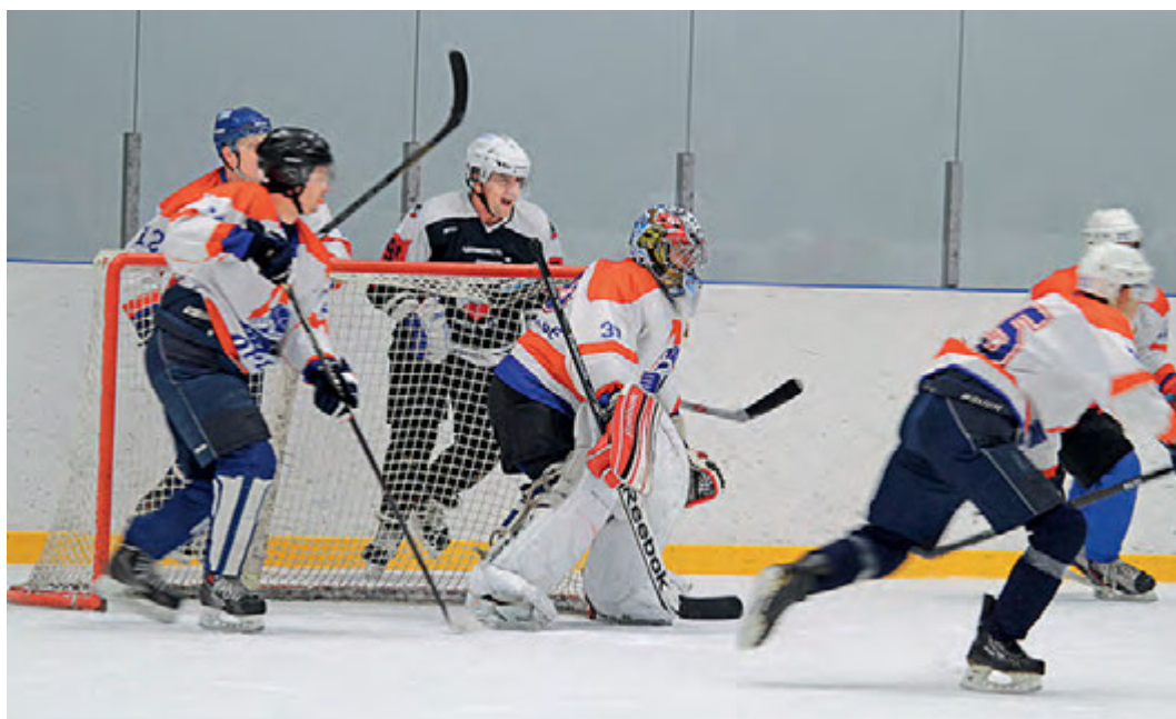
Команда Уральской Стали уверена в своих силах.