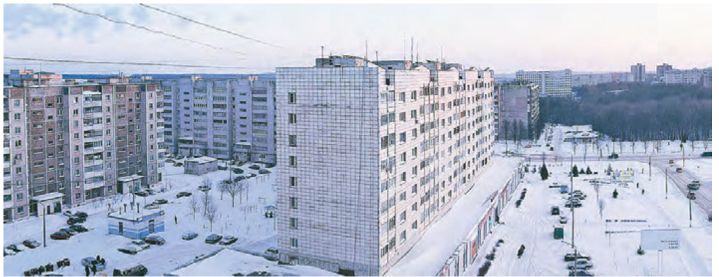
Качество капитального ремонта по-прежнему вызывает у горожан много вопросов.