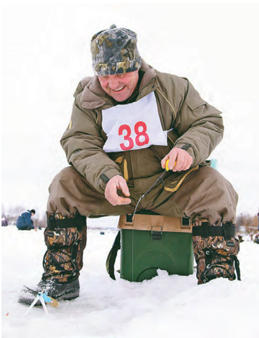
Зимняя рыбалка - это не только соревнование, но и прекрасное настроение.

Уже более десяти лет зимняя рыбалка проводится по инициативе и при организационной поддержке профкома Михайловского ГОКа и спорткомплекса «Магнит». Лед железногорского озера объединяет людей разных профессий. Здесь можно встретить представителей практически всех подразделений МГОКа. Вот и в эти выходные дни на белой глади городского водоема можно было насчитать не одну сотню человек. Сюда пришли и командные игроки, и те, кто привык рыбачить в одиночку. На соревнования по подледному лову многие горняки идут как на пикник, семьями – с женами, детьми и даже домашними животными. Ведь для большинства из них рыбалка – это не столько спорт, сколько хорошая возможность провести на свежем воздухе еще один выходной. В этом году организаторы соревнований постарались построить процесс точно так, как будет на предстоящей корпоративной спартакиаде. Ведь в ее программу подледный лов включен как вид состязаний. Почему бы и не подготовиться? Поэтому система судейства была более строгой. Как только организаторы дали команду «Старт», 14 команд рыбаков, по пять человек в