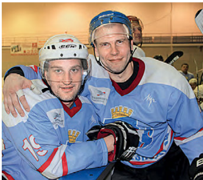
Работники МГОКа готовы к ледовым баталиям.

—Михайловский ГОК был пионером в проведении первых летних игр, и для нас большая честь быть открывателями первой зимней спартакиады компании. Особенно значимо для железнгорцев, что спартакиада проходит в год 60-летия города и Михайловского ГОКа. В рамках социальной политики компании «Металлоинвест» в Железногорске построены замечательные современные спортивные объекты: ледовый каток «Юбилейный», Дворец