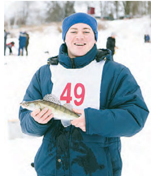
Ну как такому улову не радоваться!