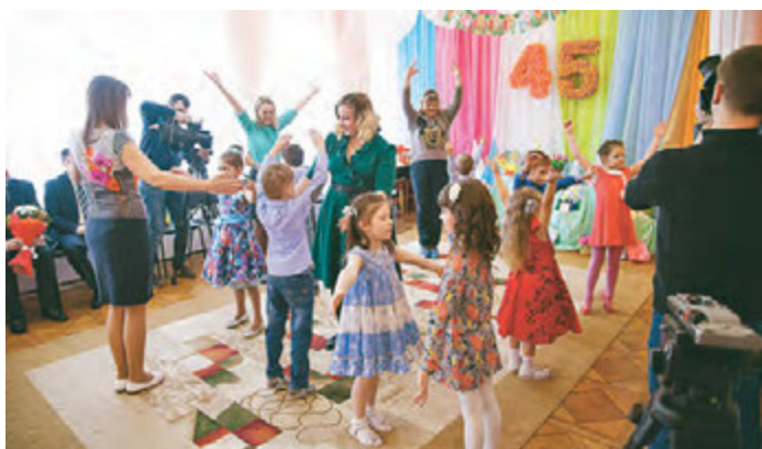
Воспитанники детсада №10 подарили гостям замечательный концерт.

садика, покупал мебель для детских групп. Благодаря заботе комбината у детишек было очень хорошее питание. За 45 лет коллектив детсада согрел теплом своих сердец и подготовил к школе почти три