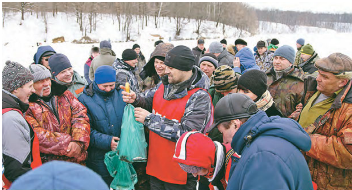
Интересно, чей пакет перевесит?