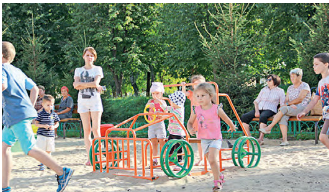
«Милосердие» заботится о самых маленьких железногорцах.