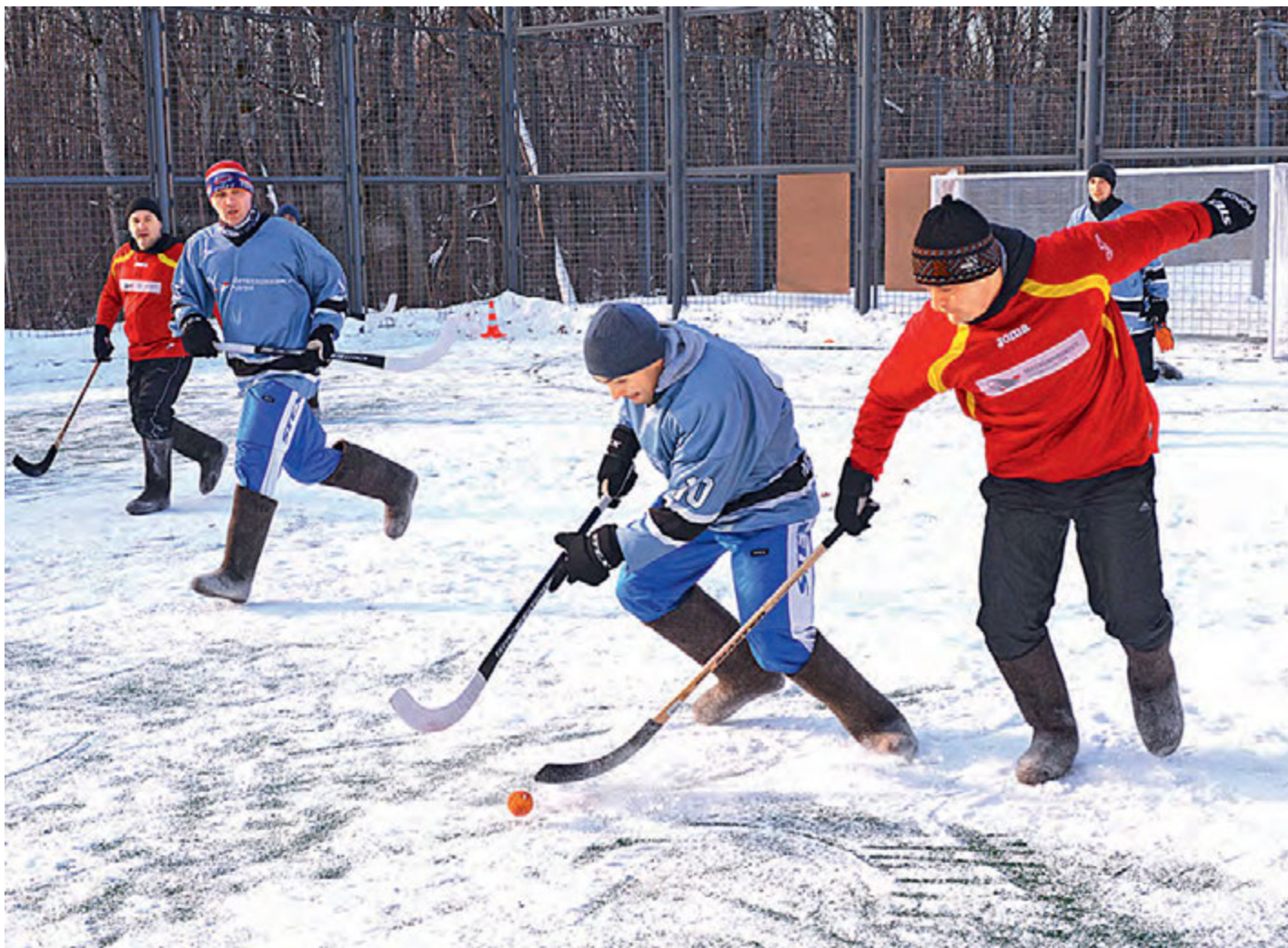
Русский хоккей в валенках: много эмоций, борьбы и азарта!

В четверг в Железногорске стартовала Первая зимняя корпоративная спартакиада компании «Металлоинвест».