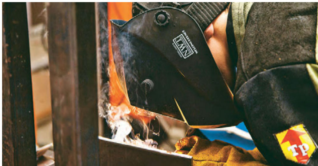
В Железногорске на региональный этап чемпионата приехали участники со всей Курской области.