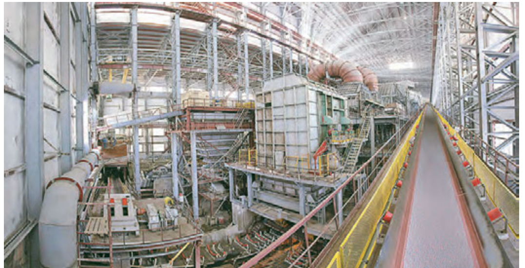
Инженеры Михайловского ГОКа проявили свое мастерство в пуско-наладочных работах на ОМ-3.