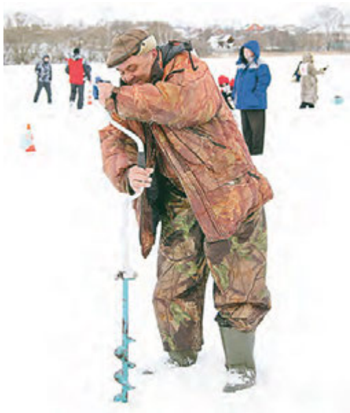
Бурение лунок на скорость.

В минувшие выходные на льду городского водохранилища заядлые рыбаки Михайловского ГОКа выясняли, кто из них самый лучший.