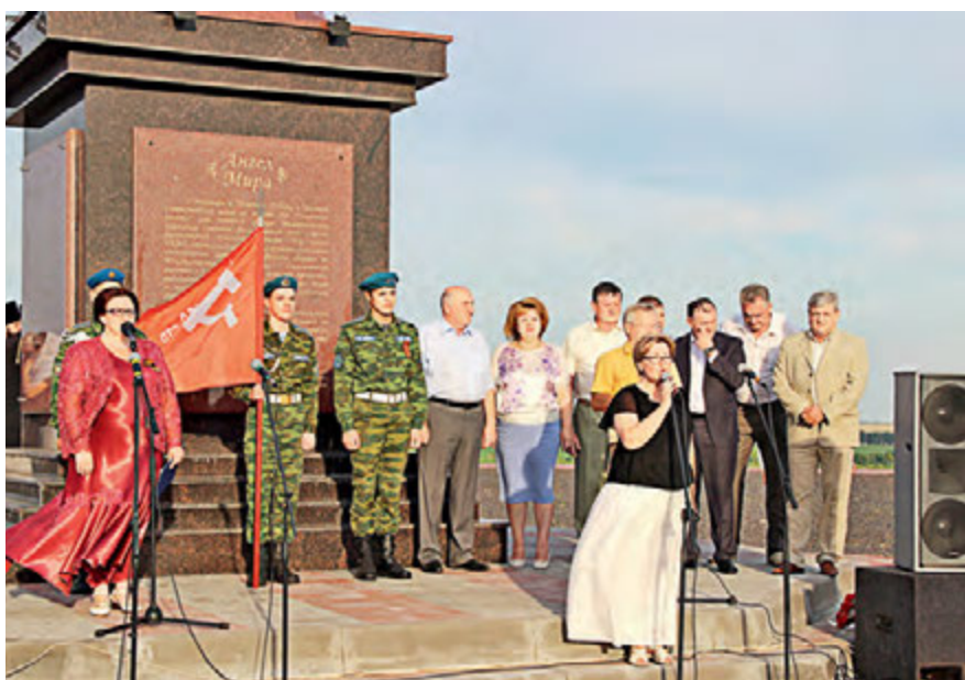
Особое внимание уделяется патриотическому воспитанию молодого поколения.