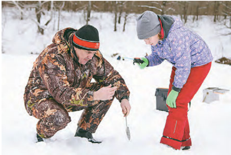
Осторожно: рыбалка вызывает привыкание не только у взрослых, но и у детей.