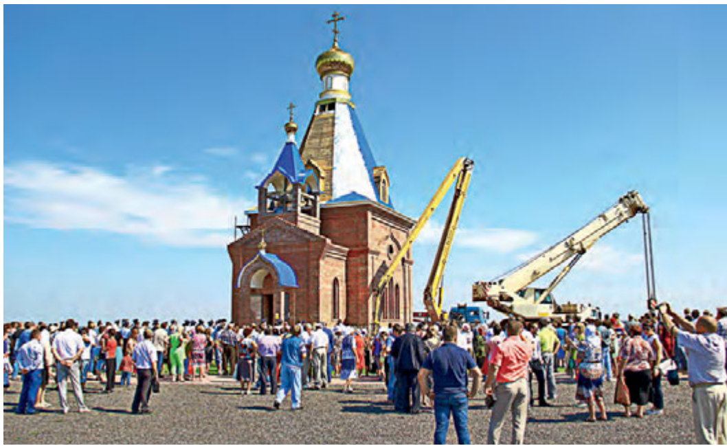
Фонд выделил средства на строительство мемориального комплекса «Ангел Мира».