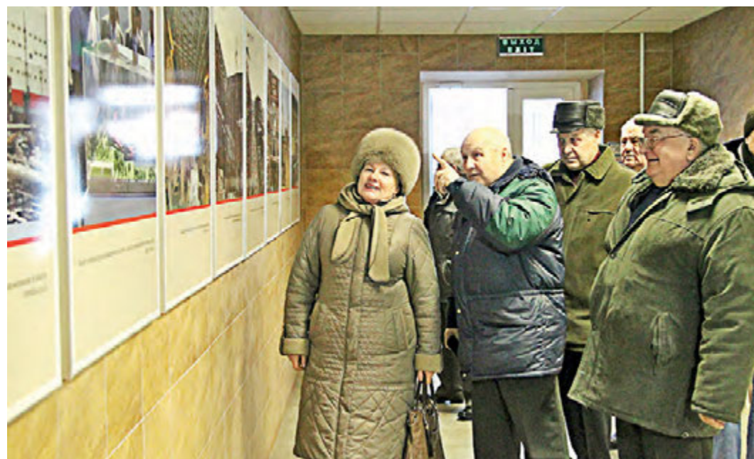
Одним из главных направлений деятельности Фонда является работа с ветеранами МГОКа.

— Содействие в оказании помощи учреждениям здравоохранения, образования, культуры, физической культуры и спорта, детским специализированным учреждениям, домам — интернатам, общественным объединениям и некоммерческим организациям, муниципальным образованиям Железногорского района, а также помощи малообеспеченным семьям; — Содействие в оказании социальной помощи работникам, ветеранам — бывшим работникам Михайловского ГОКа и его дочерних обществ; — Содействие в реализации мероприятий по возрождению и укреплению духовности, патриотизма, культурного наследия, воспитания и образования молодежи; — Содействие в проведение государственных и корпоративных праздников, новогодних утренников, мероприятий по месту жительства с ветеранами, молодежью и детьми. Все вышеперечисленные Программы выполнены в полном объеме, участники Фонда, привлекаемые для их реализации, работали на добровольной основе, руководствуясь принципами гуманизма, милосердия и бескорыстности. Это заместители начальников цехов по общим во-