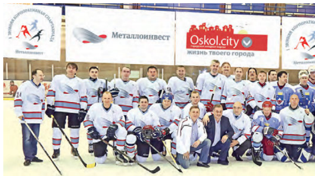
Хоккейная дружина управляющей компании.