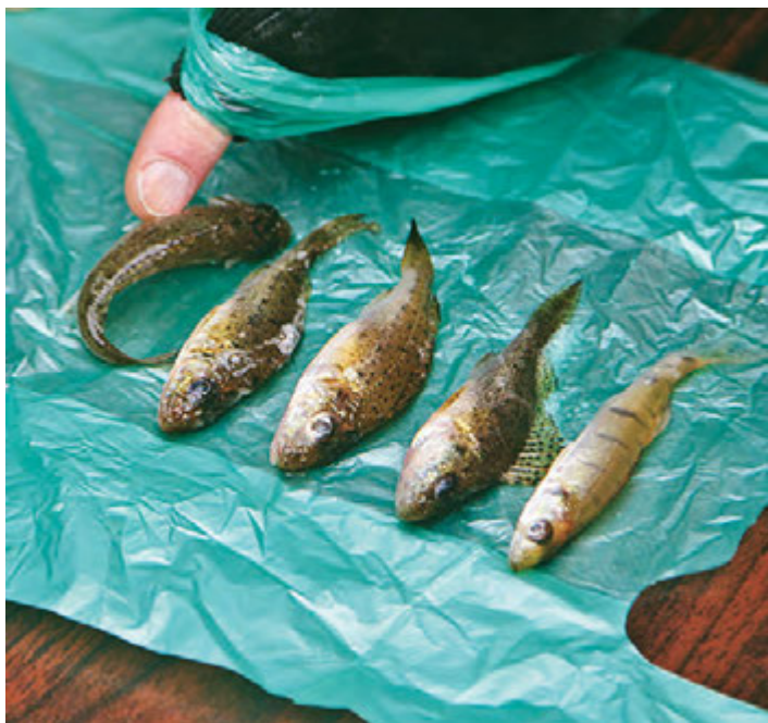
Кто на маленького?