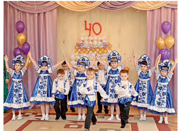
Какой день рождения без веселых танцев?