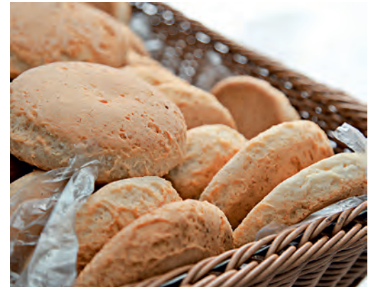
Жаль, что газета не может передать всех ароматов румяной душистой выпечки.