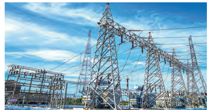
Оскольский комбинат потребляет большое количество энергоресурсов.