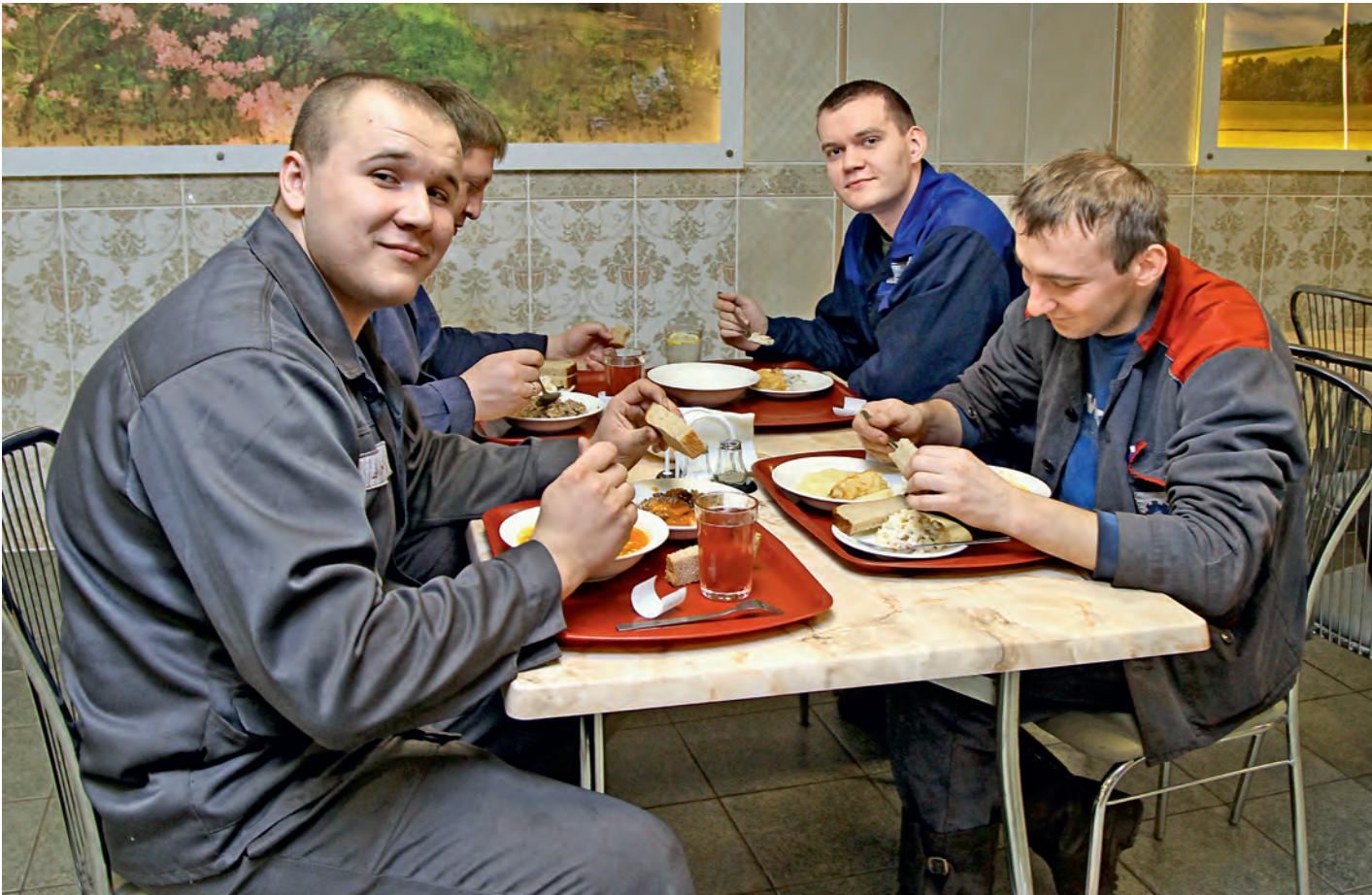
Вкусный, горячий, сытный обед - залог удачного рабочего дня на производстве.

Пирог как произведение искусства – под таким девизом в столовой ОМ-3 ФОКа прошел фестиваль пирогов. При этом повара Цеха питания не забыли про тех, кто держит Великий пост. Для них в ежедневном меню - только постные продукты.