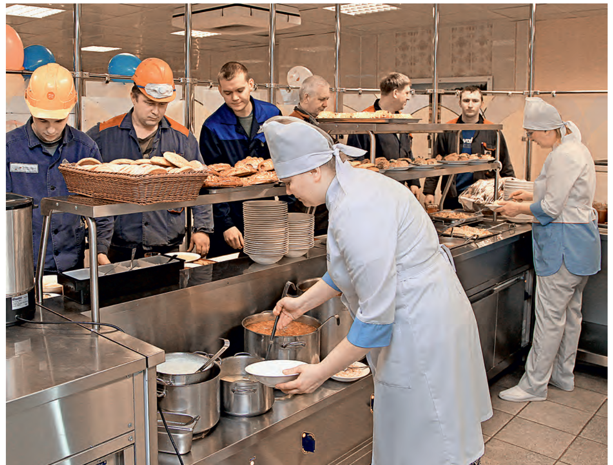
Традиционно ко времени обеда в столовых Михайловского ГОКа выстраивается большая очередь из желающих вкусно поесть.