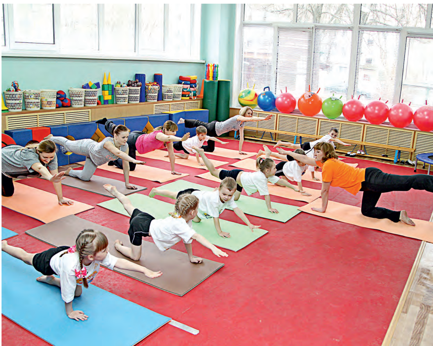
Йогой воспитанники детсада занимаются вместе со своими родителями.

В рамках социальной программы Металлоинвеста «Здоровый ребенок» в детском саду № 18 реализуется интереснейший проект «Росток».