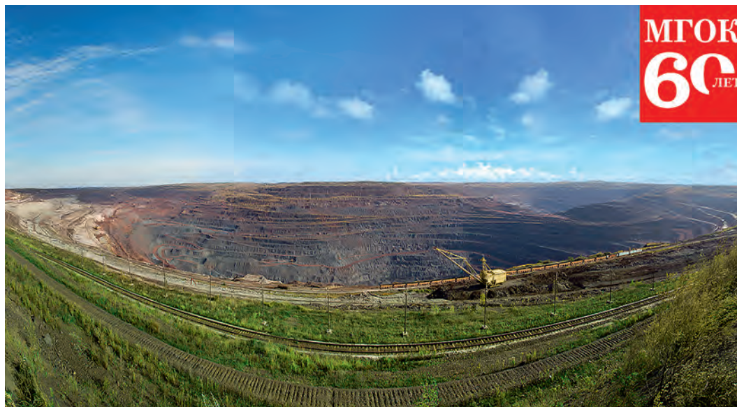
Промышленная разработка месторождения началась в 1957 году.