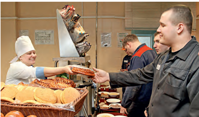
Фраза «разошлись как горячие пирожки» точно про чудесную продукцию, созданную руками повара Цеха питания МГОКа.