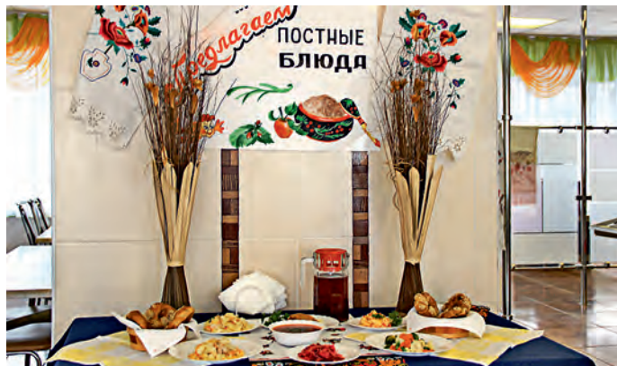
С каждым годом востребованность постных блюд все выше, поэтому повара стараются угодить всем желающим.