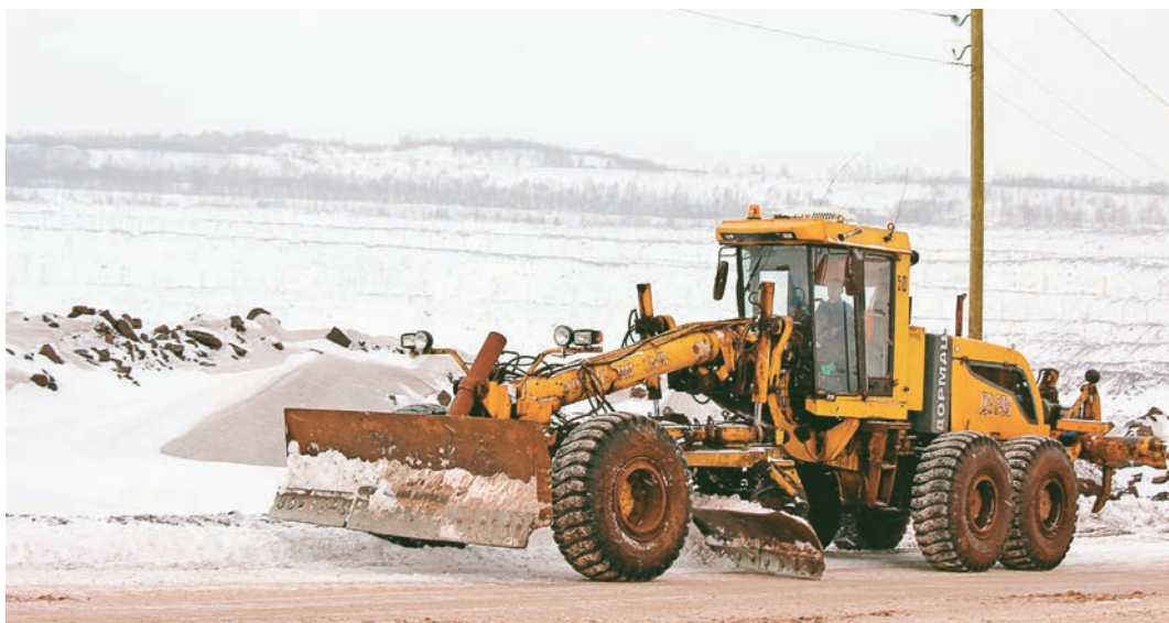
Бульдозер расчищает автодороги