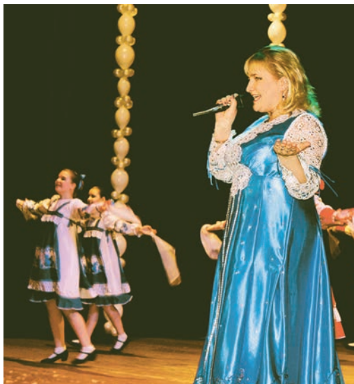
Поздравляли спортсменов лучшие ансамбли ДК