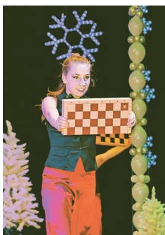
Тематический танец от «Степа»