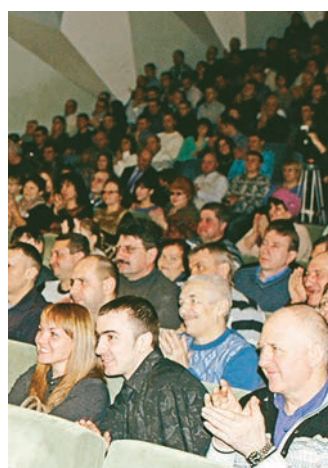
Гости радовались и аплодировали

«Спартакиада – большое дело, которое объединяет коллективы подразделений»