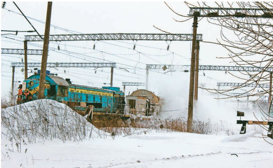
Вентиляторная установка сдувает снежные заносы с железнодорожных линий

В таких погодных условиях дорожный участок рудоуправления сразу же приступает к контролю состояния авто-