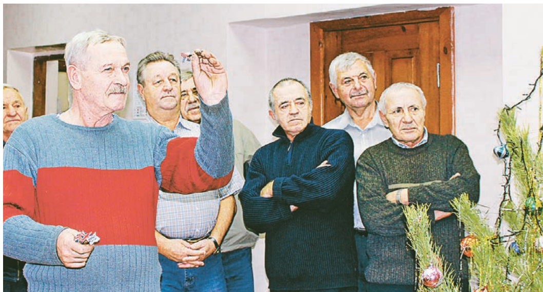
Игра в дартс теперь в турнирном списке спартакиады