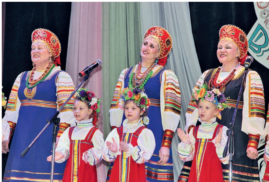
АРТ объединяет более тысячи железнодорожников — от мала до велика.