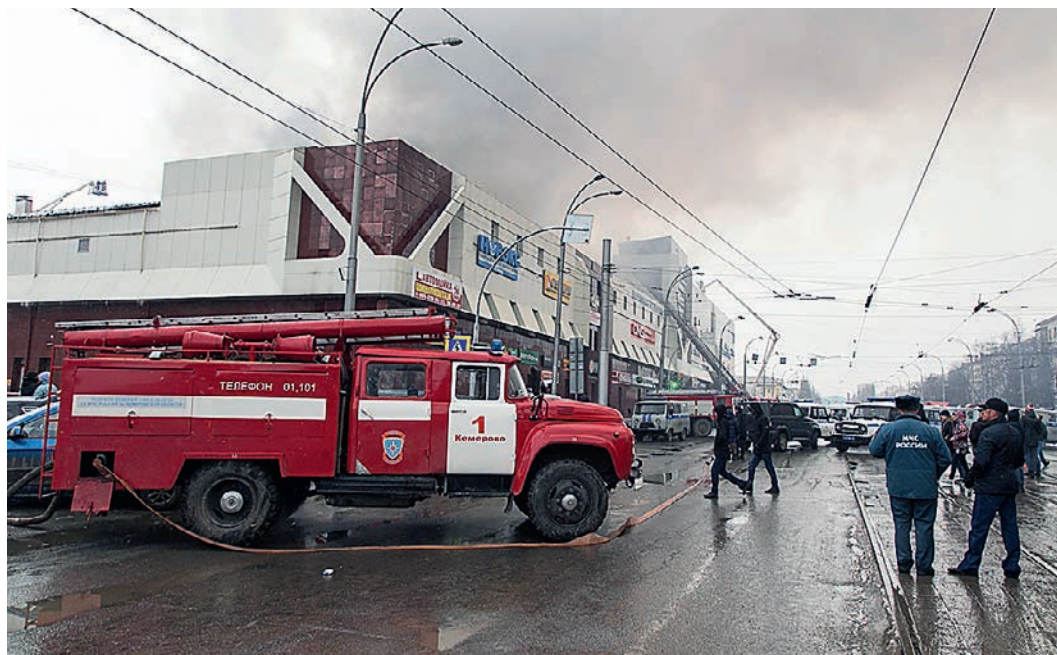
Пожар в «Зимней вишне» в Кемерово начался 25 марта, в воскресенье, когда в залах ТРЦ было очень много народа, в том числе – детей.

При пожаре в торгово-развлекательном центре «Зимняя Вишня» в Кемерово погибло 64 человека. Возможно ли повторение подобной трагедии в Железногорске?