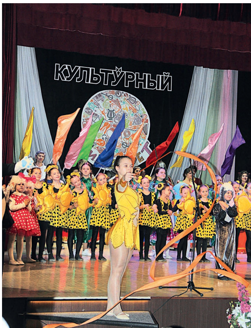
«Культурный винегрет» всем зрителям пришёлся по вкусу.