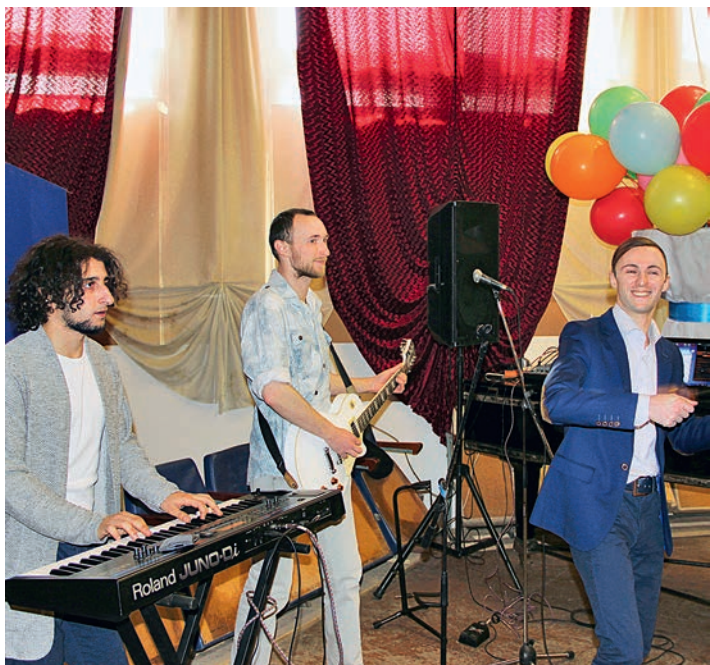
Ребята из группы «Экспресс» дарили гостям позитивное настроение.