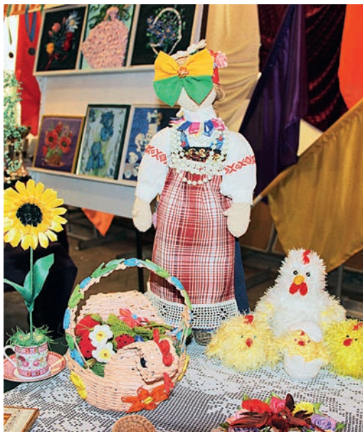
Ни дня без творчества.

Филиал культурного центра «Русь» — «АРТ» отметил своё 40-летие. Торжественное мероприятие, посвящённое юбилею, прошло накануне Дня работника культуры.