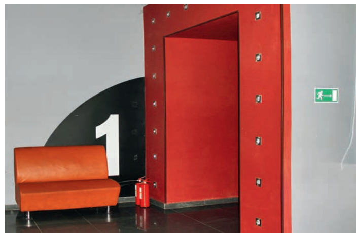
Кинотеатр «Русь» оснащён средствами пожаротушения.