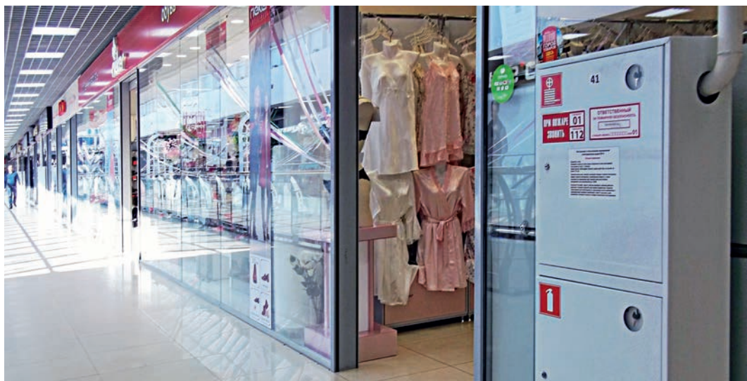
В ТЦ «Европа» установлены пожарные гидранты.