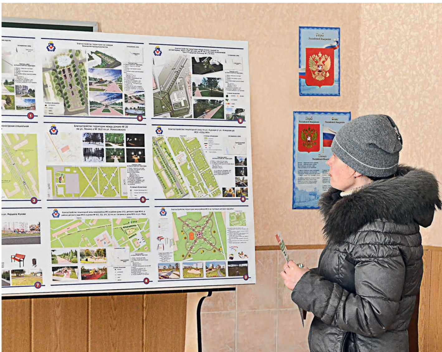
На рейтинговое голосование было вынесено девять городских территорий для благоустройства.

Подведены итоги рейтингового голосования за общественные территории, подлежащие благоустройству в рамках программы формирования комфортной городской среды.