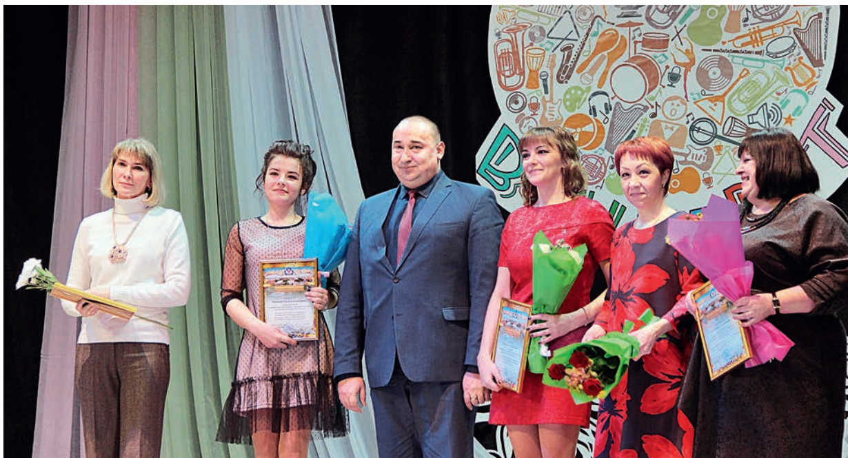
В честь праздника работники культуры получили цветы и заслуженные награды.