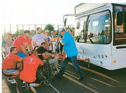
Спорт объединяет всех