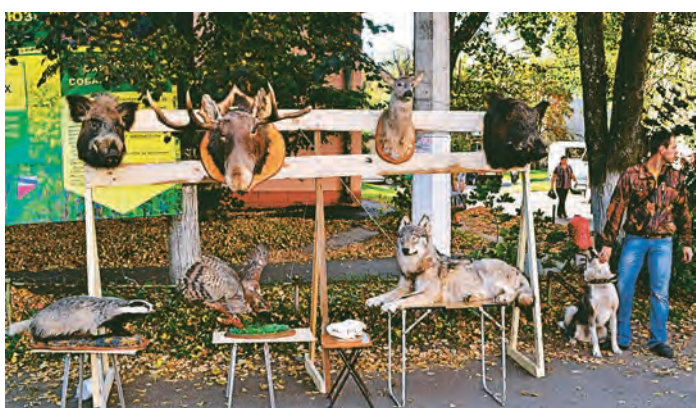
Железнодорожские охотники традиционно устроили на ярмарке выставку своих трофеев