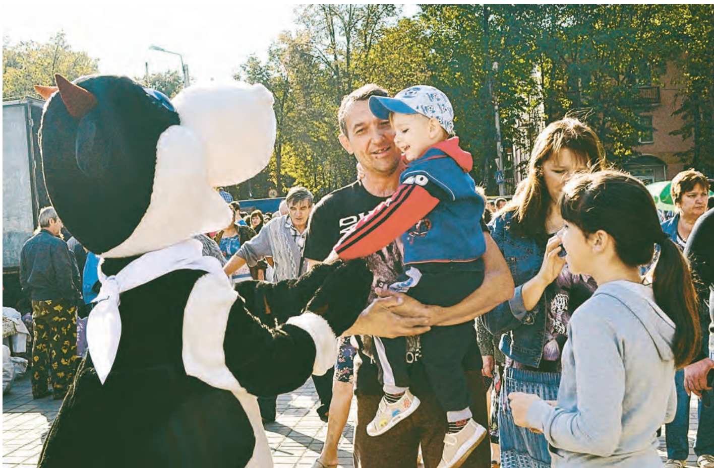
Забавные «коровы» радовали на ярмарке и детей, и взрослых