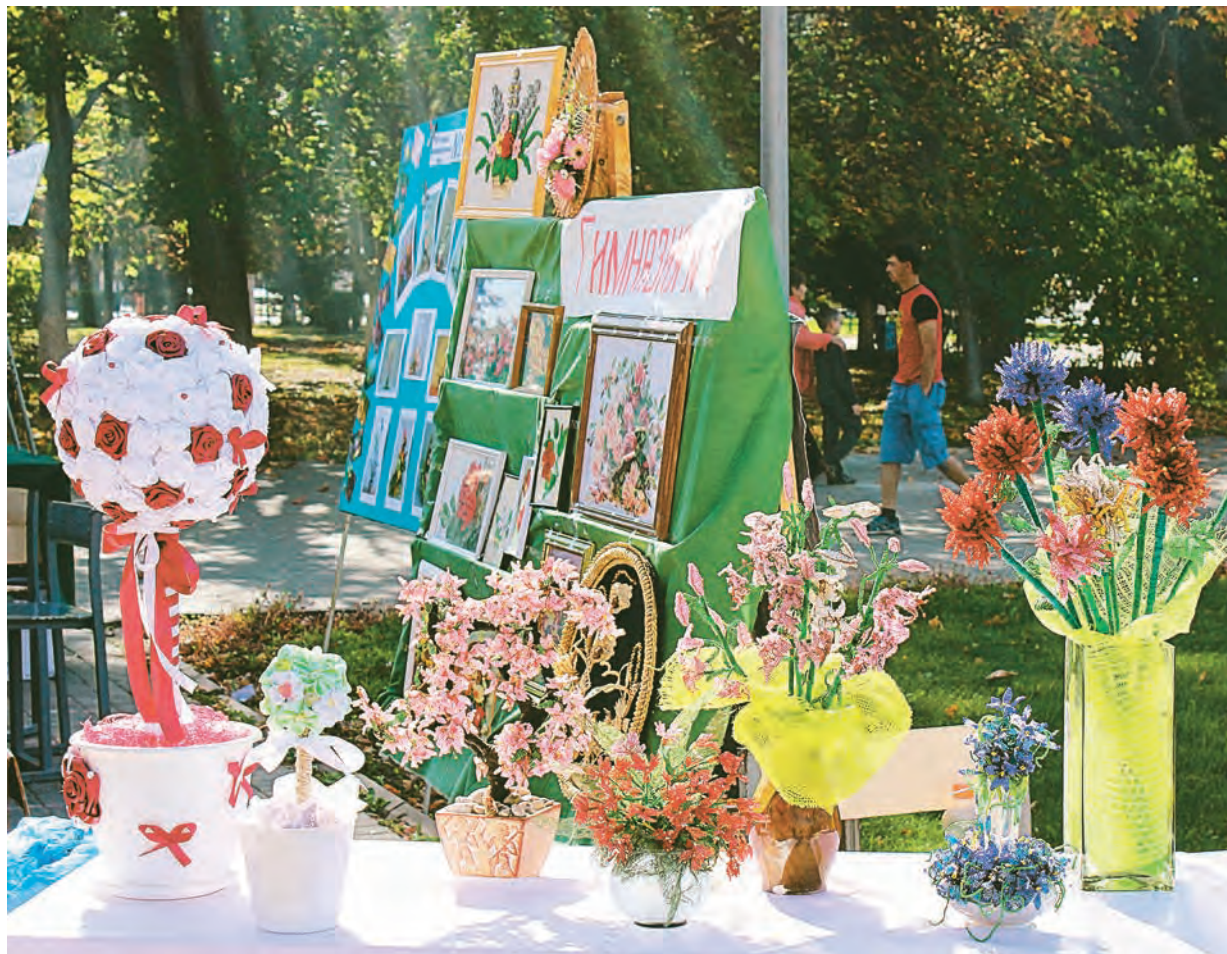
На выставке «Цветочная феерия» были не только живые букеты, но и искусственные – настоящие шедевры железнорожских мастеров и мастериц