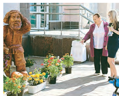
Самые яркие и разнообразные цветы на радость жителям города