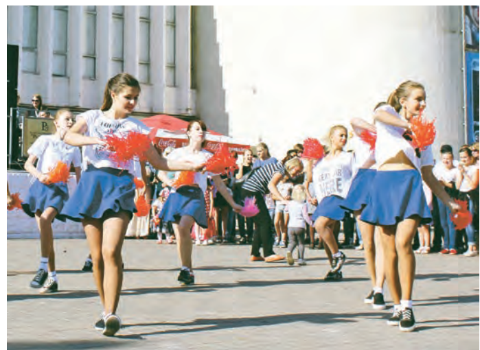
Танцы - это здорово и здорово!