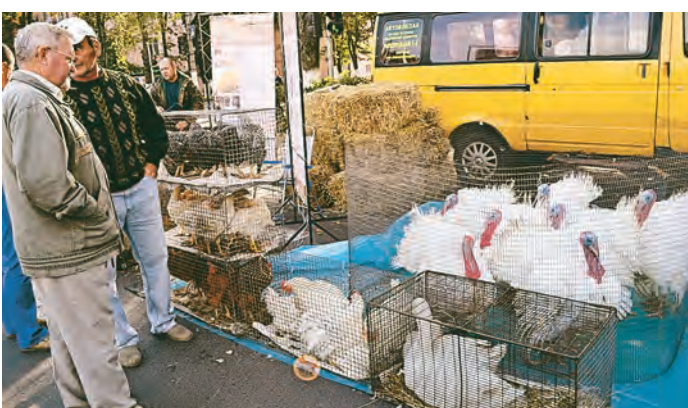
Возле клеток с живым товаром – курочками, индюками, кроликами, нутриями всегда были покупатели