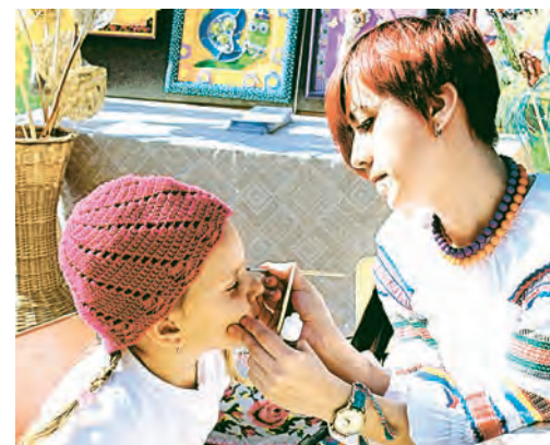
Умелые художники украшали лица всех желающих замысловатыми узорами