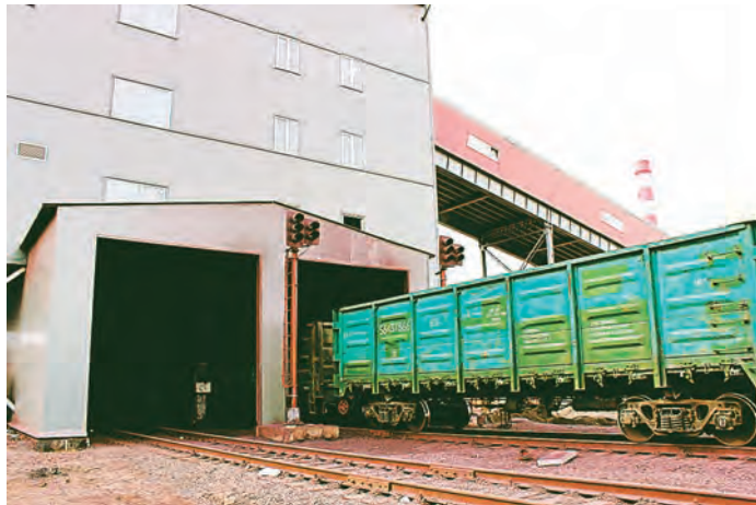
Идет погрузка очередной партии окатышей, выпущенной новой обжиговой машиной №3

не на полную мощность, - сказала Марина Аракелян, приемосдатчик операторской на погрузке готовой продукции. Участок погрузки, как практически все новое производство, сегодня находится на стадии опытно-промышленной эксплуатации.